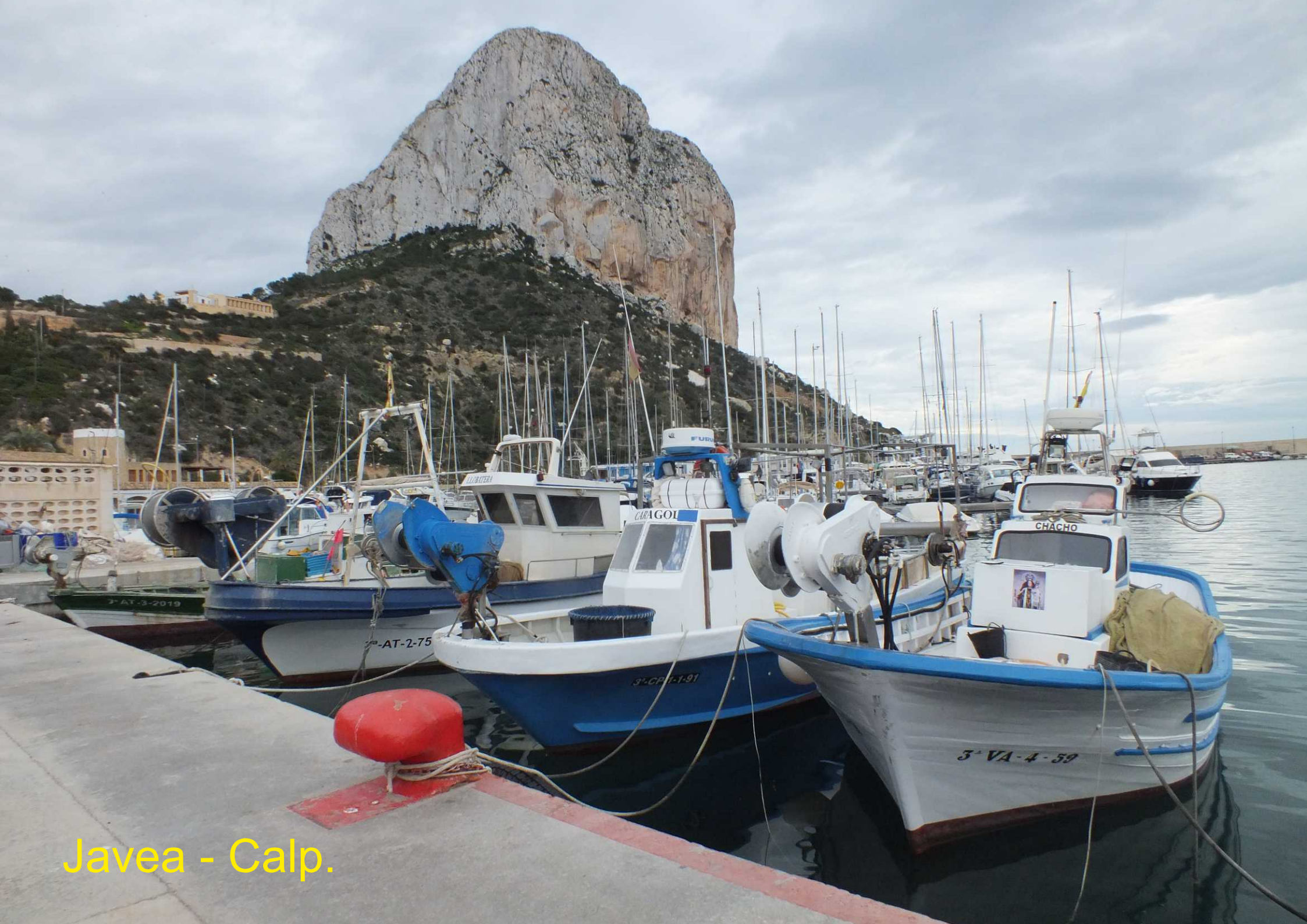
Javea - Calp.