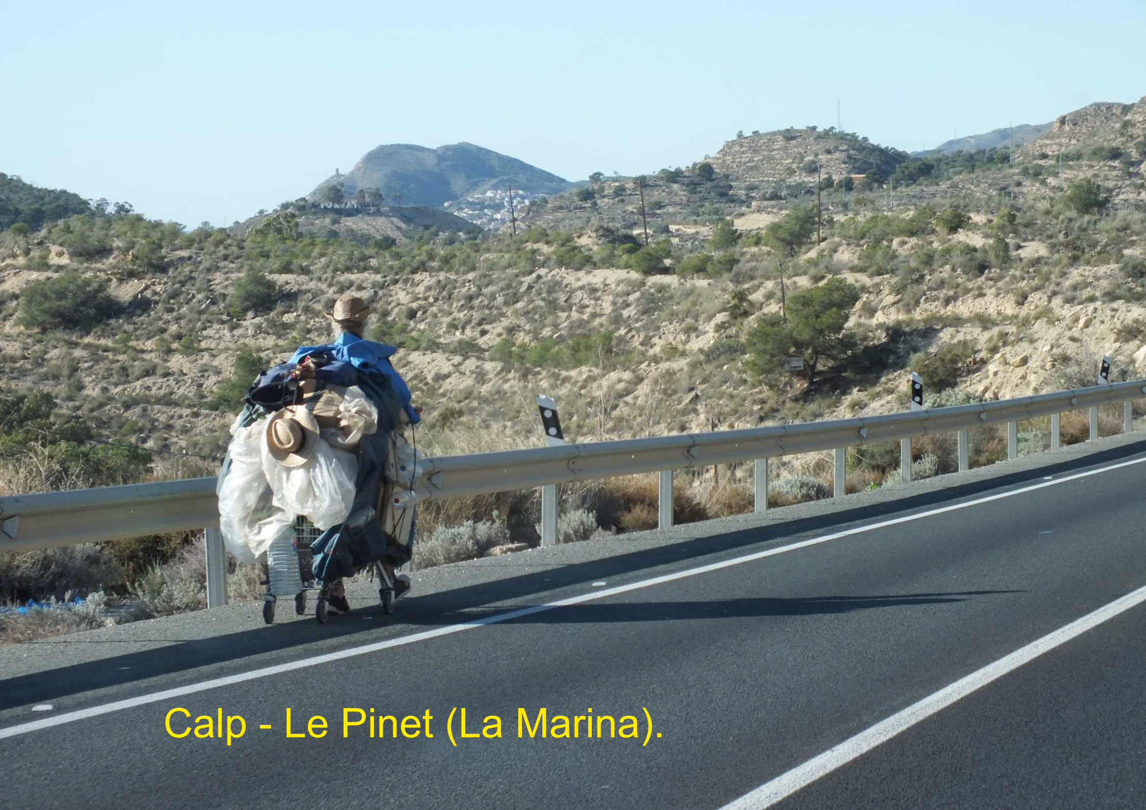
Calp - Le Pinet (La Marina).