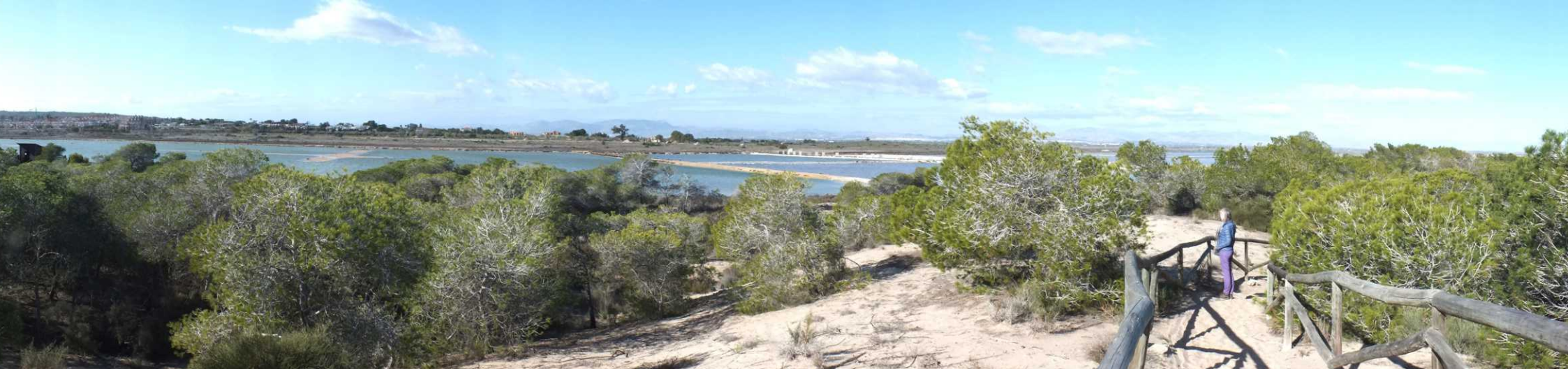
Deze pagina: Parque Salinas de Santa Pola.