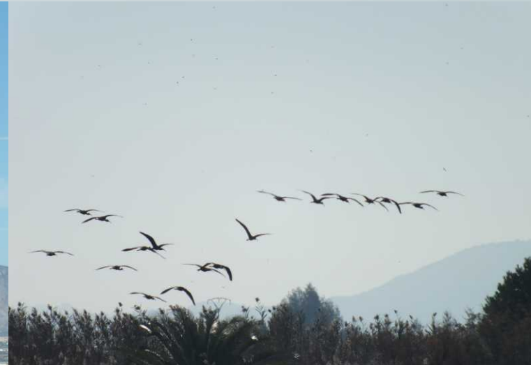
Bij een uitkijktorentje op het verst gelegen punt, zien we een vlucht ibussen.

Bo, RM: Zwarte ibis, Plegadis falcinellus . LBe: Zicht vanaf het torentje.