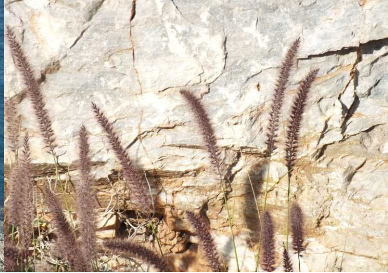
Links naast de weg staan mooi bloeiend gras, rechts zijn kleine baaitjes onder aan verschrikkelijk steile hellingen.