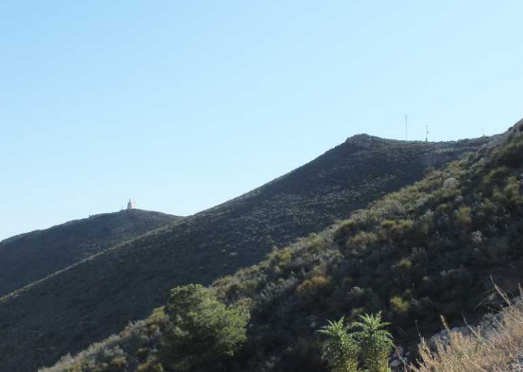
Vorige pagina: Zicht op Castell de Ferro.

Links op de berg zien we de vuurtoren. Op het hoogste punt aangekomen blijkt er weliswaar een weggetje naar de vuurtoren te lopen, maar dat dat samen met een wateropvangbekken achter een hoog hek is opgeborgen. We lopen om dat waterbekken heen (15:30) en dalen dan af naar de weg langs zee af.