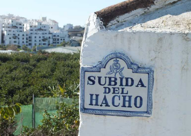
Als een spaghettisliert kronkelt dit pad tussen de kwekerijen door.