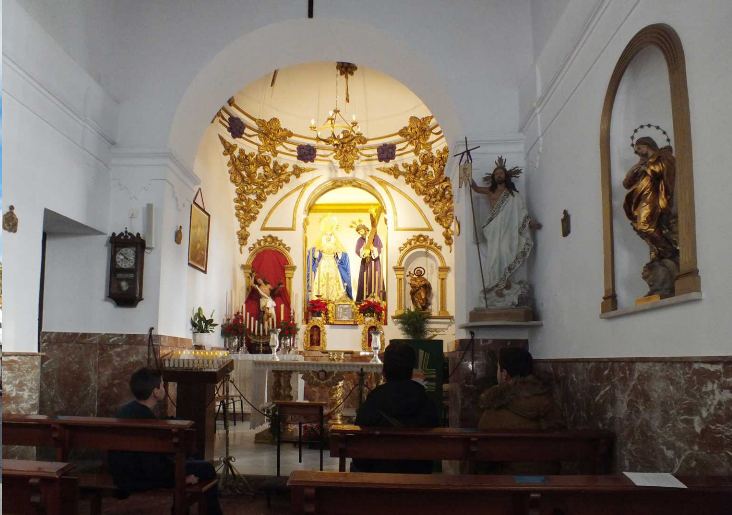
We kijken even in het kerkje San Sebastián. Opmerkelijk vinden we de huiskamerklok links.