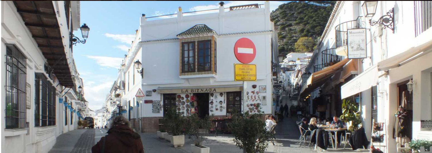
Bo: San Sebastián. RBe: Calle San Sebastián.