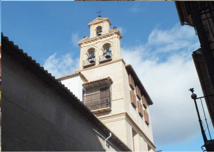
MBo: Cuesa de la Paz RBo: San Sebastián. MBe: Plaza de San Sebastián. RBe: Convento de la Encarnación.