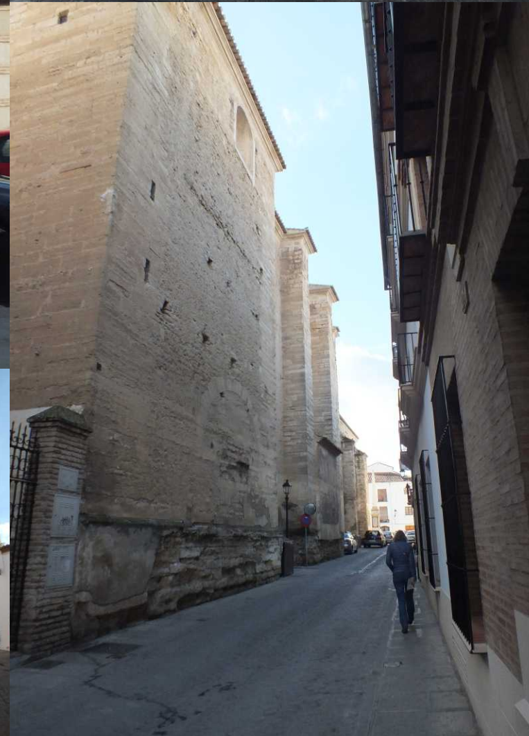
Over het Plaza de San Francisco gaat het naar de Convento de San Zoilo en om de San Pedro heen. Opnieuw een heel massieve hoge kerk.