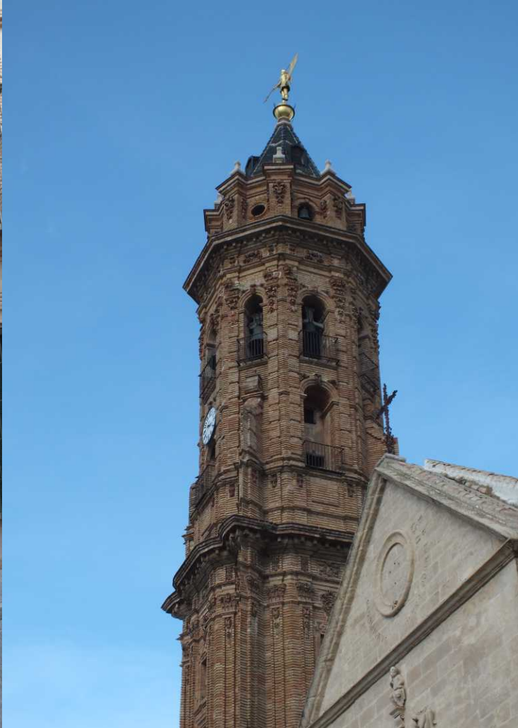
Cuesa de la Paz voert naar de Plaza San Sebastián met natuurlijk de kerk van die naam.