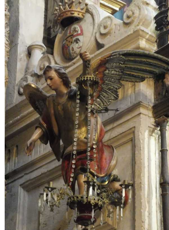
LBo: Een van 19 schepen. LBe: Retablo de San Nicolás de Bari. MBe: Capilla de San Antonio de Padua.

Ook de oostelijke muur herbergt weer de nodige kapellen. Langzaam begint je bevattingsvermogen op een eind te raken. Nu komen we ook op het meer centrale deel van de Mezquita, waar onder andere een geschrift van een Spaanse ontdekkingsreiziger wordt tentoongesteld.