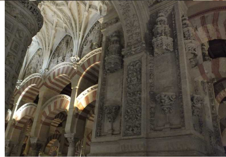
MBo: San Cristóbal.

Op een hoge tussenmuur is een enorme San Cristóbal. We kijken nu ook eens meer naar boven en zien in het centrale deel schitterend bewerkte plafonds en gebeeldhouwde kapitels.