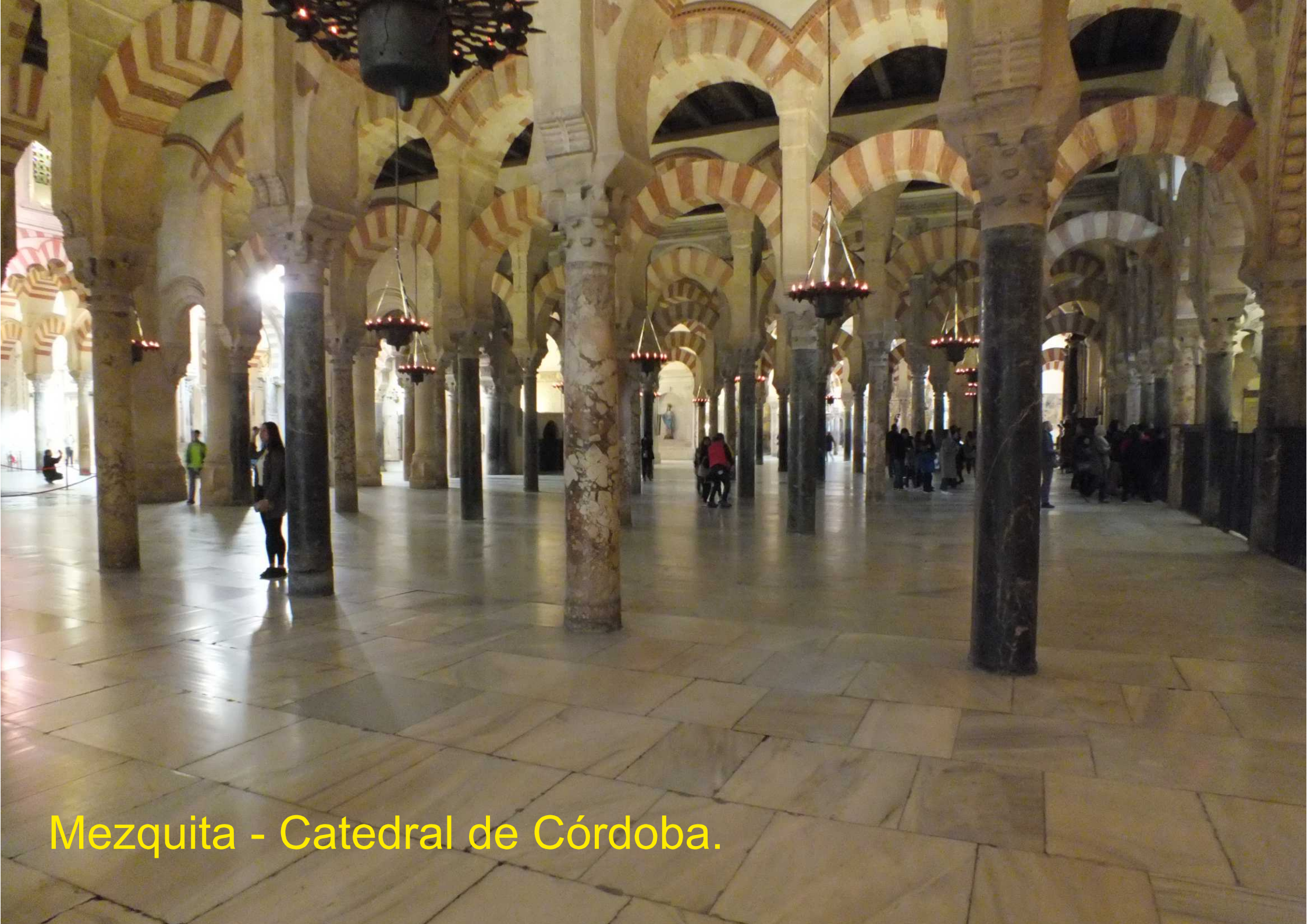
Mezquita - Catedral de Córdoba.