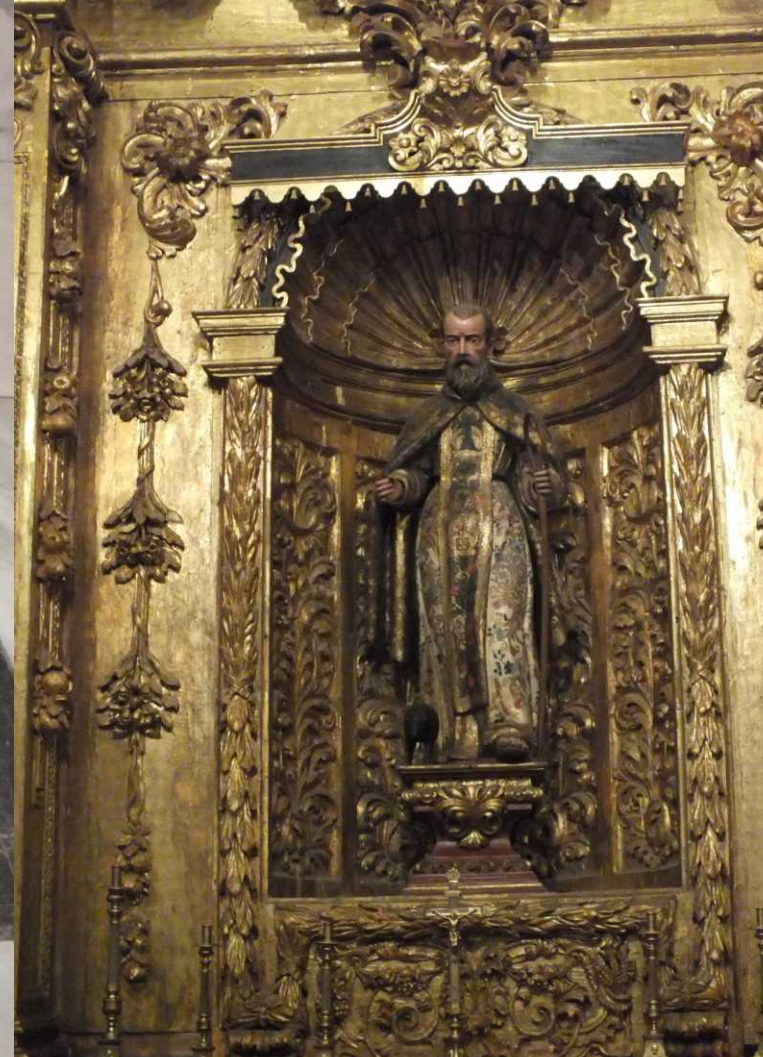
LBo: Grafsteden. RBo: Capilla de San Antonio Abad. MBe: Capilla de San Felipe y Santiago. RBe: Museo Visigodo de San Vicente.