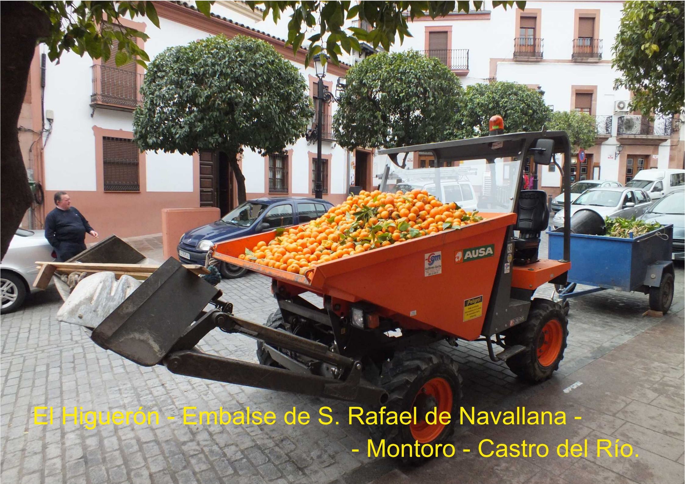
El Higuerón - Embalse de S. Rafael de Navallana - - Montoro - Castro del Río.