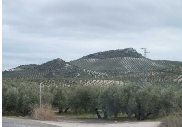
Deze pagina: Een woestijn met olijfbomen.