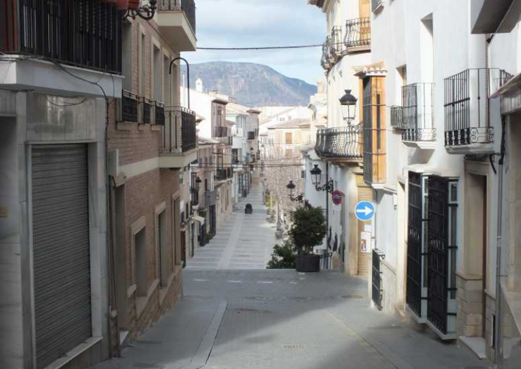
Via de omweg Calle Carril, Calle Moral en de Calle Campanario komen we bij de Convento de Inmaculada.