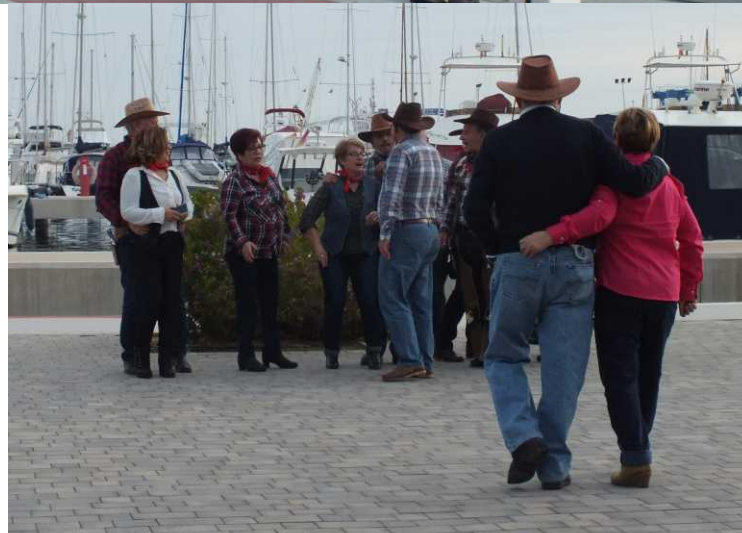
LBo: Strand Santa Pola. RBo: Avenida de Granada. LM: Puerto Deportivo. RBe: Tineke aan de sangria. MBe: In-line dansers nababbelend.

We lopen naar de jachthaven links en nemen daar op een terras wat te drinken: sangria en rode wijn. We kunnen lekker buiten zitten, want in de loop van de dag is het weer steeds beter en warmer geworden. Binnen in de zaak is er spektakel: Een groep in-line dansers in cowboykleding zijn daar bezig.