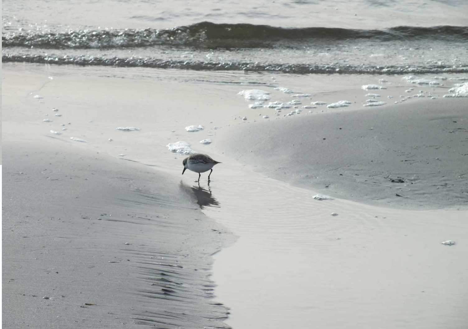
Deze pagina: Drieteenstrandloper, Calidris alba .