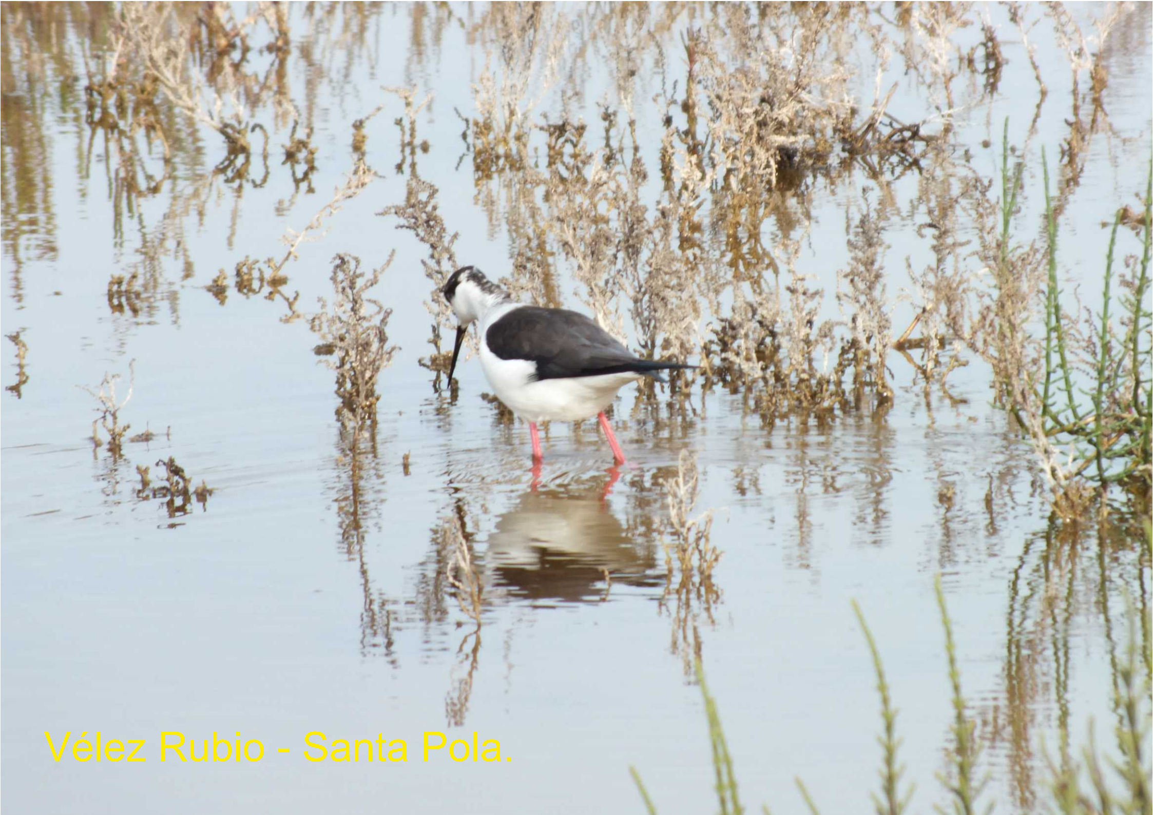
Vélez Rubio - Santa Pola.