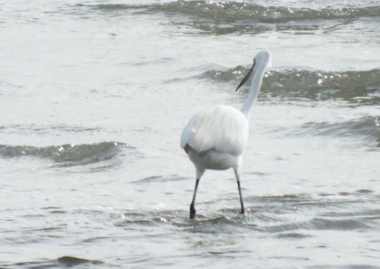
Aan het strand komen daar een Kleine zilverreiger, Steenlopers en Drieteenstrandlopers bij (16:32).