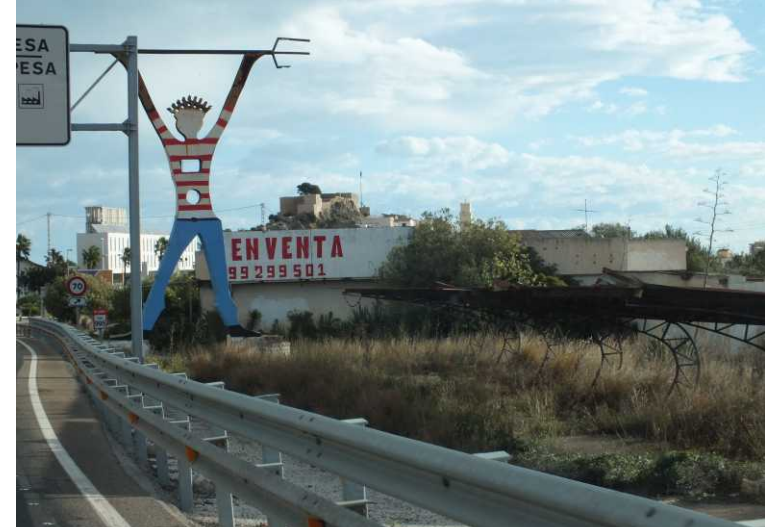
LBo, RBo: Oropesa. LBe: Regenboog met een vrij sterje secundaire boog. RM: Alcalà de Xivert.

In Oropesa zitten we op de scheidingslijn van regen en zon en zien we links een heel fel gekleurde dubbele regenboog. De windvlagen laten de camper stevig schudden, waardoor we even zelfs aan de kant van de weg gaan staan. Dan toch maar weer door. In Torreblanca is het weer even droog (9:53). Even is het donkergrijze wolkendek versierd met een zwart gekantkloste bobbelrand. 10:00 passeren we Alcalà de Xivert.