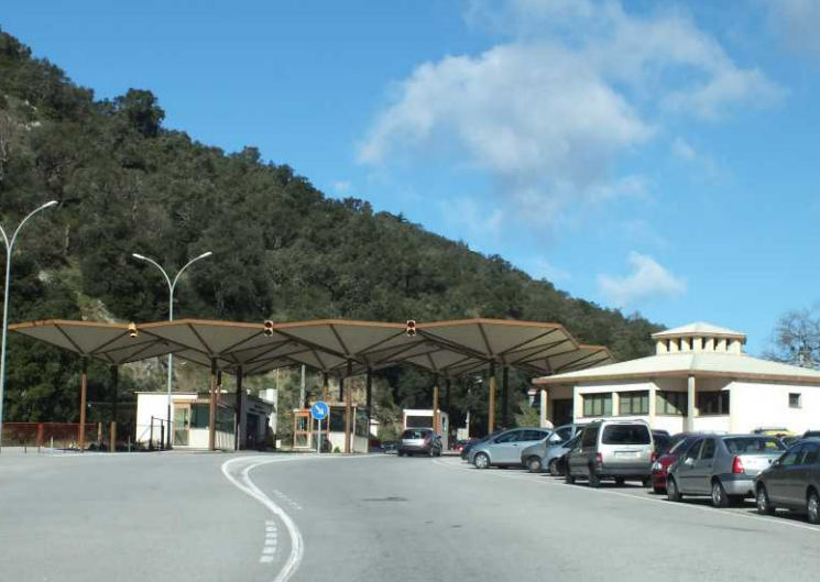
LBo: Grensovergang, Le Perthus. RBo: Le Perthus. LBe: De Pyreneeën. RBe: Perpignan.

Na 4463 km gaan we bij Le Perthus Frankrijk binnen, steken Le Tech over en rijden vervolgens de D900 op. Daar is heerlijk zicht op besneeuwde bergen. Ook aan de Franse kant van de grens is er veel zon en veel wind. Mannen zijn bezig electriciteitsdraden te repareren, de radio heeft het steeds weer over de "mistral" en steke windstoten. 12:31 Perpignan. We vangen zo veel wind dat we zwabberend de weg over gaan.