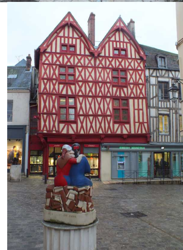
LBo, LBe: Rue de l'Horloge. MBo: Marie Noël. RBo: Astronomisch uurwerk. RBe: PPlace Charles Lepere.

We lopen het straatje in naar de Tour de l'Horloge. Een prachtig astronomisch uurwerk versiert het poortgebouw. Een beeld dat in deze straat staat betitelt ik spontaan als tante marie en zie dan dat de persoon, die ze verbeelt Marie Noël heette, een dichtster en schrijfster uit Auxerre! Een vergelijkbaar beeldje zien we verderop in de vorm van een lezend stelletje op een stapel boeken, hij is Nicolas-Edme Rétif de la Bretonne.