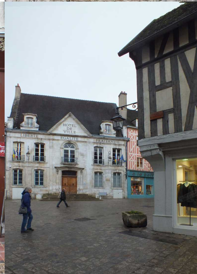
LBo, RBo: Cathédrale Saint-Étienne d'Auxerre. MM: Rue Fourier. RBe: Stadhuis, Place de Hôtel de Ville.