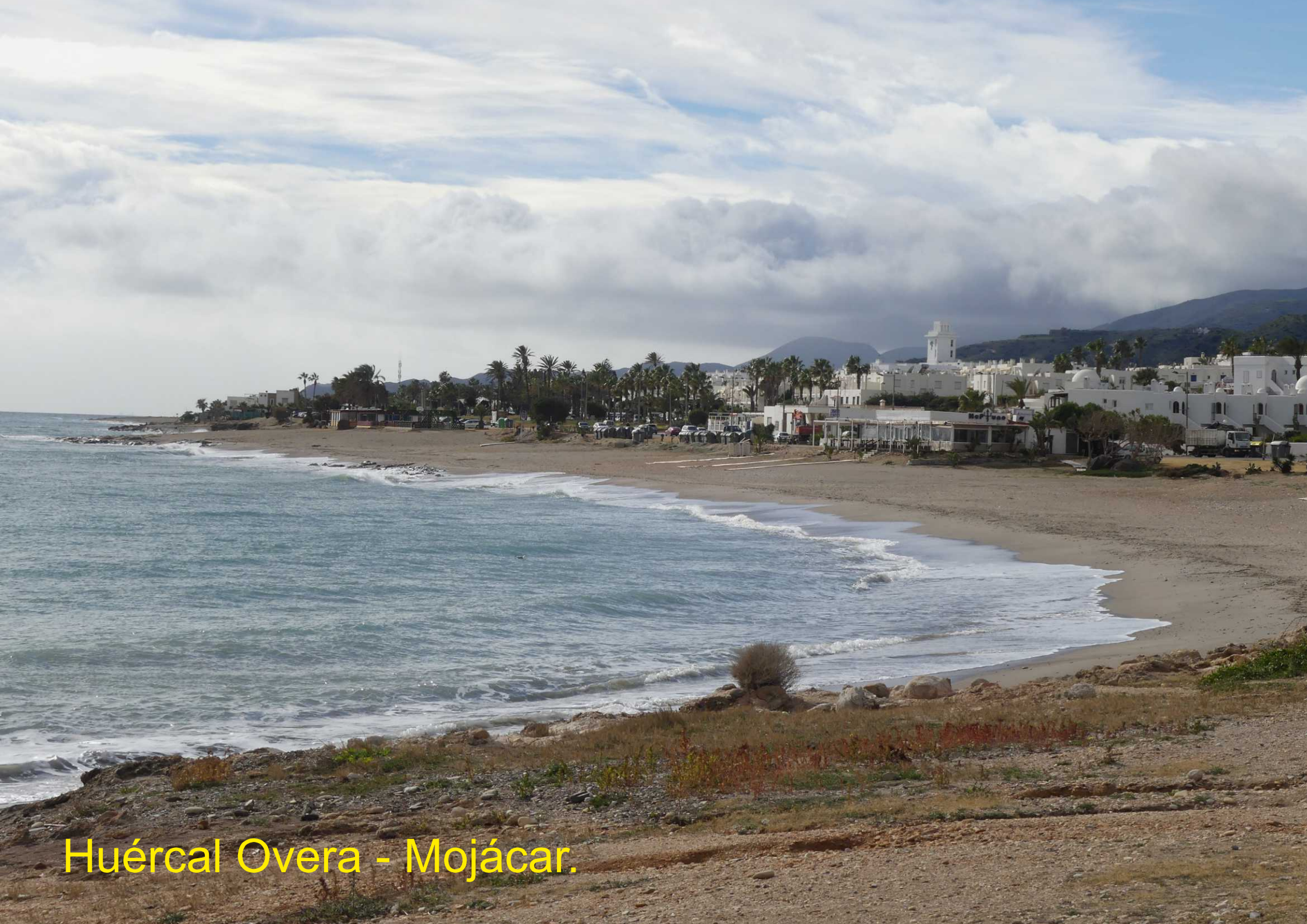
Huércal Overa - Mojácar.