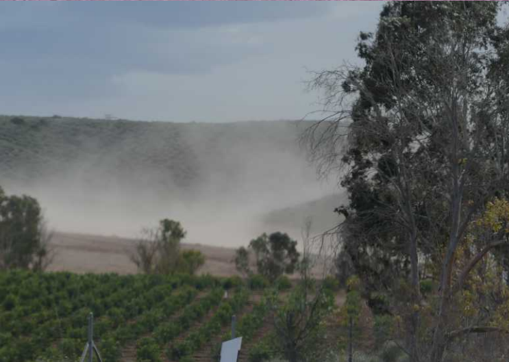
MO: Zicht op Turre vanaf de A370.

Opmerkelijk zijn de fel roze velden in de buurt van Antas. Maar ook de nevel van zand die door de felle wind opgewaaid wordt op de braak liggende percelen. Bij Los Gallardos verlaten we de A7 voor de A370 naar Garrucha.