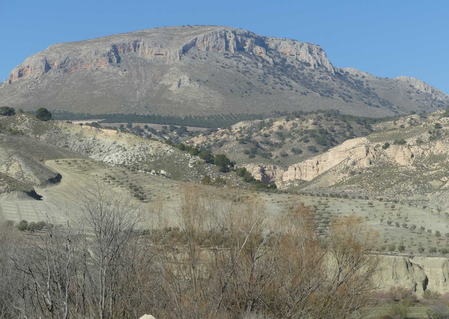
Deze pagina: Langs de weg naar Alicún de las Torres.