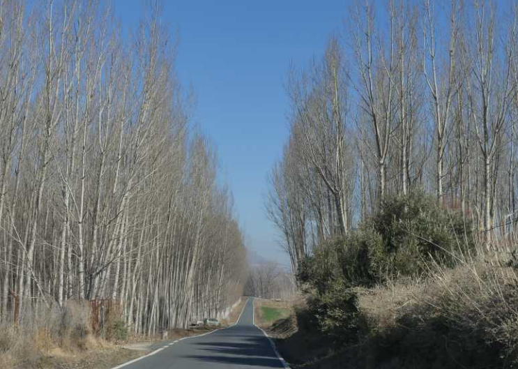
Massa's populieren staan er langs de weg naar Fonelas.