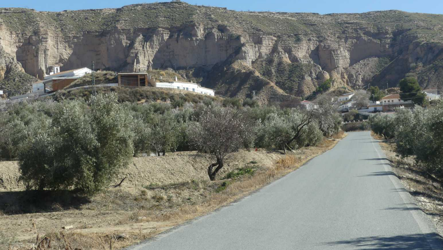
Deze pagina: Gorafe.

13:00: In Gorafe lopen we een rondje door het dorp naar het Centro de Interpretación del Megalitismo. Die is echter alleen om 12 en 17 uur open! Alleen excursies met gidsen? Na de lunch in Gorafe stappen we om 14:03 weer op.