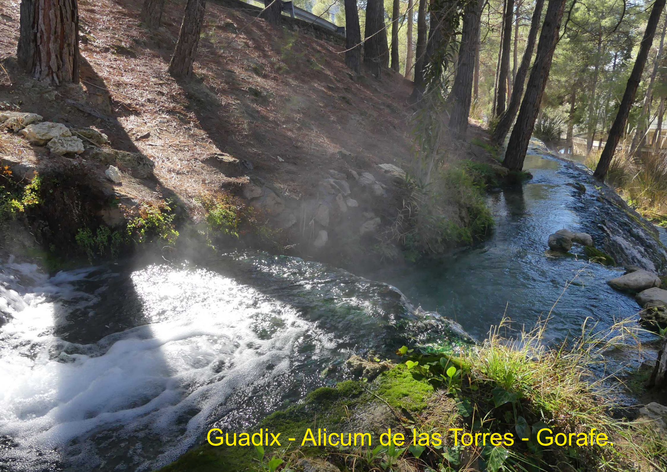
Guadix - Alicum de las Torres - Gorafe.