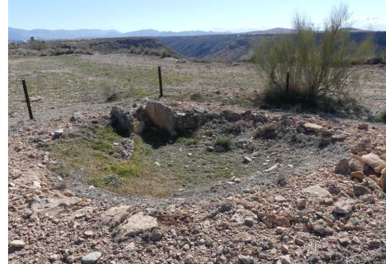
Deze pagina: Dolmens aan de Ruta de Llano de Olivares.

Die parking ligt aan de rand van de Cortijo Olivares, een hoogvlakte hoog boven de brede kloof. Binnen in die kloof is een kleinere kloof met de Río Gor. We wandelen een eind in de richting van Gorafe langs een aantal kleine dolmen, die aan de rand van de kloof op de hoogvlakte liggen. Ze bestaan uit cirkelvormige muren met aan één kant een opening met twee rechte muurtje. Die opening liggen steeds ruwweg op het ZO-en (tussen de 135 en 185°).