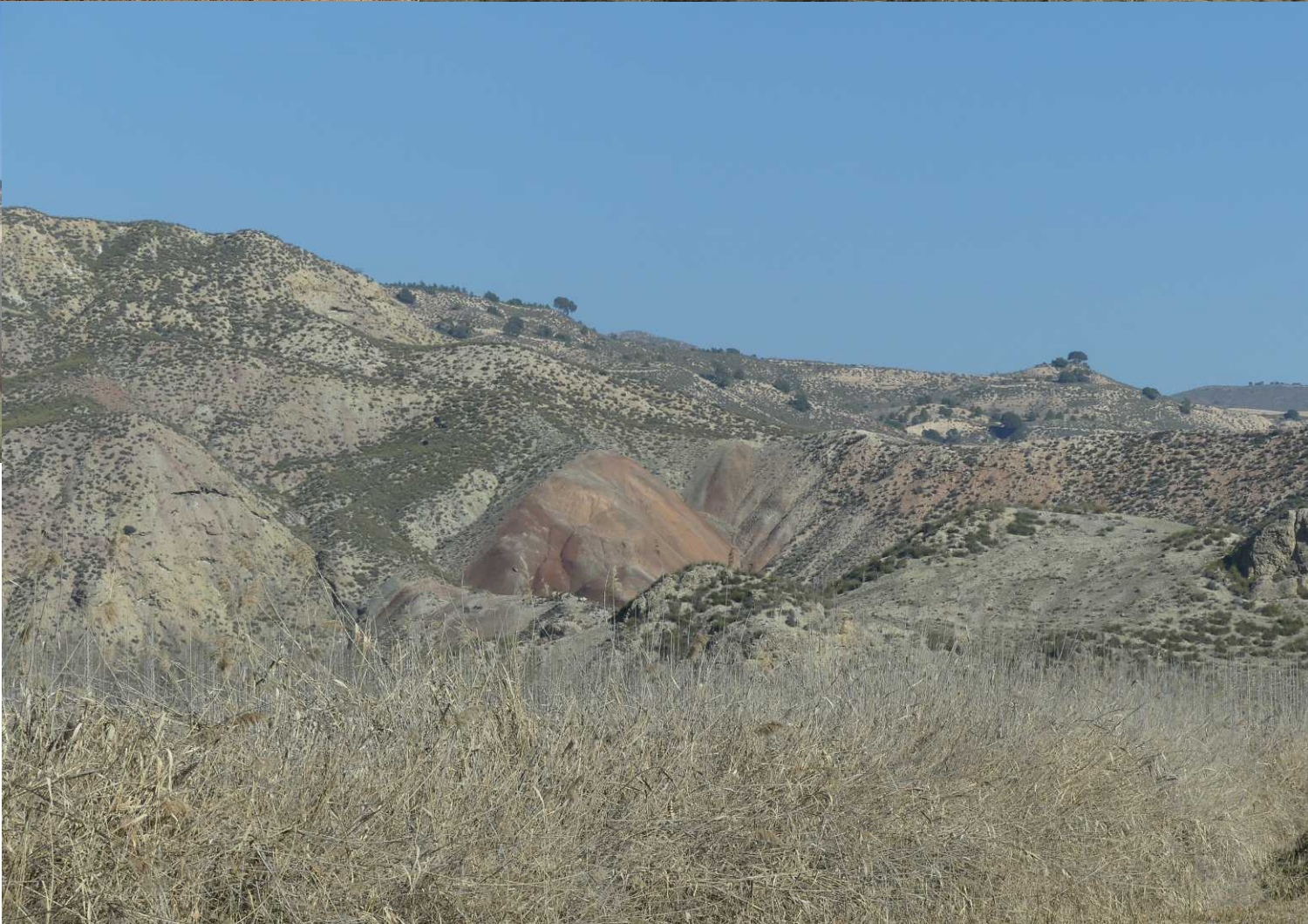
Deze pagina: Langs de weg naar Alicún de las Torres.