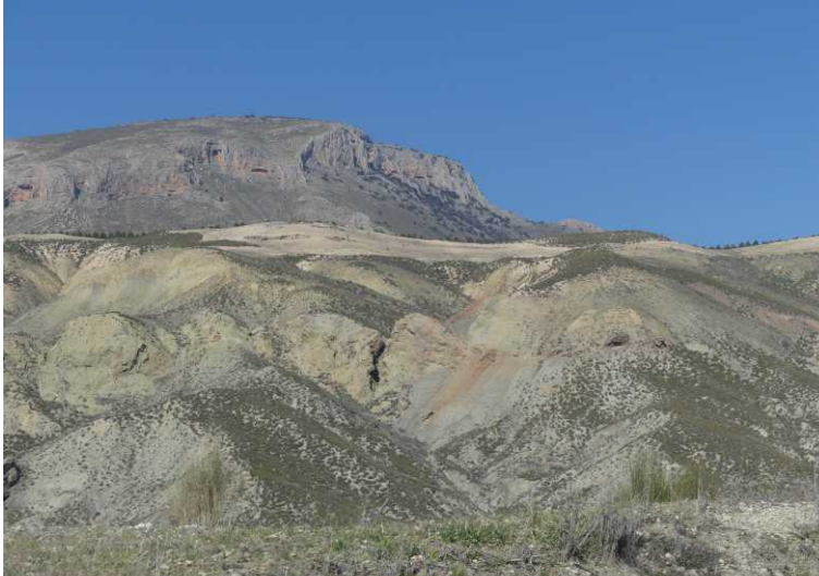
Deze pagina: Langs de weg naar Alicún de las Torres.