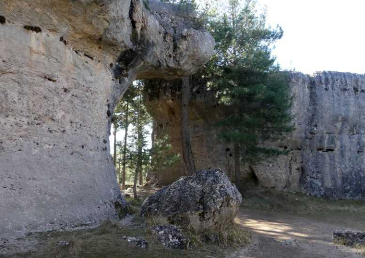
RB: El Perro (de hond).

Nu is het vergelijken van foto's met die rotsen wel lastig. namen zijn niet altijd evident, net zoiets als bij wolken kijken. Iedereen ziet toch iets anders in dezelfde wolken. Als bij een inktvlekkentest?