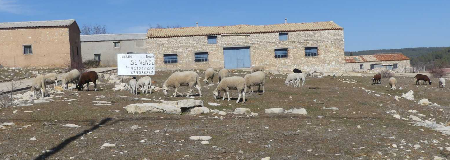
Deze pagina: Las Majades.