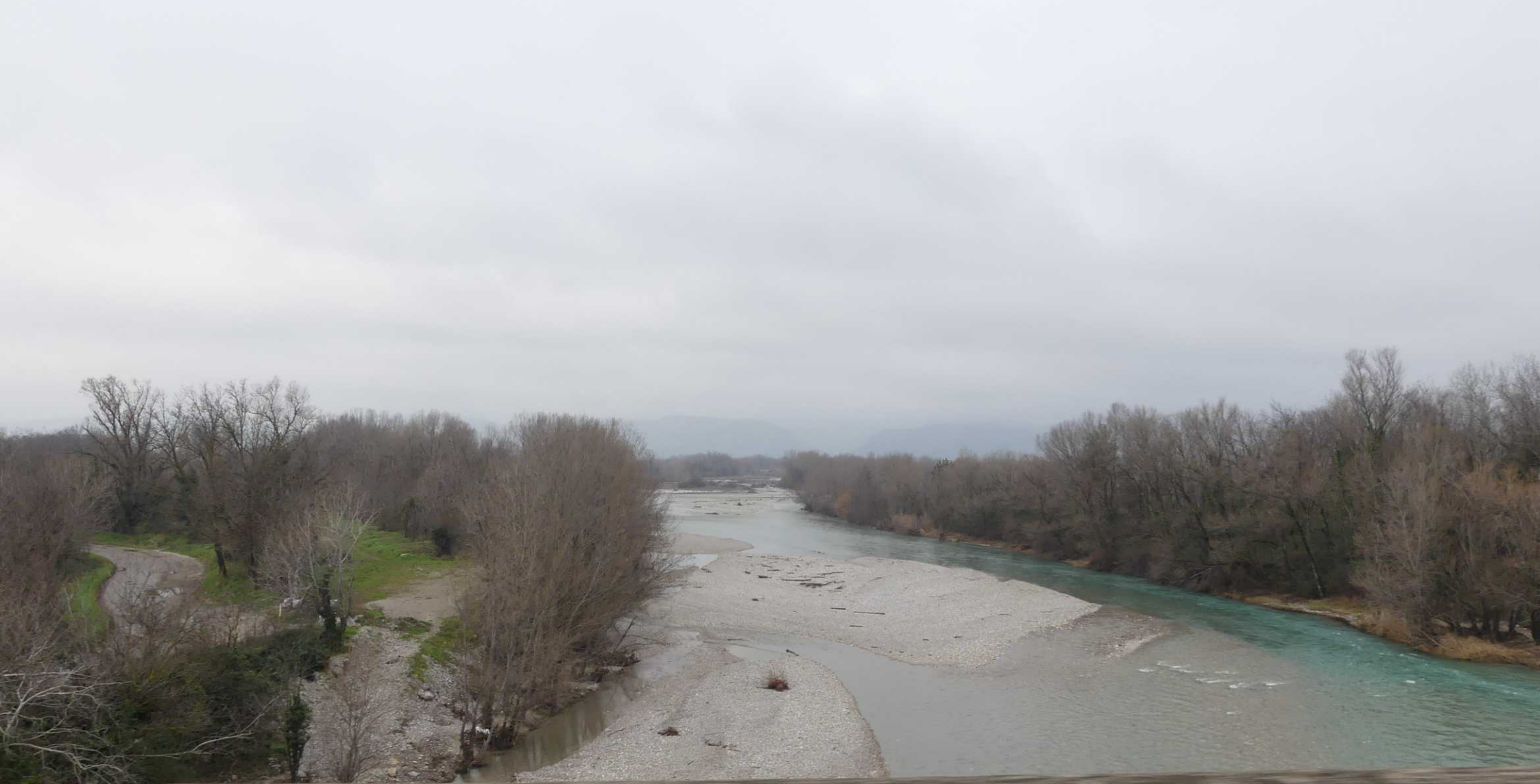
Beausemlant - Port du Chichoulet.