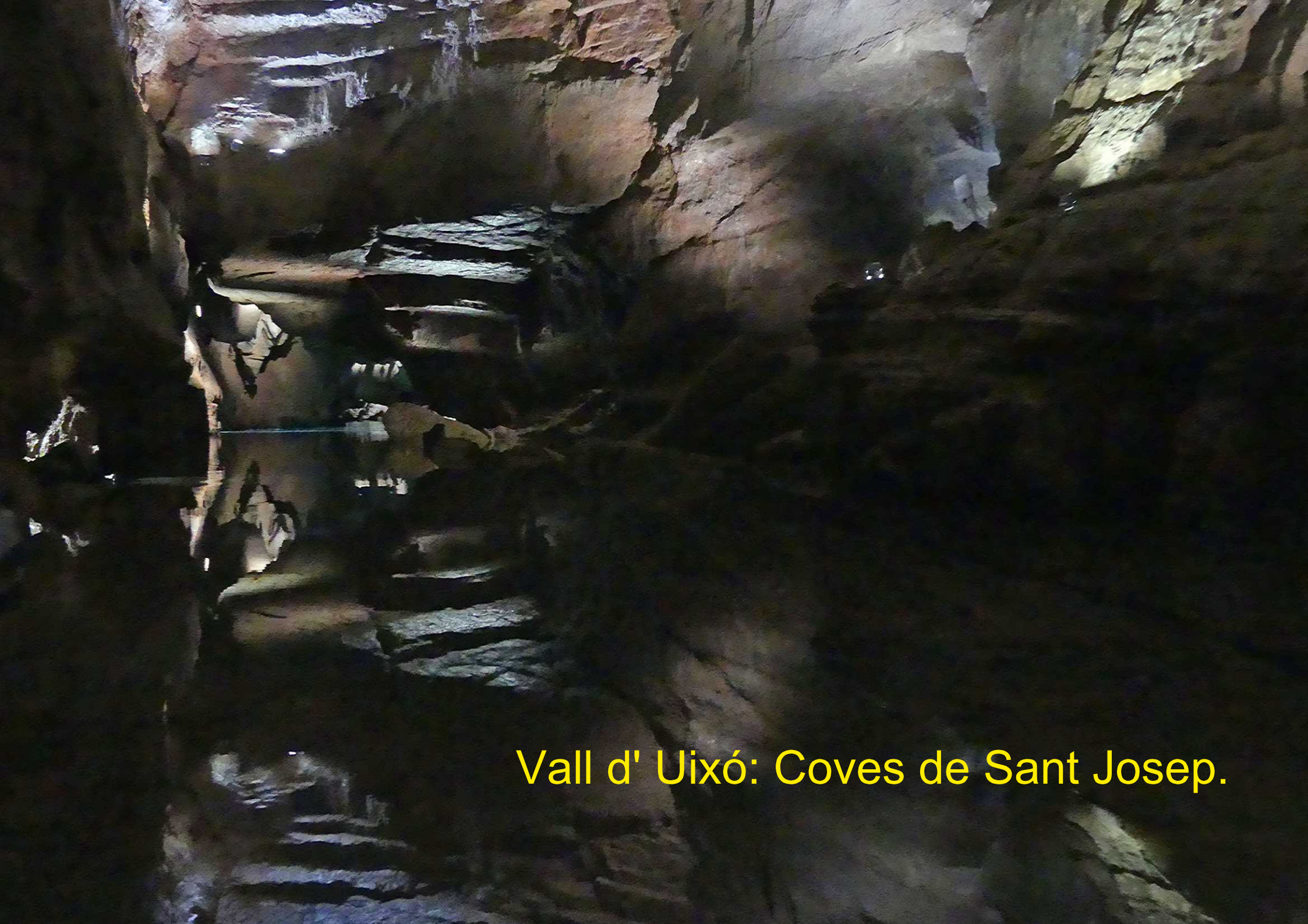
Vall d' Uixó: Coves de Sant Josep.