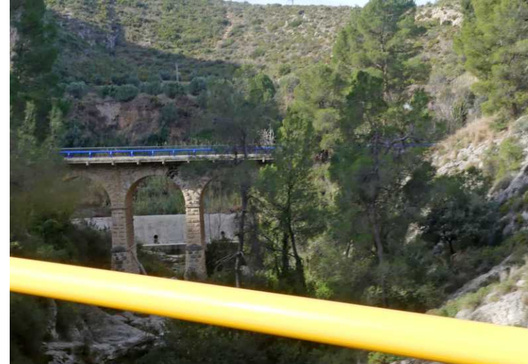
RB, M, O: Canyó del Barranc d'Ontinyent.

Na Ontinyent (11:30) hebben we een prachtige weg CV81 door de kloof van de Río Clariano. Deze weg is ook populair bij wielertouristen. Dus is het op dit bochtige parcours geregeld voor ze inhouden om die 1,5 m ruimte voor fietsers aan te houden.