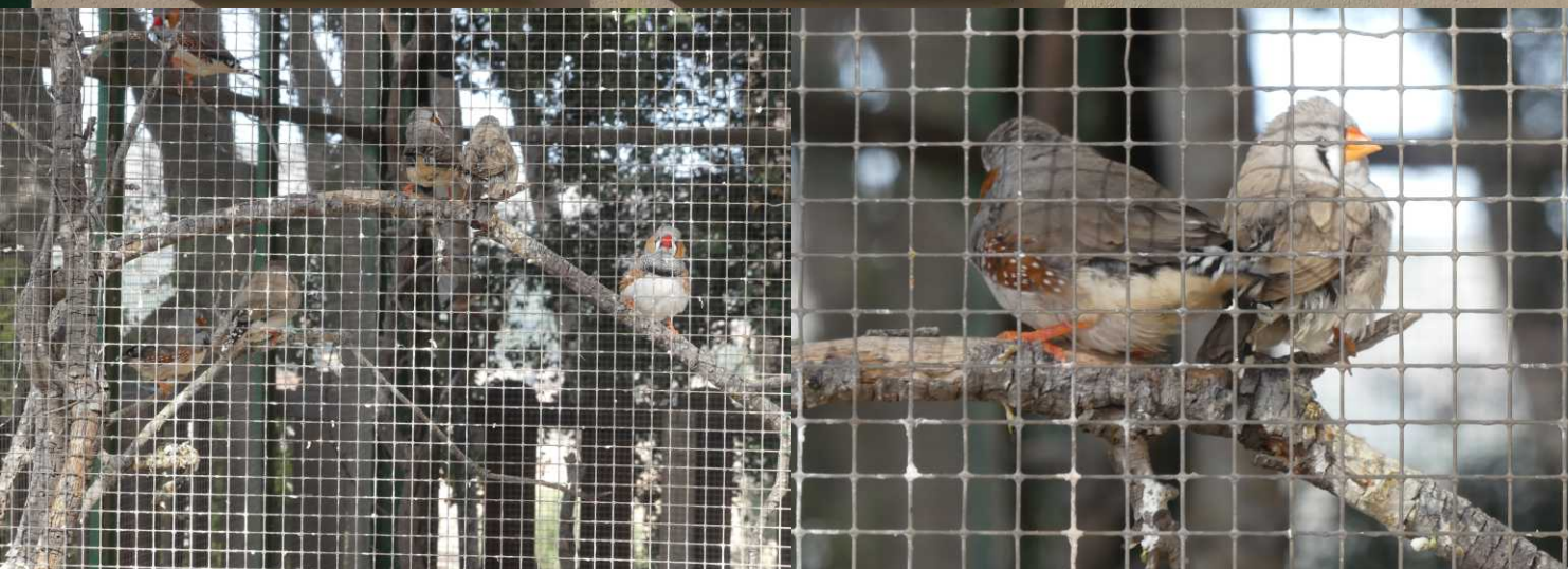
LB: De moderne wijze van informeren. RB: Vila Rosario (Papiermuseum). LO, MO: Australische zebra-vink, Taeniopygia castanotis .

Op de deur staat dat het kantoor tot 2 uur open zou zijn.... niet dus. Wel is de nodige info via QR-codes op te halen. We lopen een rondje door het park daar met een grote villa, kinderspeelplaats en een volière met zebra-vinken. Om 13:15 zijn we terug bij de camper.