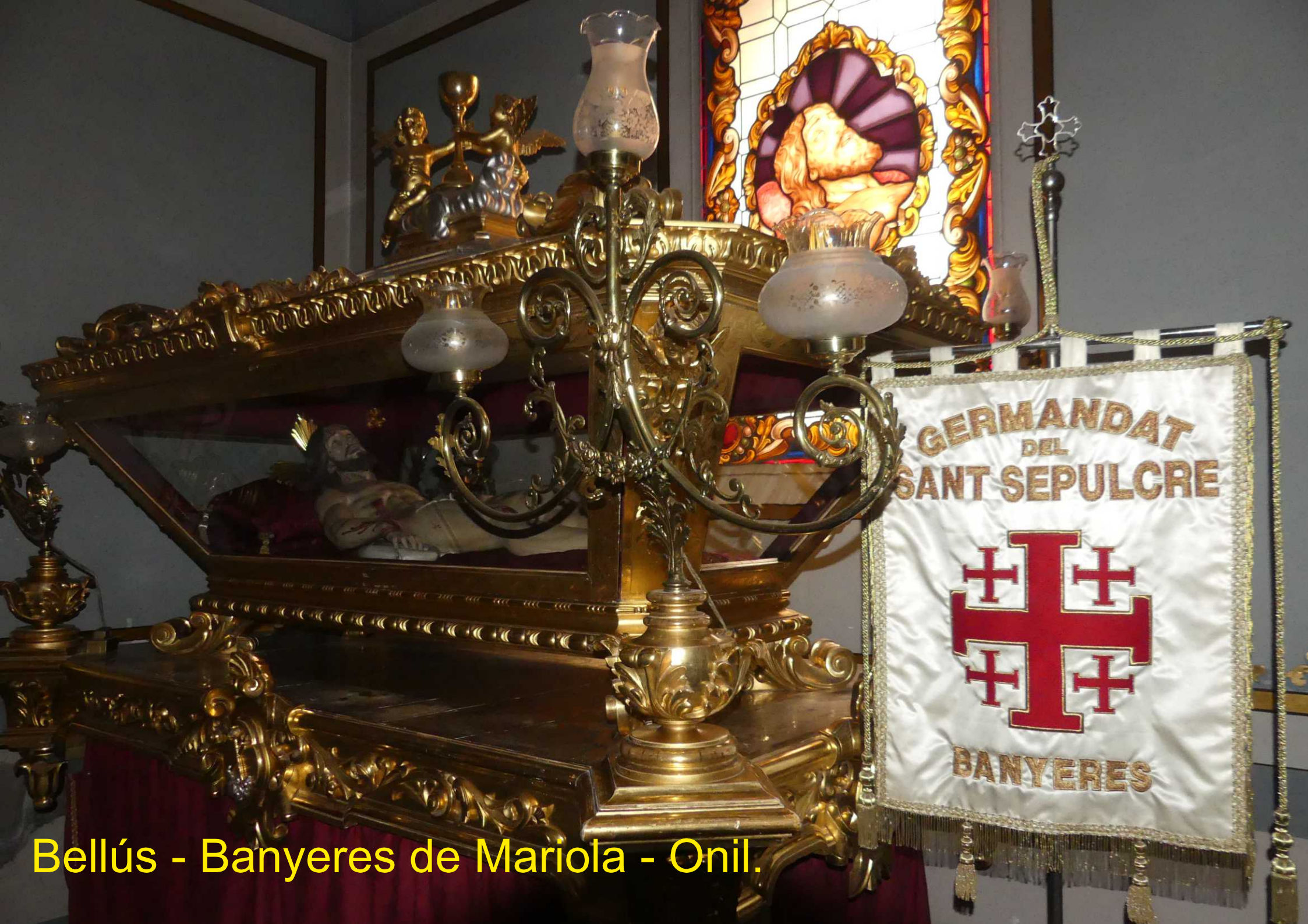
Bellús - Banyeres de Mariola - Onil.