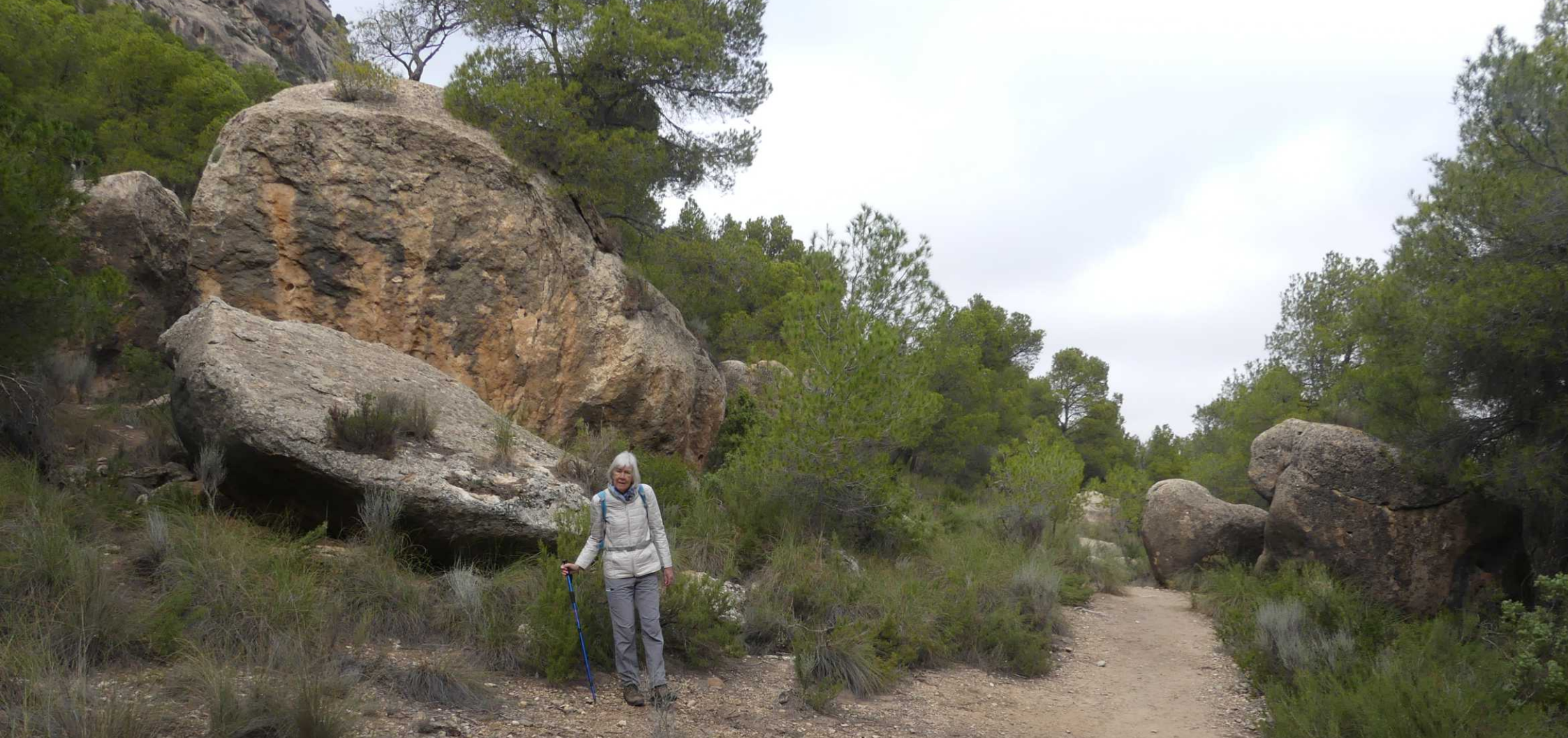
Al die keien, de uitzichten en het struikgewas maken dit tot een prachtige wandeling.