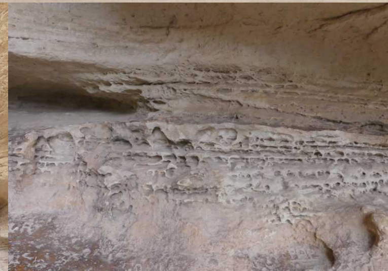
B: Info over karstwerking e.d. MO, RO: Cueva de la Horadada.