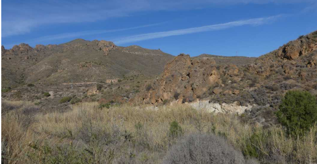
LO: Ramblas de los Miñarros.

We volgen enige tijd de Ramblas de los Miñarros, die we pas om 10:53 goed zien. We kijken onze ogen uit naar dit prachtige landschap. Waarom wordt deze N332 niet groen aangegeven op de kaart?