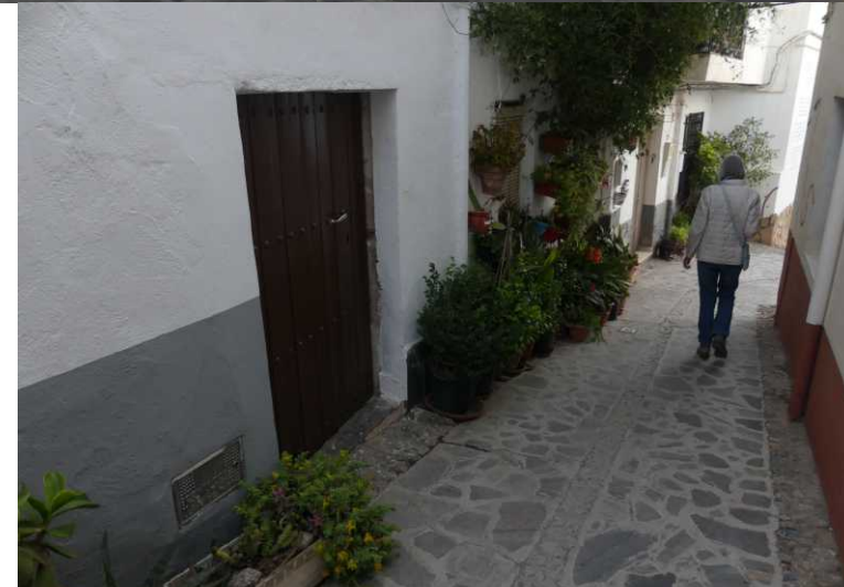
B: Calle Andalucía. LO: Plaza de la Libertad.

We zien huizen met muurschilderingen en gedichten in de Calle Andalucía en een mosfontein op de Plaza de la Libertad. Zo te zien is hier geen gebrek aan water.