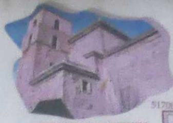
IGLESIA DE N. SRA. DE LA MISERICORDIA