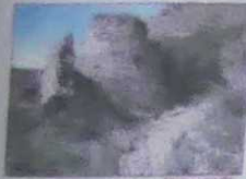
Molino del Río

Si decide recorrer el sendero podrá disfrutar de la asombrosa variedad del paisaje de Almóctia. Así, podrá usted apreciar como el matorral almohadillado de montaña (las plantas adoptan formas semiesféricas para protegerse de las bajas temperaturas y del frío viento), es interrumpido por los barrancos y por el mismo río Andarax, dando lugar a una densa vegetación de ribera (distintos tipos de Álamos, Algarrobos, Almeces, Rosáceas, etc. que necesitan un alto grado de humedad, tanto ambiental como la procedente del suelo). La fauna también es variada, destacando la cabra montes y distintas rapaces.