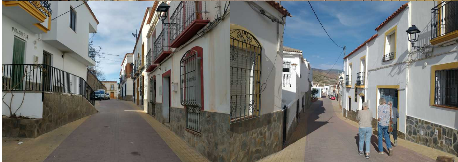
LB: Santa María la Mayor. RB, MO: Calle Ruiz Ocaña. RO: Calle Canario.