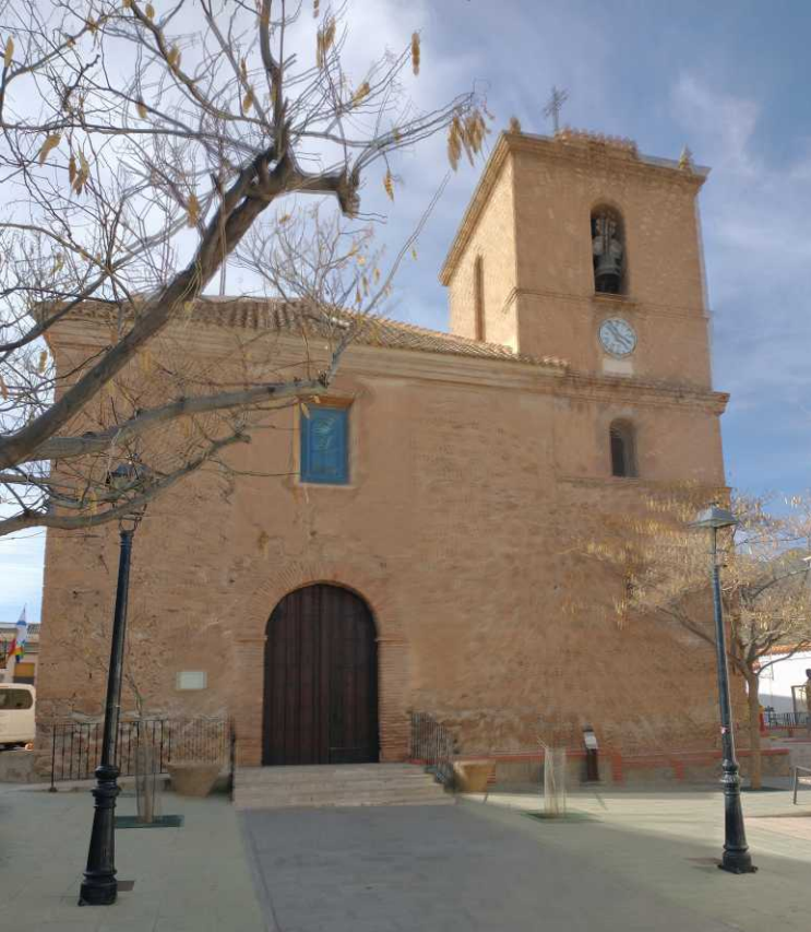
We gaan langs de kerk af en door diverse smalle straatjes met witte huizen. Het ziet er goed uit allemaal.