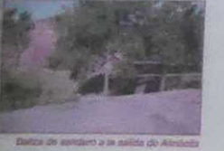
Baliza de sendero a la salida de Almóctia

OBSERVACIONES: Conviene llevar calzado y ropa adecuada a las condiciones del terreno y clima.