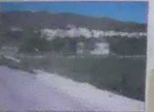
Vista de Almóctia

Si decide recorrer el sendero podrá disfrutar de la asombrosa variedad del paisaje de Almóctia. Así, podrá usted apreciar como el matorral almohadillado de montaña (las plantas adoptan formas semiesféricas para protegerse de las bajas temperaturas y del frío viento), es interrumpido por los barrancos y por el mismo río Andarax, dando lugar a una densa vegetación de ribera (distintos tipos de Álamos, Algarrobos, Almeces, Rosáceas, etc. que necesitan un alto grado de humedad, tanto ambiental como la procedente del suelo). La fauna también es variada, destacando la cabra montes y distintas rapaces.