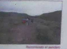
Reconociendo el sendero