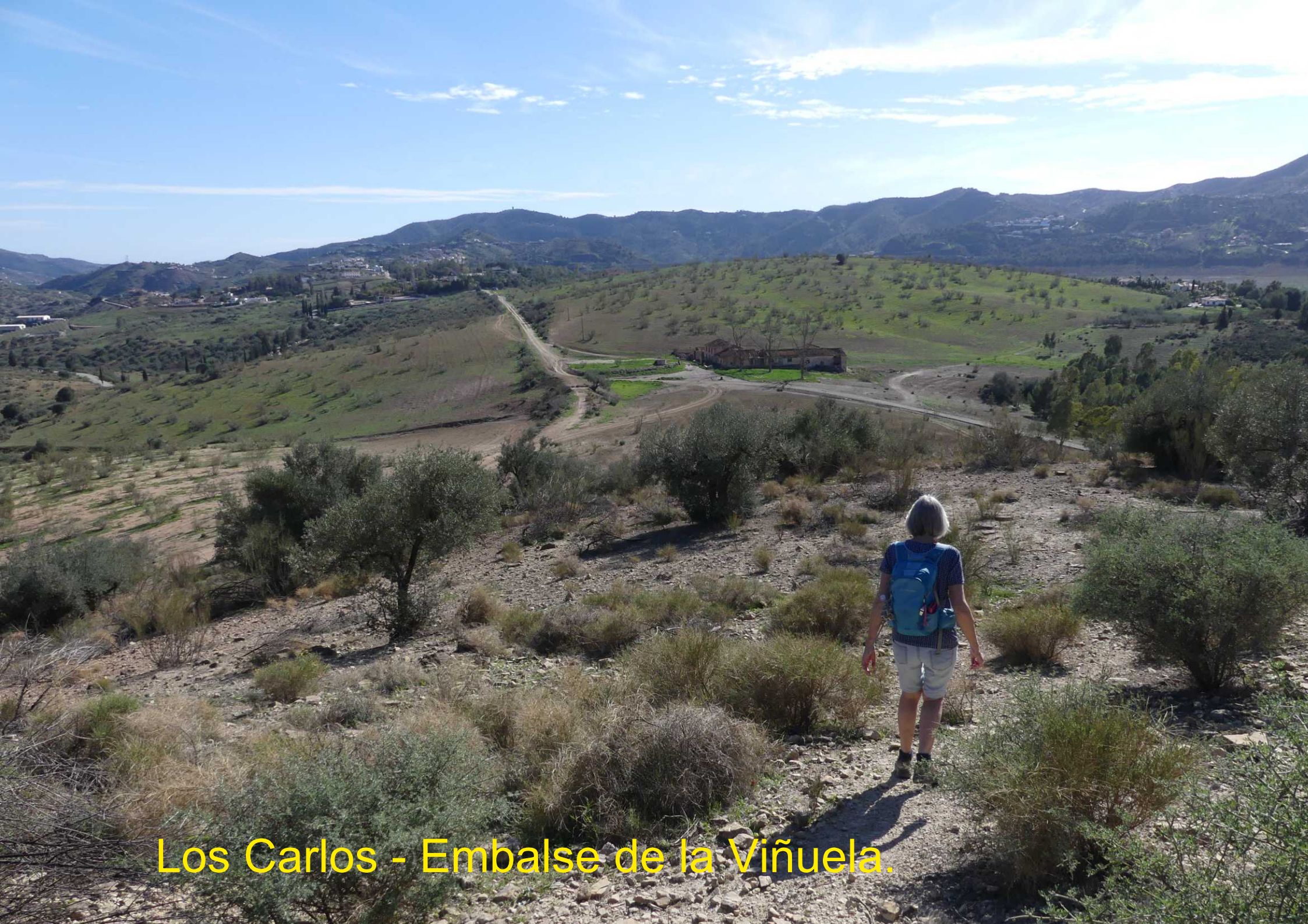
Los Carlos - Embalse de la Viñuela.