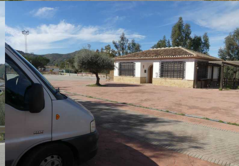
LB: Los Gomez. MB, RB, LM: Calle Pizarras, La Viñuela.