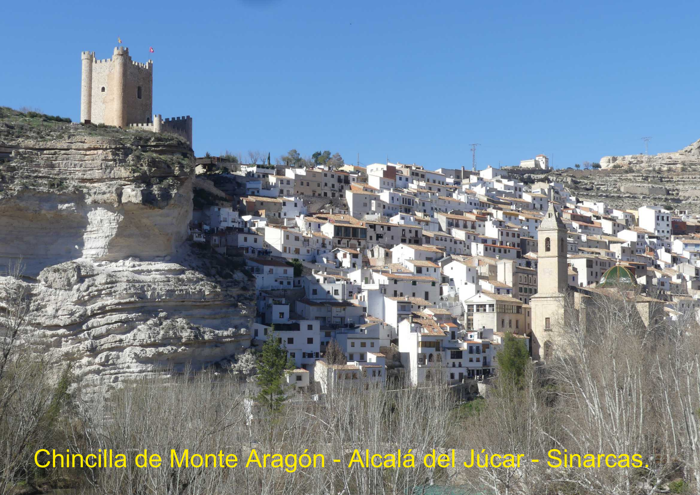
Chincilla de Monte Aragón - Alcalá del Júcar - Sinarcas.