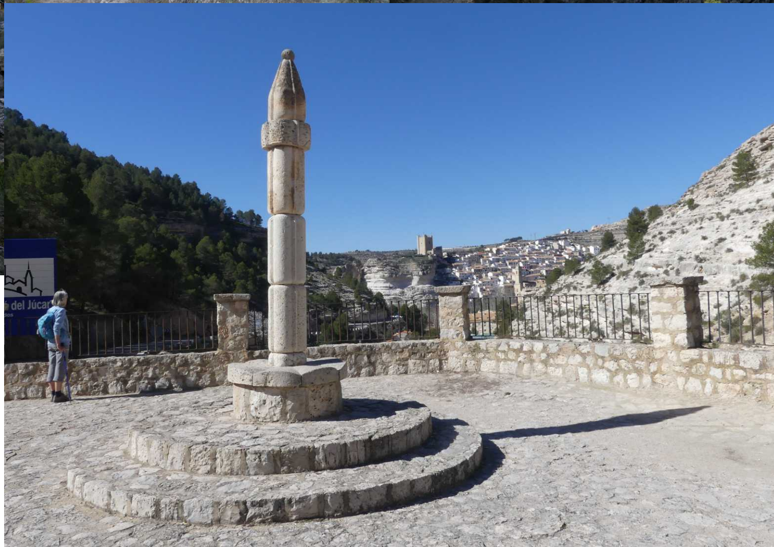
Over een kronkelend rotspad dalen we af naar de doorgaande weg van Alcalá. We kijken even bij een uitzicht op de stad vanaf een platform met een stenen zuil.