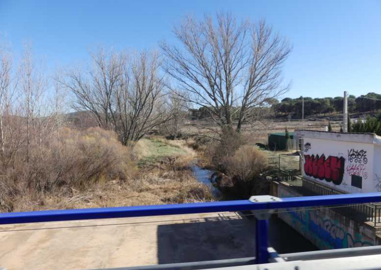
LB: Río Magro. RB: Afslag naar de NIII, Requena. LO, RO: N330 Sinarcas.

Op de buitengrens van Requena slaan we links af de NIII op. Die brengt ons even later op de A3 naar Utiel. Tenslotte rijden we over de N330 (15:33) naar Sinarcas,