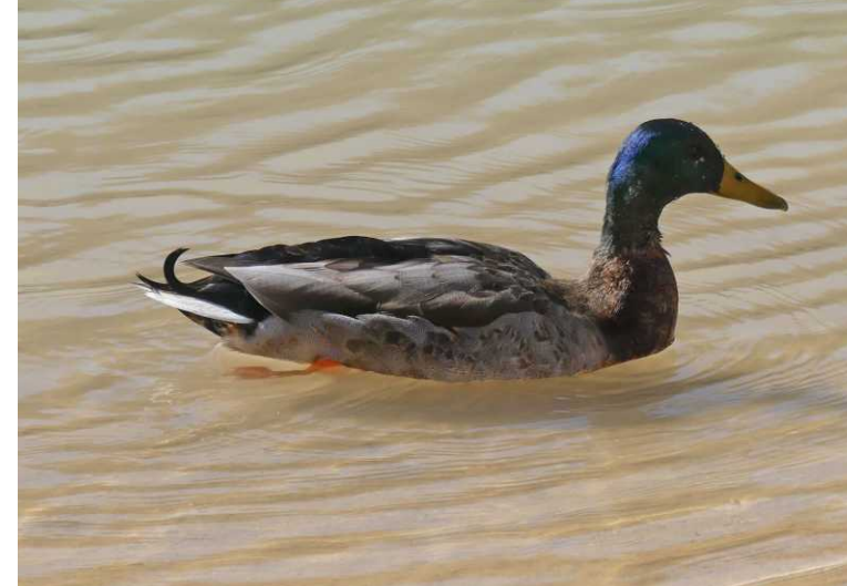
LB Puente Romano. RB: Wilde eend, Anas platyrhynchos . LO, RM: Castillo de Alcalá. RO: Sendero del Corciolico.

Daar zien we dat deze stad op tourisme is ingesteld met winkels, bars en restaurants. Verder krijgen we mooi zicht op de aparte kasteelrots, die aan de zuidzijde een flink eind is ingesneden.