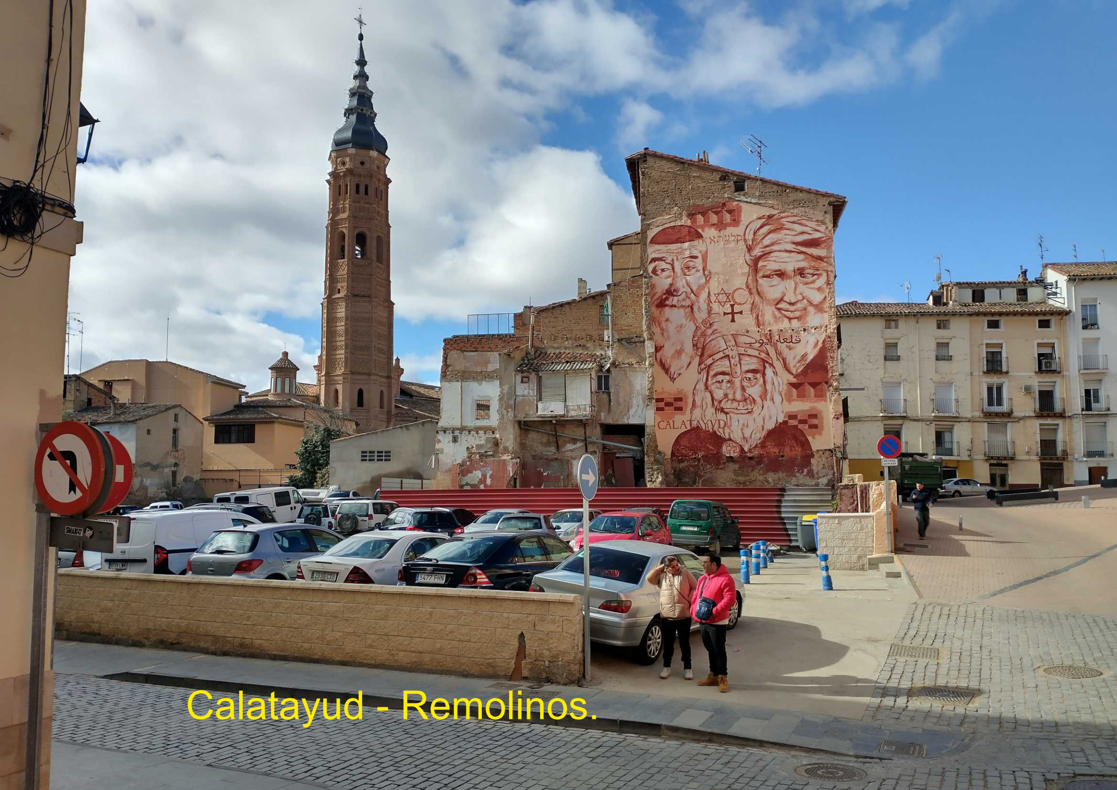
Calatayud - Remolinos.