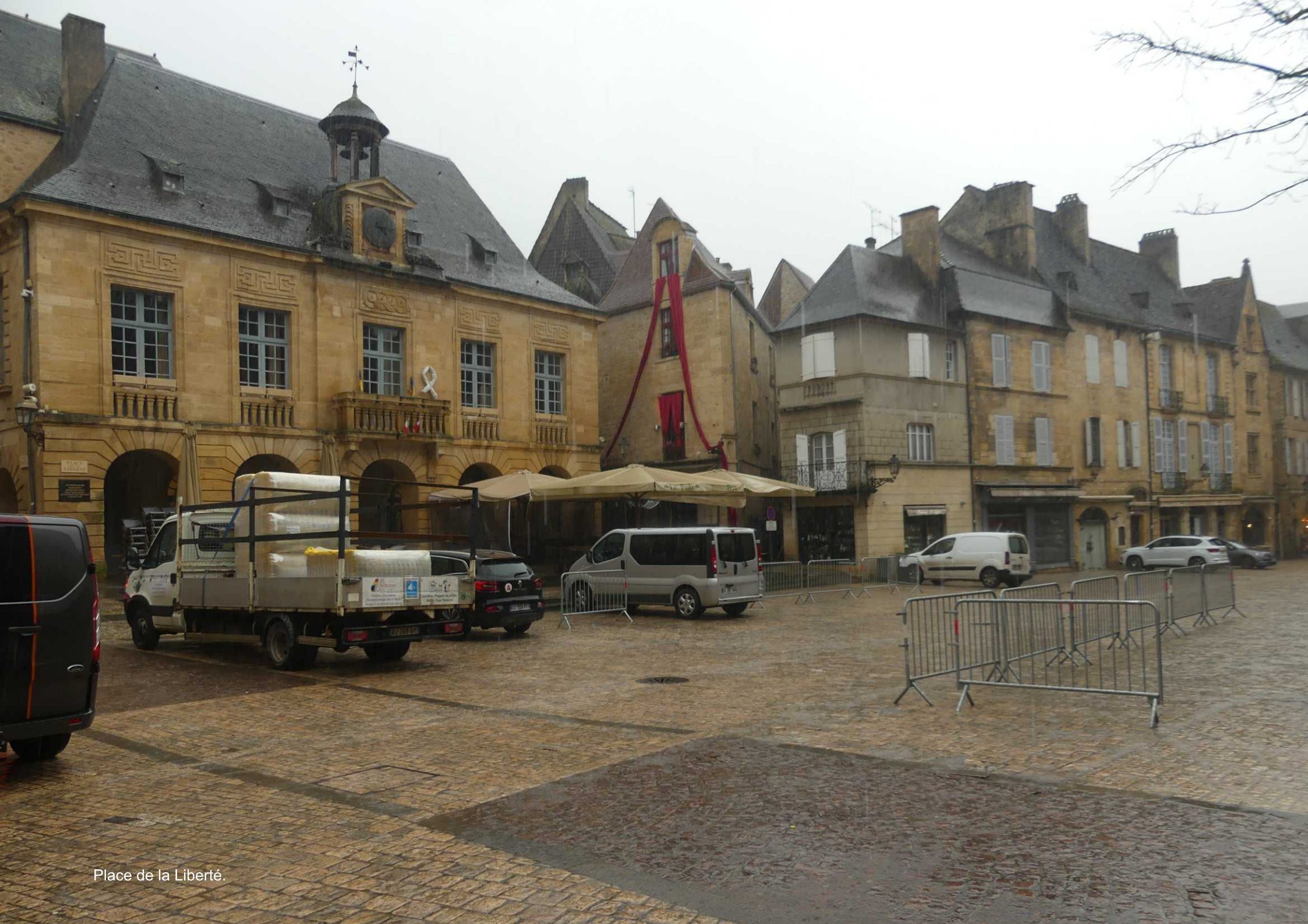
Place de la Liberté.