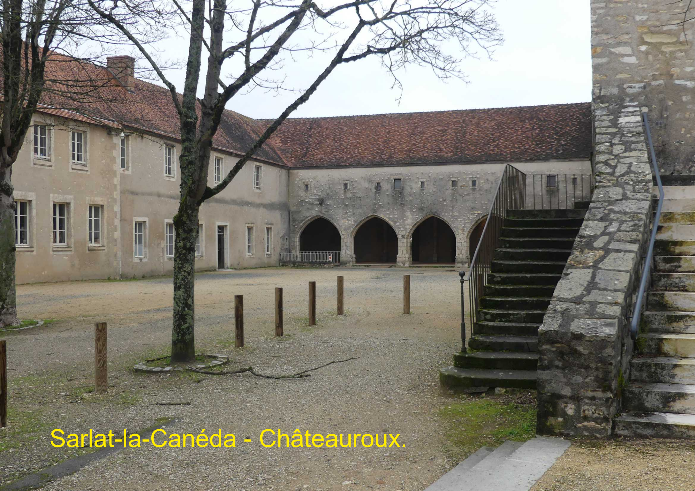
Sarlat-la-Canéda - Châteauroux.