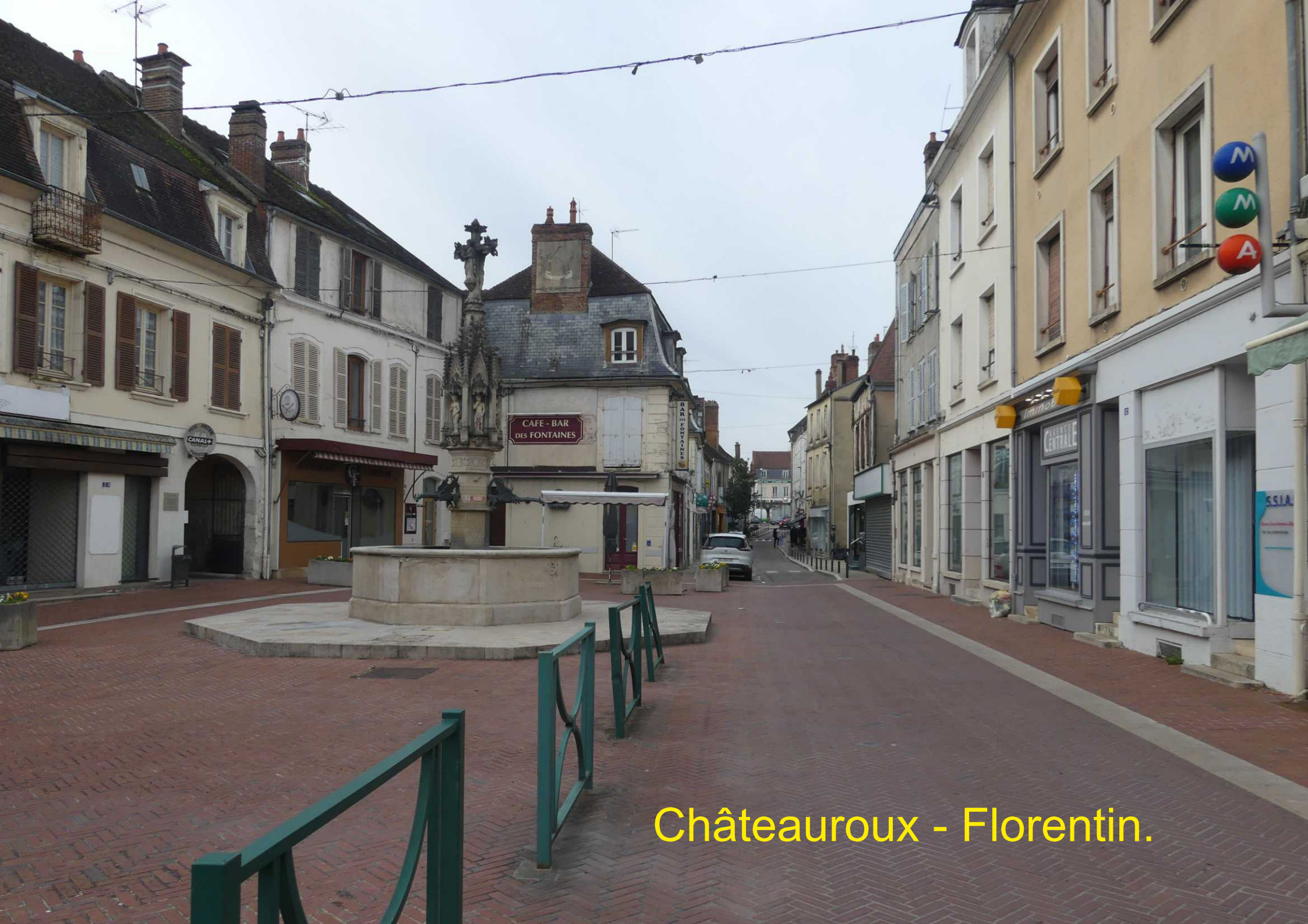
Châteauroux - Florentin.