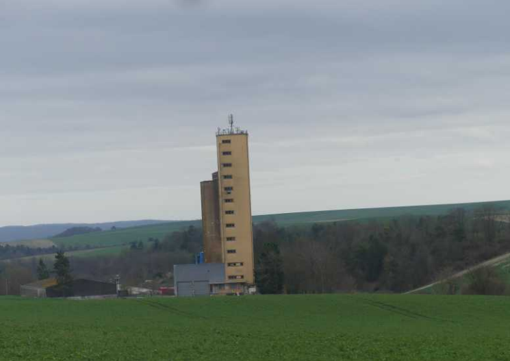
Het landschap wordt weer wat geaccidenteerd.