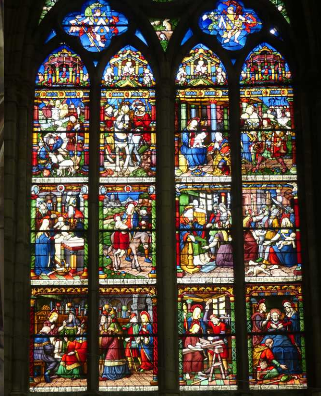
Deze pagina: Cathédrale Saint Etienne.