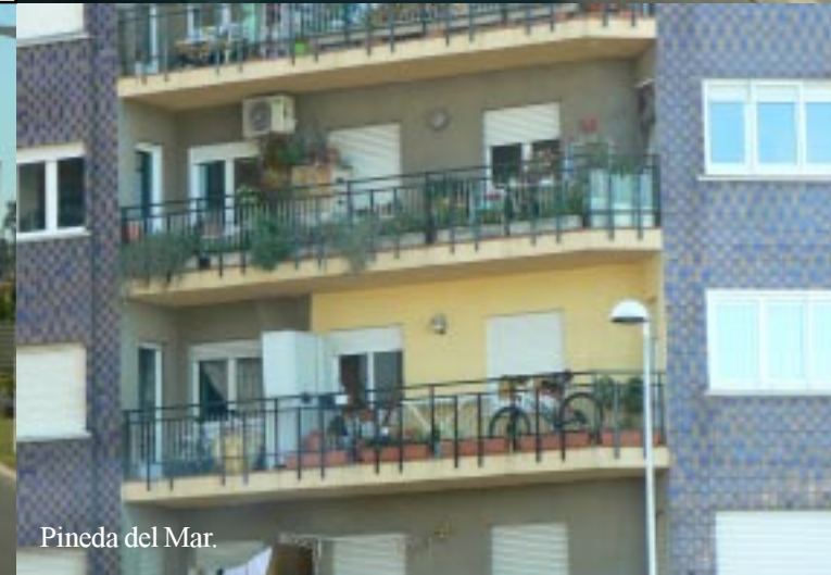
Pineda del Mar.