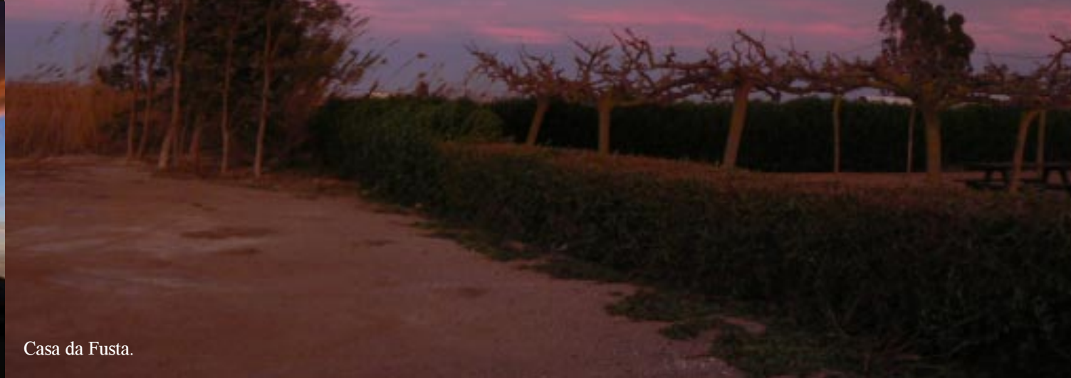
Casa da Fusta.