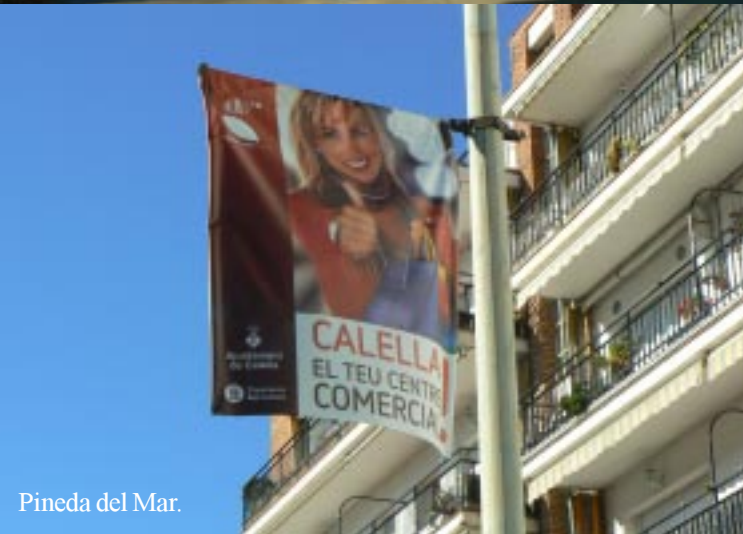
Pineda del Mar.