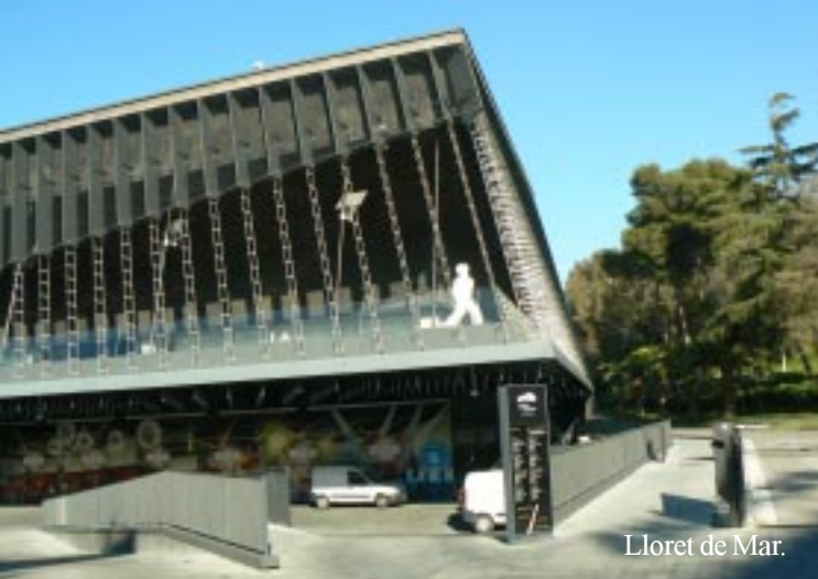
Lloret de Mar.

12.00 Lloret de Mar. Om 12.10 zien we het beruchte Repsolstation uit de eerste Spanjereis. Na Parafolls gaat het wat sneller over de NII richting Calella. 12.25 Pineda del Mar. 12.30 Calella. 12.50 boodschappen bij LIDL in Arenys del Mar. Daar lunchen we dan. 13.40 verder.