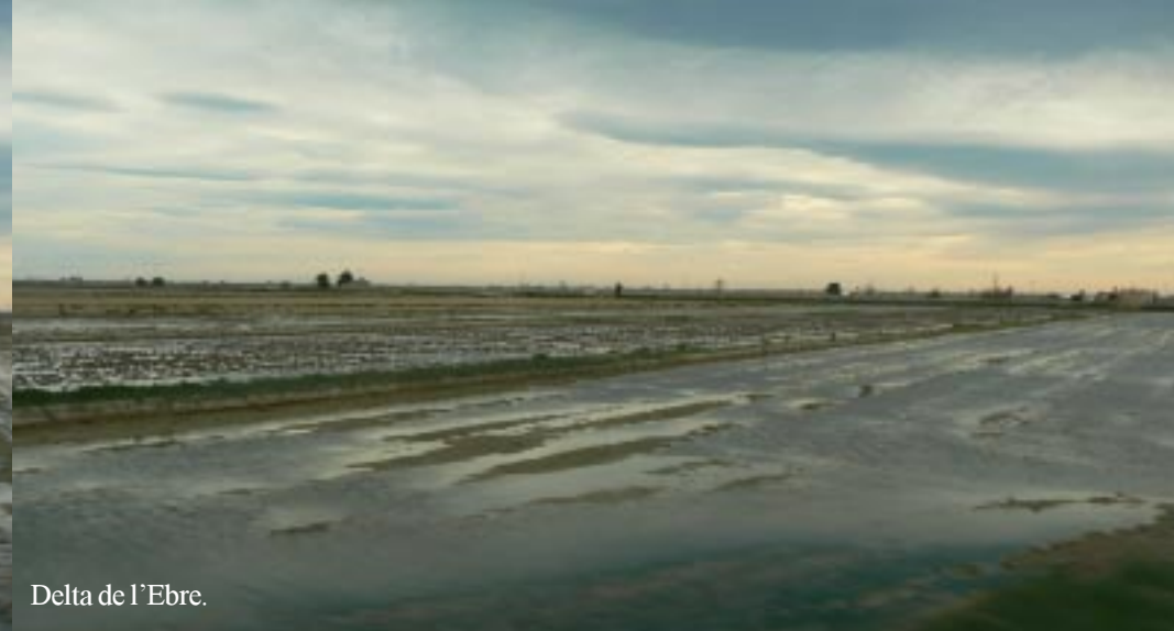
Delta de l'Ebre.