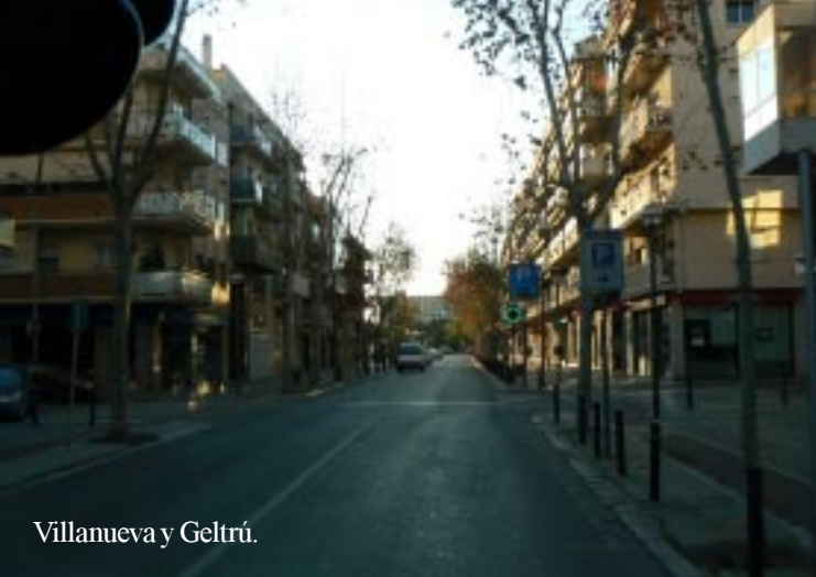
Villanueva y Geltrú.

Tenslotte rijden we naar het 11 km verderop gelegen Vilanueva y Geltru. Een cache bij een telefooncel vinden we niet, wèl de parking om te overnachten. (Daar staan al 2 campers.) 17.05. Voor we avond en nacht ingaan, maakt Tineke nog een klein rondje langs het strand. Morgen meer. Radio Teletaxi zorgt naast geklets met vrouwen, die bellen ook voor flamenco en cante forte, prachtig. FM102.