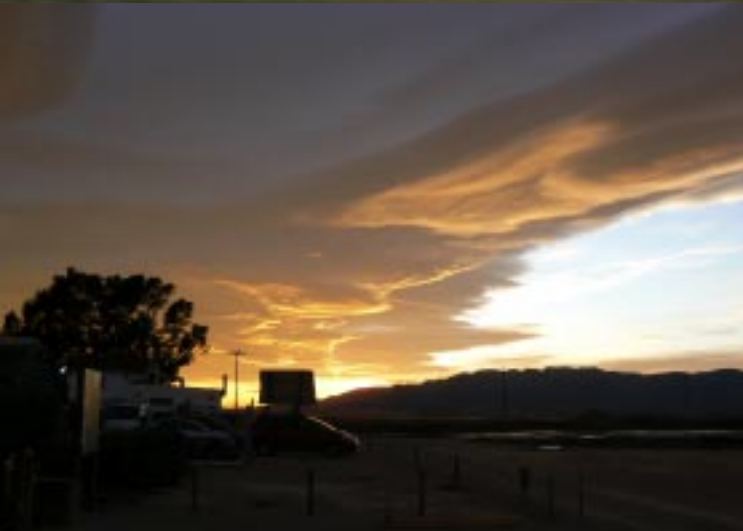
St. Jaime d'Enveja.

Het waait hier op deze vlakte gigantisch. Dan wacht ons nog een fabuleuze zonsondergang. Die wolkpartijen die we al heel de middag zagen worden nu op een fantastische manier uitgelicht. In de duisternis krijgen we nog gezelschap van een Spaanse camper, die zich op deze weidse vlakte tegen ons aanschurkt.