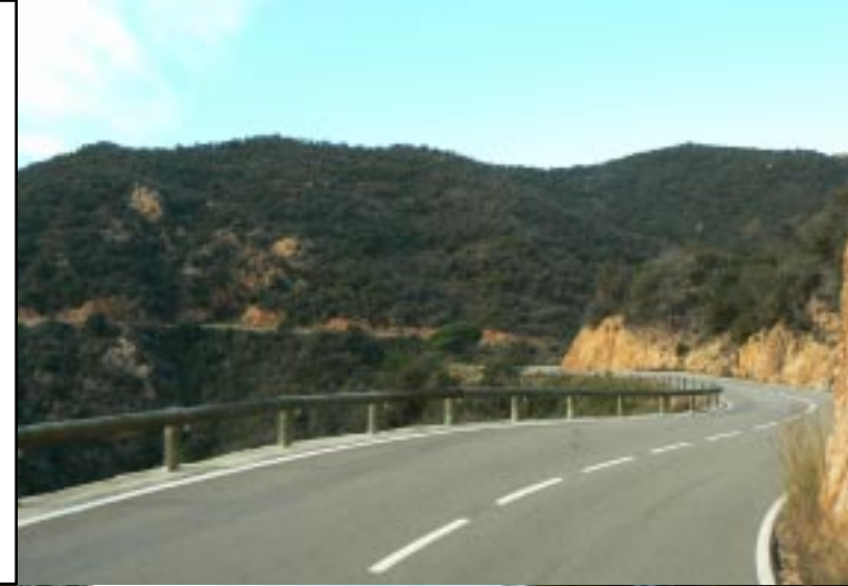
Kustweg naar Tossa del Mar.

04-01-'12. Feliu de Guíxols - Villanueva y Gentrú. 10.55 (1581 km) vertrekken we na water tanken. We nemen de mooie en kronkelende kustweg naar Tossa del Mar. Steeds van hoog zicht op de kliffen, zee en de verspreid liggende urbanicacjon. 11.45.