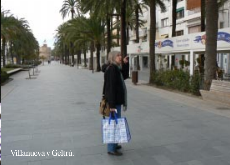
Villanueva y Geltrú.