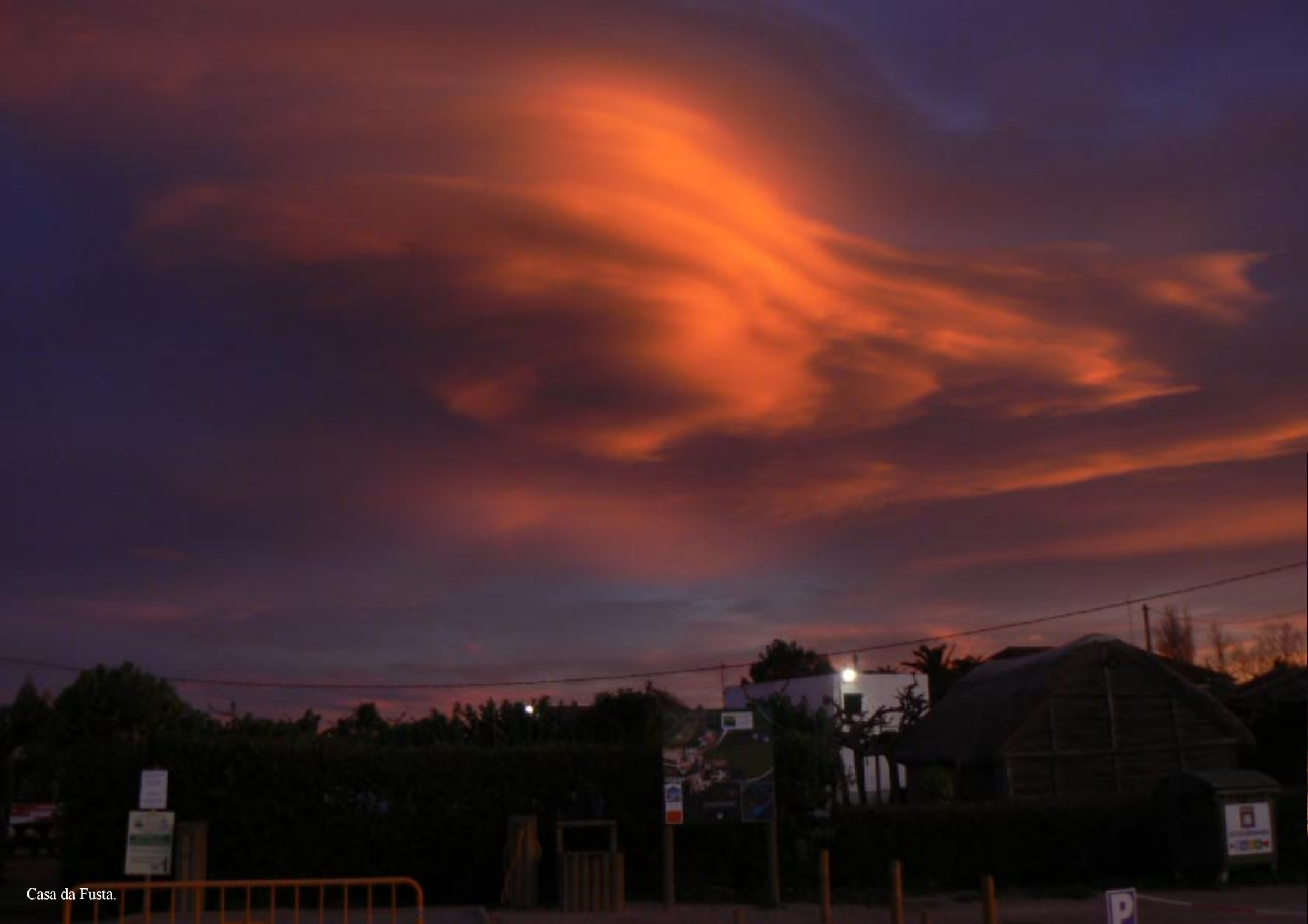
Casa da Fusta.