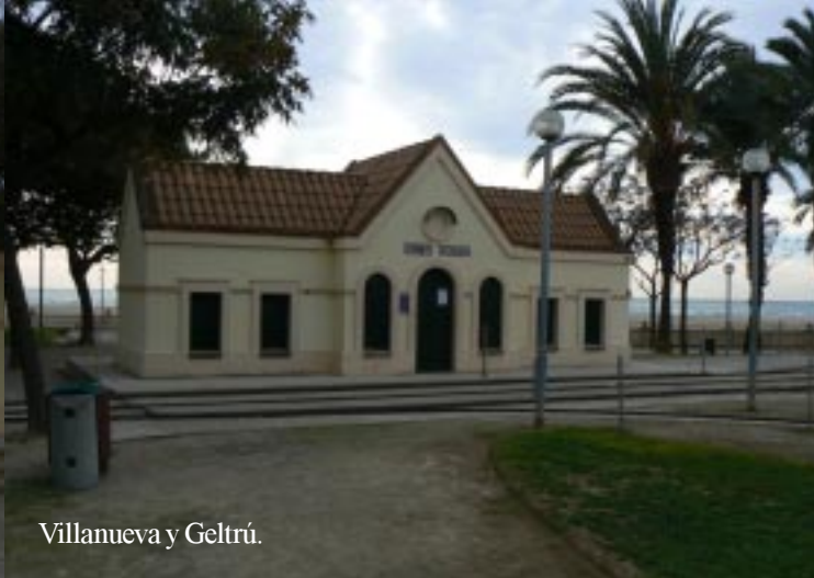
Villanueva y Geltrú.

In Cubelles schuiven we in een file aan. 12.50 Segur de Calafell (een lange rij van bebouwing.) De poort Arc Romà de Barà 13.15 kennen we al. De D340 brengt ons door meer bebost gebied naar Tarragona. 13.30. 13.40 afslag naar Salou langs industriegebied. De vuurtorencache (Salou) is onbereikbaar.