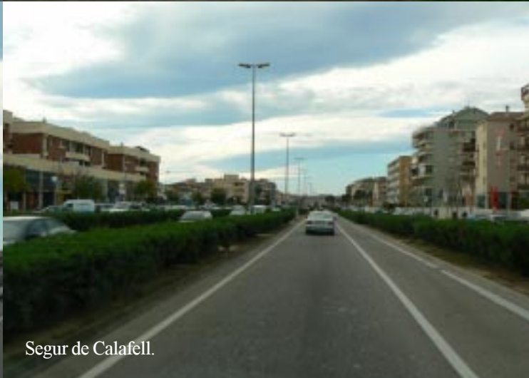
Segur de Calafell.