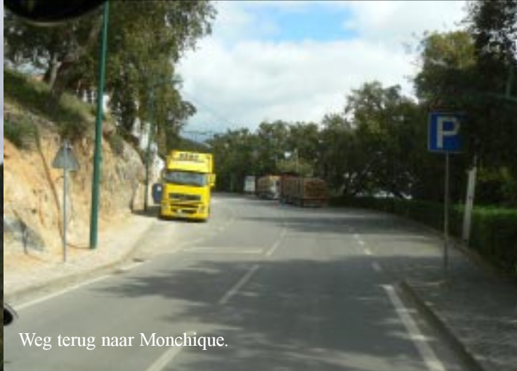
Weg terug naar Monchique.