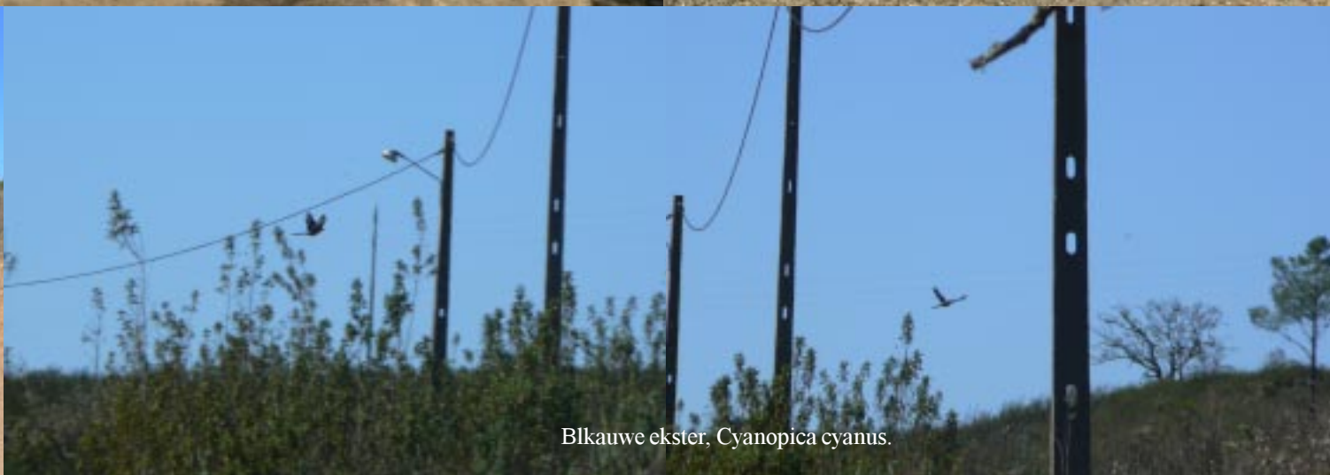
Blkauwe ekster, Cyanopica cyanus.