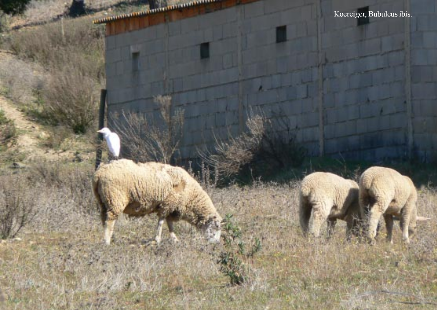
Koereiger, Bubulcus ibis .