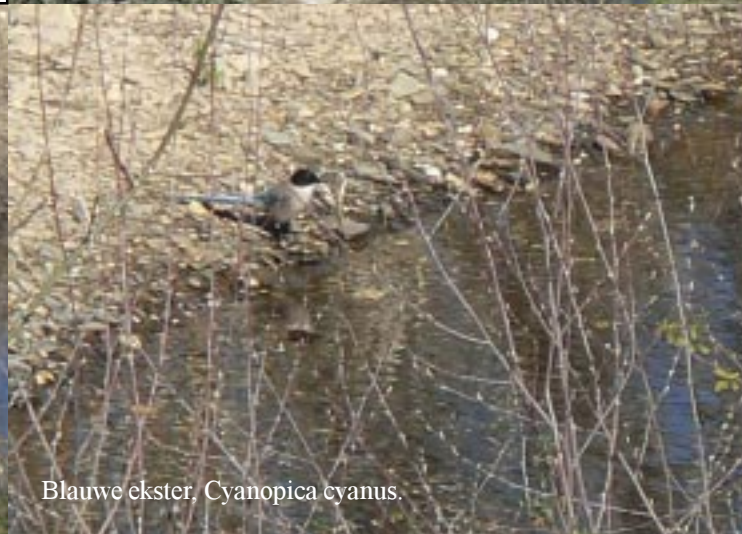
Blauwe ekster, Cyanopica cyanus .