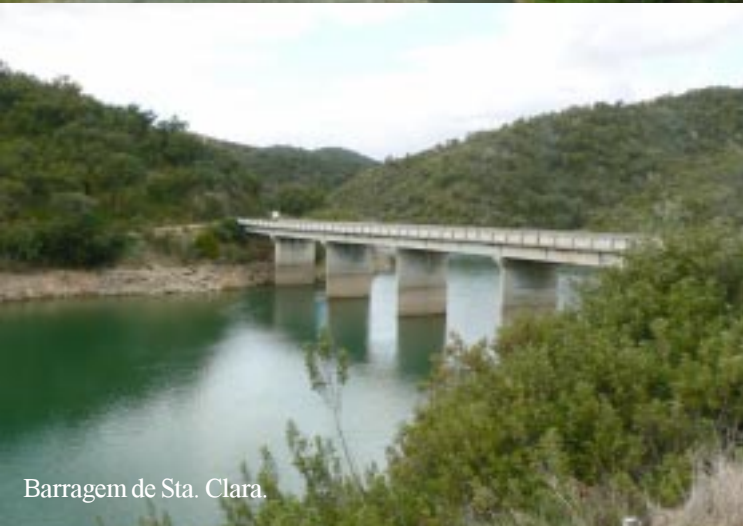
Barragem de Sta. Clara.