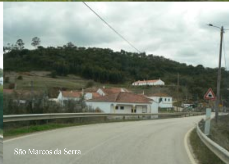
São Marcos da Serra..