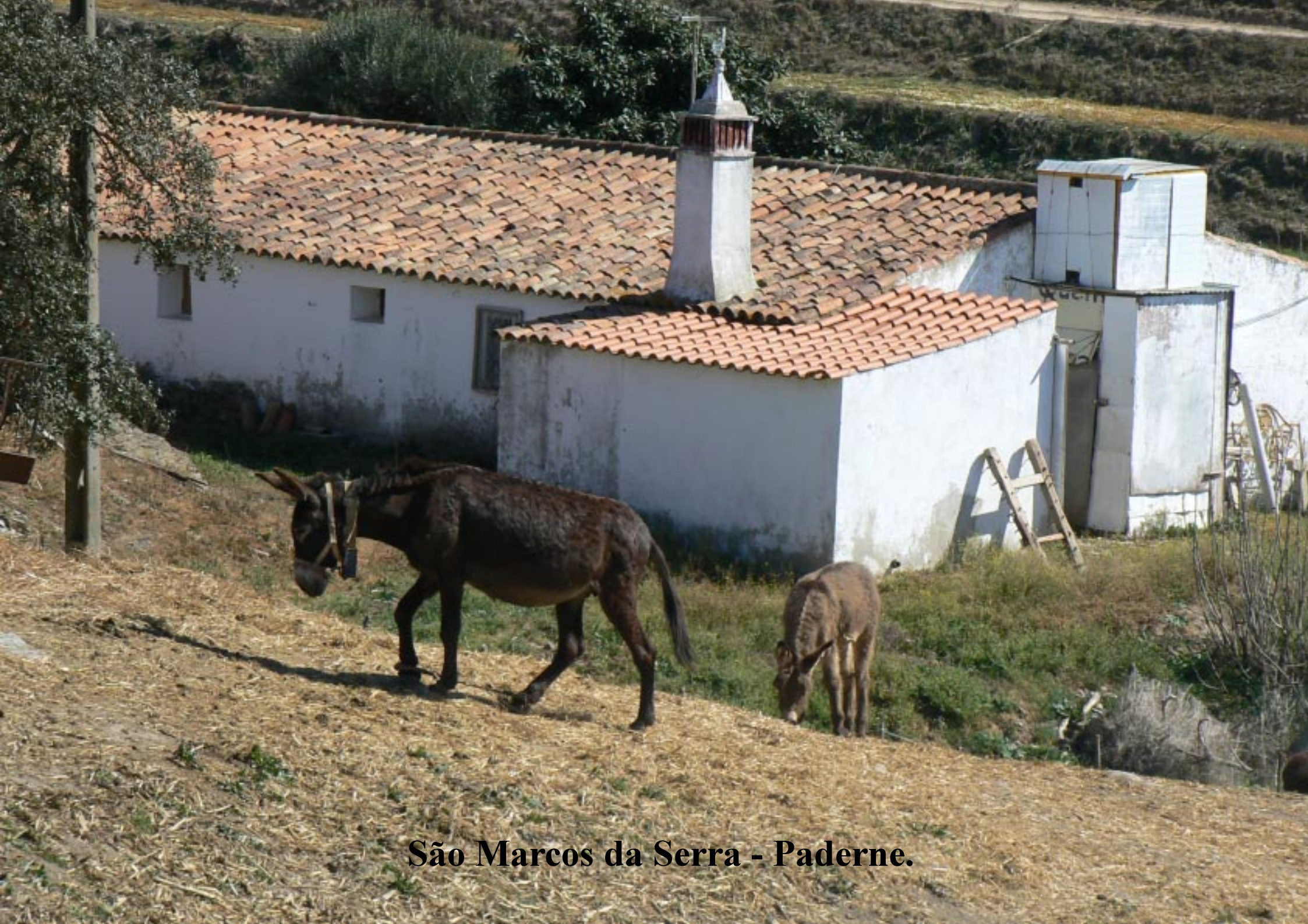
São Marcos da Serra - Paderne.