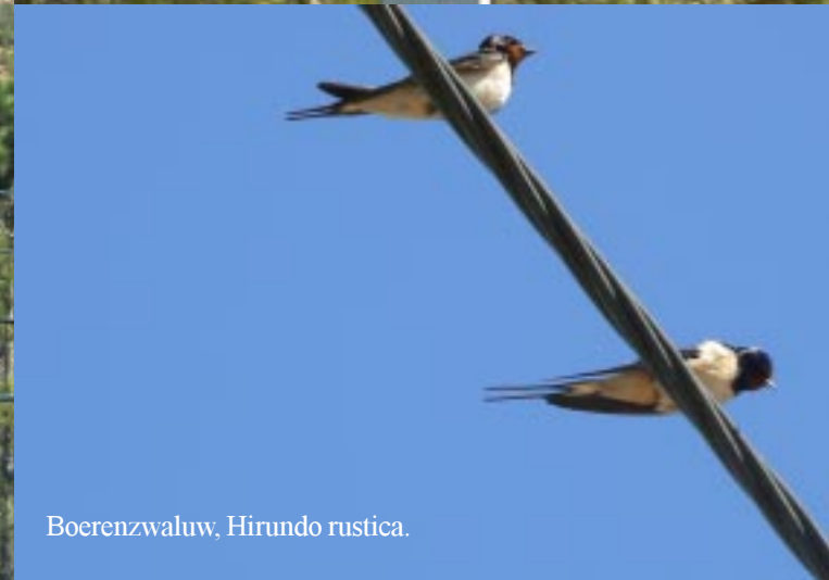
Boerenzwaluw, Hirundo rustica .