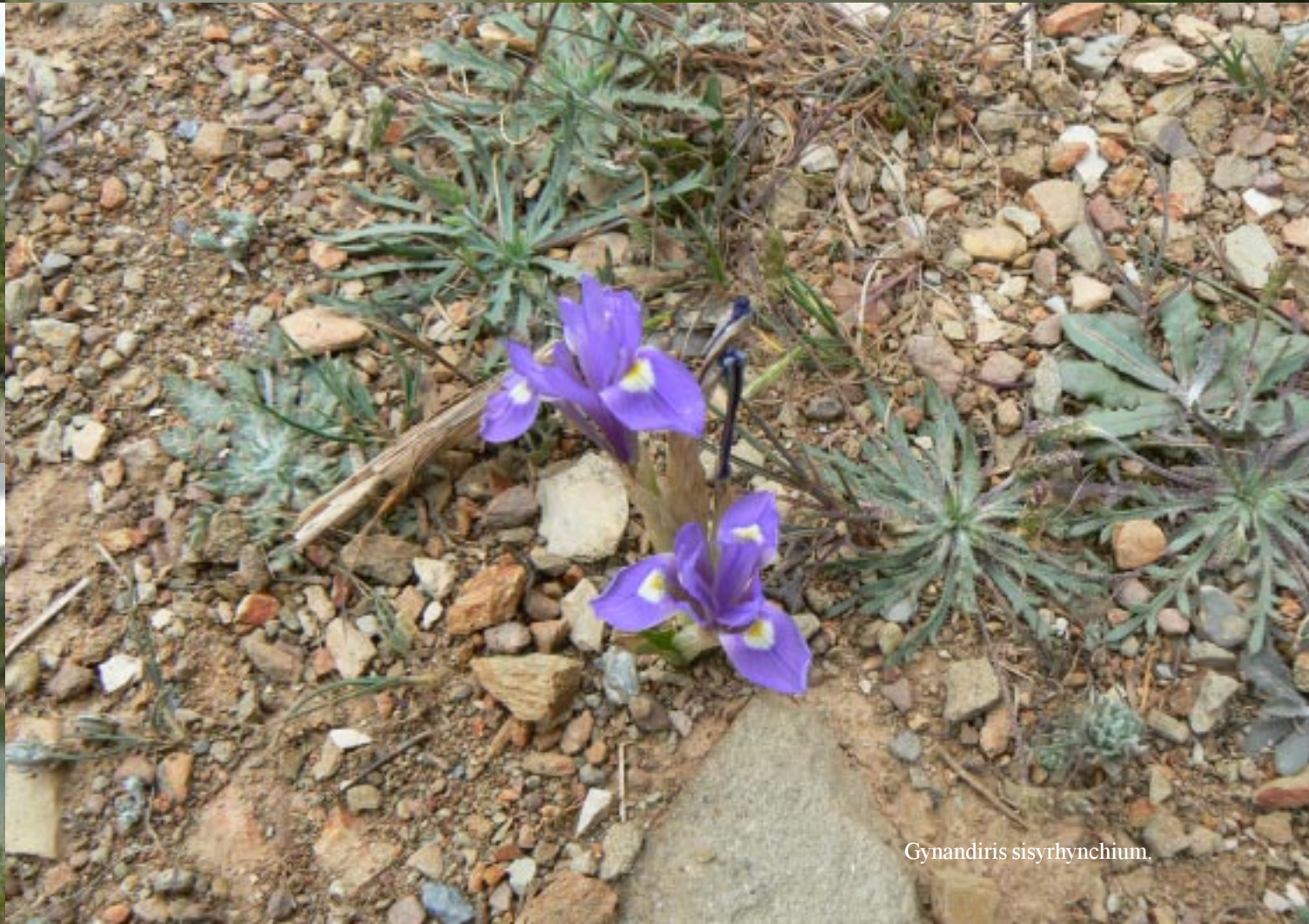
Gynandiris sisyrhynchium .