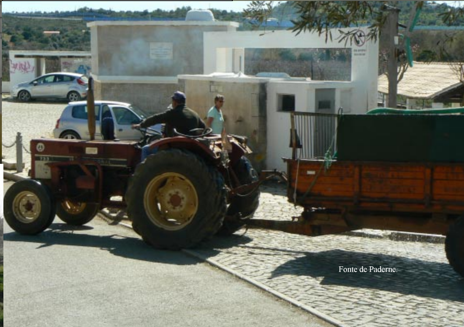
Fonte de Paderne.