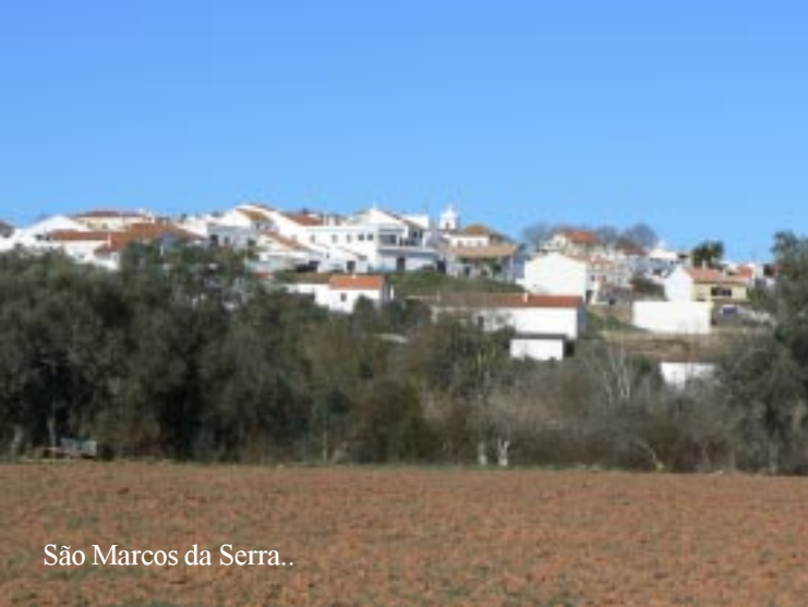
São Marcos da Serra..