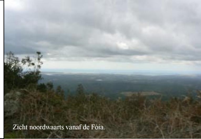
Zicht noordwaarts vanaf de Fóia.

03-18-'12. Fóia - B.gem de Sta Clara - São Marcos da Serra. Vertrek vandaag is 10.40 (4917 km) na een stormachtige en koude nacht: T min : 4,3°C. We rijden over dat weggetje dat we gisteren hebben gelopen, maar nu uiteraard wel door naar de weg naar Monchique.