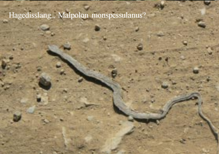
Hagedisslang., Malpolon monspessulanus?