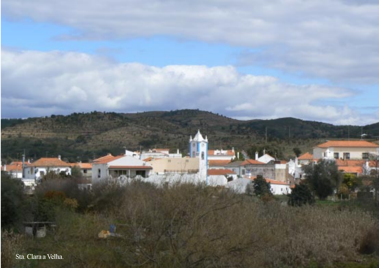
Sta. Clara a Velha.

Wij gaan echter door via Sta Clara a Velha 13.10 en een gele gang van bloeiende acacia's.