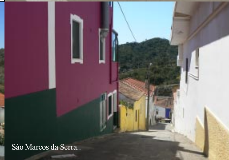
São Marcos da Serra..