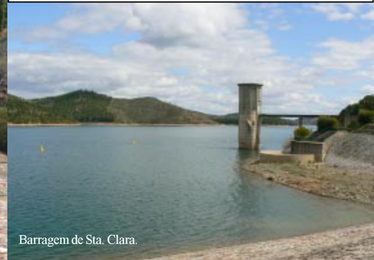
Barragem de Sta. Clara.

We slaan links af naar de Barragem de Sta Clara. Vlak voor we daar zijn, zien we een Bijeneter op een elektriciteitsdraad. Helaas geen foto. Van 12.15 tot 13.00 uur over de dam gelopen en een theepauze aan de stuwdam. Dit is een mooie plek om te overnachten!