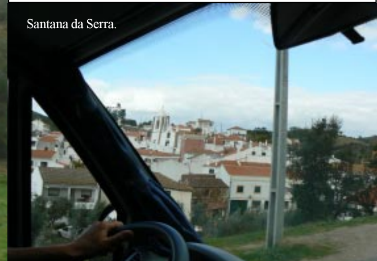
Santana da Serra.

We vinden na een rondje door het dorp vlak bij de IC1, het voetbalveld en de bombeiros een rustig plekje voor van nacht. Tegen 6 uur gaat er ook de herder met zijn schapen op huis aan. Ze laten de bloemperken netjes kaal achter.