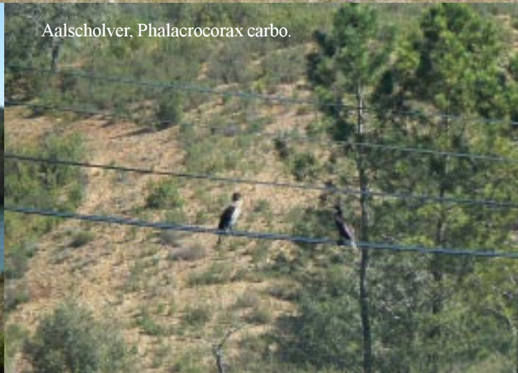
Aalscholver, Phalacrocorax carbo .