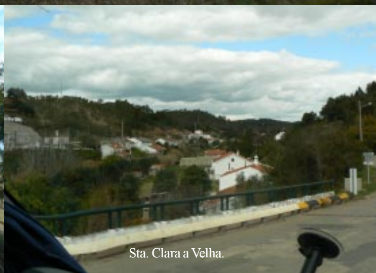
Sta. Clara a Velha.