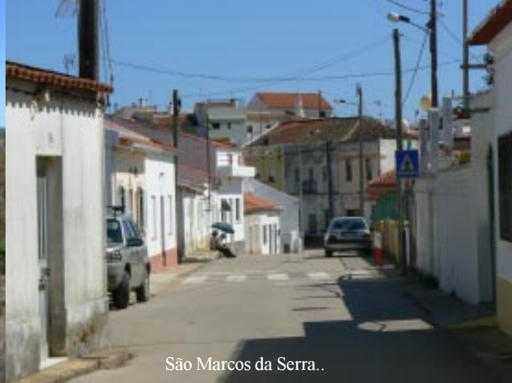
São Marcos da Serra..