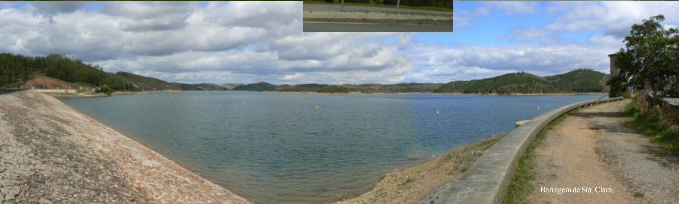
Barragem de Sta. Clara.