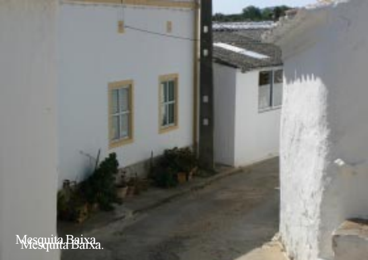
Mesquita Baixa. Mesquita Baixa.