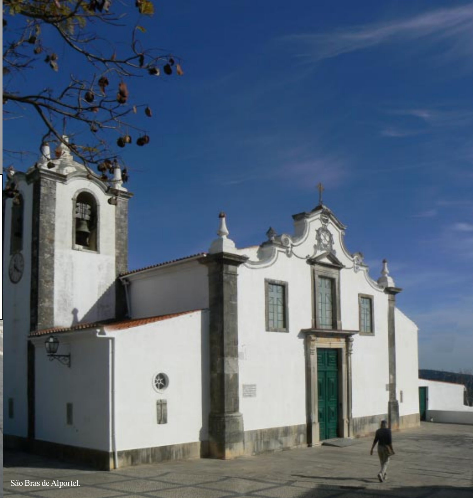
São Bras de Alportel.