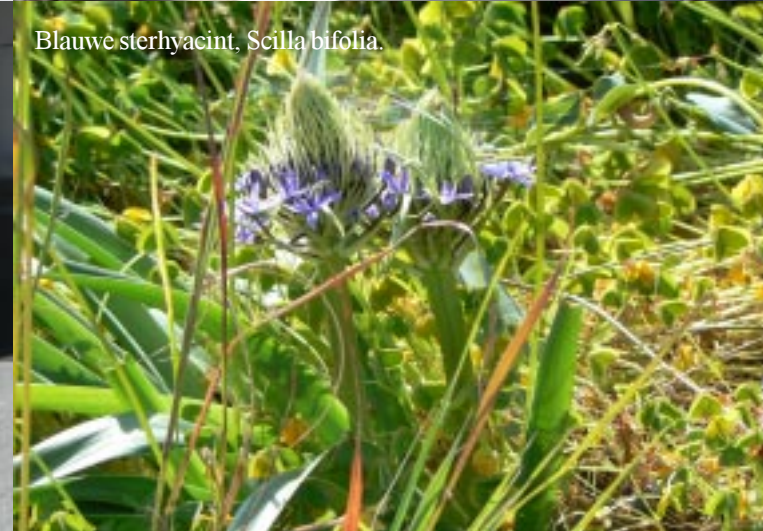
Blauwe sterhyacint, Scilla bifolia .