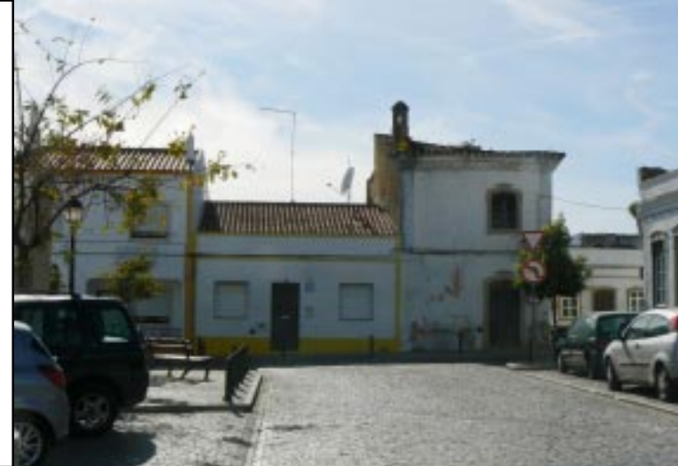
São Bras de Alportel.

We missen een eind buiten dit dorp een afslag. Zo lopen we langs de Mesquitakapel naar de camper terug. ( 15.15). Wel gaan we nog even bij de Moinho de água verderop aan de weg. 15.40 verder naar het heel aardige dorp São Bras de Alportel (15.50). We bekijken het dorp, vinden echter geen geschikte overnachtingplaats.