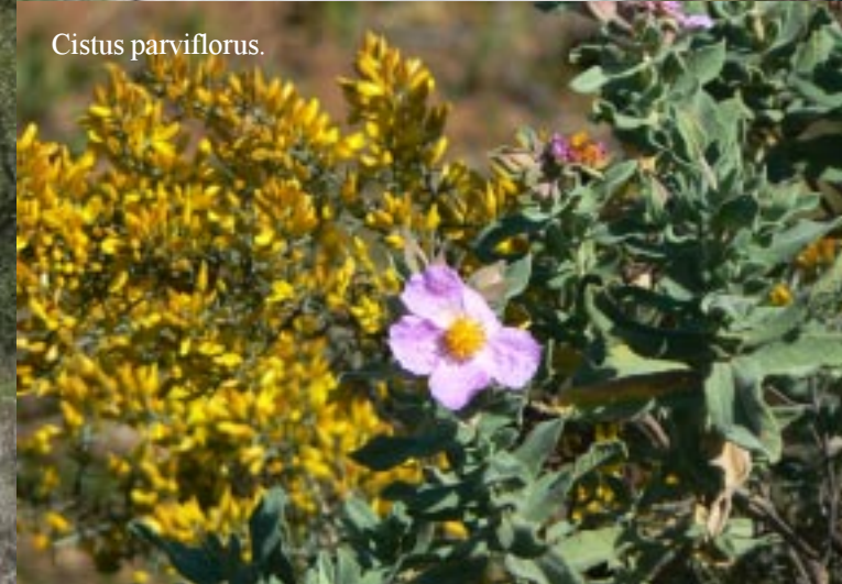
Cistus parviflorus .