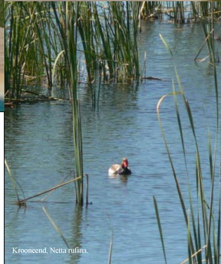
Kroonced, Netta rufina .