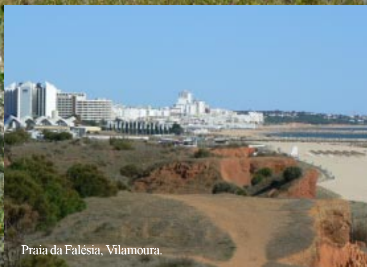
Praia da Falésia, Vilamoura.