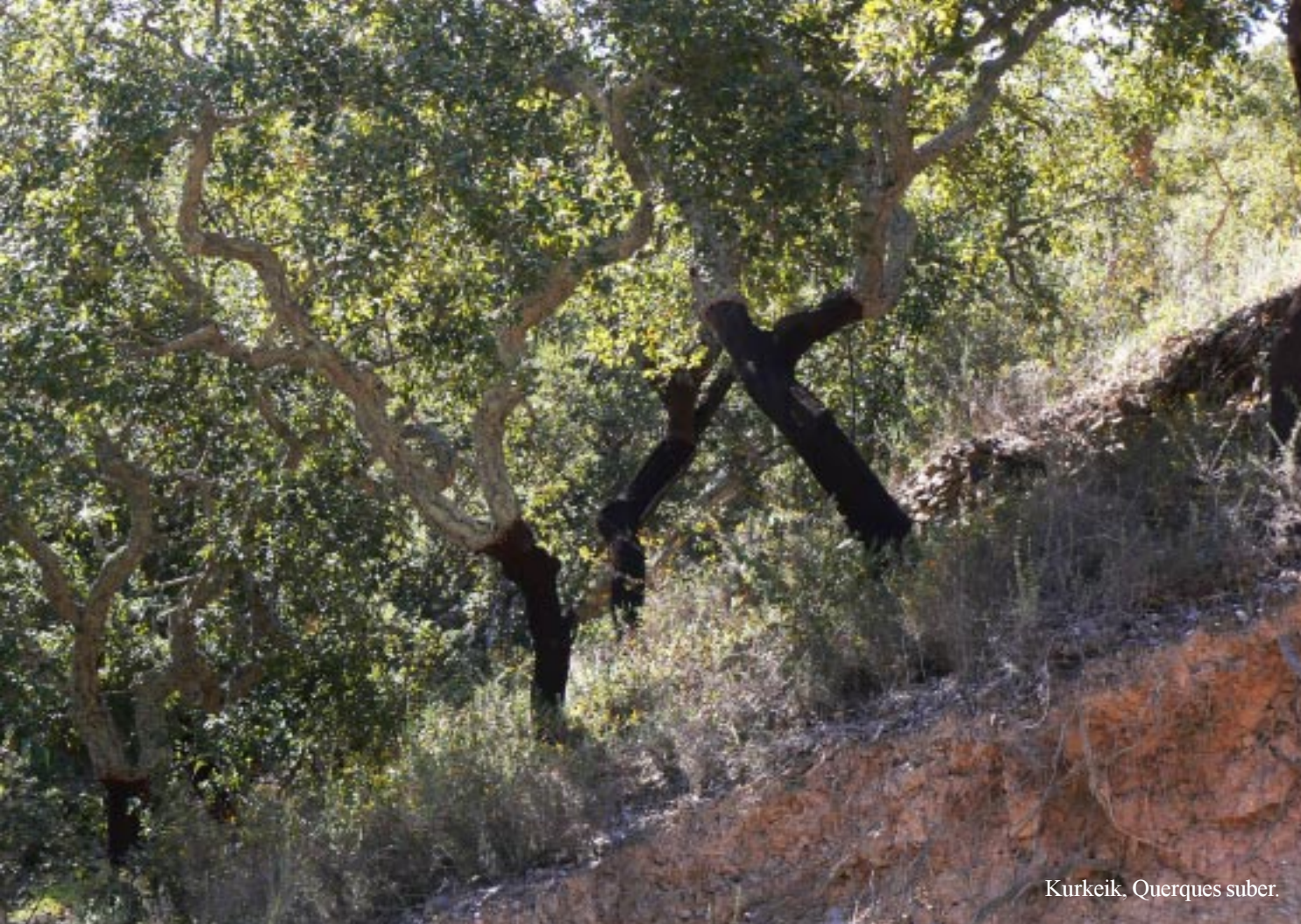
Kürkeik, Quercus suber .