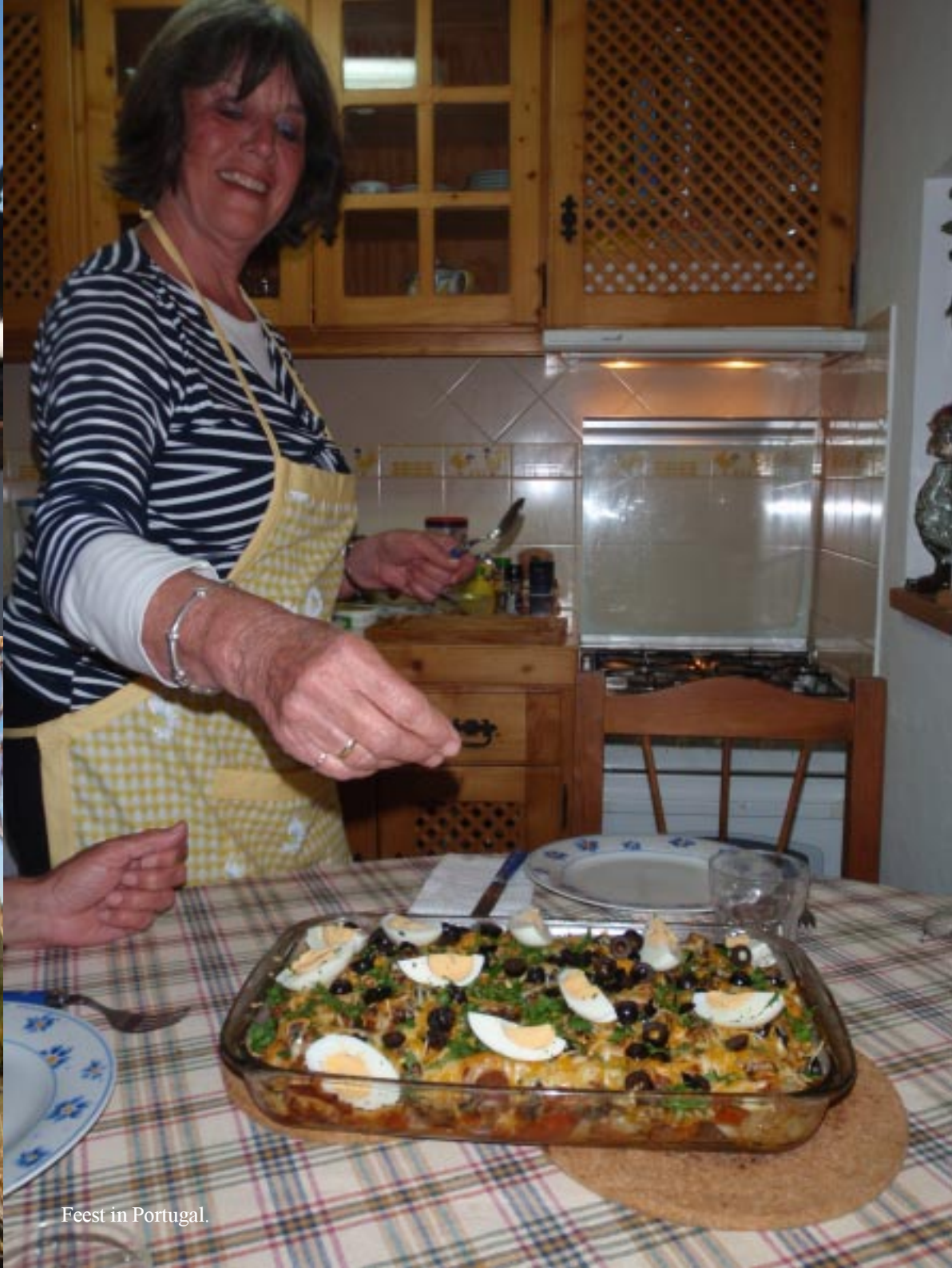
Fiest in Portugal.