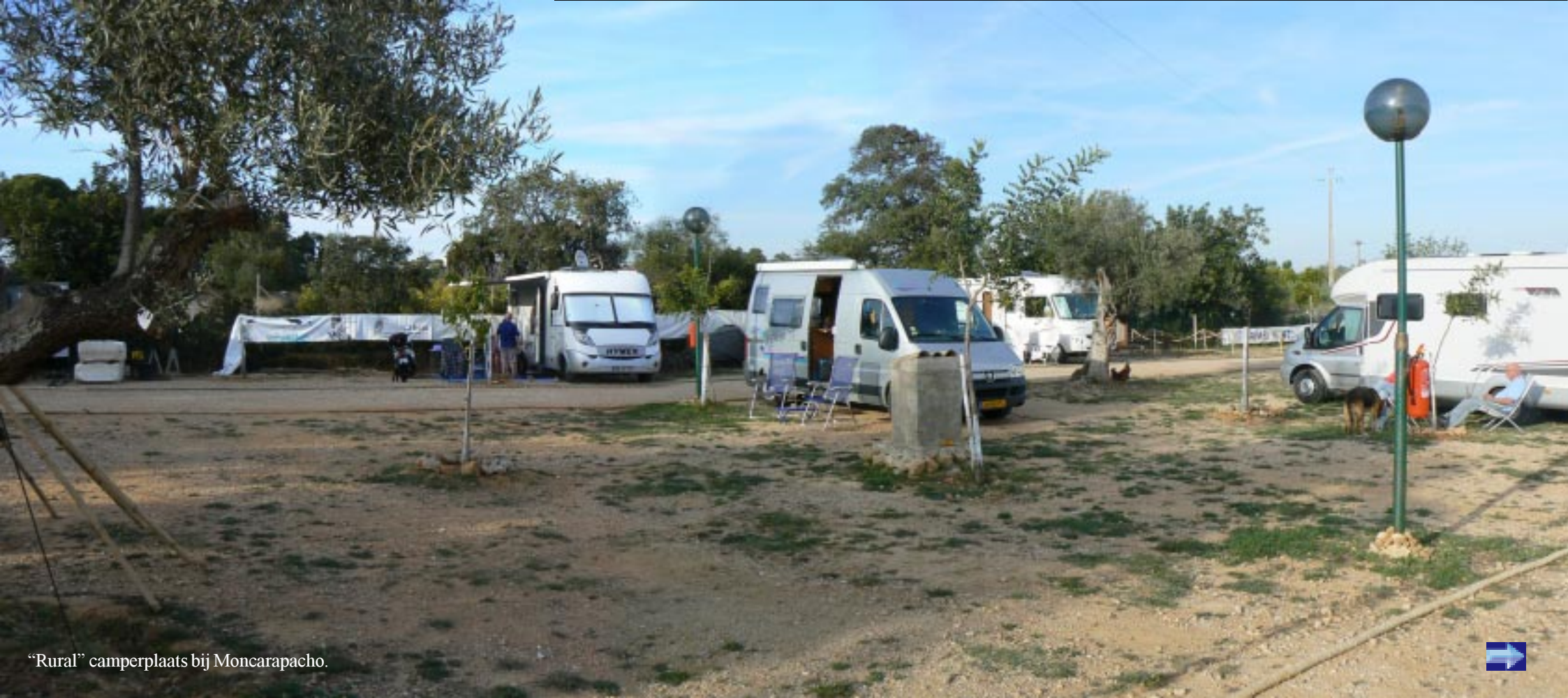
“Rural” camperplaats bij Moncarapacho.