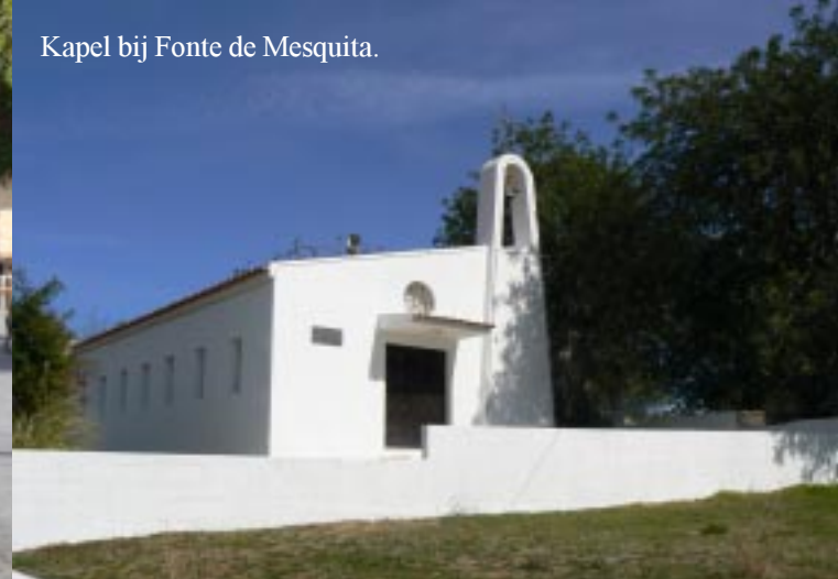
Kapel bij Fonte de Mesquita.