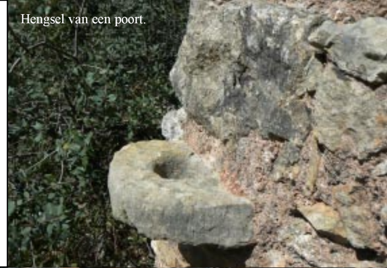
Hengsel van een poort.

Het gaat opnieuw omlaag naar een weggetje door dat dal. Nu eerst steil heuvel op en links het dal in. Her en der zijun oude staaltjes van watertechniek te zien in de vorm van oerdegelijke putten en mechanismes om het water omhoog te halen. Wel zijn de ijzeren onderdelen steevast compleet verroest.