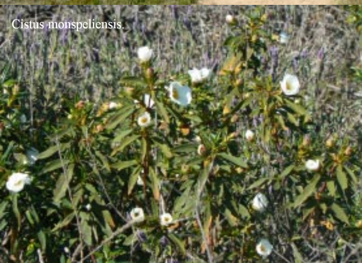
Cistus monspeliensis .