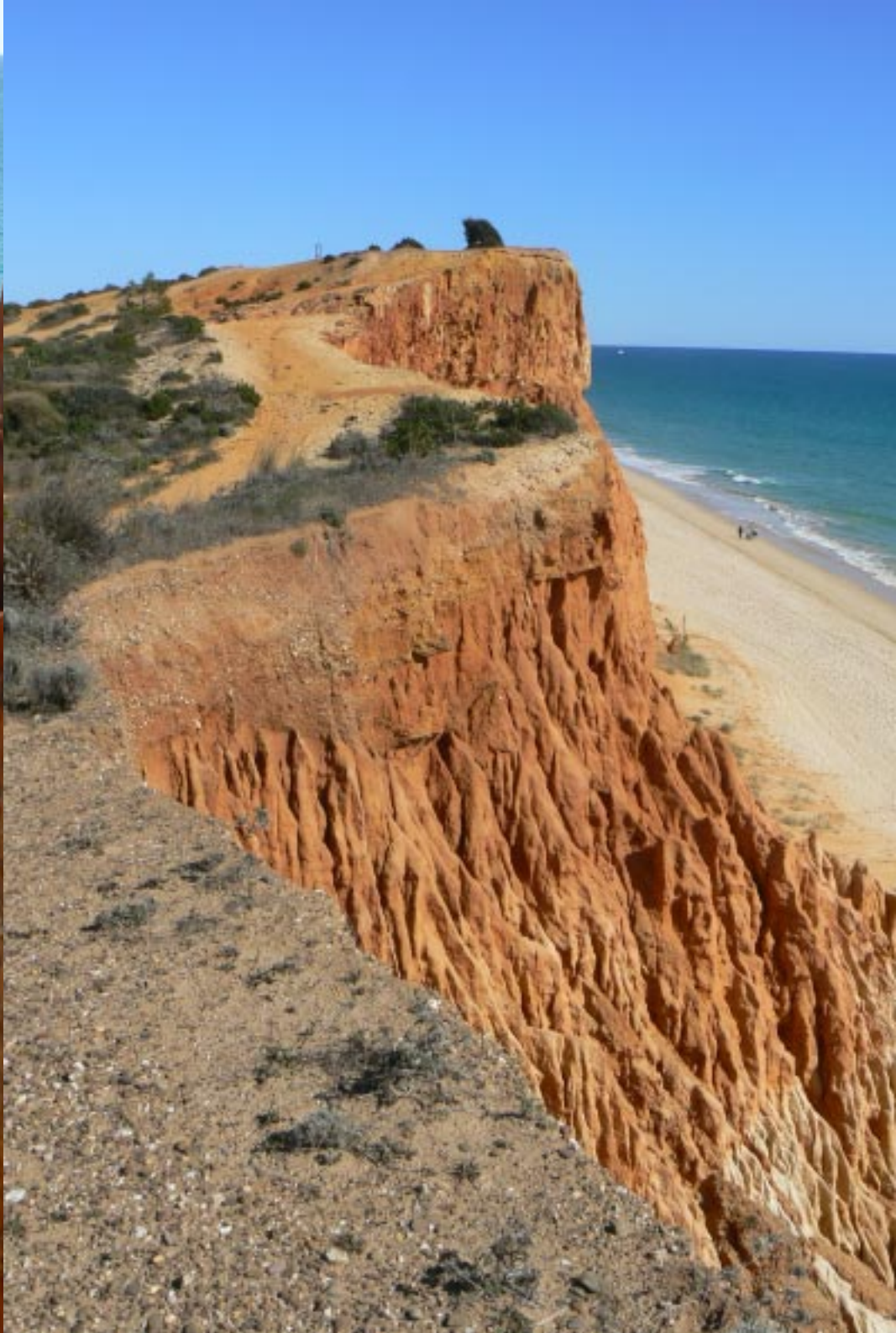
Praia da Falésia, Vilamoura.