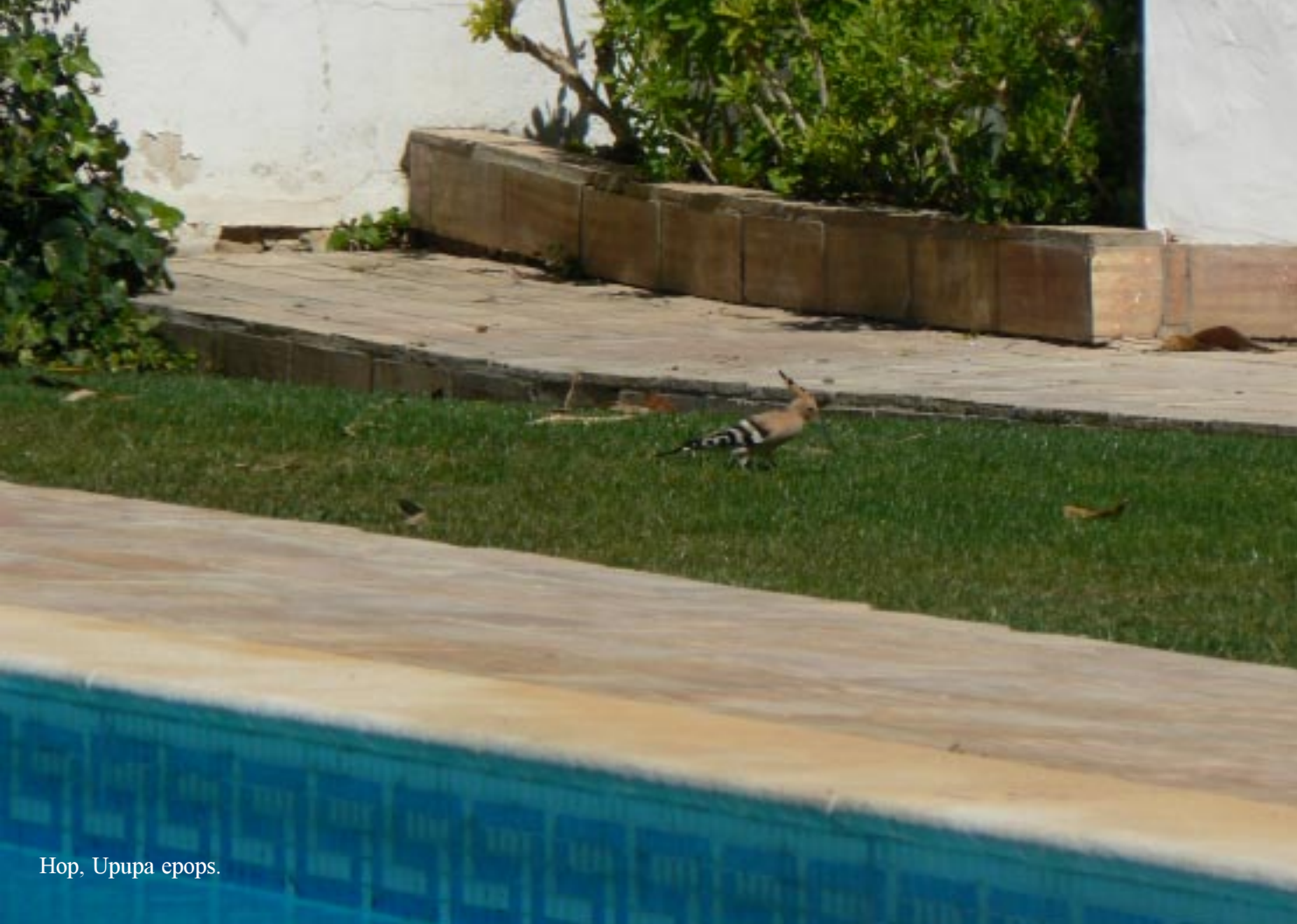
Hop, Upupa epops .