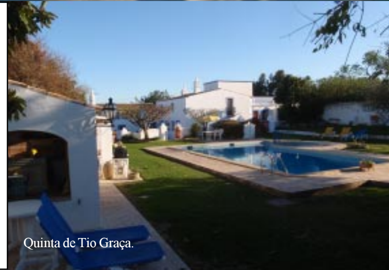
Quinta de Tio Graça.

Daar babbelen aan het zwembad en als het frisser wordt in het barretje met wijn, cake, toastjes serrano-ham, kaasjes enz. Daarbij zijn ook het Nederlandse stel, dat nu naast hen het appartement heeft, op visite. Zo wordt het laat voor wij vieren naar binnen gaan voor het avondeten. Om 21.55 kunnen we aan die heerlijke ovenschotel beginnen. Zo wordt het twaalf uur voor we na de afwas onder zeil gaan.