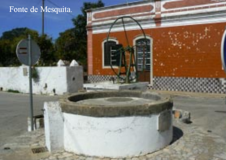
Fonte de Mesquita.

11.55 zijn we in bij de Fonte de Mesquita en beginnen we aan de wandeling blz 47: Caminhos e encruzilhada de ir à fonte. De start ligt bij de Fonte (en wasplaats) da Mesquita. Links aan het oostelijke zijstraatje gaat een keienpad tussen muurtjes heuvel op om daar een eerste straatje over te steken.