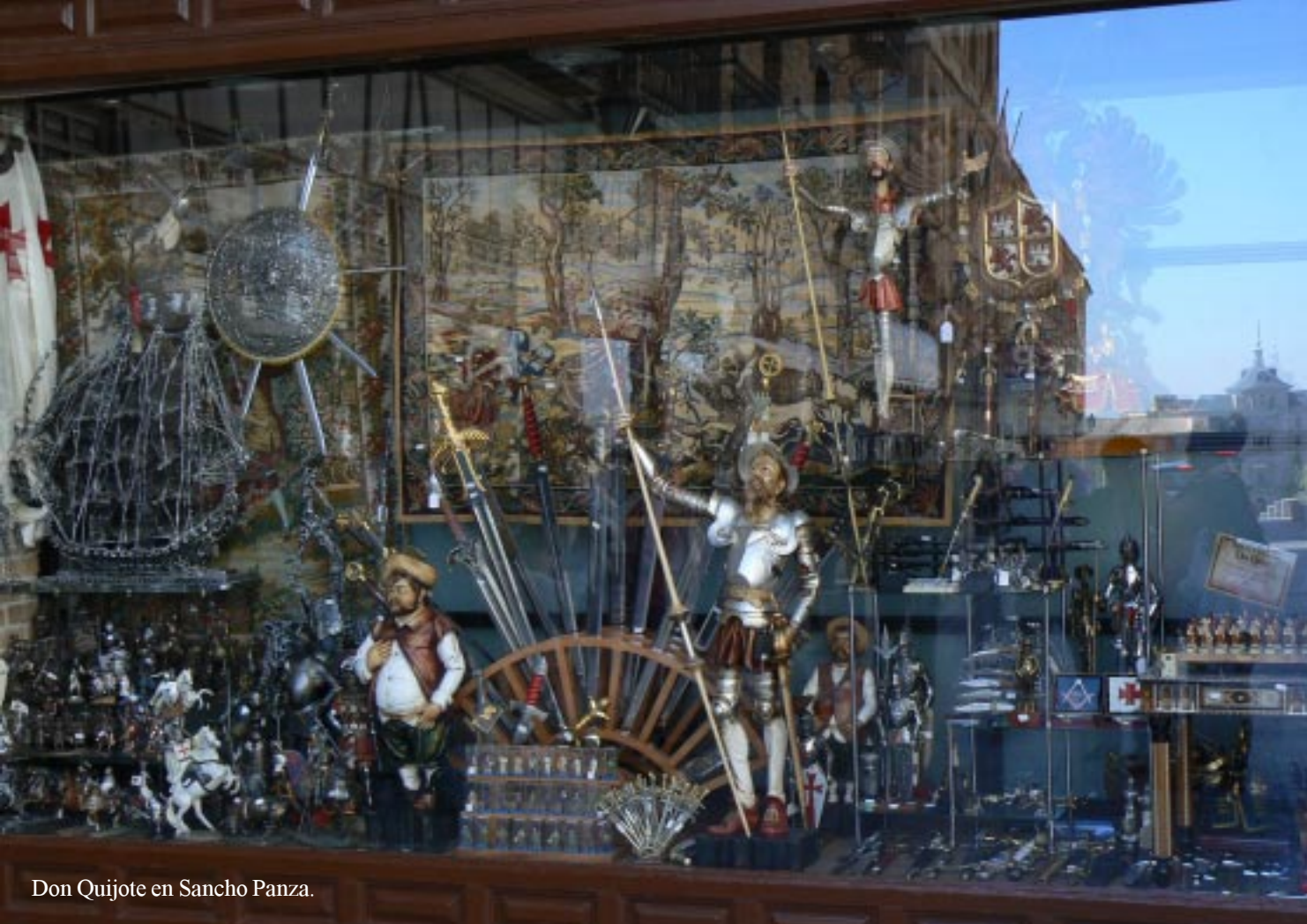
Don Quijote en Sancho Panza.