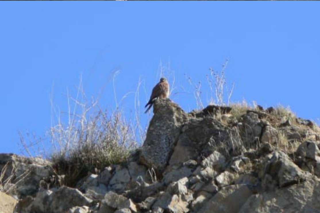
Torenvalk, Falco tinnunculus .

We zijn er pas laat uit. Tineke ziet twee Torenvalken op de helling boven ons. Met 6498 km achter de rug vertrekken we om 11.35.