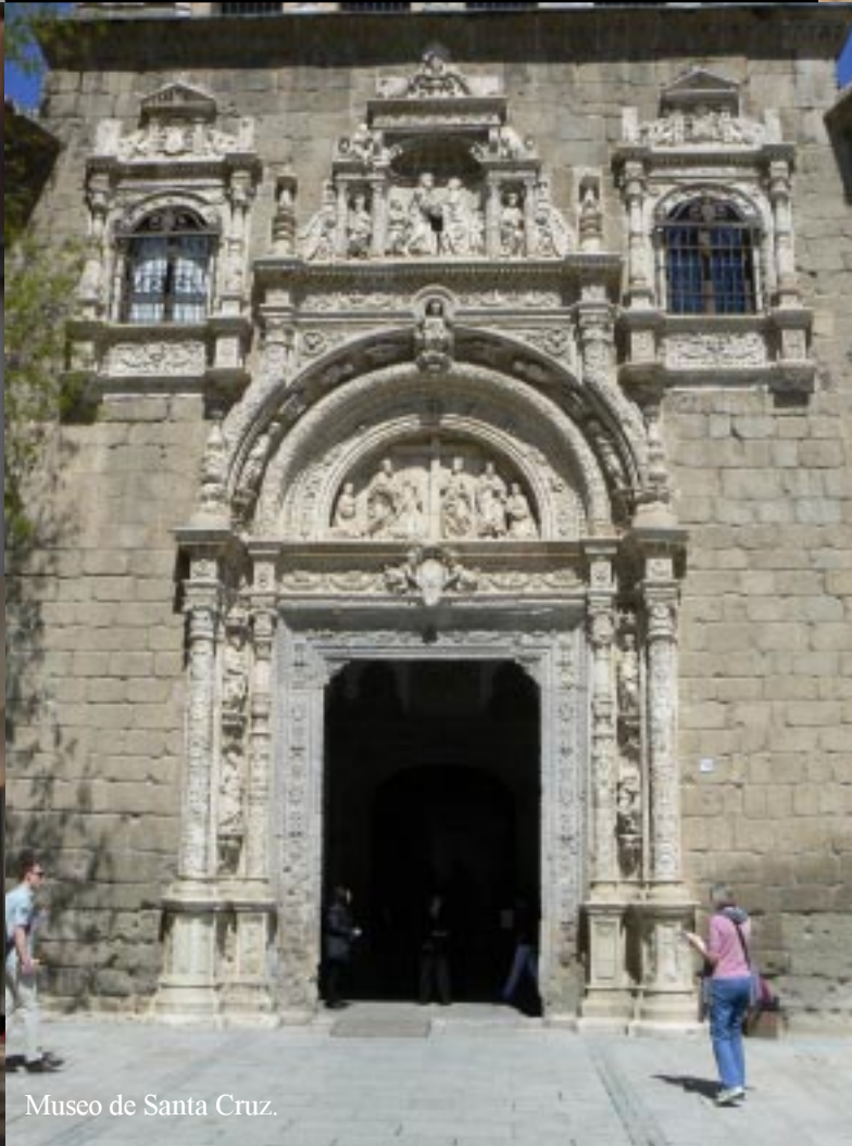
Museo de Santa Cruz.