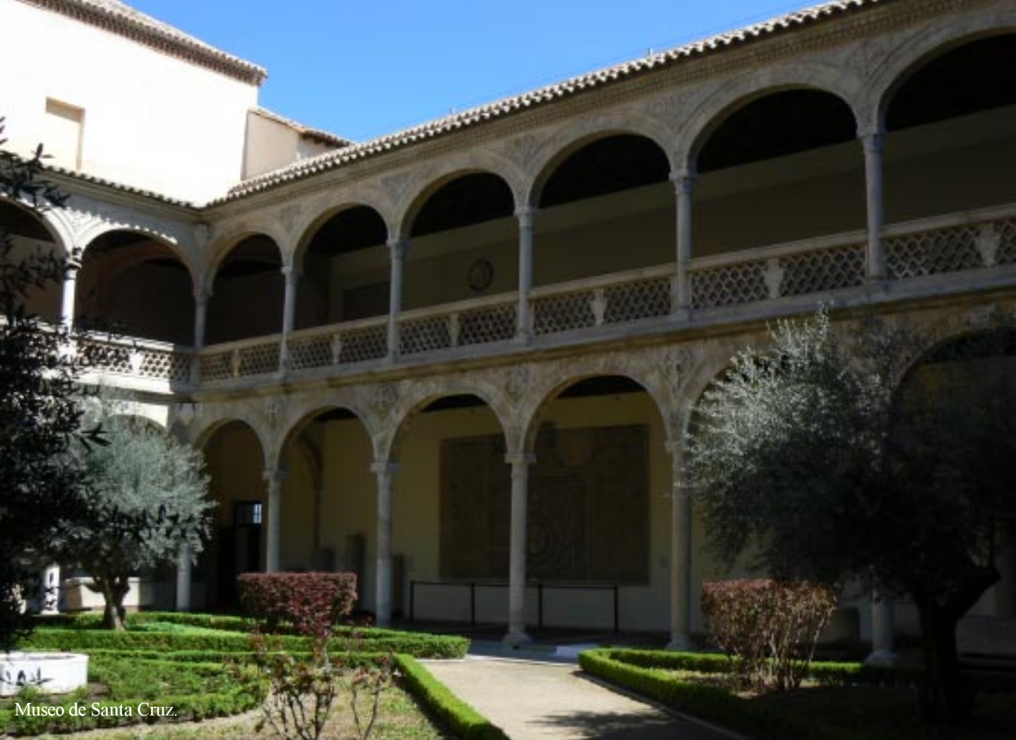
Museo de Santa Cruz.