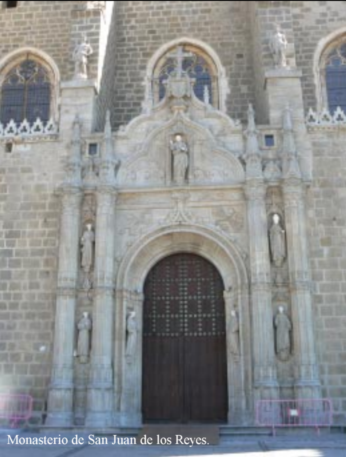
Monasterio de San Juan de los Reyes.

Om 15.55 bereiken we het Monasterio de San Juan de los Reyes, het meest westelijke punt van deze wandeling.