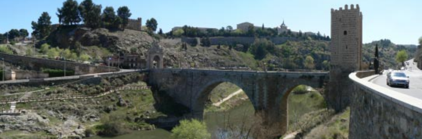
Puente de Alcántara.