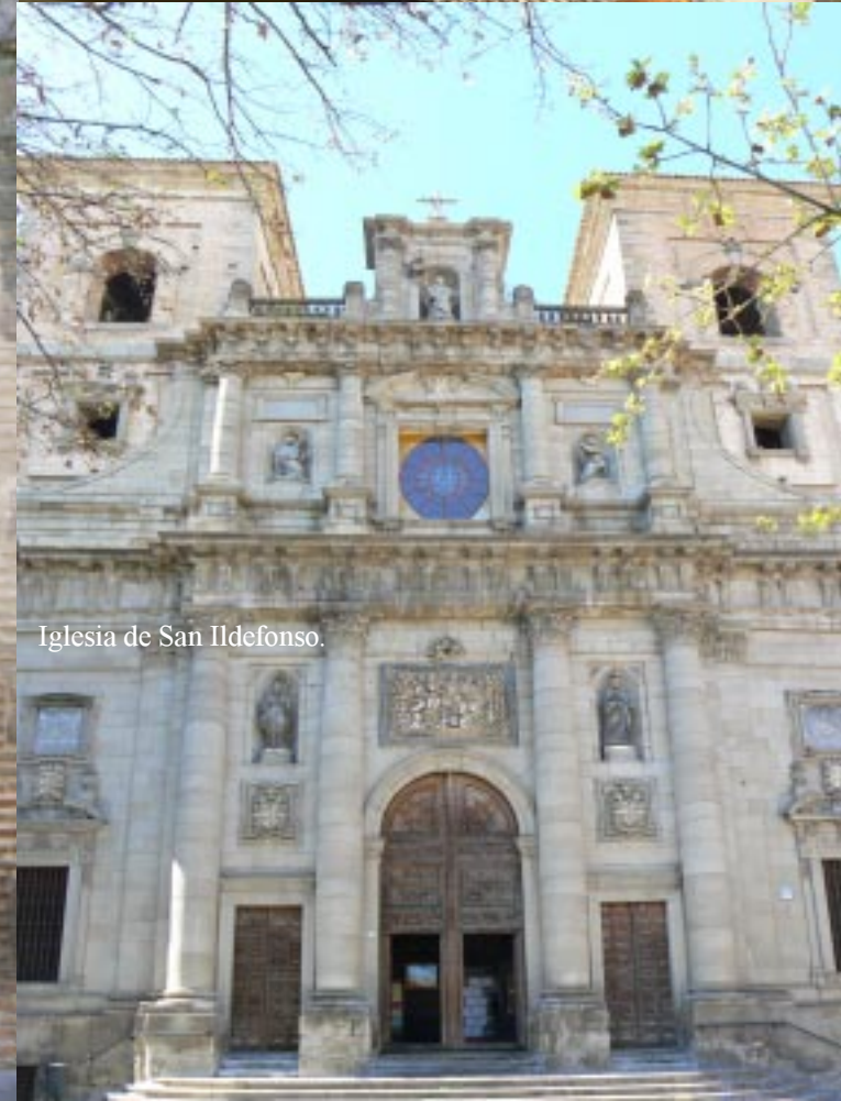
Iglesia de San Ildefonso.