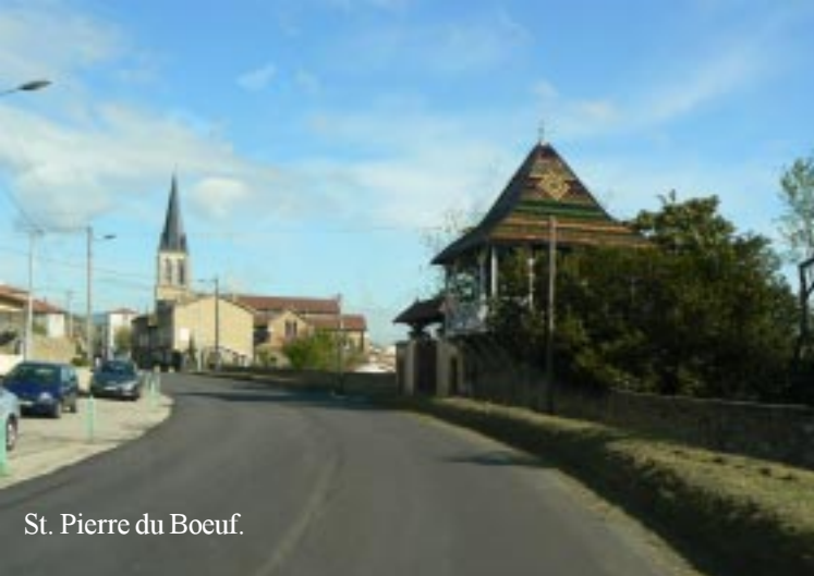
St. Pierre du Boeuf.