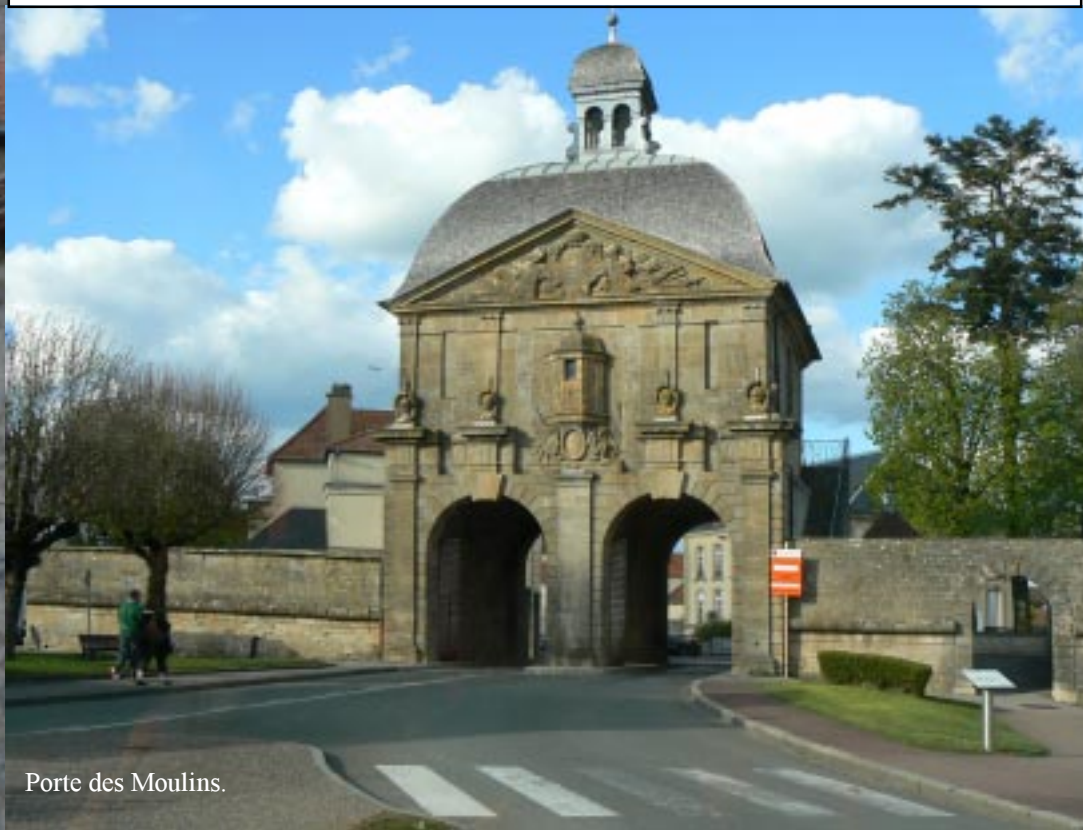
Porte des Moulins.