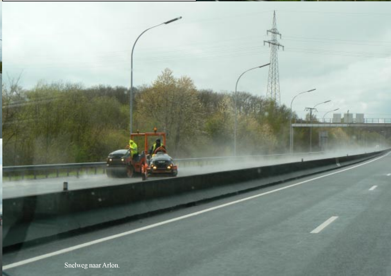
Snelweg naar Arlon.