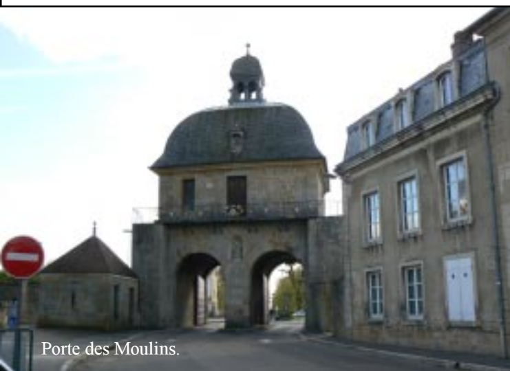
Porte des Moulins.