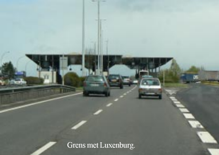
Grens met Luxemburg.

Even later voor de zoveelste keer de Moselle over. 12.30 weer de Moezel bij Thionville, vlak voor de Luxemburgse grens. We tanken 40 l in Bettenbourg à •1,277/l bij Q8. We lunchen op Aire Capellen tot 13.40. Dan gaat het via Arlon de Ardennen in. De andere weghelft is geblokkeerd door zeer uitgebreide wegwerkzaamheden, hetgeen een 4 km lange file tot gevolg heeft.