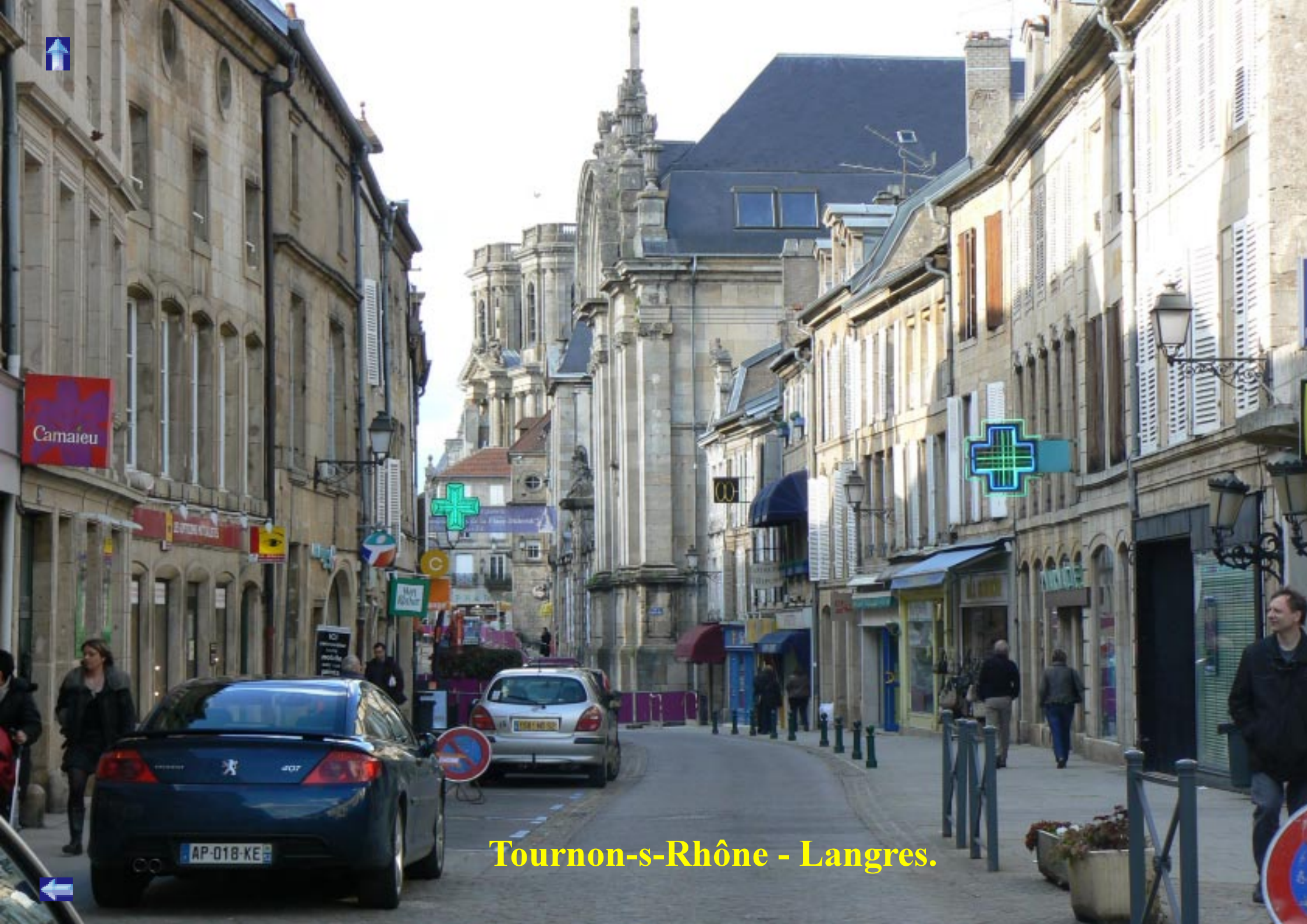
Tournon-s-Rhône - Langres.