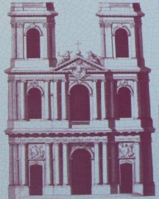
• Projet d'élevation du portail de la cathédrale Saint-Mammès •

In 1768 the imposing neo-classic facade is made up of two towers flanking a forward central body superimposed by a pediment. Two monumental statues representing the Synagogue (on the left) and the Church (on the right) crown the pediment. The three levels are articulated by other orders or pilasters of the respective orders, Doric, Ionic and Corinthian. During the revolution other features of the decor had their initial meaning changed. Thus, above the north door (to the left), the mitre and crosier (the bishop's cross staff) were transformed respectively into a Phrygian cap (a symbol typical of the Revolution), and a fasces (a symbol for a roman consul) weapon.