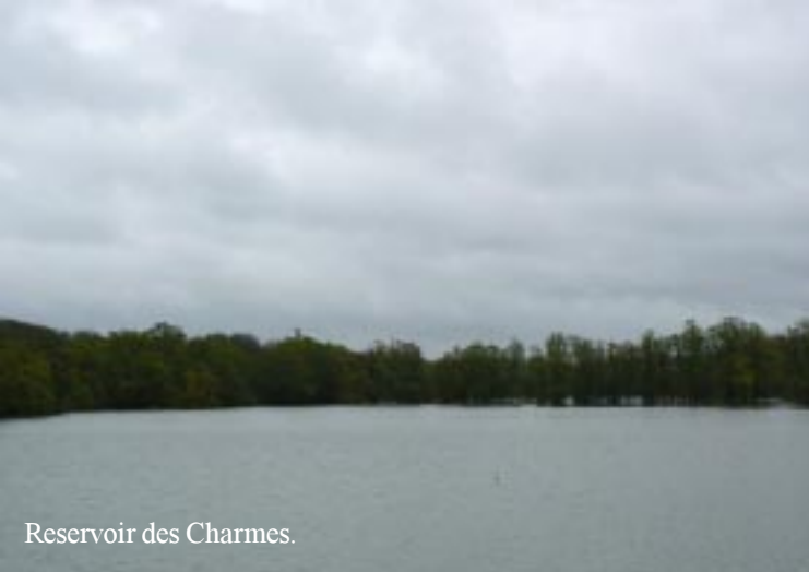
Reservoir des Charmes.

21-04-'12. Langres (F) - Waalre (NL). Om 9.20 (8426 km) vertrekken we uit Langres onder een bewolkte lucht. Het eerstvolgende dorp is het zeer nette Bannes met boompjes langs de weg met Fats Domino-kapsel. 9.30 Reservoir de Charmes. Het is vies grijs en miezert. Frécourt is zo klein dat alles in één plaatje te vatten is. Ville de Clefmont met huizen op de heuvelkam geplakt. We zien hier alleen weiden en bossen op kort heuvellandschap. De gehuchten zijn zeer klein en zien eruit alsof het leven nagenoeg foetsie is. Bazoilles-s-Meusse (10.20) de Maas is hier nog op Dommel formaat.