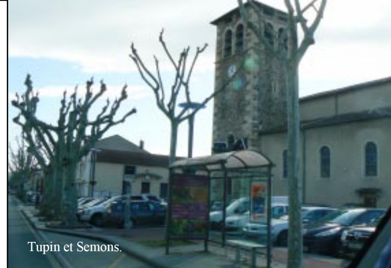
Tupin et Semons.

Tupin et Semons 10.05. Via Condrieu naar Givors (oude hoogovens net voor de stad) en de LIDL(10.30). Geen brood of pinda's wel Yoghurt. In Givors zelf zit het verkeer vast. We nemen de omweg in km's over de A46-N346 om oost-Lyon heen. Dat schiet beter op ondanks het drukke verkeer. Tot voorbij Villefranche-s-Saône nemen we de péage. Bij Belleville er weer af na betaling van •4,50 voor die 42 km! We tanken 60,57 l bij een Carré Four in Mâcon à •1,404/l. (12.10) In het centrum van Mâcon stoppen we aan de Saône om te eten en te drinken, 12.30.