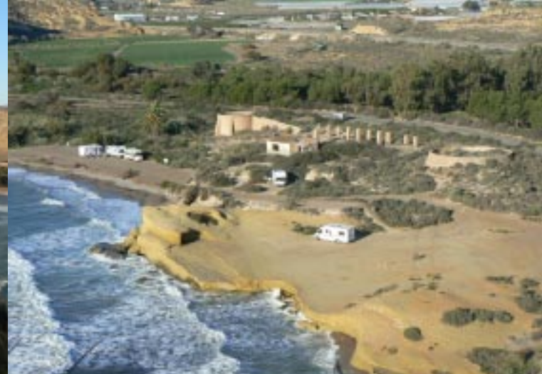
Andalucia begint met een mooie kust.