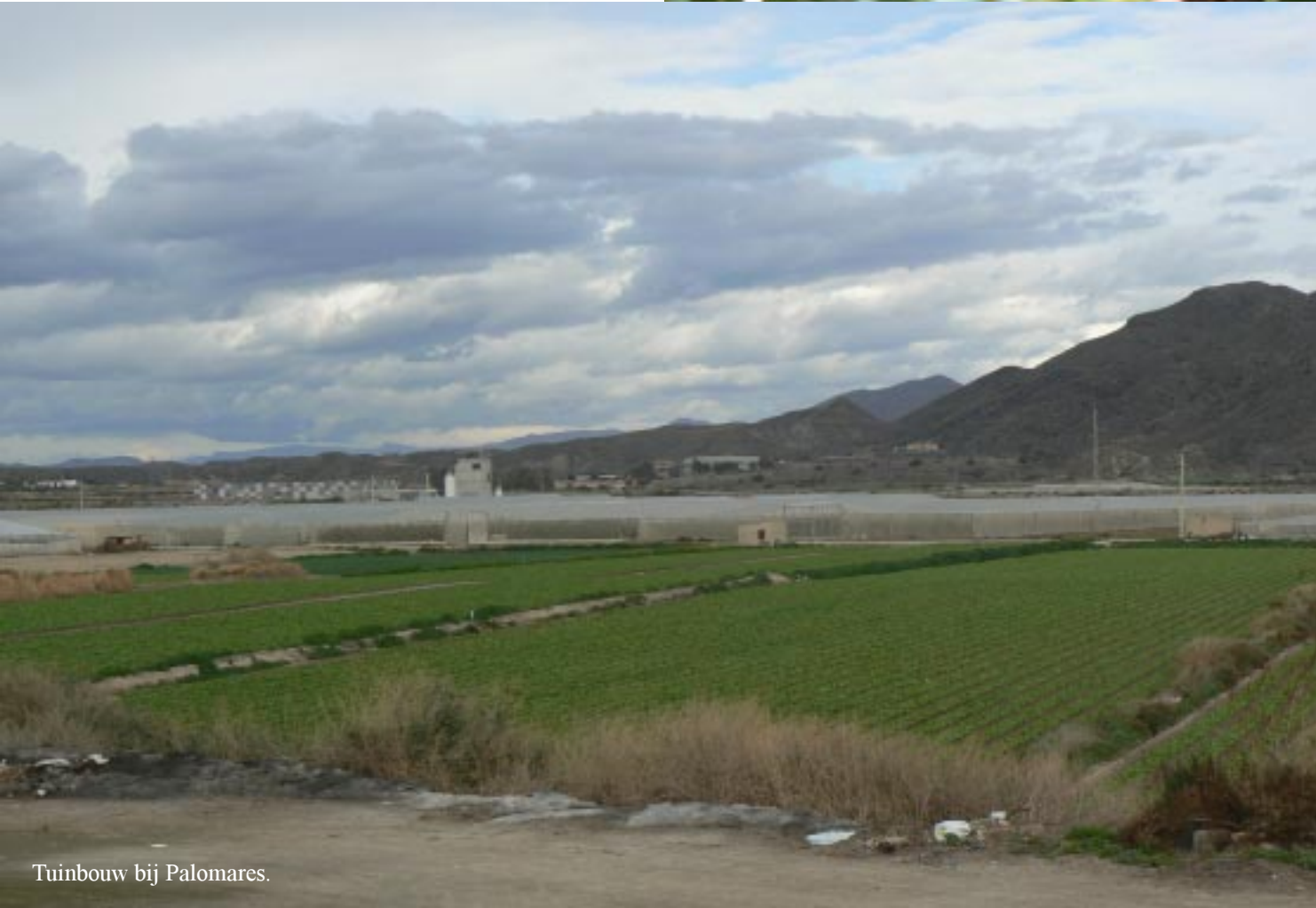
Tuinbouw bij Palomares.