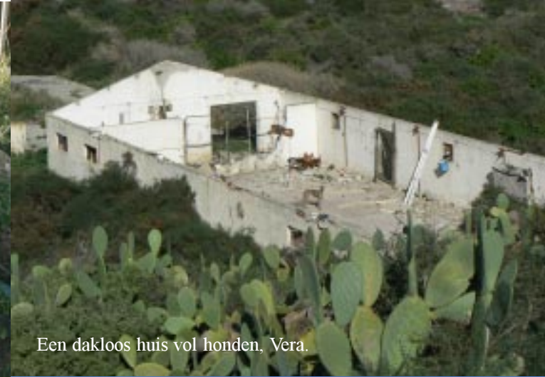
Een dakloos huis vol honden, Vera.