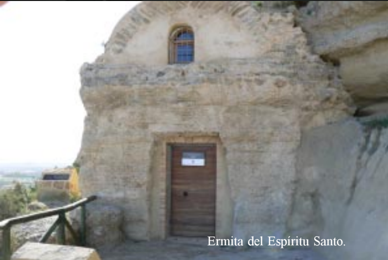
Ermita del Espíritu Santo.