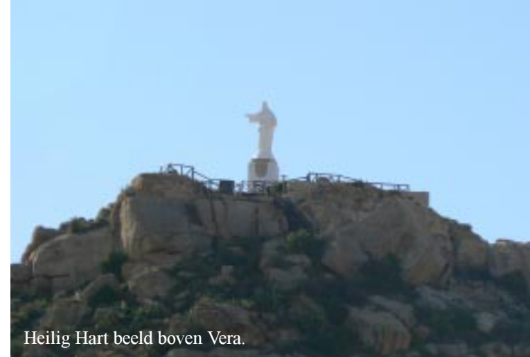
Heilig Hart beeld boven Vera.

We rijden voor we doorgaan naar die heuvel met het Heilig Hartbeeld erop. Daar vinden we de 1e cache van vandaag.