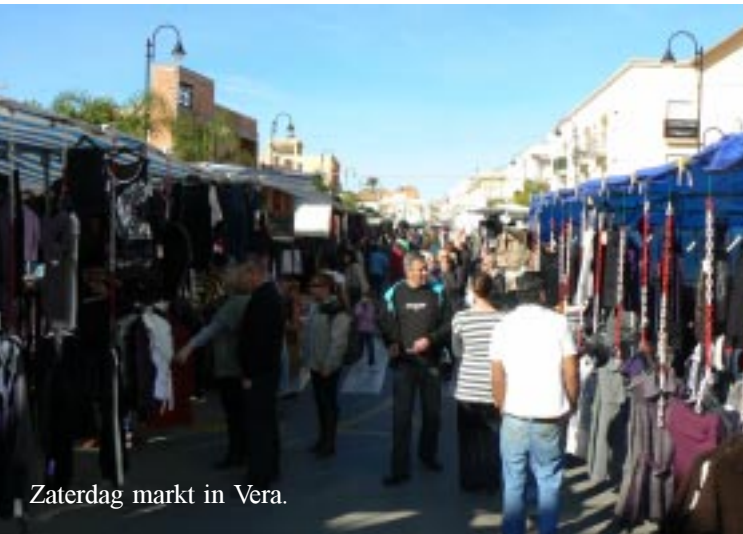
Zaterdag markt in Vera.