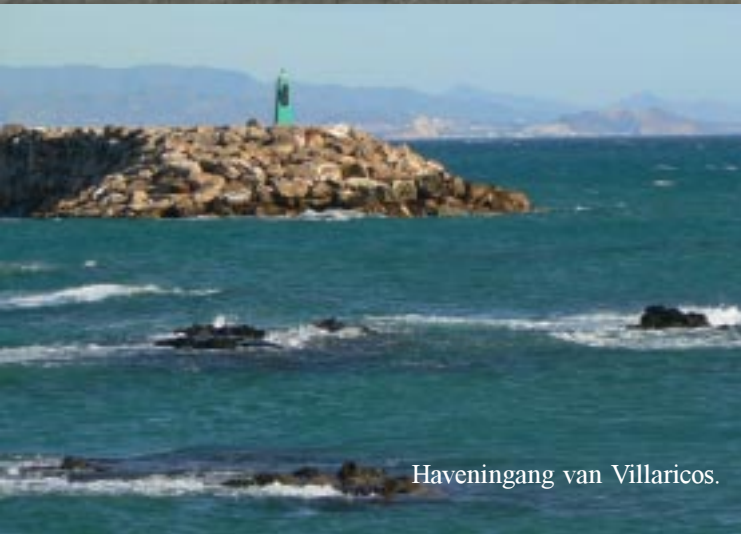
Haveningang van Villaricos.