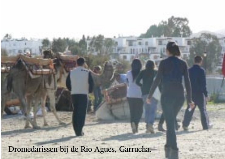
Dromedarissen bij de Rio Agues, Garrucha.