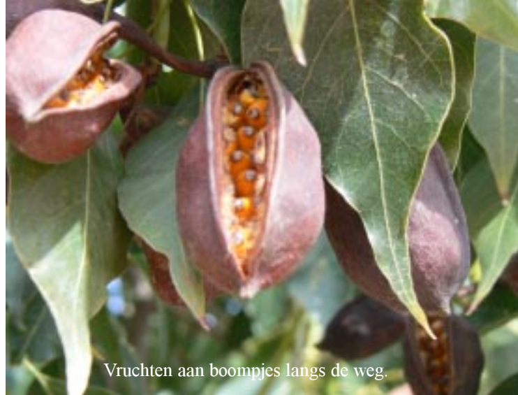
Vruchten aan boompjes langs de weg.

Mensen op de camping zijn druk bezig met de komende avond. Engelsen hebben een gezamenlijk etentje gepland. Iedereen wordt geacht zelf zijn eigen eten en drinken mee te nemen met wat extra, dat dan tot één groot buffet verzameld wordt. We worden gevraagd om te tolken tussen een Engelsman en een Fransman over deze party. Tineke kan nog iets van wat de Fransman vertelt maken, voor mij is dit het summum van koeterwaals.