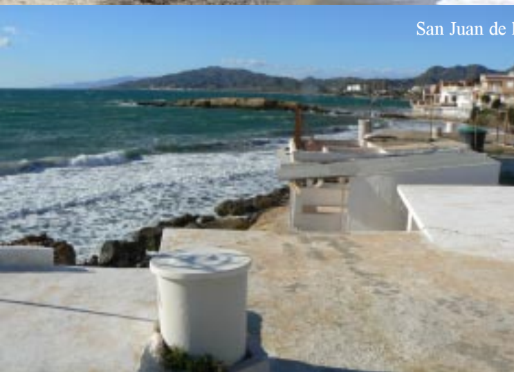
San Juan de los Terreros.