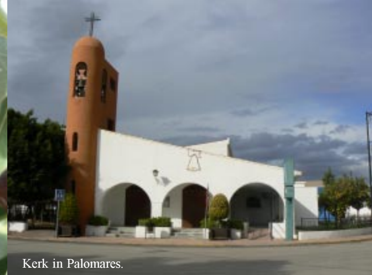
Kerk in Palomares.