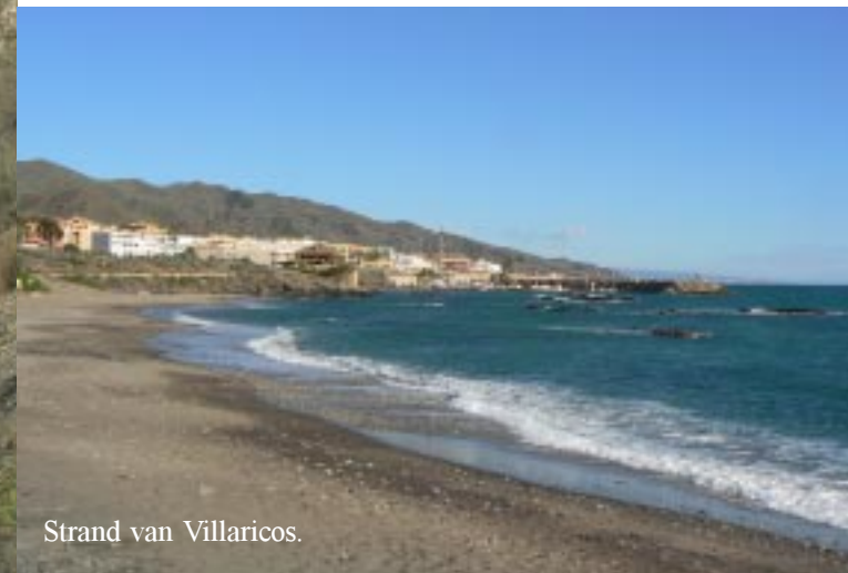
Strand van Villaricos.

Op gegeven moment geeft de thermometer (in de zon) 40+ aan! Tegen die tijd hebben we uiteraard de korte broeken aan.