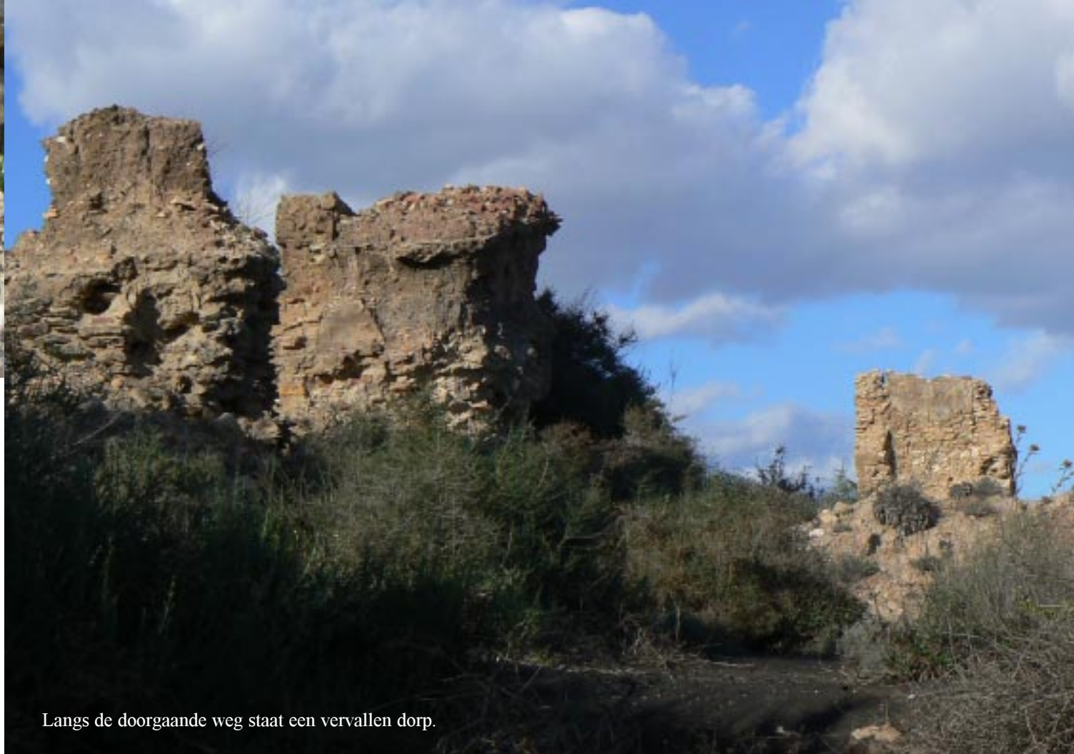
Langs de doorgaande weg staat een vervallen dorp.

Onderweg zijn nog enige vogels te zien: koereigers en kleine gelige vogeltjes (cirlgors?). Vlak voor de rotonde bij de camping is een grootschalig wegen- en waterbouwproject aan de gang. Daar zijn ook de ruïnes van een oud dorp te zien. Thuis dobbelen en scrabbelen we. Badminton zit er bij deze wind nog steeds niet in.