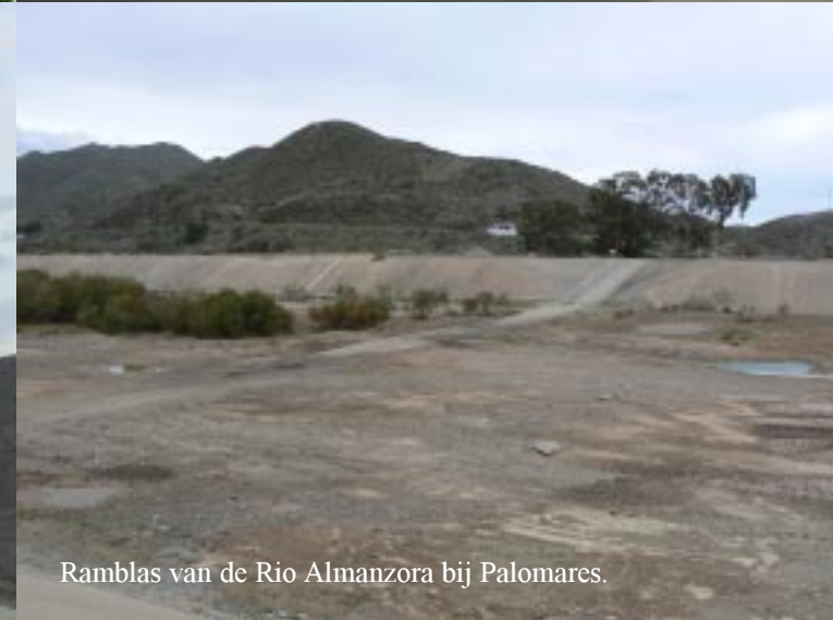
Ramblas van de Rio Almanzora bij Palomares.

Pas om kwart voor twee lopen we een rondje door het niet bijzondere dorp Palomares en dan langs de plantenkassen naar de ramblas van de Rio Almanzora. Daar zien we waar de MIO ons gisteren door wilde sturen!