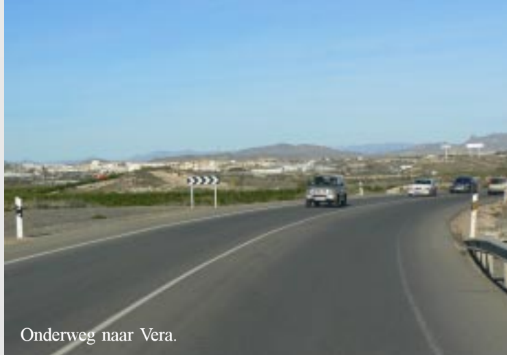
Onderweg naar Vera.

Eindelijk een die een uitgebreid aanbod heeft. Het is er dan ook aardig druk.