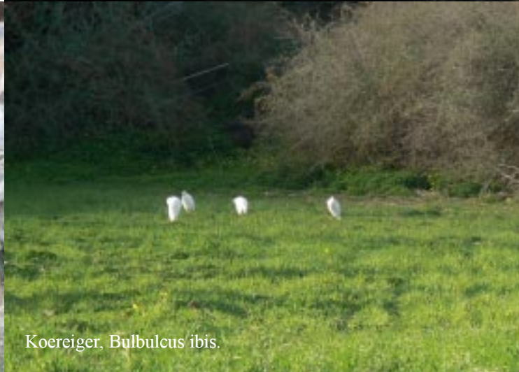
Koereiger, Bulbulcus ibis .