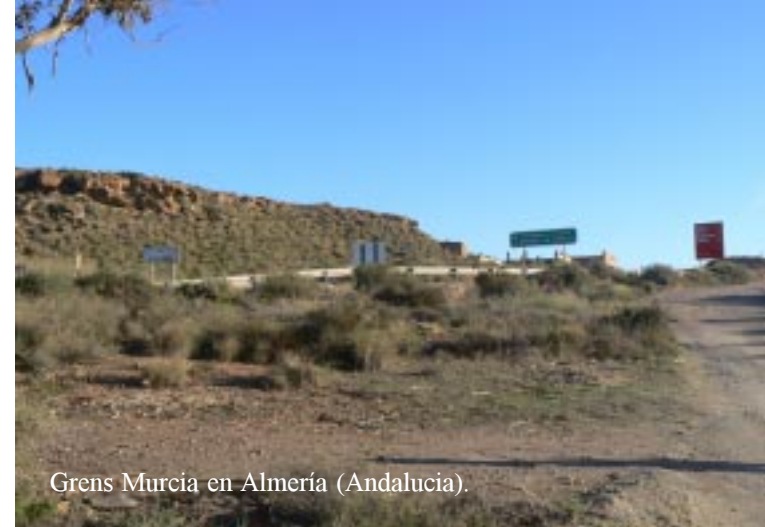
Grens Murcia en Almería (Andalucia).

We kijken er even rond, maar de zeer slechte toegangsweg lijkt ons niet best voor Zippy.