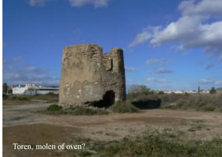
Toren, molen of oven?

We sturen de nieuwjaarswens via E-mail op en zitten geregeld in de zon te lezen.