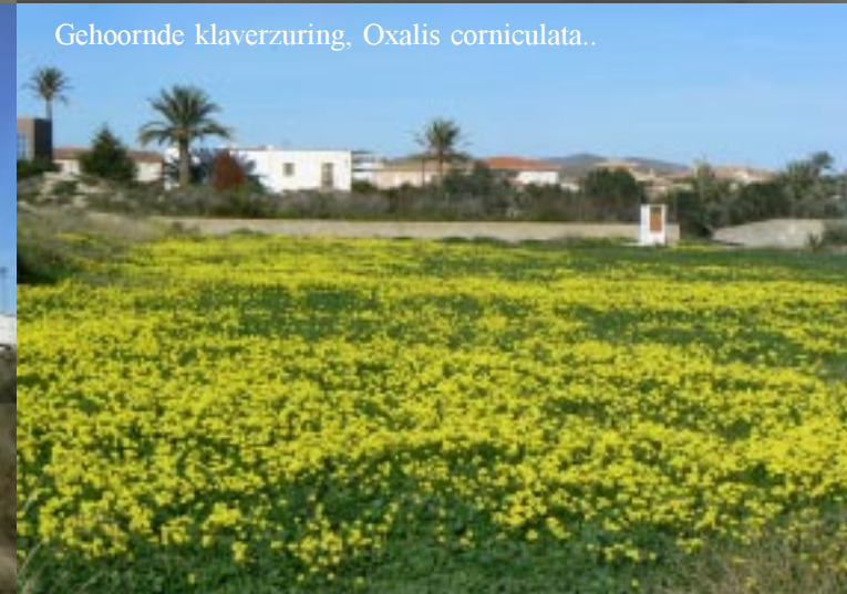
Gehoornde klaverzuring, Oxalis corniculata ..