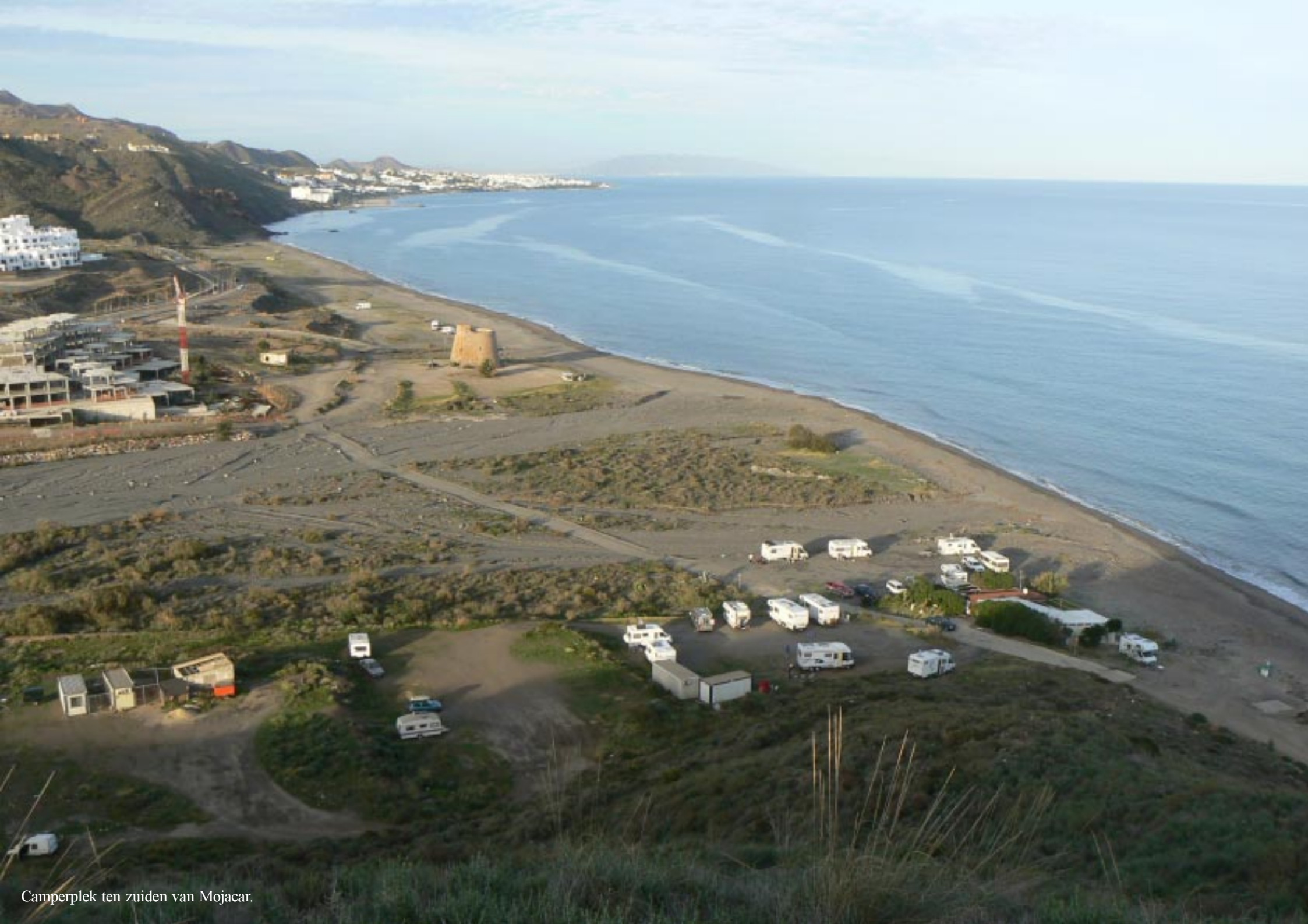
Camperplek ten zuiden van Mojacar.