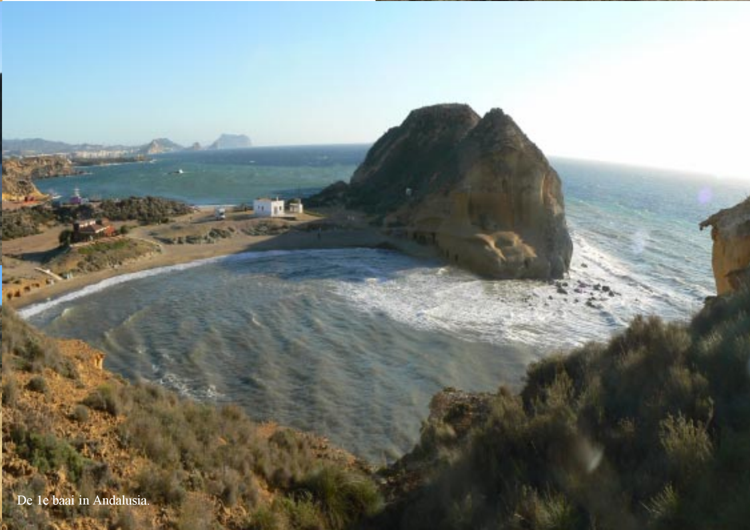
De 1e baai in Andalucia.