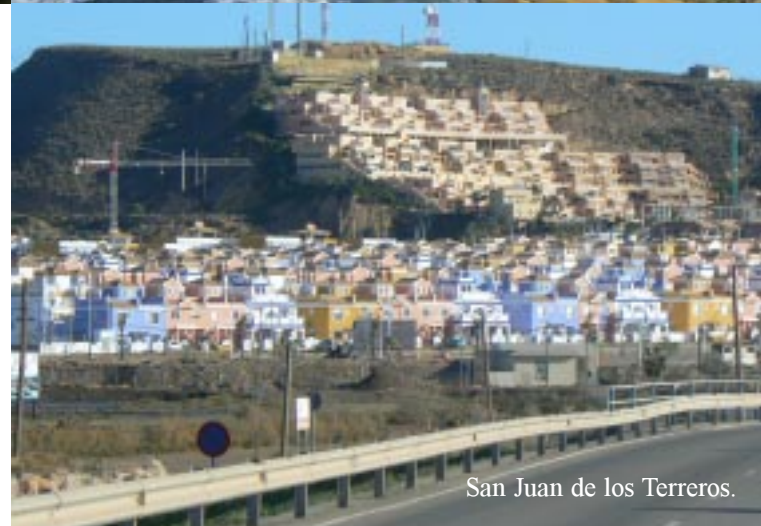
San Juan de los Terreros.

Er staat een groot bord dat kamperen verboden is! Tegen elf uur rijden we het stukje door naar San Juan de los Terreros. Her en der langs deze kust staan campers op kleine plateaus. San Juan bouwt rechts van de weg een groot complex met zeer kleurrijke huisjes. Links in het stadje zien we een aantal vakantiehuisjes (eigenlijk meer stenen hutjes) met de voeten tegen de zee aan staan. Als het mooi rustig weer is, beslist een prachtig plekje. De twee campers hier staan er met uitgestalde zonnecellen, generator en de was buiten. Die zijn hier voorlopig nog wel. Om half twaalf rijden we via een mooie bergweg door de Sierra Almagrera, die tegen de kust aan ligt. De vakantie-stadjes onderweg zien er niet interessant uit.