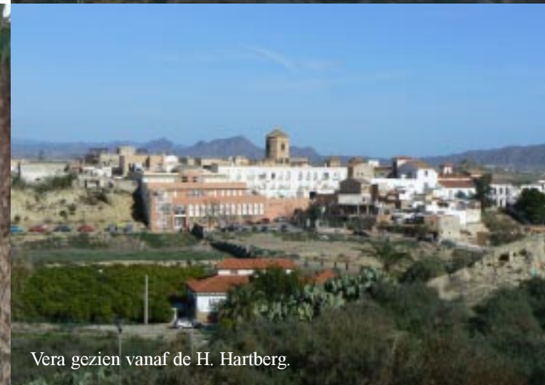
Vera gezien vanaf de H. Hartberg.