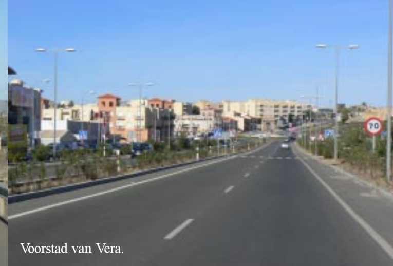
Voorstad van Vera.