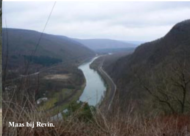
Maas bij Revin.