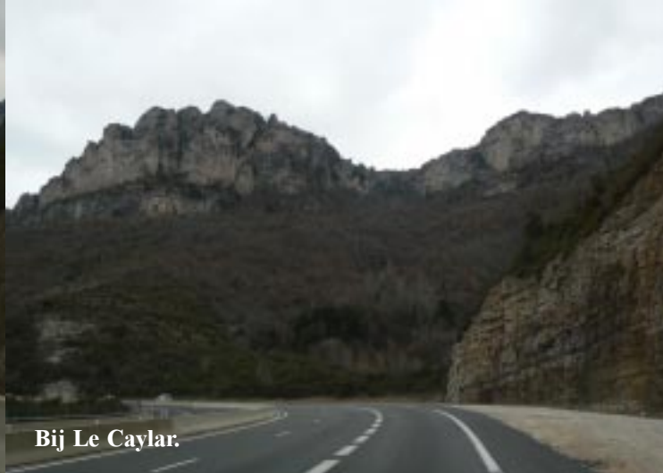
Bij Le Caylar.