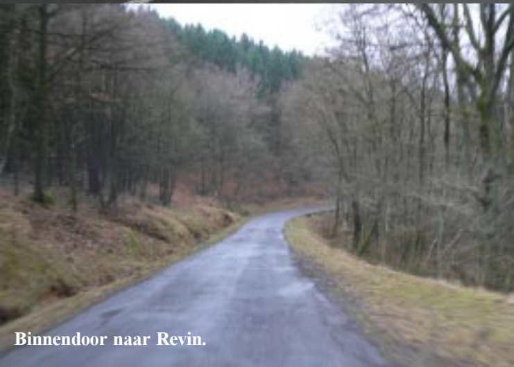
Binnendoor naar Revin.