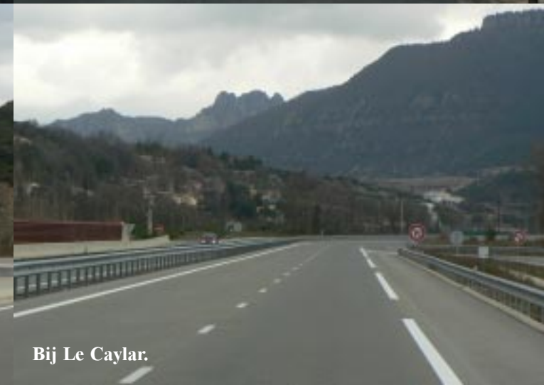
Bij Le Caylar.