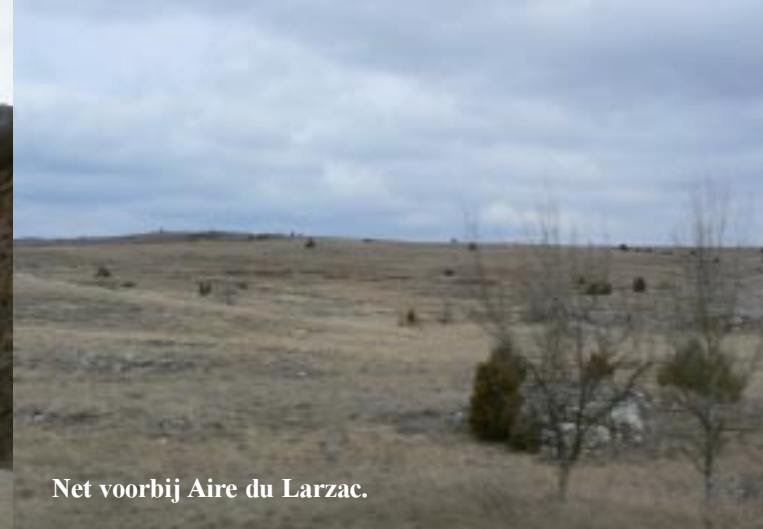
Net voorbij Aire du Larzac.