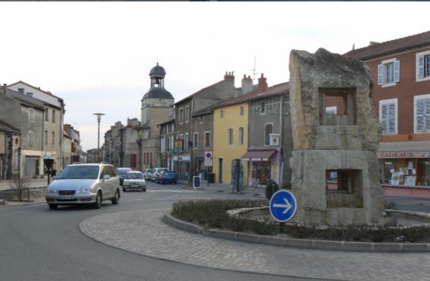
De doorgaande weg.

Aigueperse blijkt een vrij groot parkeerterrein te hebben, waar ook campers terecht kunnen. Uiteraard maken we direct na aankomst een rondje door het centrum. Een in wezen een heel aardig dorp met allerlei mooie en/of aparte gebouwen. Maar ook een dorp met veel leegstand, verwaarloosd uitziende gebouwen en zelfs krotwoningen.