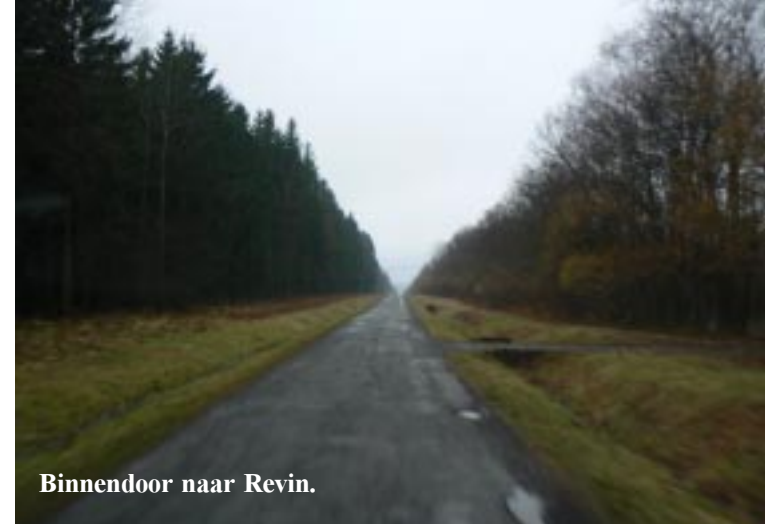
Binnendoor naar Revin.

Vandaag hebben we de laatste étape van deze reis: De 202 km naar huis. (Gisteravond had de MIO nog 272 km gezegd, maar dat was de "snelste" route over Luik en Maastricht! En die snelwegen ruilen wij graag in voor een 70 km kortere route.) Om 8 uur met 9118 km achter de rug rijden we gretig weg. Te gretig want we krijgen al snel een venijnig geel lampje te zien: brandstofalarm. We besluiten het eerste stuk naar Givet om te leiden naar Revin, omdat dat maar 10 km is. Wel 10 km over een erbarmelijk slecht hobbelpweggetje, dat zeer smal is. Wel door prachtige bossen. We moeten toch maar eens uitzoeken hoe groot de reserve is. Momenteel durven we geen extra risico te lopen. Uiteindelijk kunnen we via een uitermate steile afdaling het Maasdal inrijden.