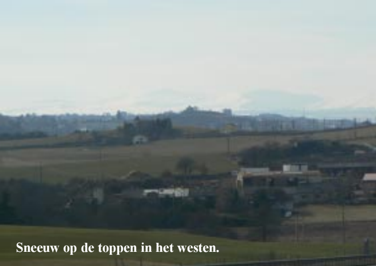
Sneeuw op de toppen in het westen.

Onderweg zien we nog de rode spoorbrug Viaduc de Garabit (16.10), een groot klooster op een berg bij Ribeyre en 8 km voor Clermont Ferrand een futuristisch uitzijende Grand Halle Zenith.