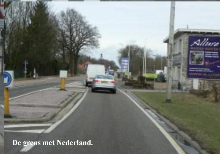
De grens met Nederland.