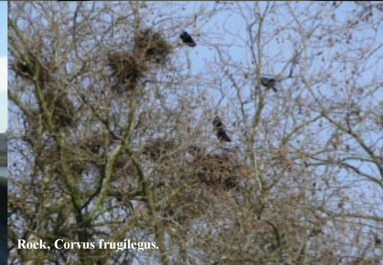
Roek, Corvus frugilegus .