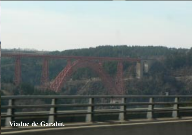
Viaduc de Garabit.