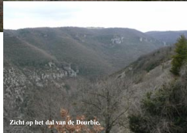
Zicht op het dal van de Dourbie.

Een voorbeeld daarvan is le Caylar een spectaculair hoefijzer-vormig dal net voor een tunnel die onder een pas door gaat. We pauzeren van 12.45 tot 13.20 op de Aire du Larzac. Even later komen we bij het panorama punt boven het stadje Millau bij de dalen van de Tarn en de Dourbie. Vooral het laatste dal heeft hoge steile kliffen.