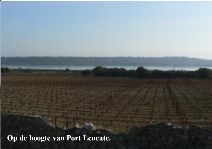
Op de hoogte van Port Leucate.