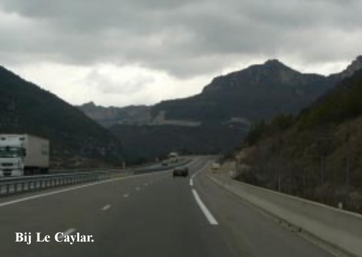
Bij Le Caylar.