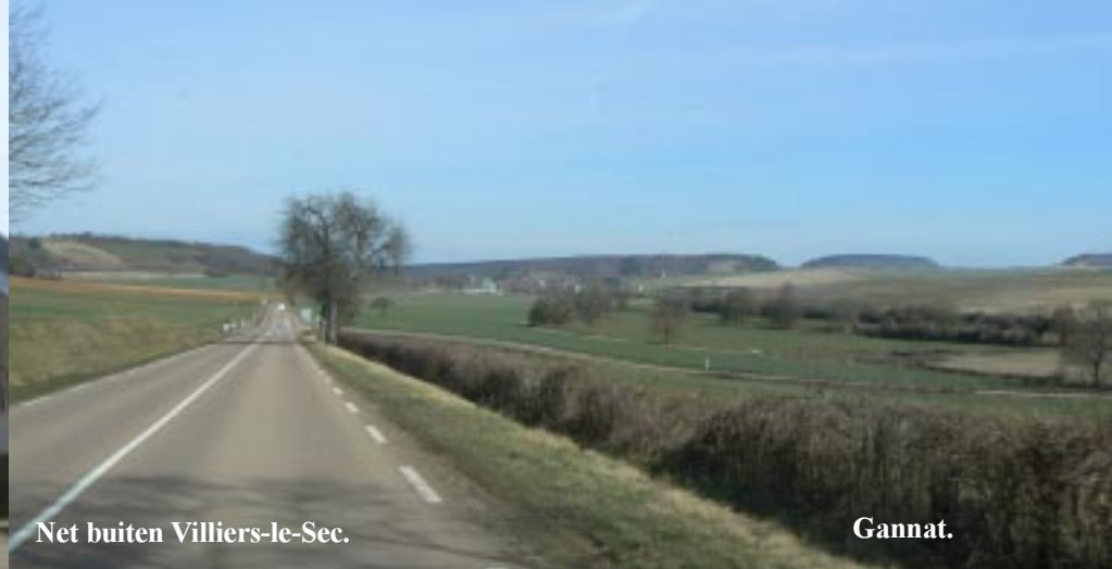
Net buiten Villiers-le-Sec.

We rijden via Guerigny (10.40) en Prémery met zijn vermoedelijk leuke binnenstad. Vermoedelijk omdat bomen steeds goed zicht verijdelen. Over een mooie Ardennen-achtige weg gaat het naar Montigny, Varzy en Villiers-le-Sec. Rond 12 uur kuieren we een rondje door Clamecy, een pittoresk stadje aan de Yonne. Opmerkelijk is de in slechte staat verkerende betonnen kerk uit 1940.