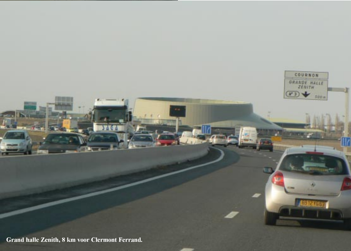
Grand halle Zenith, 8 km voor Clermont Ferrand.