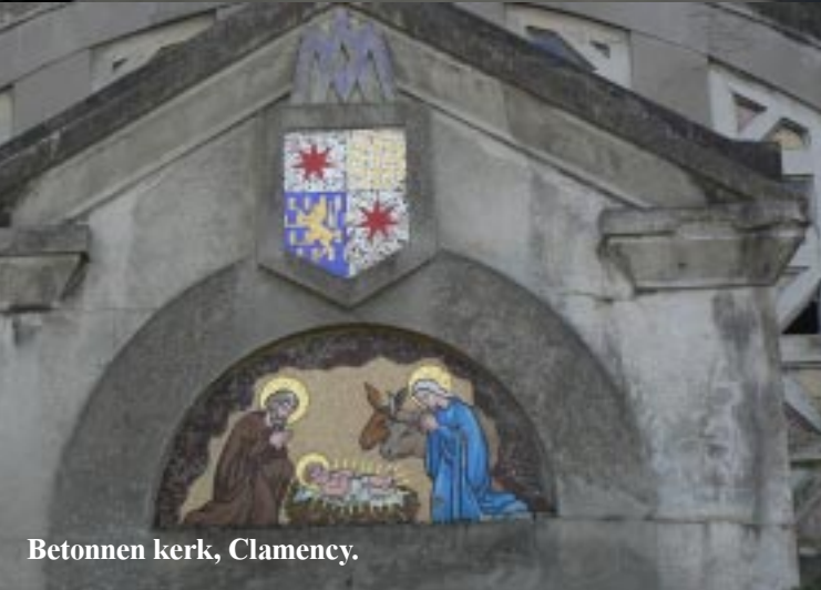
Betonnen kerk, Clamecy.