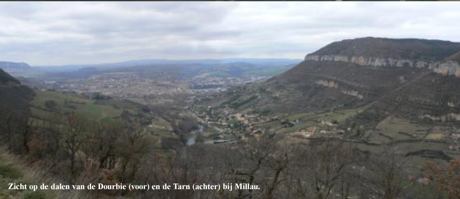
Zicht op de dalen van de Dourbie (voor) en de Tarn (achter) bij Millau.