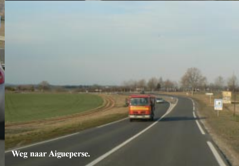
Weg naar Aigueperse.