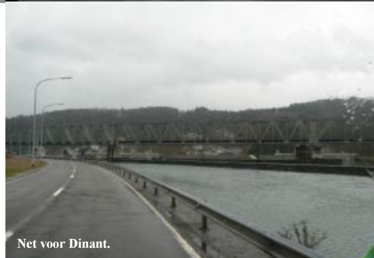
Net voor Dinant.

De Maas meandert hier dat het een lieve lust is en Revin ligt aan een zeer mooi plekje van de rivier. Er blijkt maar één benzinepomp te zijn. Een man legt ons uit, dat die bij de plaatselijke Intermarché is en rijdt voor ons uit daarheen. Heel aardig dus. Gelukkig kunnen we er op deze vroege zondagmorgen met een creditcard terecht. Anders hadden we tot negen uur moeten wachten op een pompbediende, weet een voorbijganger te melden. 8.45 kunnen we volgetankt echt aan de terugweg beginnen. We volgen tot ver België in (Namen) de Maas over dikwijls slechte wegen. maar wel wegen door een schitterend stukje Europa. Uiteraard herkennen we ook hier enige punten van de heenweg: Zoals b.v. Waulsort met zijn stuw (9.50).