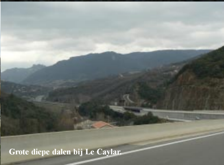
Grote diepe dalen bij Le Caylar.