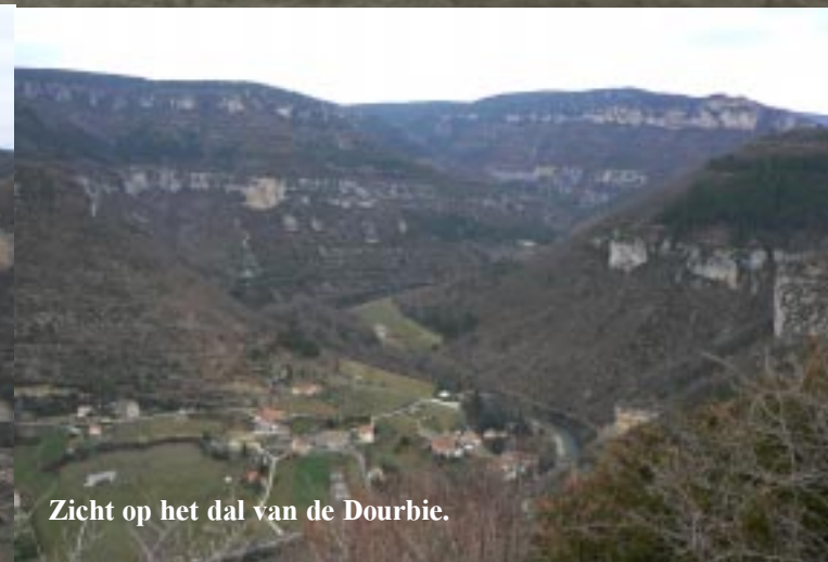
Zicht op het dal van de Dourbie.