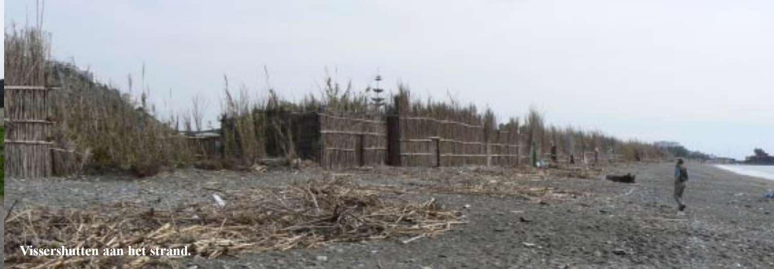
Vissershutten aan het strand.