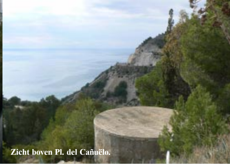
Zicht boven Pl. del Cañuelo.

We zitten echter wel weer aan een prachtig stukje kust: het Paraje Natural Acantilados de Maro-Cerro Gordo. We vinden een beschutte Mirador en besluiten er de nacht te blijven. (15.00)