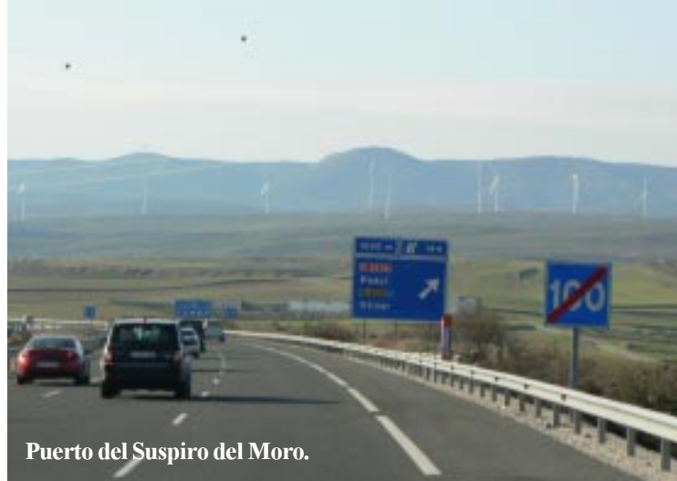
Puerto del Suspiro del Moro.

Met 4003 km op de teller verlaten we om 10.30 de camping. We rijden naar Motril terug. Nu echter steeds over de snelweg. Dat levert voor het grootste deel van deze trip betere uitzichten op dan de kleinere wegen op de heenweg! Met name uiteraard na de pas Puerto del Suspiro del Moro. Voor die tijd hebben we goed zicht op de hoge toppen van de Sierra Nevada. Helaas tegen te veel licht in voor foto's. Later is daar geen last meer van, want het weer wordt aanzienlijk slechter.