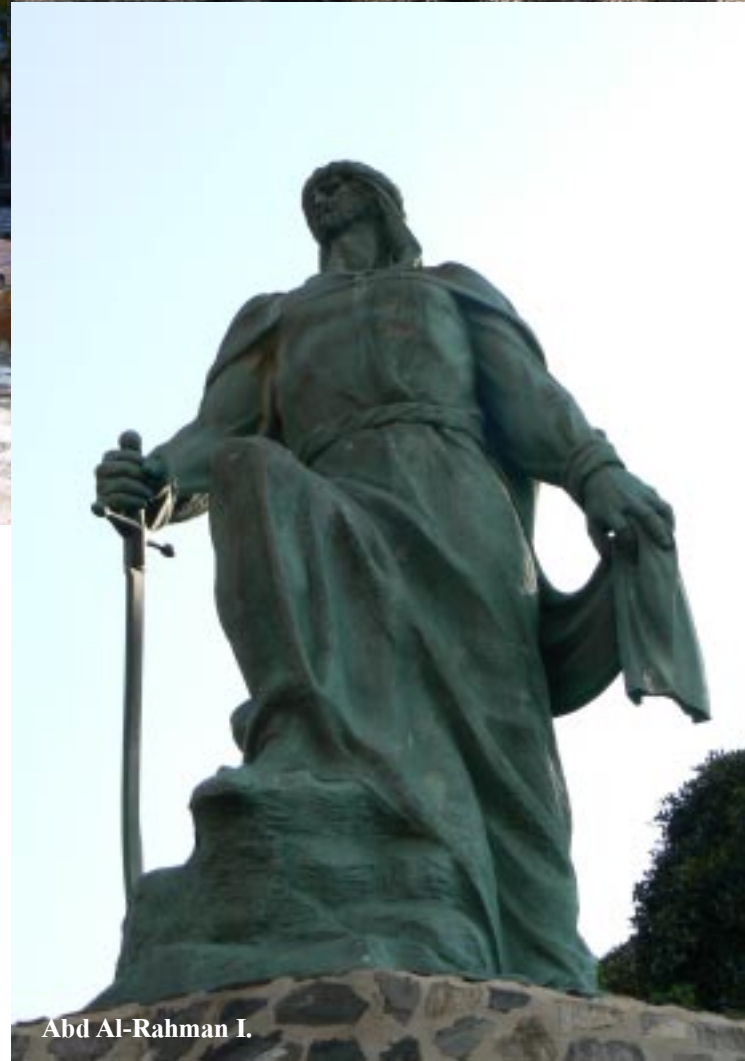
Abd Al-Rahman I.