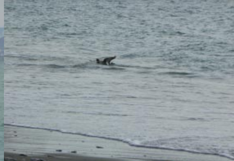
Vissende kanoër en de meeuw.