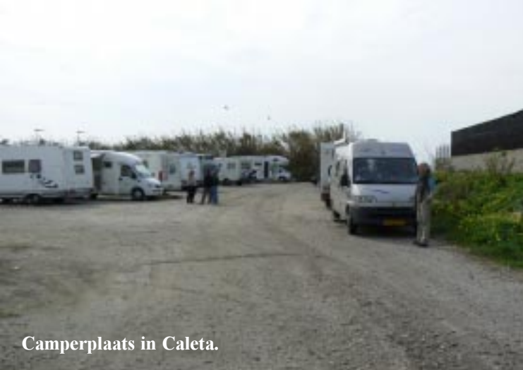
Camperplaats in Caleta.