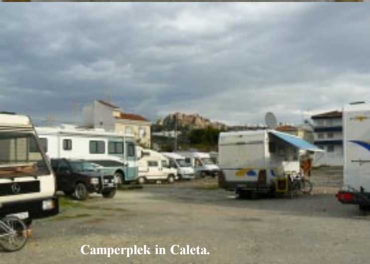
Camperplek in Caleta.