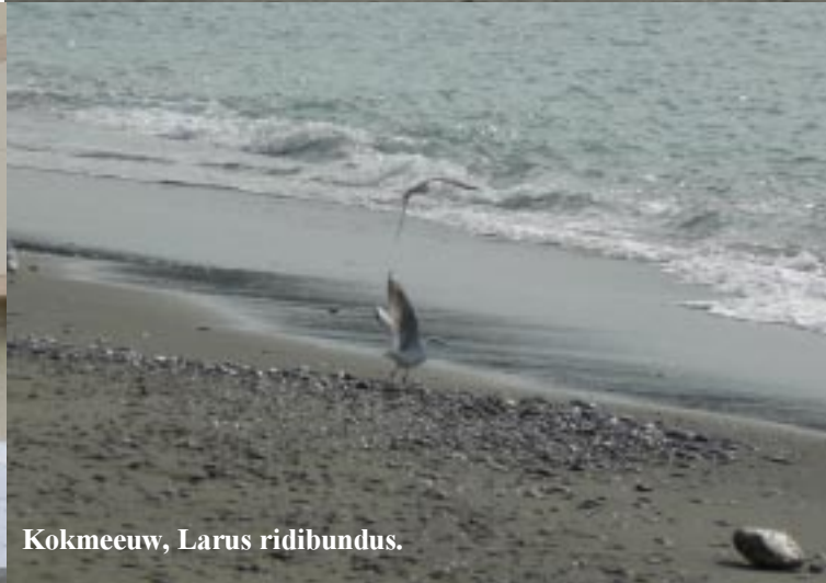
Kokmeeuw, Larus ridibundus .