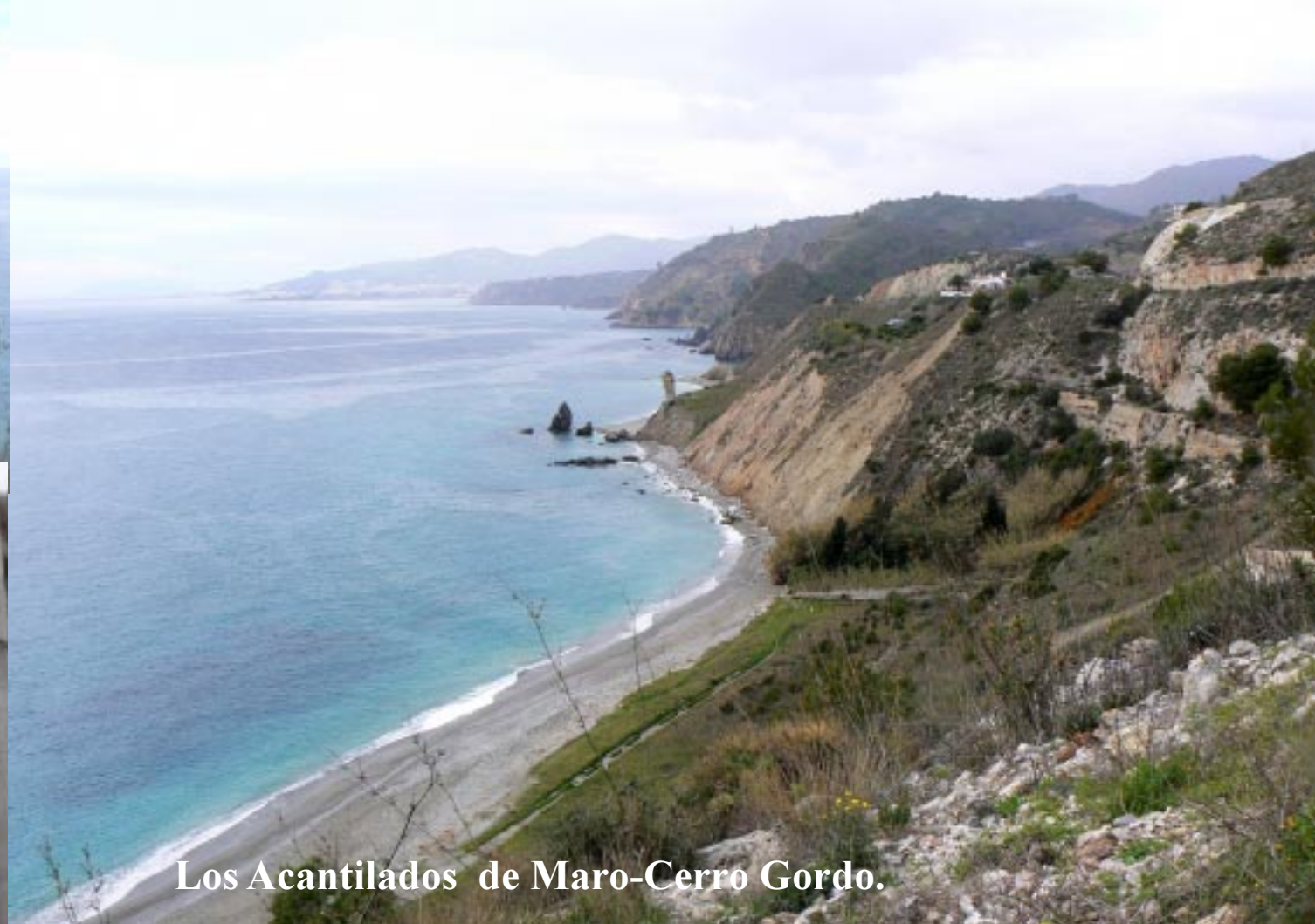
Los Acantilados de Maro-Cerro Gordo.