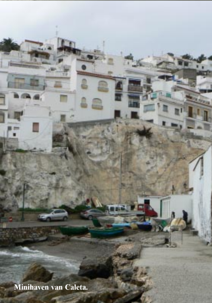
Minihaven van Caleta.