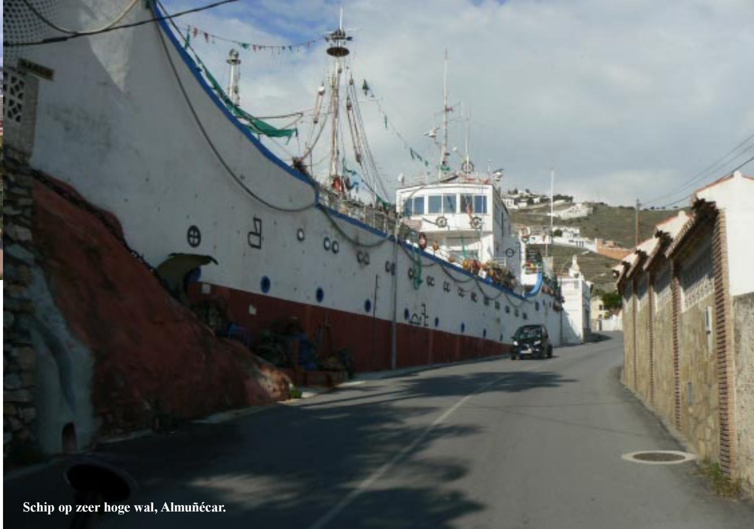
Schip op zeer hoge wal, Almuñécar.

Als we om 14.10 Almuñécar uitrijden komen we langs een grote boot, die is wel heel ver boven het water gestrand! Op zoek naar Playa del Cañuëlo (een mooi plekje van Ko) rijden we via het kleine plaatsje Herradura en dan steil bergop daar weer uit. We zijn te vroeg afgeslagen. Helaas blijkt dat strand even later niet meer met de auto bereikbaar te zijn. Dat is althans voor onbevoegden verboden.