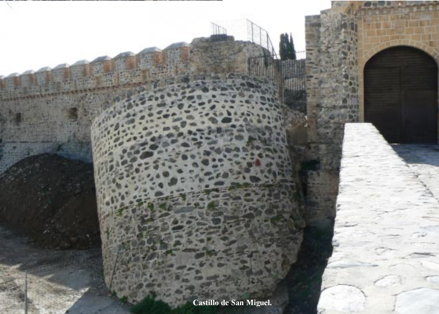
Castillo de San Miguel.