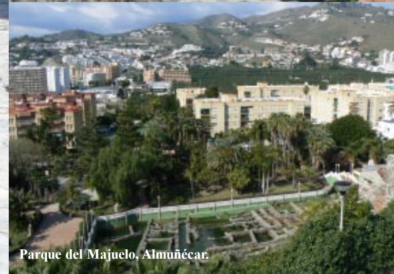
Parque del Majuelo, Almuñécar.