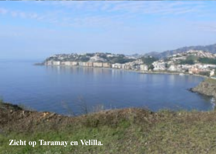
Zicht op Taramay en Velilla.