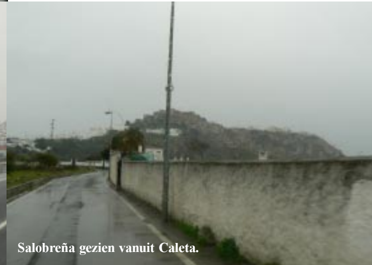
Salobreña gezien vanuit Caleta.