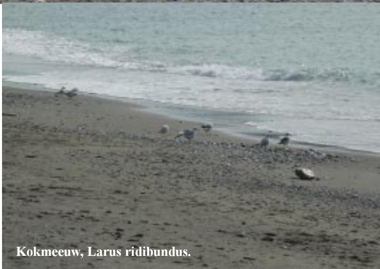
Kokmeeuw, Larus ridibundus .

24-1-2010. Caleta en Salobreña. Deze grijze dag gebruiken we om de verhalen bij te schrijven. Tegen half twee lopen we wel langs het strand af naar Salobreña-Plaja. Opmerkelijk is de lange rij vissershutjes aan het strand. In 1e instantie is er daar verder niet veel te zien. Enkele kokmeeuwen aan het strand en veel meeuwen ver op zee, waar ze niet te herkennen zijn, ook niet met de verrekijker.