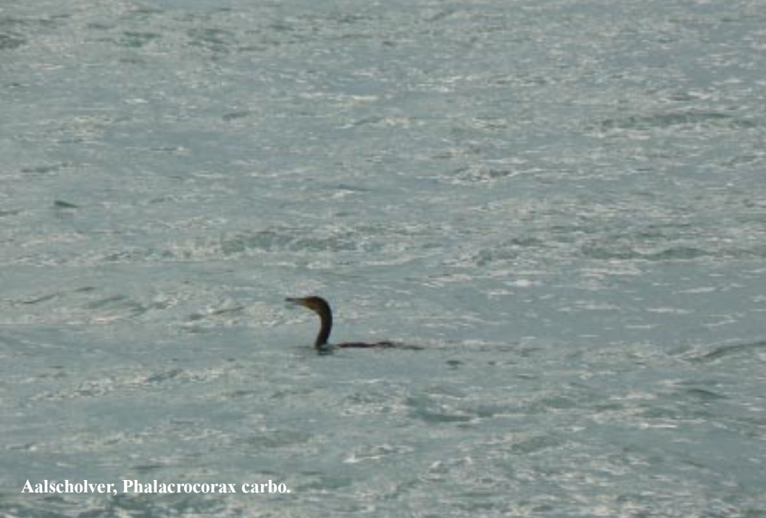
Aalscholver, Phalacrocorax carbo .