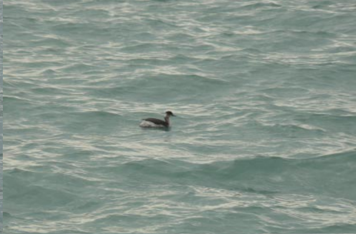
Geoorde fuut, Podiceps nigricollis .