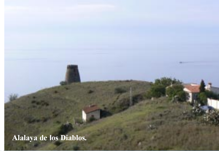
Alalaya de los Diablos.

Om 10.45 verlaten we de camperplek aan de Calle dela Carretera Caleta. Direct gaat het steil de Monte de los Almendros op. We krijgen zo goed zicht op de viskwekerijen op de zee voor Caleta. We halen een cache op bij een toren op een landtong Alalaya de los Diablos. Kleine sterk zoet geurende witte bloemen versieren het veld.