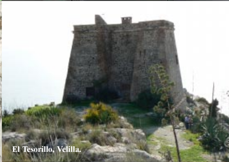
El Tesorillo, Velilla.