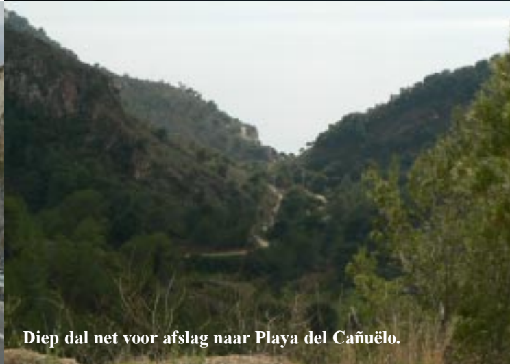
Diep dal net voor afslag naar Playa del Cañuëlo.