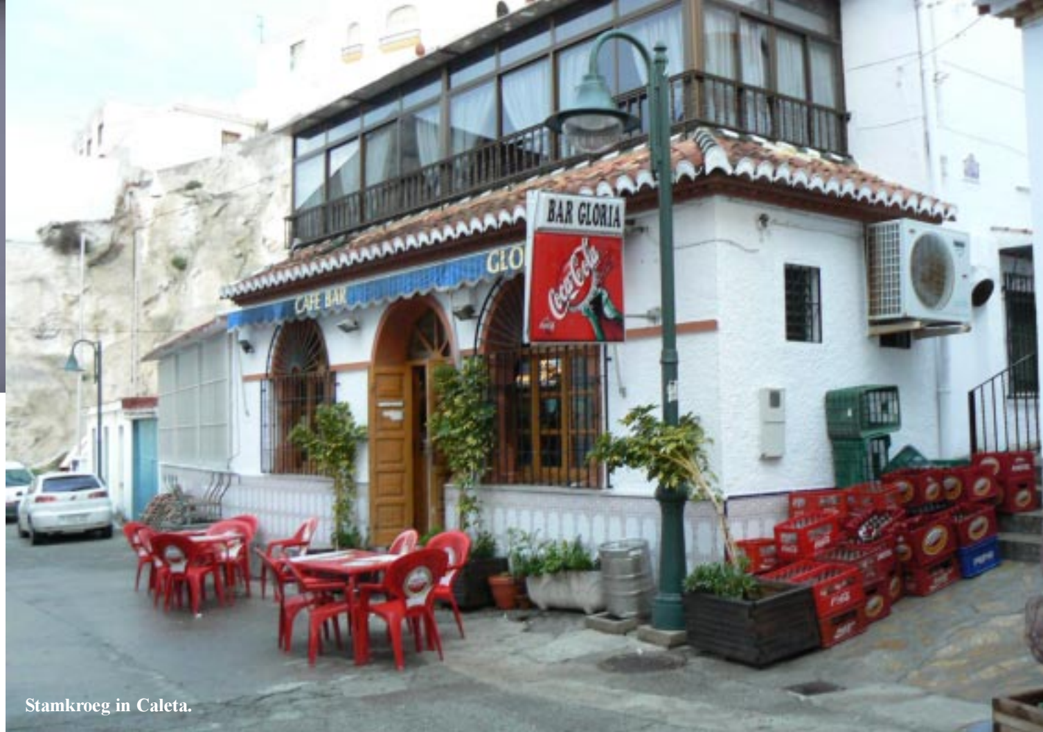
Stamkroeg in Caleta.