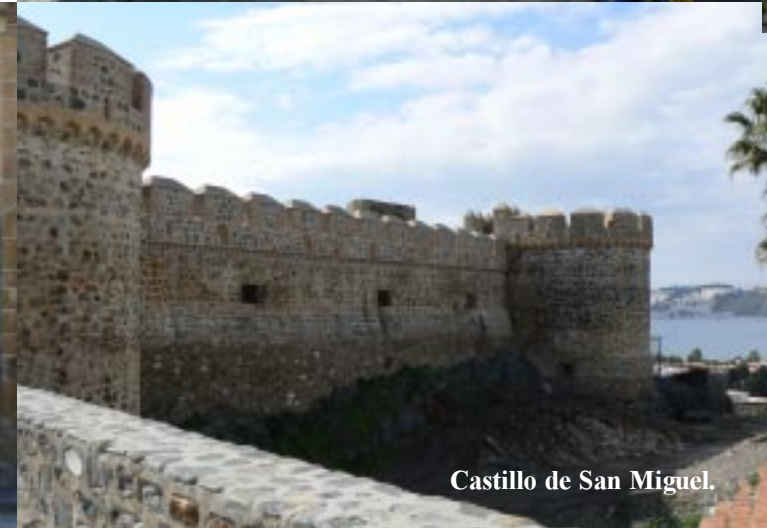
Castillo de San Miguel.