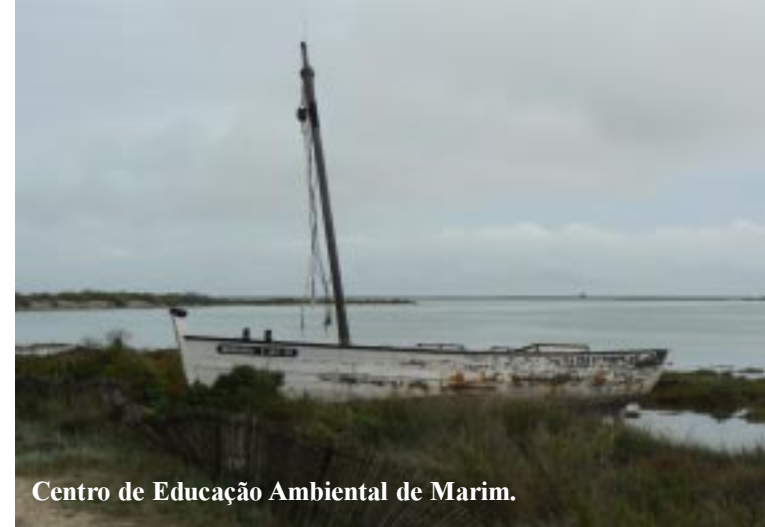
Centro de Educação Ambiental de Marim.

Het is intussen droog geworden en dat blijft het voor de rest van de dag.