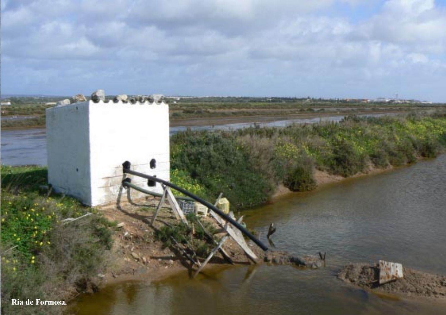
Ria de Formosa.