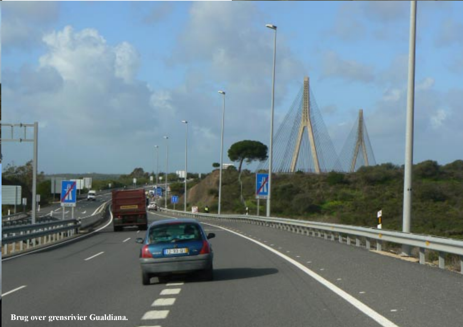
Brug over grensrivier Gualdiana.