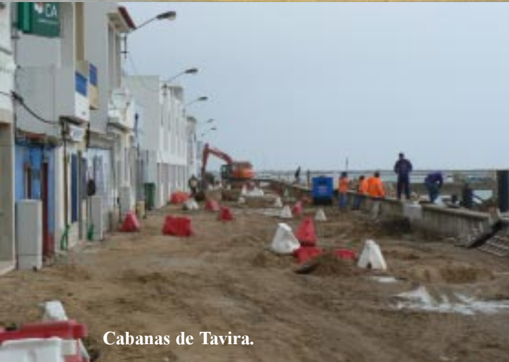
Cabanas de Tavira.