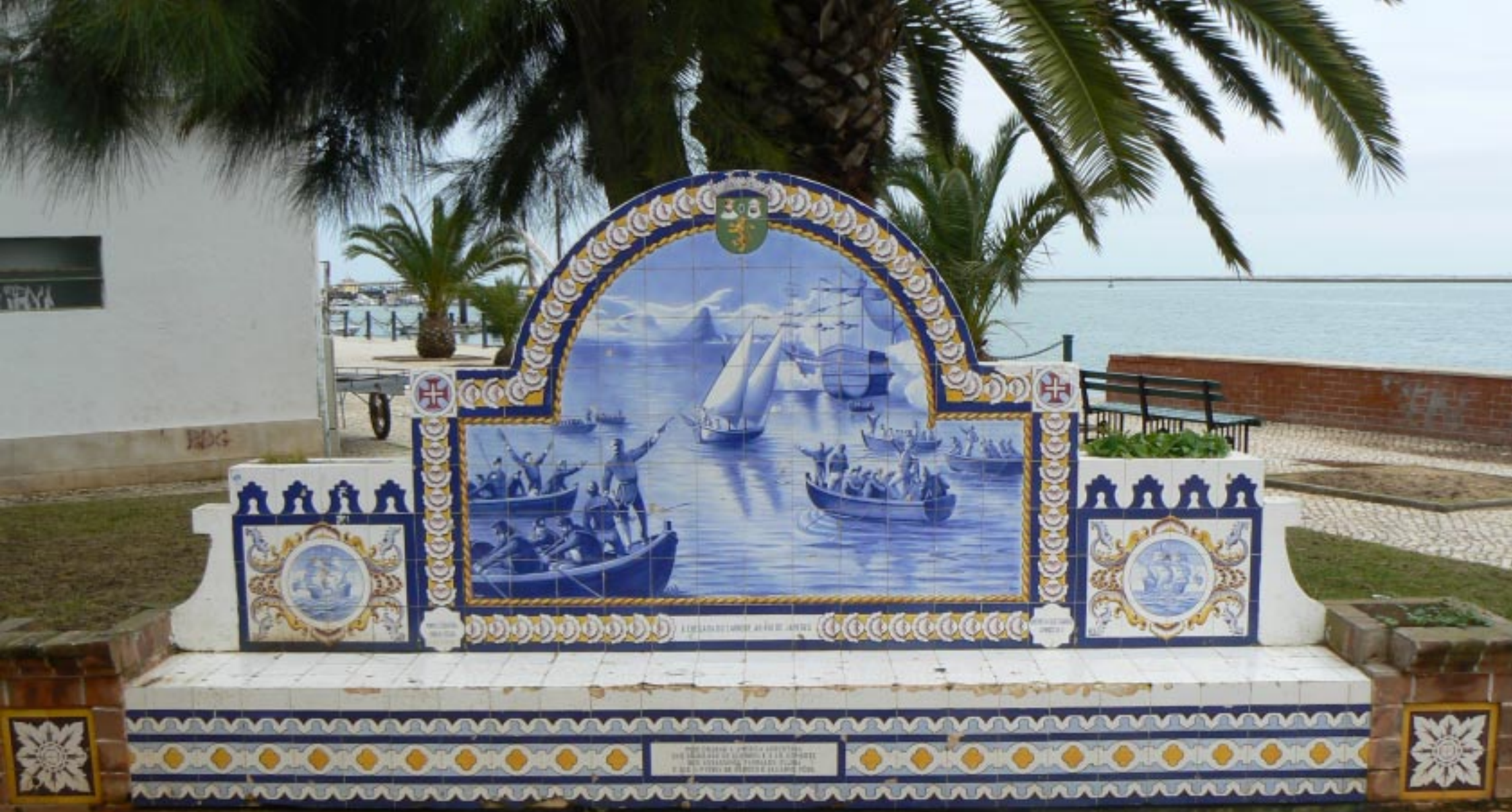
Cabanas de Tavira - Olhão.