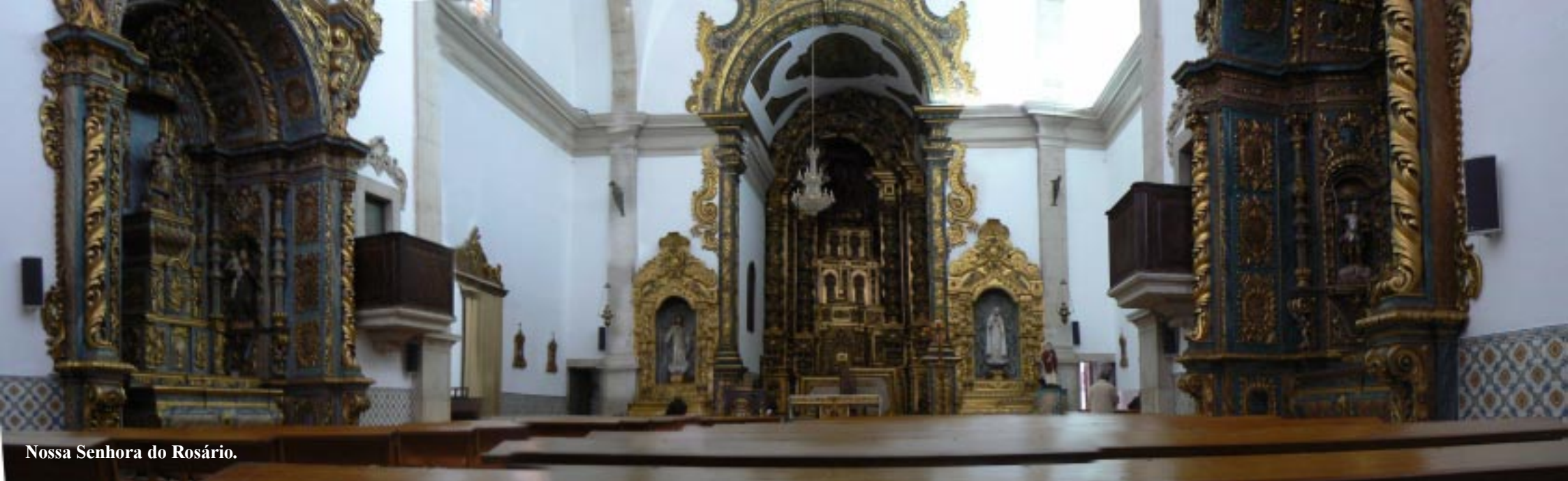
Nossa Senhora do Rosário.