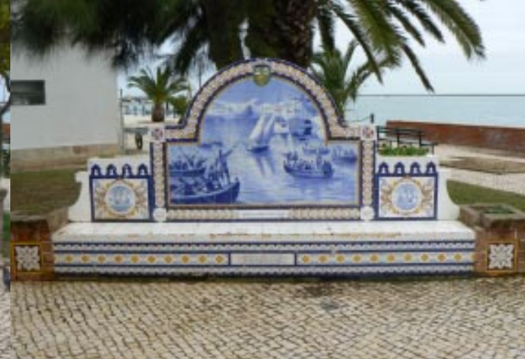
Bankjes aan de boulevard, Olhão.