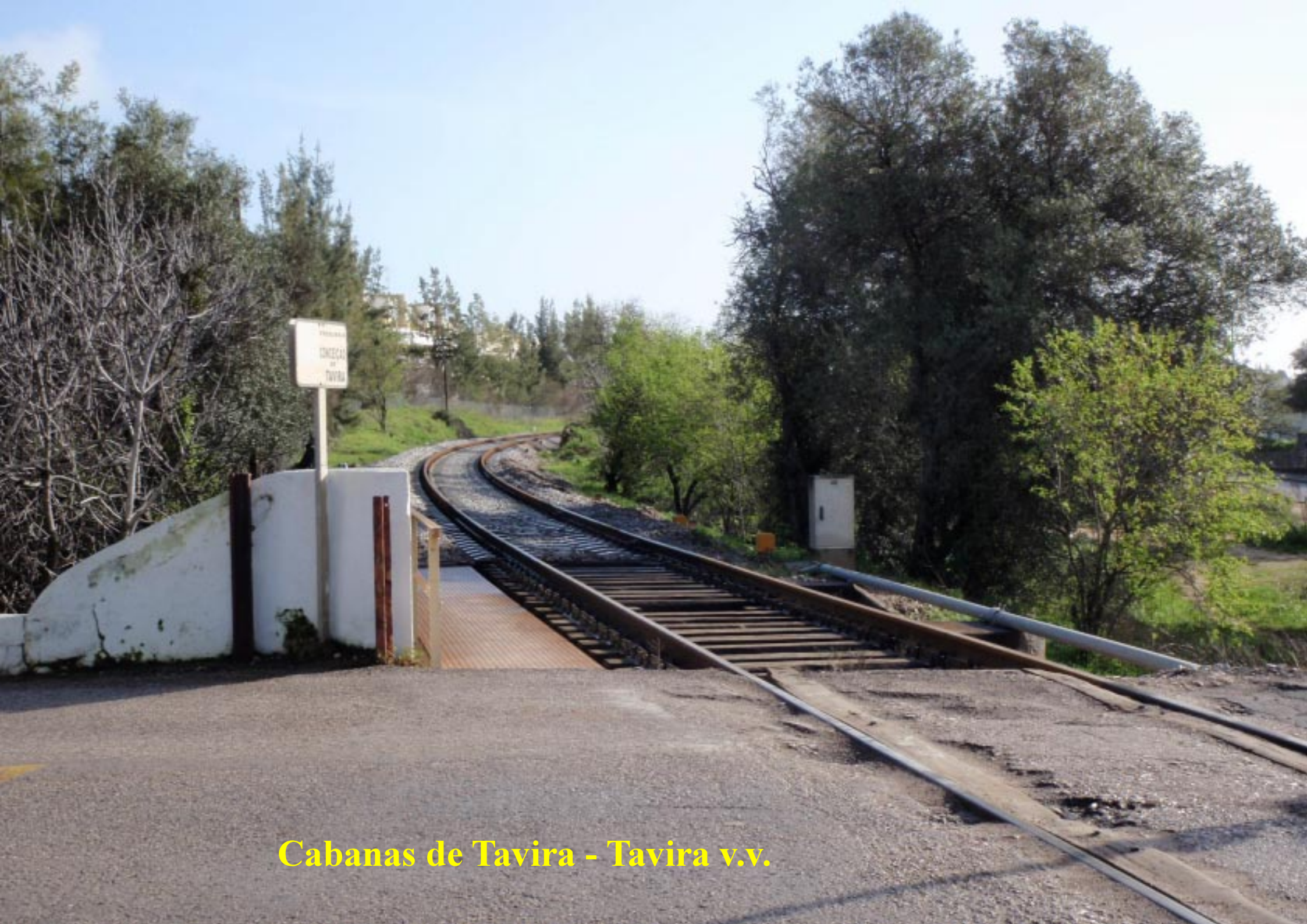
Cabanas de Tavira - Tavira v.v.