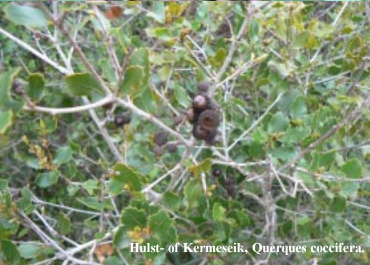
Hulst- of Kermeseik, Quercus coccifera .