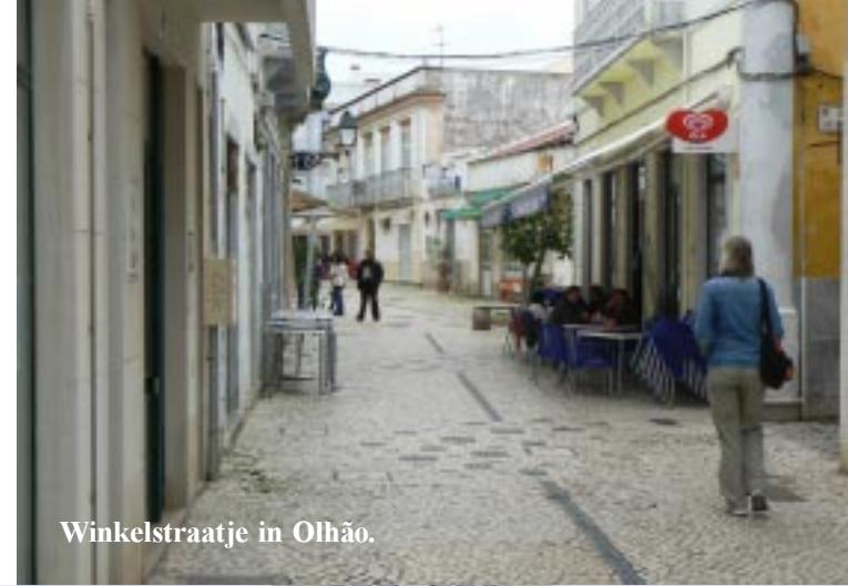
Winkelstraatje in Olhão.

Kwart voor drie rijden we Olhão in. Doen eerst boodschappen bij de Minipreço en zoeken dan een plekje voor vannacht. De camperplek bij de vissershaven is afgeladen vol. Dus door naar de stad zelf. Daar aan de boulevard vinden we een prachtige plek tegen de Ria Formosa aan. Om kwart voor vier doen we ons rondje langs het water en door de binnenstad. Een van de met azulejos versierde bankjes in het park aan het water memoreert het historische hoogtepunt voor Olhão: Simpele vissers gingen in 1808 met hun bootje de oceaan over om hun koning João VI in ballingschap in Brazilië te gaan vertellen dat de Fransen het land uit waren. Als dank kreeg Olhão stadsrechten. Aan een aparte steiger ligt een replica van die boot.