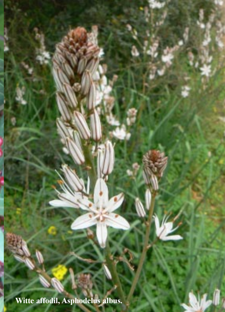
Witte affodil, Asphodelus albus .