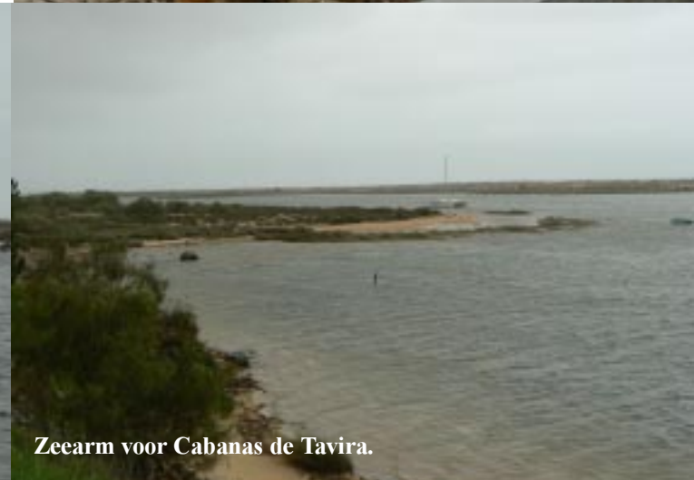
Zeearm voor Cabanas de Tavira.