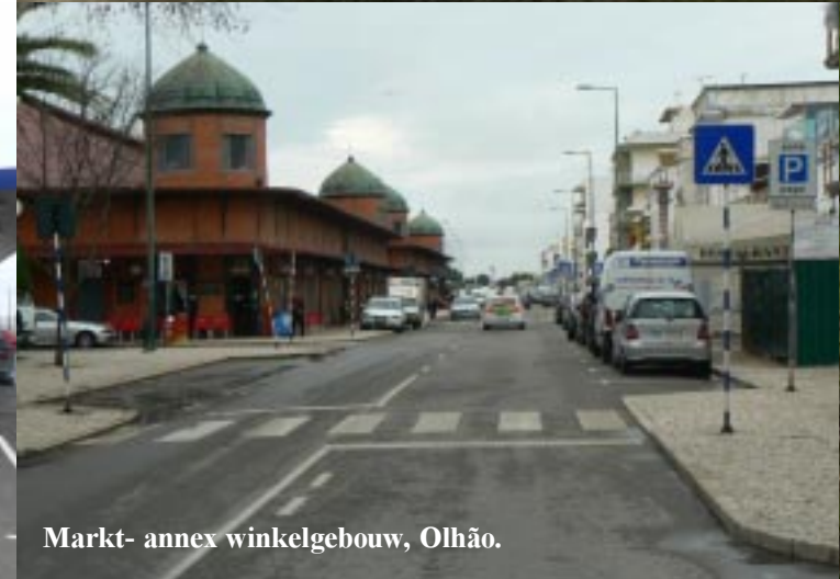
Markt- annex winkelgebouw, Olhão.