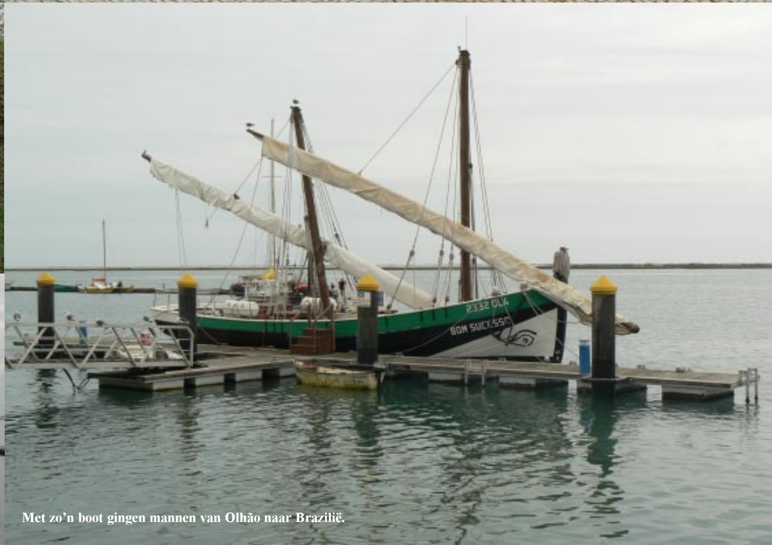
Met zo'n boot gingen mannen van Olhão naar Brazilië.