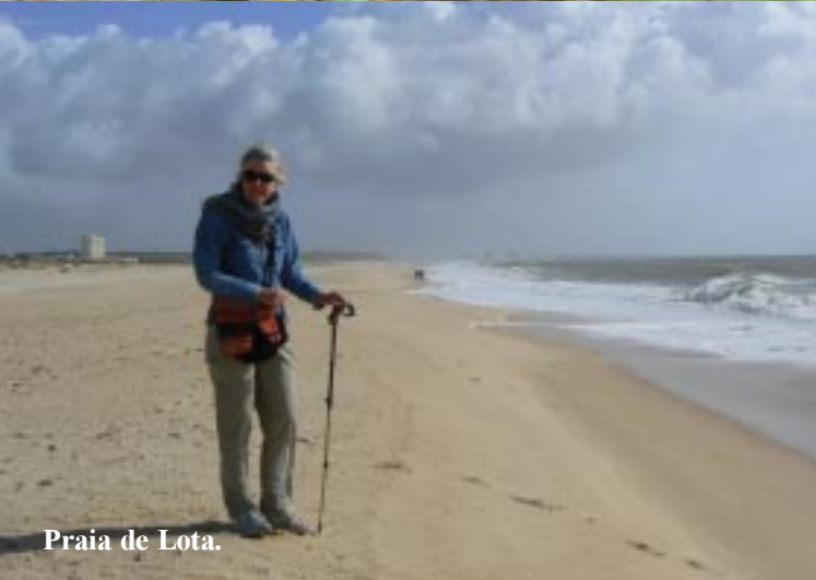
Praia de Lota.