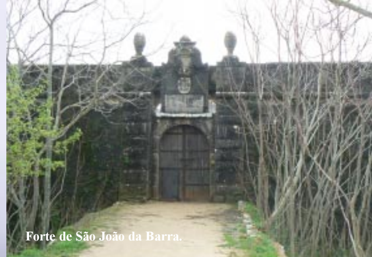
Forte de São João da Barra.