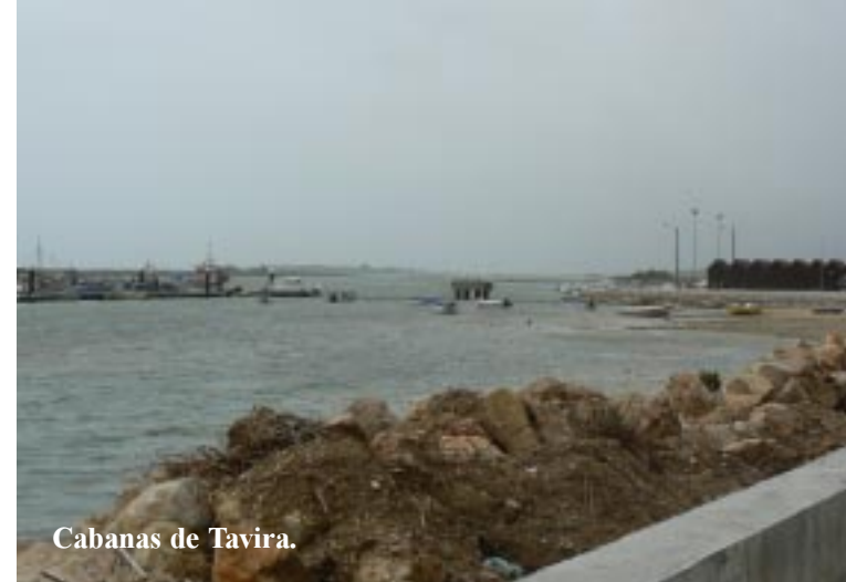
Cabanas de Tavira.

We lopen oostwaarts langs het water het dorp uit om naar een cache te zoeken. Bij het Forte de São João da Barra, dat er zeer goed onderhouden uit ziet, zien we een boot aan de andere kant van het water tegen het strand aan liggen. De Garmin wijst resoluut daar heen. 130 m zwemmen is ons echter te veel.