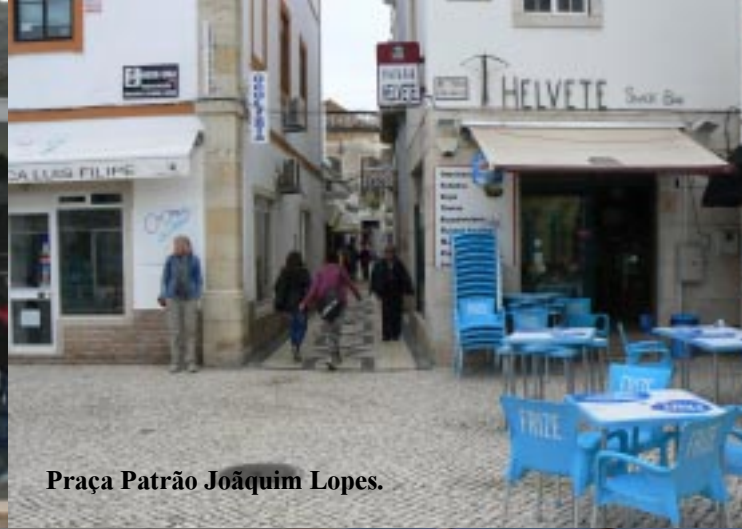
Praça Patrão Joaquim Lopes.

Later op de middag maak ik nog enkele foto's aan het water, waar ik op de slikken aan de andere kant van de Ria Formosa een ooievaar en allerlei steltlopers zie. In de boom naast de camper zitten wel 8 putters.