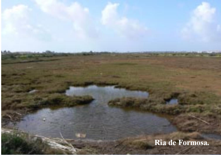
Ria de Formosa.

Een 2e cache zoeken we op in het Rato Forte, dat in het NP de Ria Formosa ligt. Hier zien we veel salinas, waar aardig wat vogels in zitten.