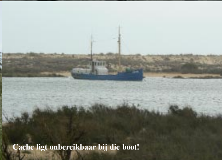
Cache ligt onbereikbaar bij die boot!