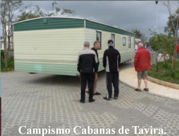
Campismo Cabanas de Tavira.