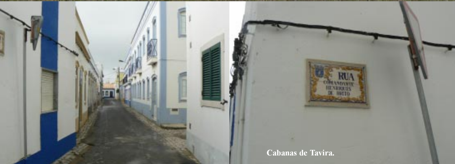
Cabanas de Tavira.