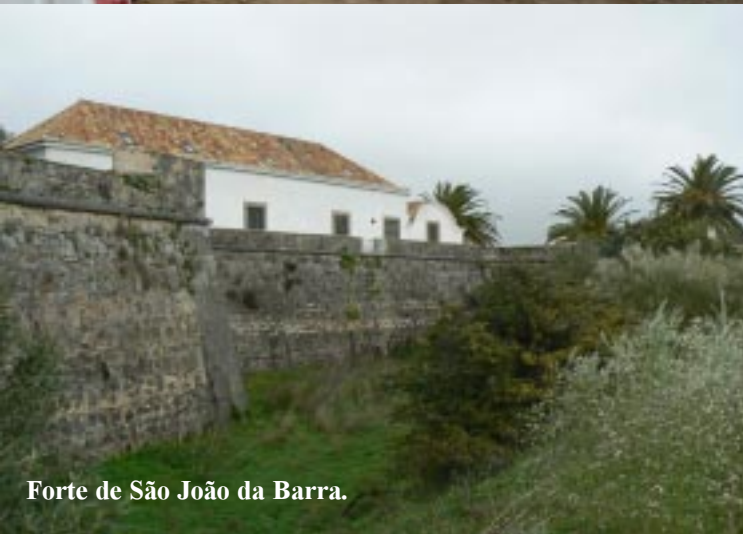
Forte de São João da Barra.