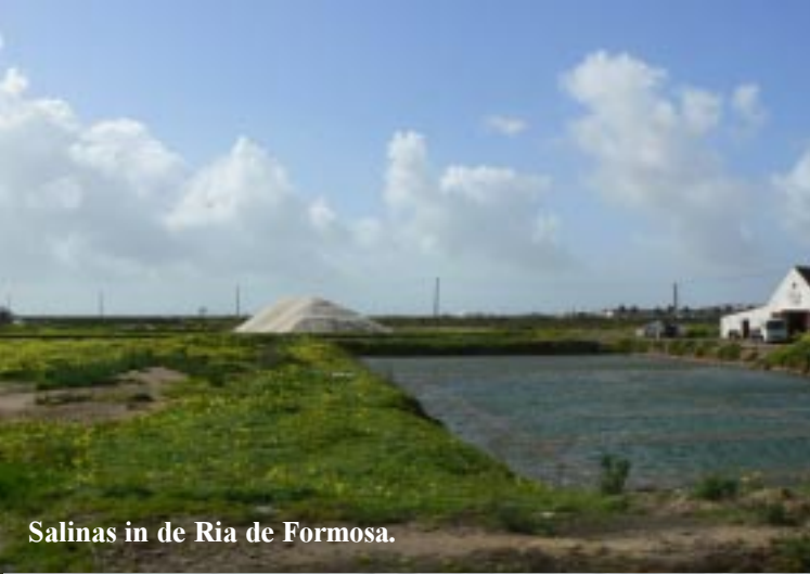
Salinas in de Ria de Formosa.

Een 2e cache zoeken we op in het Rato Forte, dat in het NP de Ria Formosa ligt. Hier zien we veel salinas, waar aardig wat vogels in zitten.