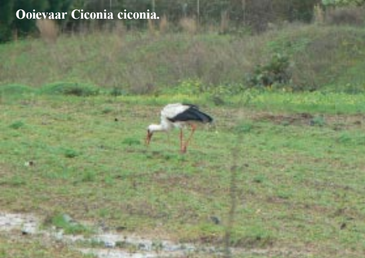
Ooievaar Ciconia ciconia .