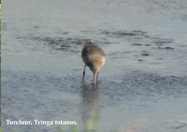
Tureluur, Tringa totanus.