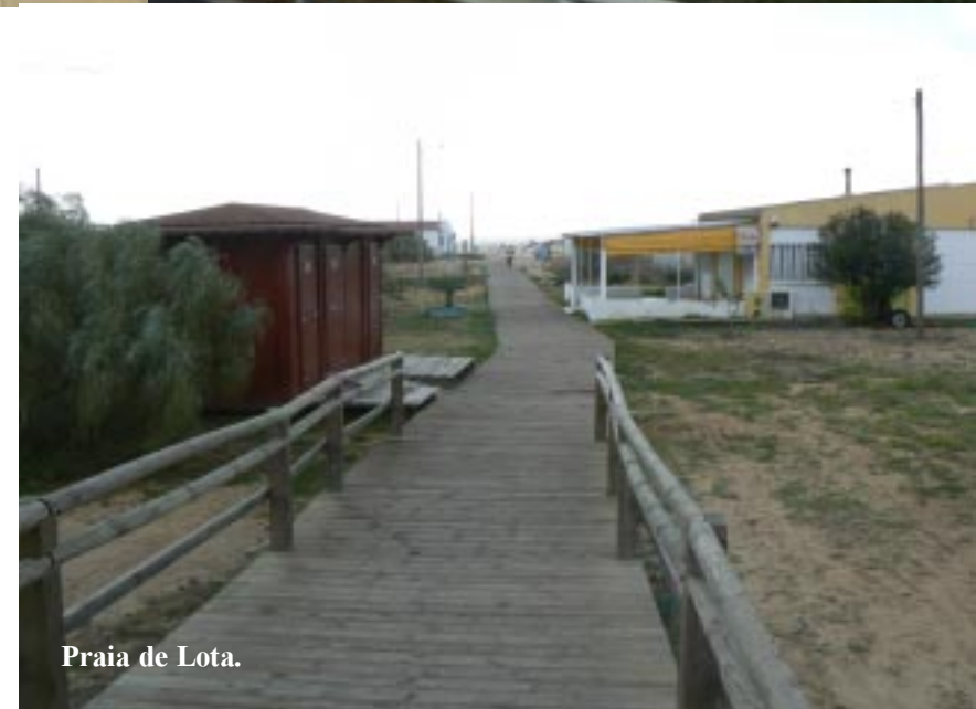
Praia de Lota.

De tijd gaat een uur terug, zodat we toch nog net voor tien in Portugal zijn. Via Altura rijden we naar een cache, die bij het strand van Praia de Lota (bij Manta Rota) in een cactusstruik is verstopt. Tineke had daar al zo'n vermoeden van en heeft de wandelstok bij zich.