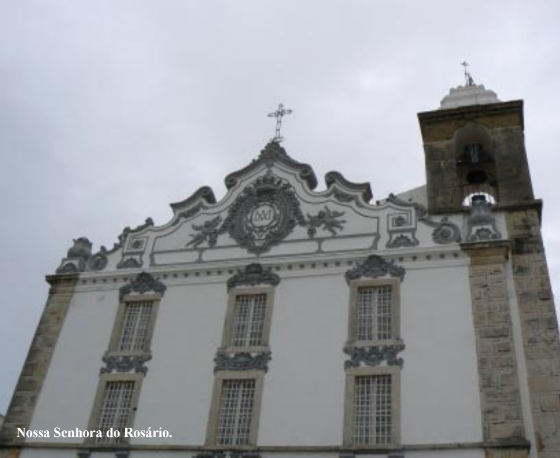
Nossa Senhora do Rosário.