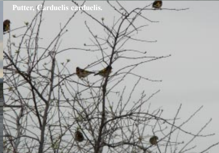
Putter, Carduelis carduelis .