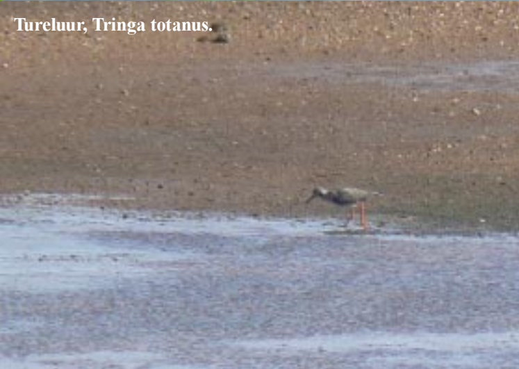
Tureluur, Tringa totanus.