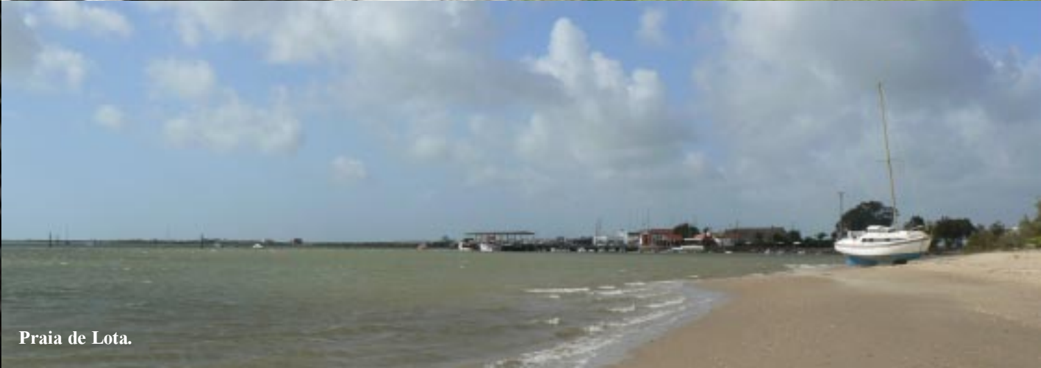
Praia de Lota.