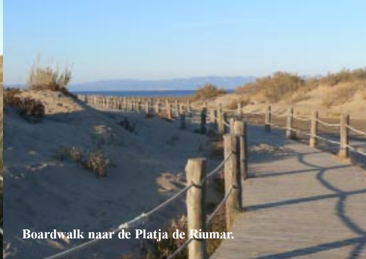
Boardwalk naar de Platja de Riumar.