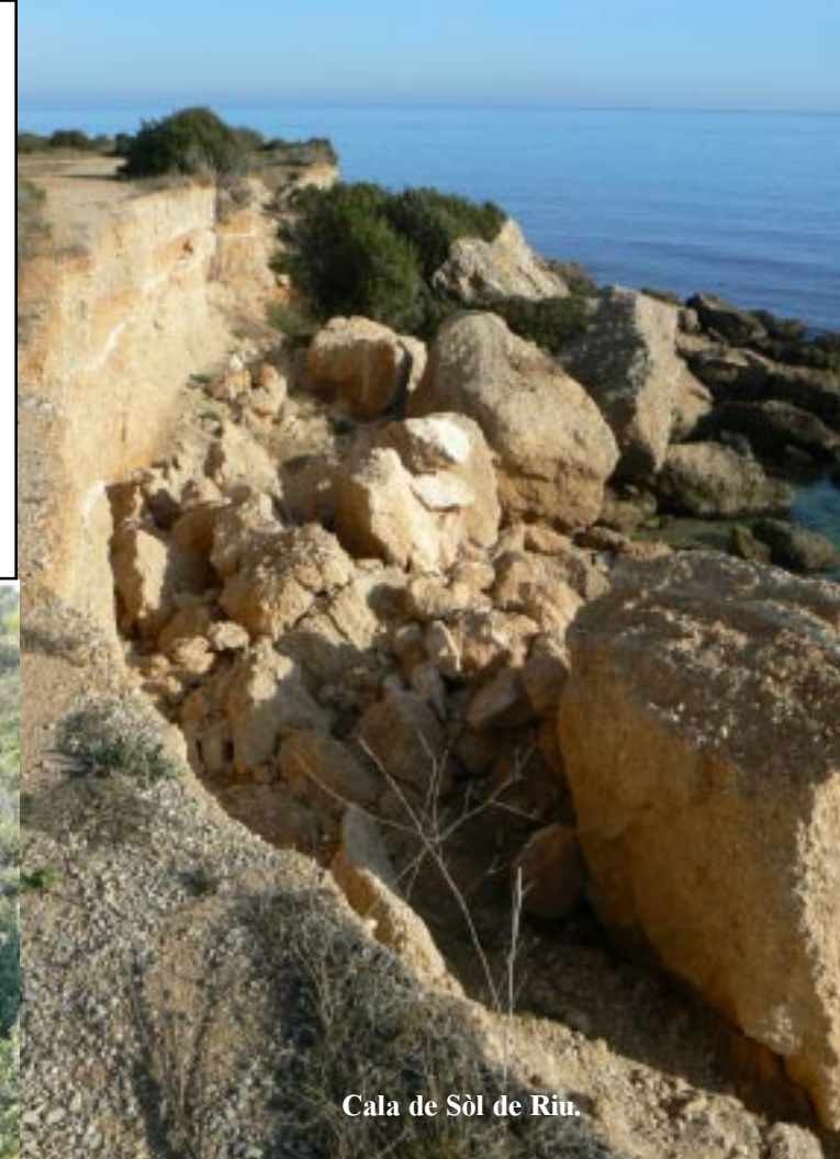
Cala de Sòl de Riu.

We rijden na 2474 km Catalunya uit en Castello in. Net voor Vinaròs zoeken we een cache op aan de kust van Cala de Sòl de Riu. Een kust die opgebouwd is met kiezelkeien in zand. Dus geen zandsteen of conglomeraatgesteente. Zeer erosiegevoelig uiteraard, hetgeen te zien is.