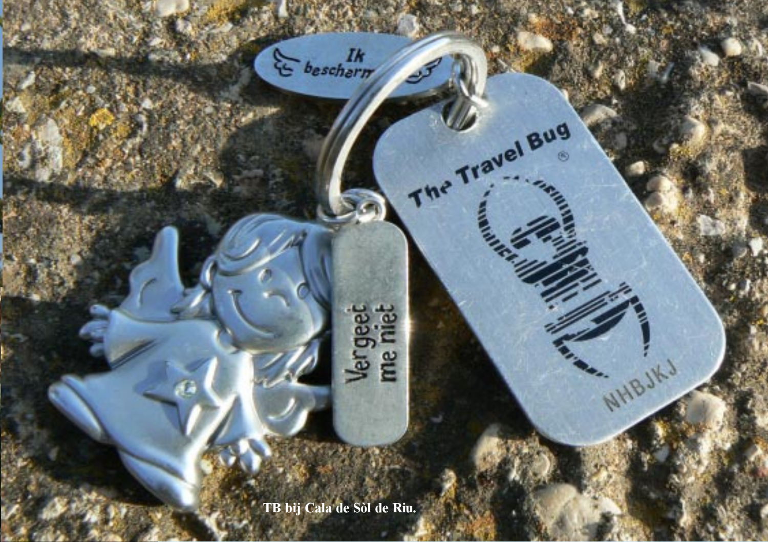
TB bij Cala de Sòl de Riu.

In Vinaròs gaan we in een groot winkelcentrum boodschappen doen bij een Sabeco. Om 16.10 gaat het dan door naar de camperplaats van Benicarló. Of beter gezegd degene, die net in Peñíscola ligt.