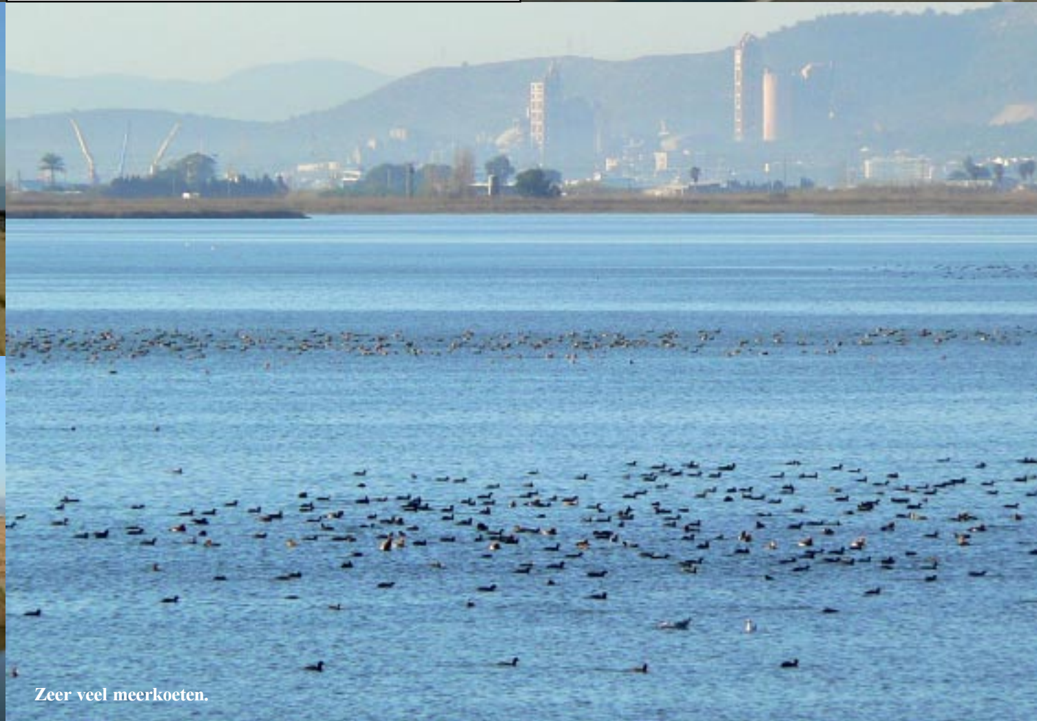
Zeer veel meerkoeten.