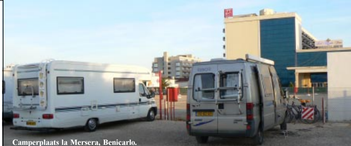
Camperplaats la Mersera, Benicarlo.

De omgeving laten we vandaag voor wat het is. We werken aan de verslagen.