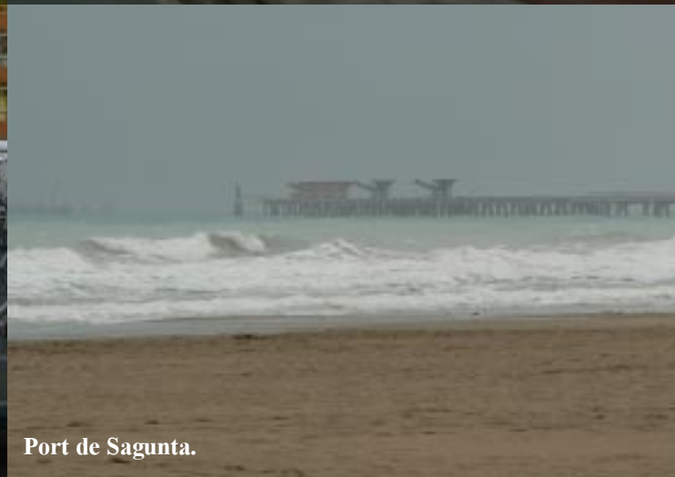
Port de Sagunta.