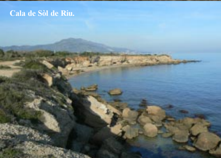
Cala de Sòl de Riu.