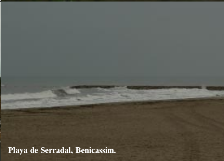
Playa de Serradal, Benicassim.