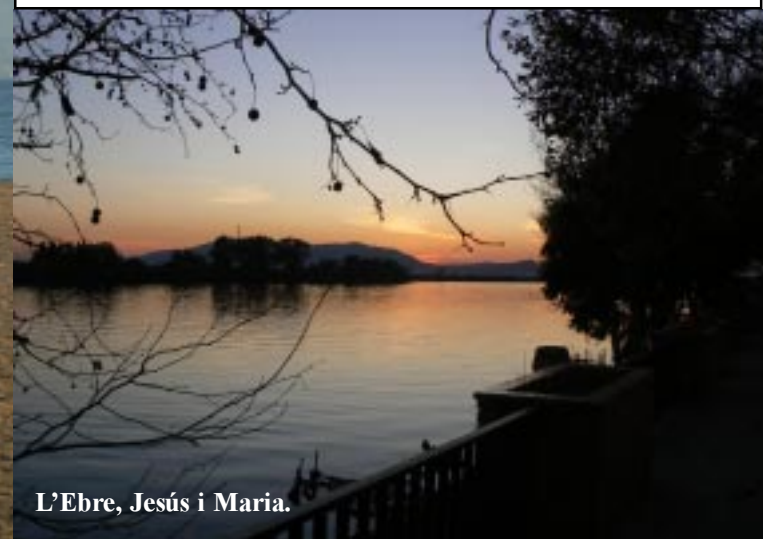
L'Ebre, Jesús i Maria.

Na eerst wat gegeten te hebben maken we van deze no2 Route Ecomuseum-rivermouth een verkorte versie door alleen de oostzijde te doen. (13.00 - 17.00) We gaan uiteraard na het fietsen nog even op het strand kijken. Het wordt een beetje juttien met een schelpje, een aparte dobber met nepworm aan de haak en een mini-bandenreparatiesetje! We rijden naar Jesús i Maria, een wijk van Deltebre en koken en eten een potje daar aan de Ebro. Om 20.00 wordt de was opgehaald (•26) en gaan we toch terug naar Platja Riumar voor de nacht.