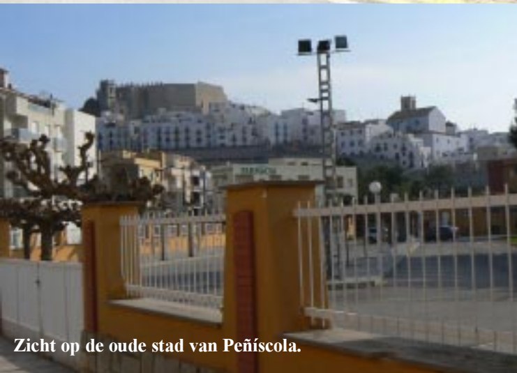
Zicht op de oude stad van Peñíscola.