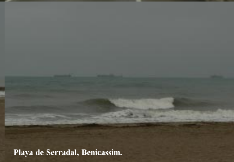
Playa de Serradal, Benicassim.