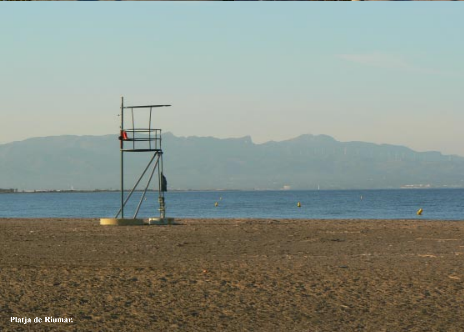
Platja de Riumar.

Na eerst wat gegeten te hebben maken we van deze no2 Route Ecomuseum-rivermouth een verkorte versie door alleen de oostzijde te doen. (13.00 - 17.00) We gaan uiteraard na het fietsen nog even op het strand kijken. Het wordt een beetje juttien met een schelpje, een aparte dobber met nepworm aan de haak en een mini-bandenreparatiesetje! We rijden naar Jesús i Maria, een wijk van Deltebre en koken en eten een potje daar aan de Ebro. Om 20.00 wordt de was opgehaald (•26) en gaan we toch terug naar Platja Riumar voor de nacht.