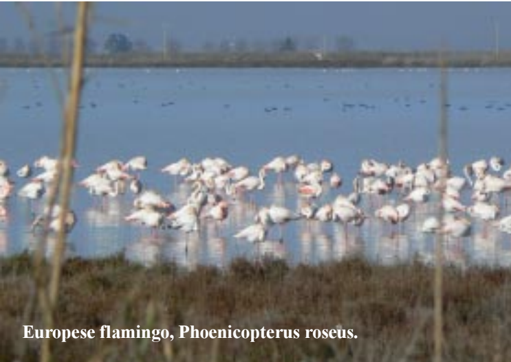
Europese flamingo, Phoenicopterus roseus .

Om 13.55 na de lunch bij Casa de Fusta rijden we om Sant Carles de la Rapita de Ebrodelta uit. Onderweg gaat het over zeer smalle wegen met uiteraard weer massa's vogels op de natte velden.