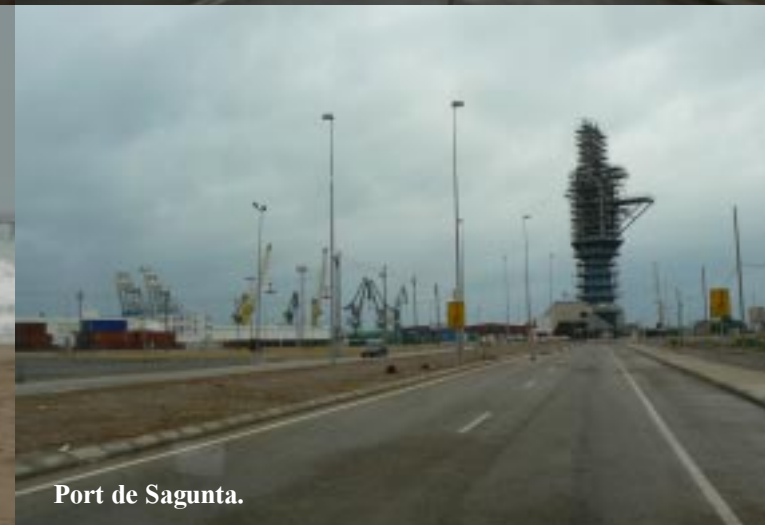
Port de Sagunta.