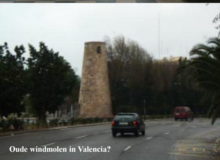
Oude windmolen in Valencia?