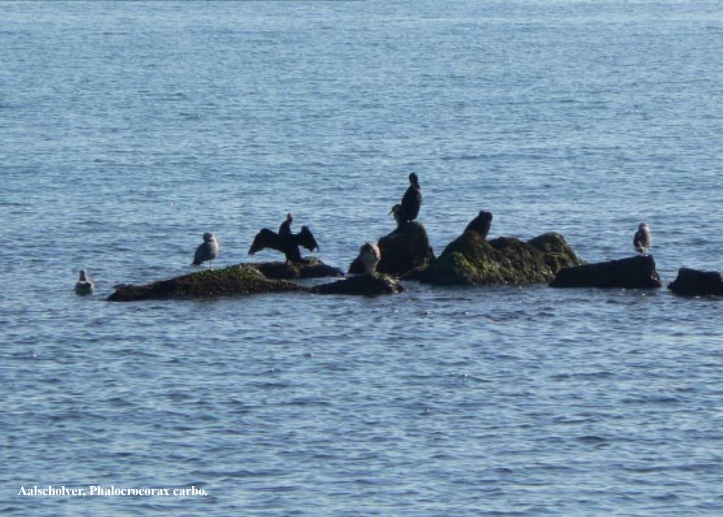
Aalscholver, Phalacrocorax carbo .

In de verte schimmert Peñíscola, daar willen we morgen heen. Opmerkelijk dat het kiezelstrand opeens in een grof zand-strand verandert, zonder dat daar een reden voor lijkt te zijn.