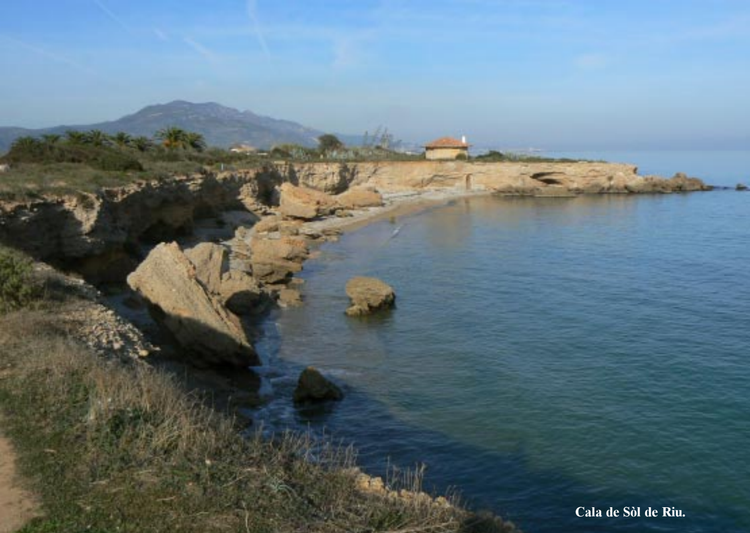
Cala de Sòl de Riu.

We moeten eerst zo'n 700 m langs die kust wandelen voor we op de zoekplaats komen. Dat is geen straf dus. Tineke zoekt fanatiek naar de cache, ik kijk meer naar de zangvogeltjes in de struiken en de aalscholvers op zee. Mooie plek weer.