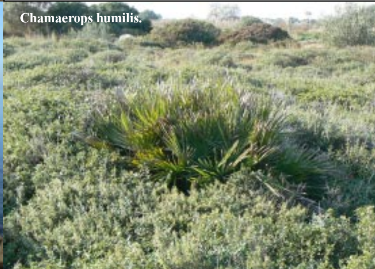
Chamaerops humilis .