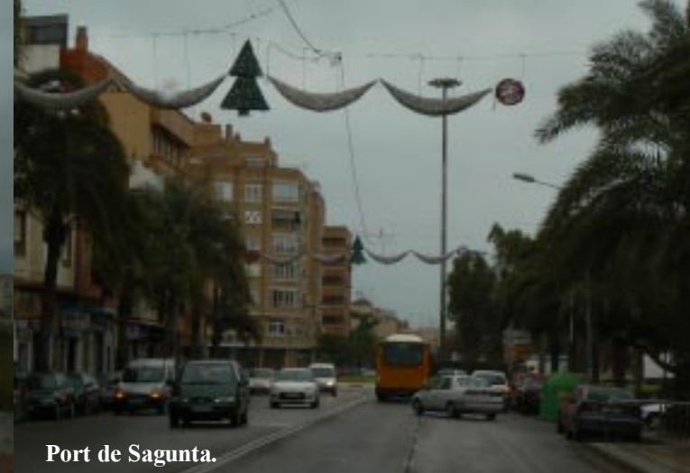
Port de Sagunta.