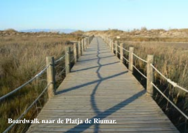
Boardwalk naar de Platja de Riumar.