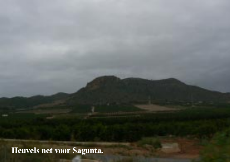
Heuvels net voor Sagunta.