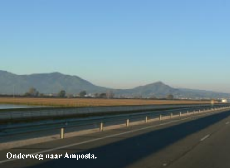
Onderweg naar Amposta.