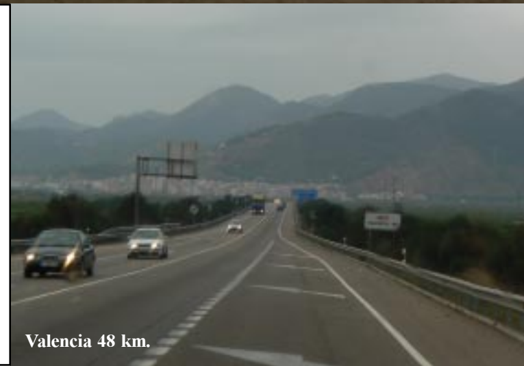
Valencia 48 km.

Bij Benicassim gaan we van de N340 af naar de kust. Iets verder bij Playa de Serradal spring ik er even uit om naar de wilde zee te kijken. Dan gaat het weer de sinaasappelboomgaarden in. Sagunta is het volgende hoogtepunt. Een stad met veel industrie erom heen, maar met ook een heel groot fort op de heuvels boven de stad. Deze gaan we echter niet in. We gaan naar de Carréfour die tegen Le Port de Sagunt aan ligt en doen daar lange tijd boodschappen in een compleet warenhuis. Dat levert mij mijn 1e pantoffels in mijn leven op: "Extreme exploration" staat er terecht op!!!? We lunchen aan de boulevard aan zee in Port de Sagunt om dan om 14.30 naar Valencia te rijden.