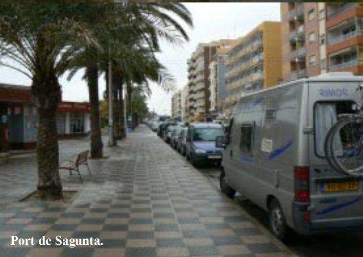
Port de Sagunta.