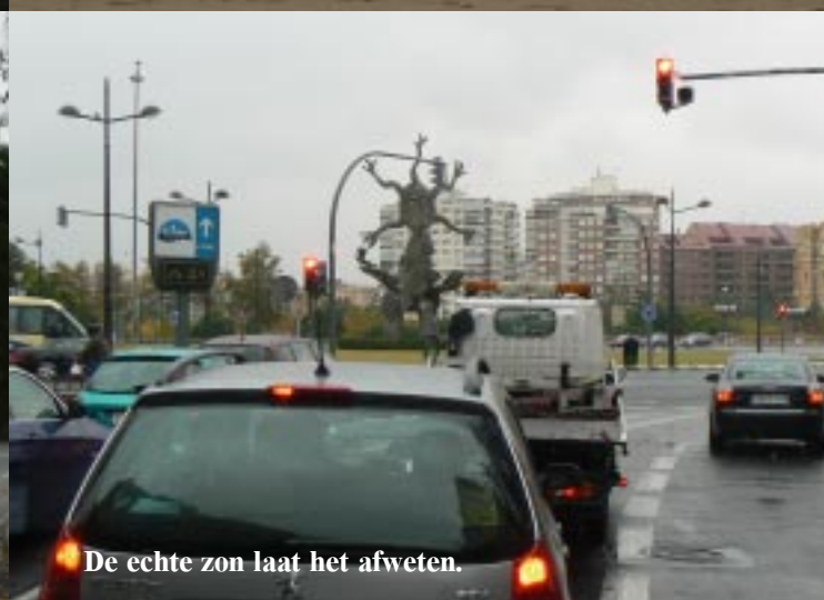
De echte zon laat het afweten.