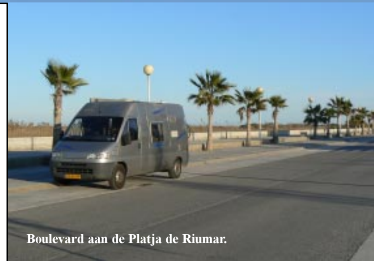
Boulevard aan de Platja de Riumar.

We rijden door naar Riumar, waar we Zippy neerzetten aan het strand, waar we een van de 4 fietstochten gaan maken.