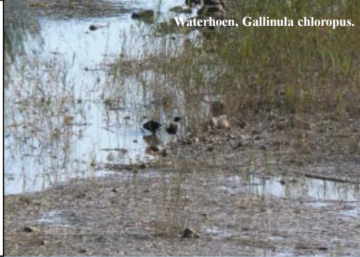
Waterhoen, Gallinula chloropus .

Een internetzaak is simpel gevonden. Tineke load haar verhaal up en E-mailt de verzekeringsbrief. Verder gaat er een machtiging naar Niels om de ANWB te betalen. (Volgend jaar ook maar automatisch maken.)