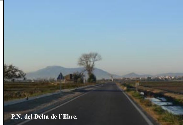
P.N. del Delta de l'Ebre.

De eerste indruk daar is zeer goed. We zien uitgestrekte rijstvelden met grote aantallen reigers, meeuwen en sternes. Steevast vliegen ze voor auto's op de smalle wegen op en altijd (wat reigers nu eenmaal doen) voor het gevaar uit. Dat resulteert in een fiks aantal platgereden exemplaren. Het is grandioos weer met een strak blauwe lucht en weinig wind.