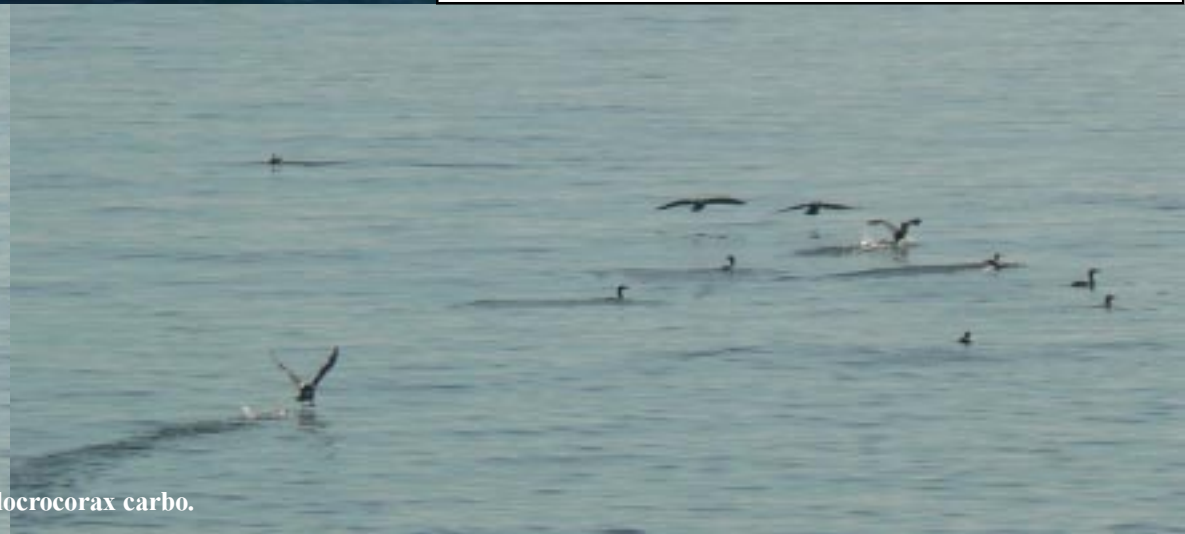
Aalscholver, Phalacrocorax carbo .