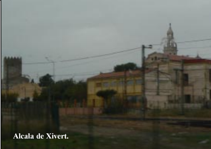
Alcala de Xivert.

Onderweg komen we door uitgestrekte sinaasappelboomgaarden. Geen wonder want we zijn al in de Comunidad Valenciana. Toch een vrolijk accent op deze grijze dag. Eenmaal op weg zijn we blij dat we er eigenlijk niet meer uit hoeven. We tanken bij een Sagas-pomp de goedkoopste tot nu toe. (*0,979/l) We passeren Alcala de Xivert om 10.35.