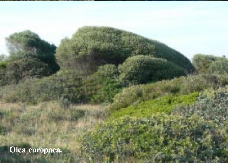
Olea europaea .