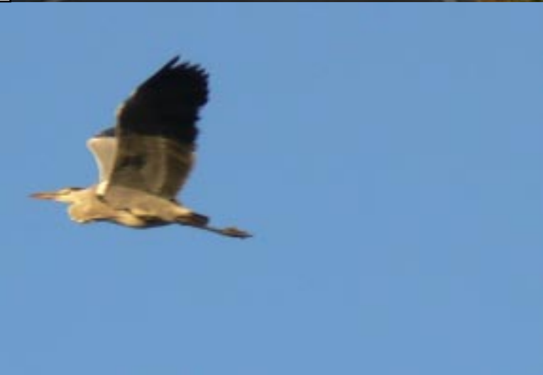
Blauwe reiger, Ardea cinerea .