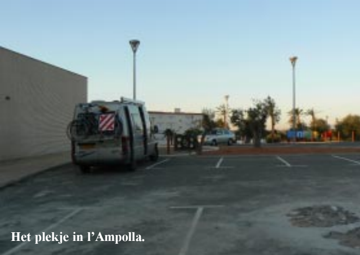
Het plekje in l'Ampolla.