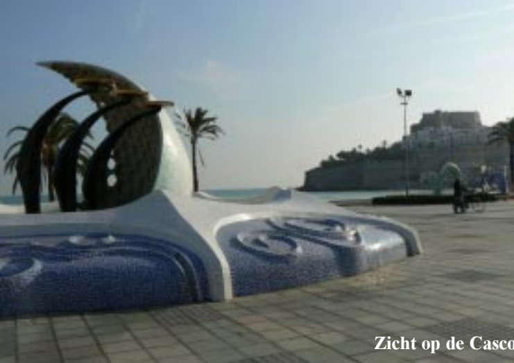
Zicht op de Casco Antiguo van Peñíscola.