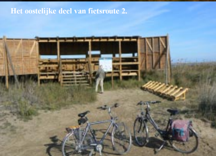
Het oostelijke deel van fietsroute 2.

In Deltebre la Cava gaan we eerst wat boodschappen doen bij de MAXI DIA %. We rijden een keer door deze stad om een wasserette te vinden, maar moeten tot 10 uur wachten alvorens de info van het Eco-museum open gaat. Daar krijgen we het adres van een wasserij. Vervolgens leveren we daar voor twee machines was in. Om 20.00 kunnen we het weer ophalen. We zien aan de doorgaande weg een Asiastore, waar we een leesbril voor mij vinden en lepels, vorken en messen van een stevig model.