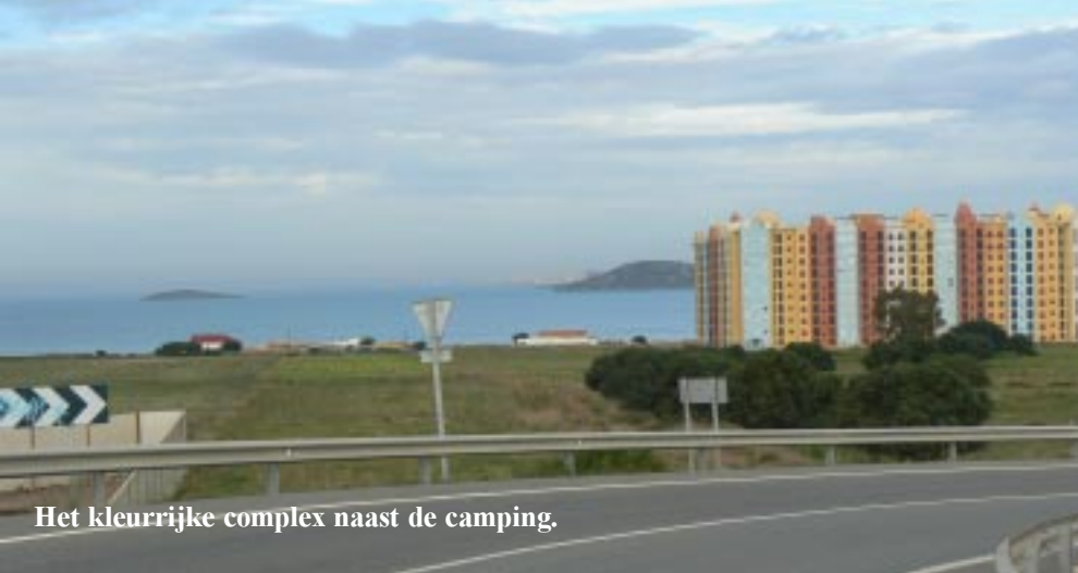
Het kleurrijke complex naast de camping.