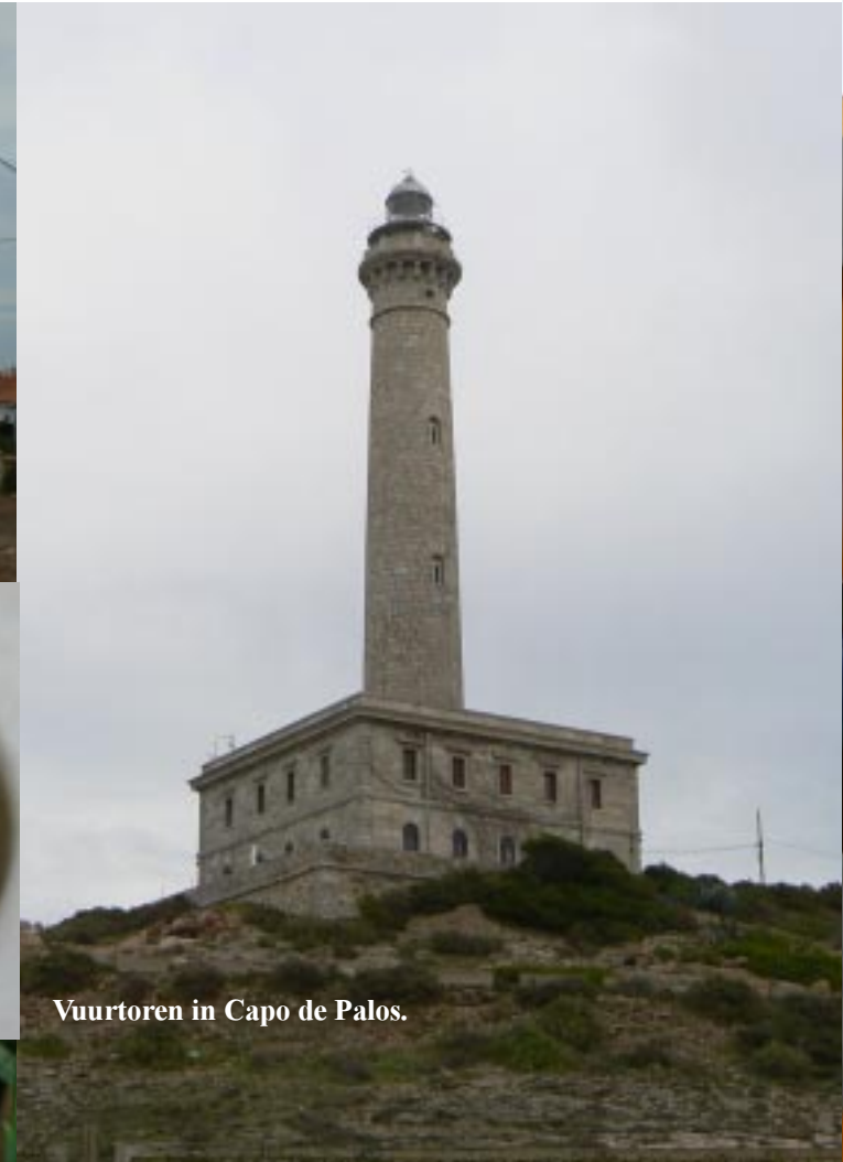
Vuurtoren in Capo de Palos.