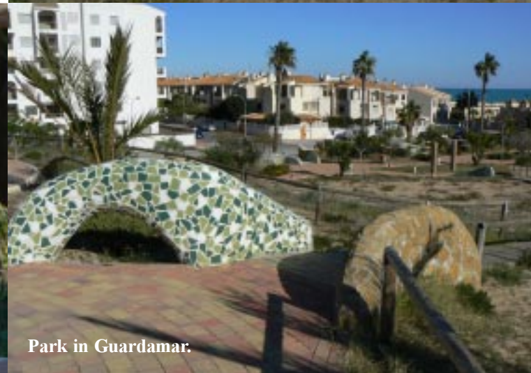
Park in Guardamar.