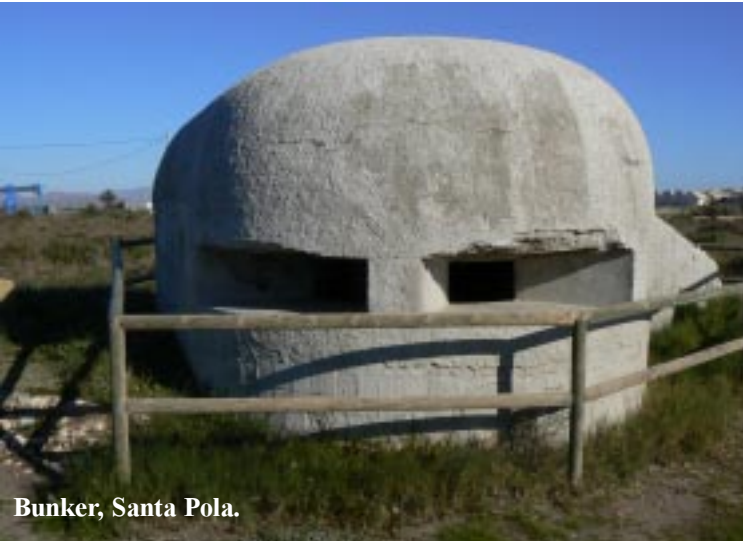
Bunker, Santa Pola.