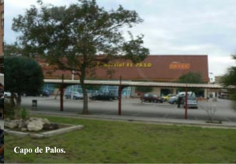
Capo de Palos.