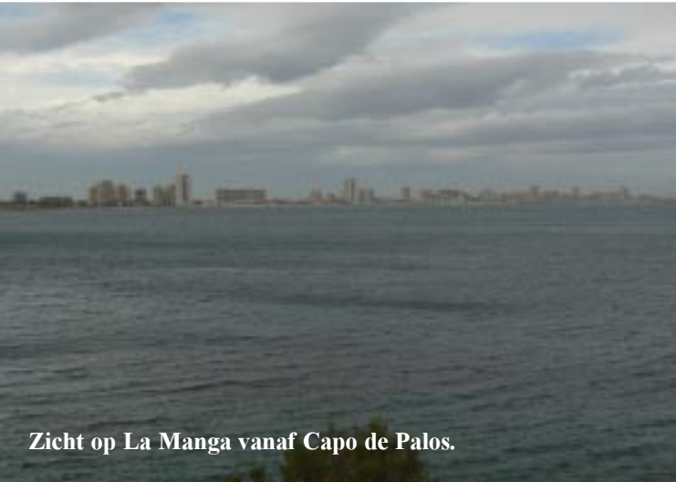
Zicht op La Manga vanaf Capo de Palos.