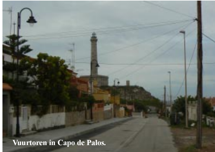
Vuurtoren in Capo de Palos.

Ondanks dat voor de cache bij de vuurtoren een verkeerde coördinaat was opgegeven vinden we hem toch. Dit aan de hand van een getekende copy van een spoiler. Op de parkeerplaats staan diverse campers. Inderdaad een mooi plekje. Misschien nog iets voor over enkele dagen?