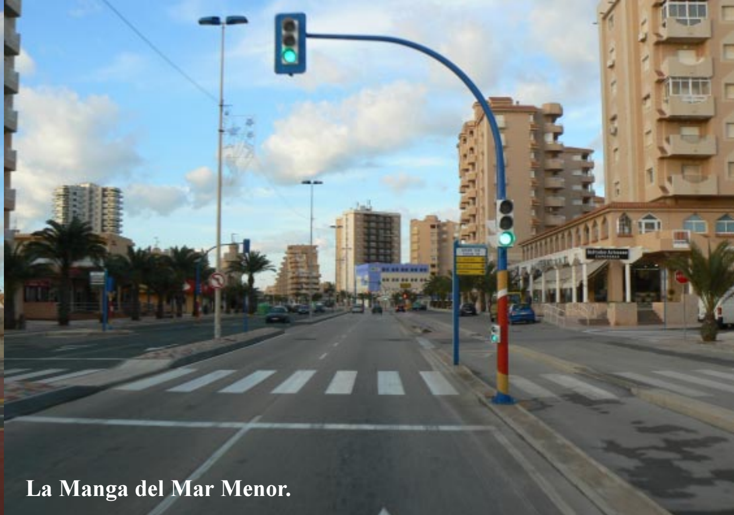
La Manga del Mar Menor.