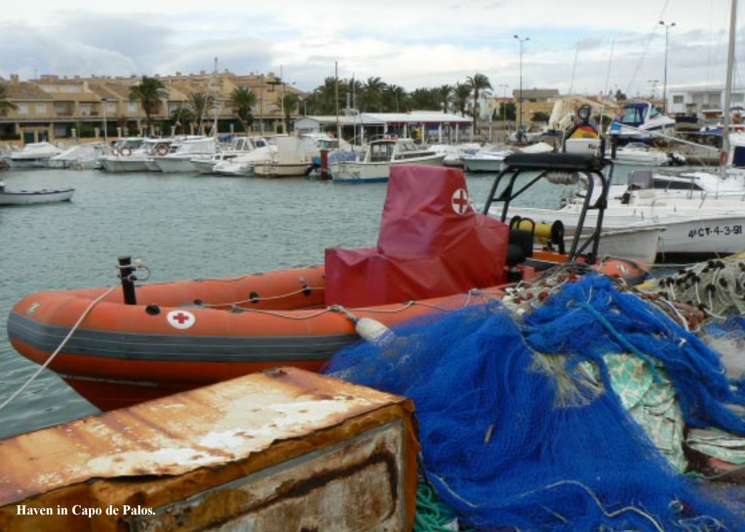
Haven in Capo de Palos.

Dan gaan we op zoek naar een supermarkt en verzeilen zo op een weekmarkt in La Unión. Een lange straat met aan twee kanten kramen. Hoofdzakelijk kleding, schoeisel, en tassen. Ik koop er 3 onderbroeken. Een nieuwe broek in mijn maat is er helaas niet. (Gisteren was de zoldering uit een van mijn broeken gegaan.) Diverse verkopers pakken al weer in omdat hun kraam op een open stuk staat weg te waaien. We doen uiteindelijk uitgebreid boodschappen in Capo de Palos en gaan in dat dorp ook bij de haven en de vuurtoren kijken.