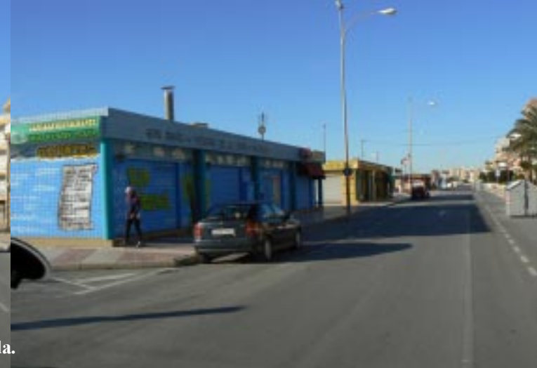
Gesloten uitspanningen langs de weg naar de Salina's, Santa Pola.