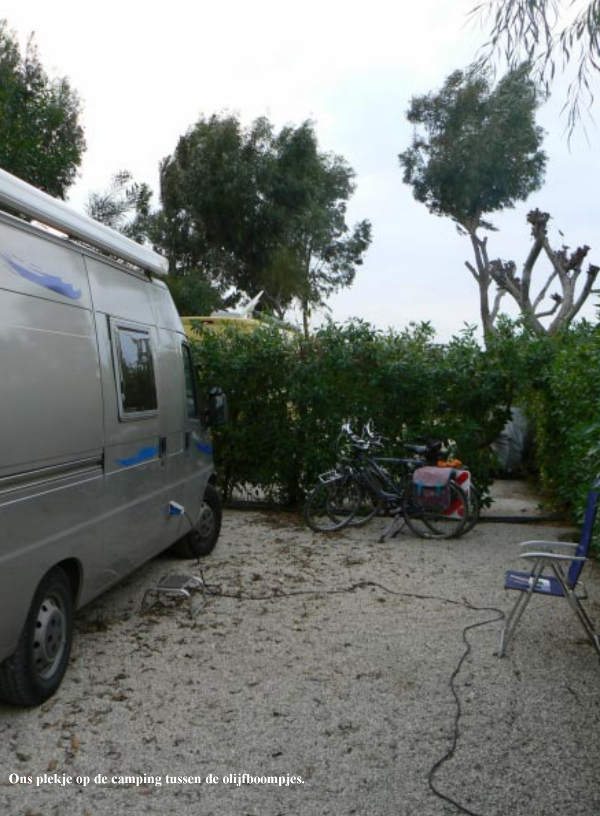
Ons plekje op de camping tussen de olijfboompjes.