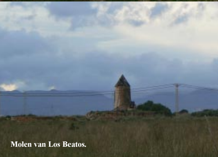
Molen van Los Beatos.

22-12-2009. Los Beatos - La Unión - Cabo de Palos.