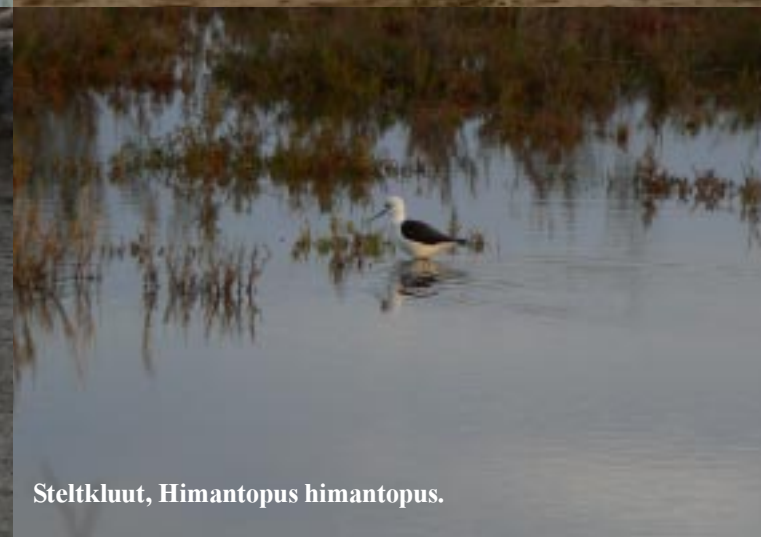
Steltkluut, Himantopus himantopus .