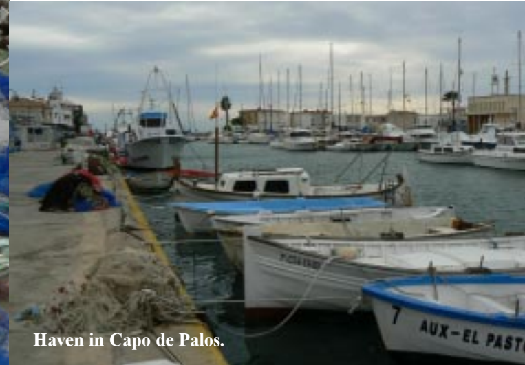
Haven in Capo de Palos.

Dan gaan we op zoek naar een supermarkt en verzeilen zo op een weekmarkt in La Unión. Een lange straat met aan twee kanten kramen. Hoofdzakelijk kleding, schoeisel, en tassen. Ik koop er 3 onderbroeken. Een nieuwe broek in mijn maat is er helaas niet. (Gisteren was de zoldering uit een van mijn broeken gegaan.) Diverse verkopers pakken al weer in omdat hun kraam op een open stuk staat weg te waaien. We doen uiteindelijk uitgebreid boodschappen in Capo de Palos en gaan in dat dorp ook bij de haven en de vuurtoren kijken.