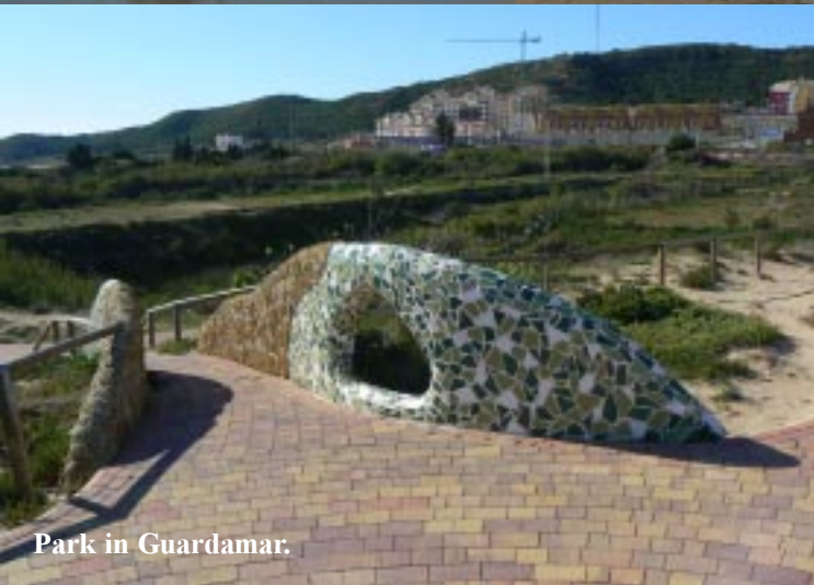
Park in Guardamar.