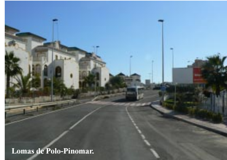
Lomas de Polo-Pinomar.

We zoeken de zee weer op via straten door villawijken. De kust bestaat uit stenen plateau's en kliffen. Dat ziet er uiteraard heel aardig uit. Daar het al weer een uur is geweest, houden we er onze lunch. Binnen wel te verstaan want de wind is ijzig! Daar kan nu zelfs de zon niet tegenop. Dan rijden we via een wirwar van éénrichtingswegen in Torrevieja naar Rio Mar. Heel leuke camperplekjes zien we daar, waar dan ook diverse campers staan. Maar de WC is aardig vol en die moeten we eerst zien te legen! Opnieuw geklooi met éénrichtsverkeer. De IGO/MIO wijst ons stevast de verboden richting in en dus moeten we het zelf maar uitzoeken.