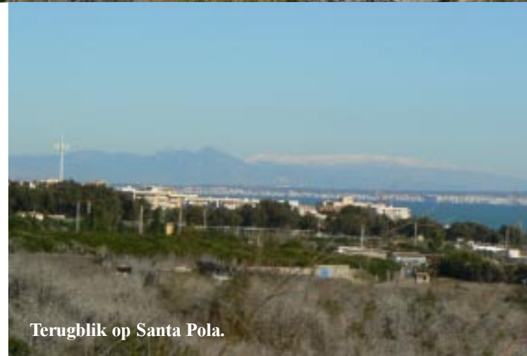
Terugblik op Santa Pola.