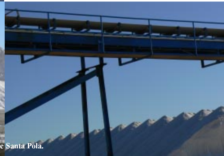
Salinas de Santa Pola.