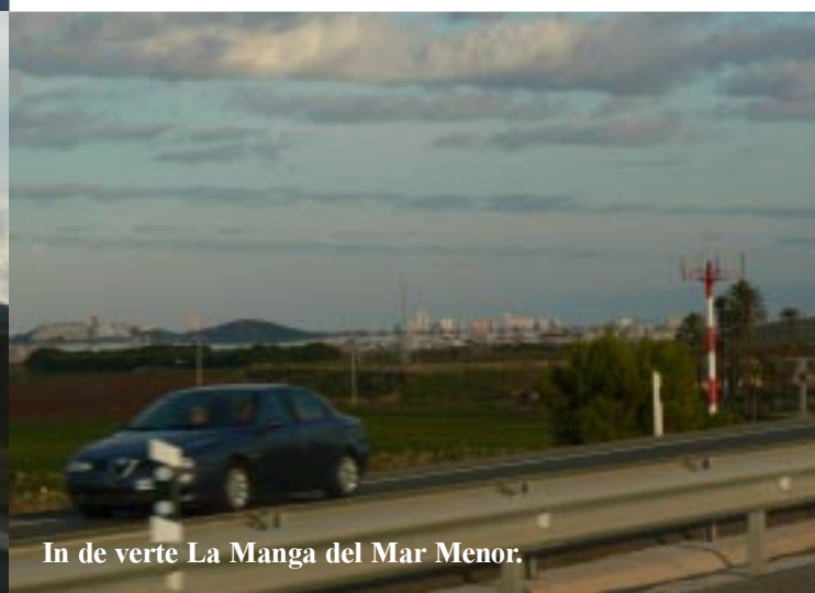
In de verte La Manga del Mar Menor.

We ronden vervolgens het Mar Menor tot ver in La Manga del Mar Menor. Grandiose plaatjes krijgen we te zien doordat de laagstaande zon de hoge flatgebouwen op de "dijk" tussen zee en Mar Menor schitterend belicht. Maar ja wij zitten even op een snelweg zonder stopmogelijkheid. En foto's naar links maken in de auto is veel lastiger dan vooruit of naar rechts. De ANWB-campinggids zegt dat we Salida 15 moeten hebben voor camping La Manga. Maar de afritten blijken (achteraf gezien) omgenummerd te zijn. Het is nu no 11. Verder heeft men in La Manga zelf ook wegen met Salida 1-60+ nummers. Tegen zessen in de schemering rijden we dan de camping op. 's Avonds gaan we er in het restaurant het dagmenu eten. •12 p.p. met een fles rode wijn erbij!