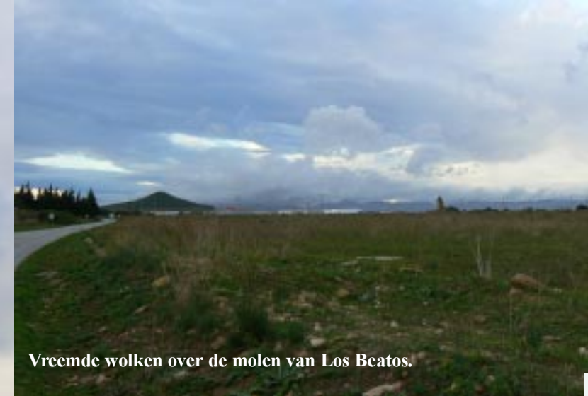
Vreemde wolken over de molen van Los Beatos.