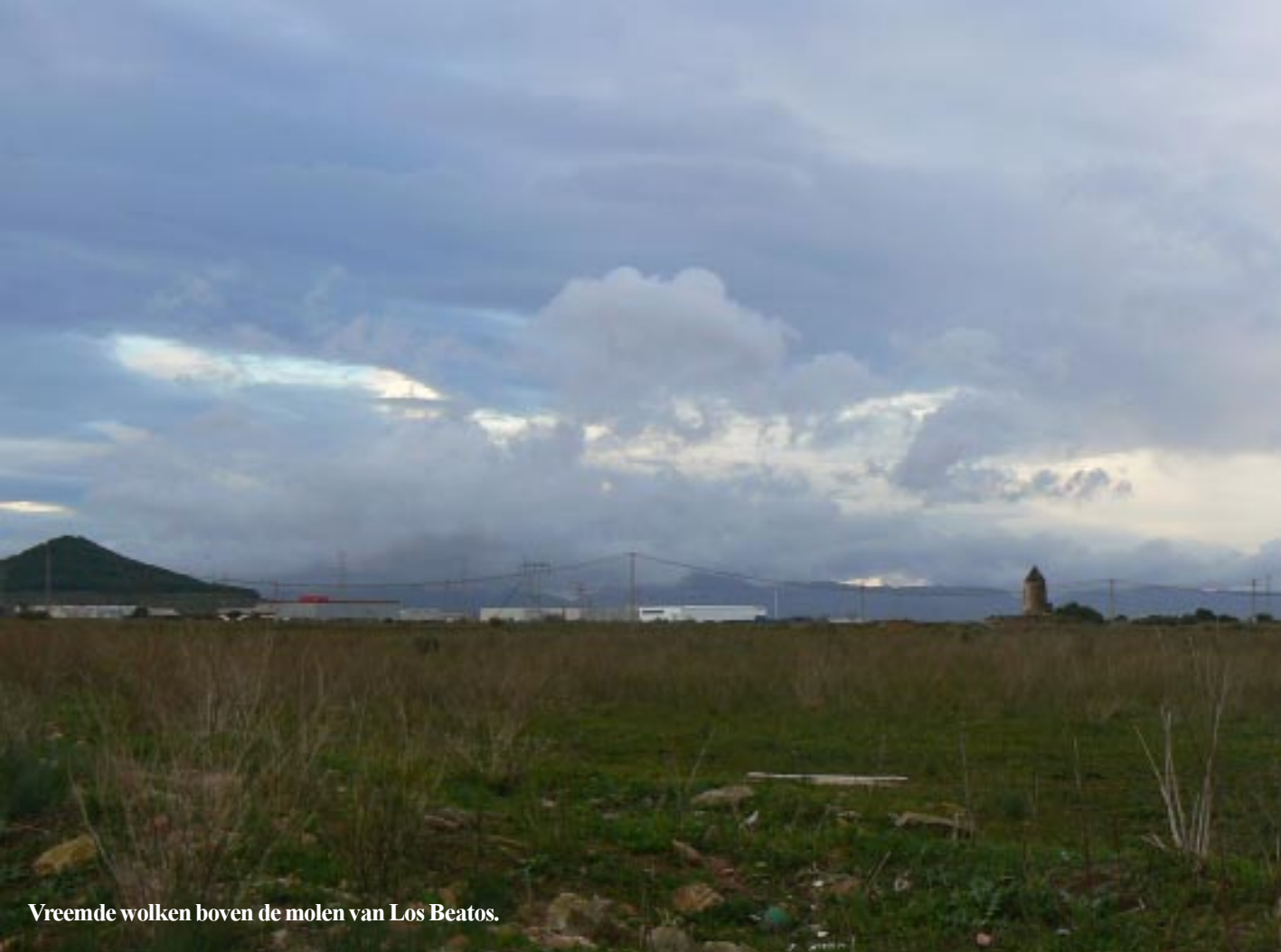
Vreemde wolken boven de molen van Los Beatos.