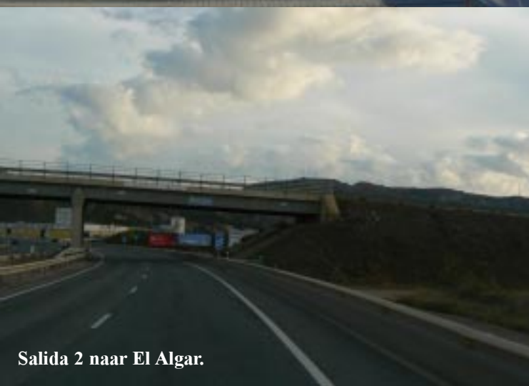
Salida 2 naar El Algar.