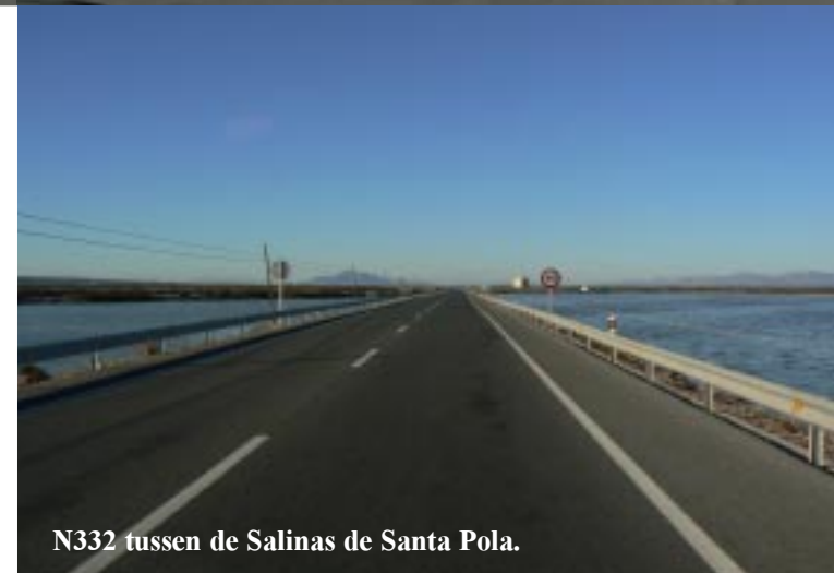
N332 tussen de Salinas de Santa Pola.

Dan gaat het over de N332 tussen de Salinas door.