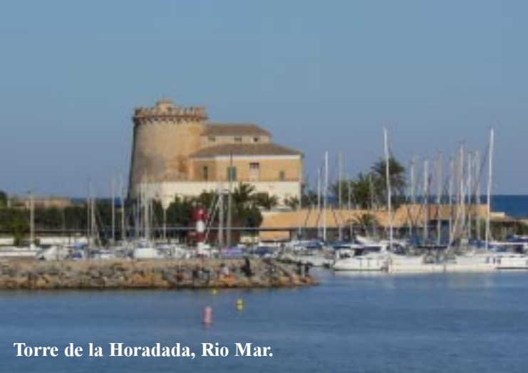
Torre de la Horadada, Rio Mar.