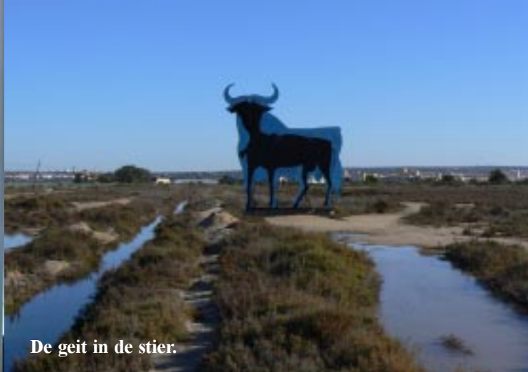
De geit in de stier.

La Torre principal de Juan de la Torre, está emplazada en un lugar excepcional, en uno de los lagos del Parque Nacional de las Salinas de Santa Pola, que alberga diversos ambientes: los ambientes más salinos, cercanos al mar, los salinos de agua dulce, predominantemente inundados y los ambientes de humedad y de alta salinidad. Los ambientes más salinos son los ambientes de formación que siguen a contar varios millones de años. También la presencia del Lago de Juan de la Torre, la Granja de la Granja, el Charco de la Granja, el Charco de la Granja, el Charco de la Granja y el Charco de la Granja.