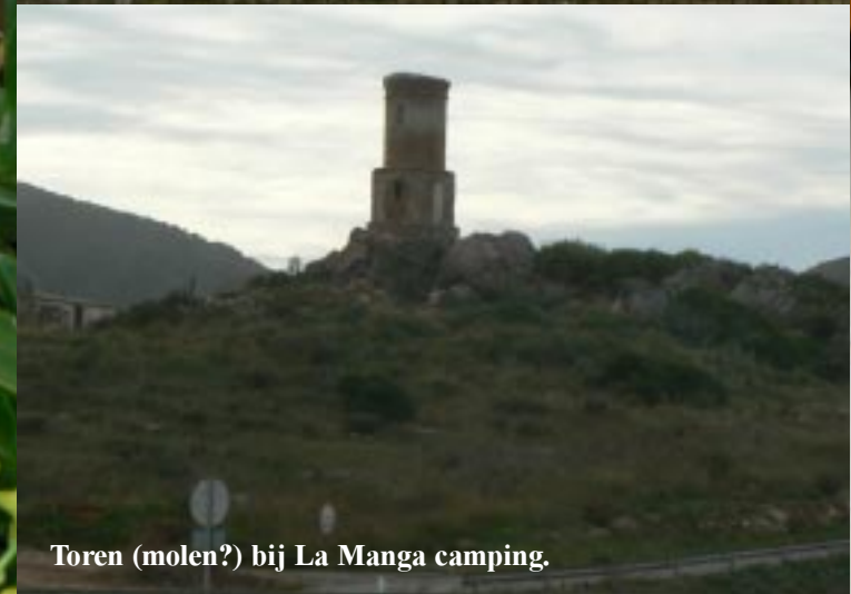
Toren (molen?) bij La Manga camping.