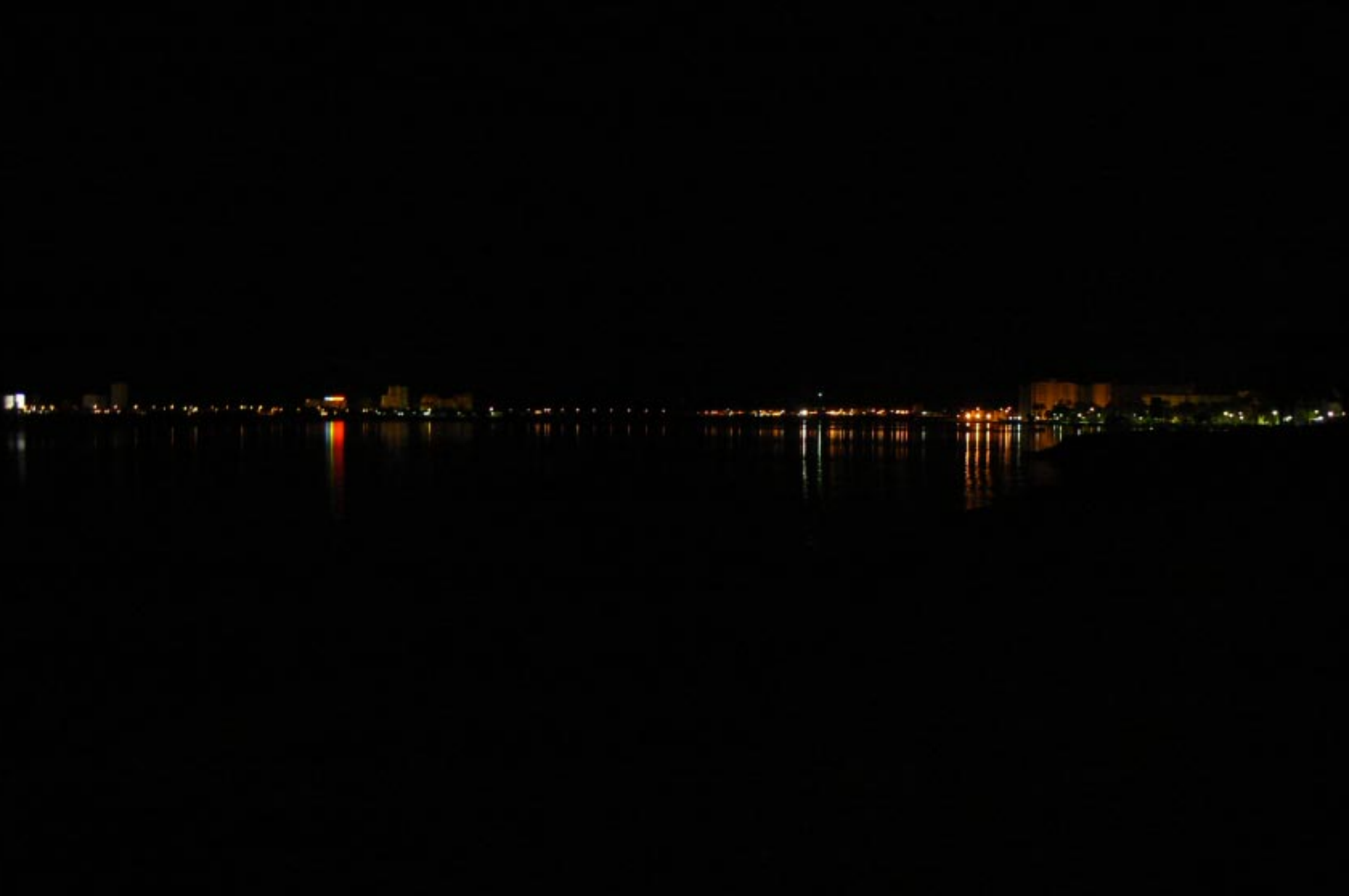
In de verte La Manga del Mar Menor.