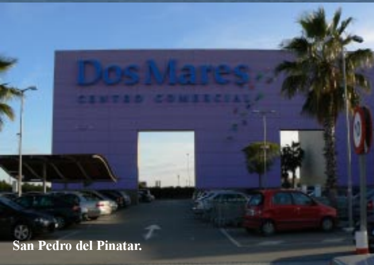
San Pedro del Pinatar.

In El Mojón vinden we geen cache. Nu omdat we geen zin hebben natte voeten te halen onder een lage brug. Een brug waar zo te zien vrijwel nooit water onderstaat. Net buiten San Pedro del Pinatar doen we tegen vier uur in een groot winkelcentrum enkele boodschappen. We rijden om het Mar Menor heen, kijken even naar een cache bij Los Alcázares. Maar het pad door het riet daar is ook al verzopen.