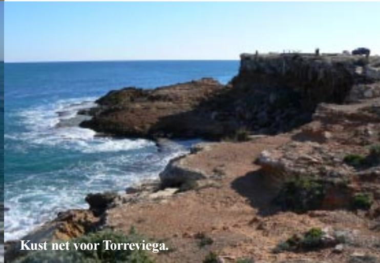
Kust net voor Torrevieja.