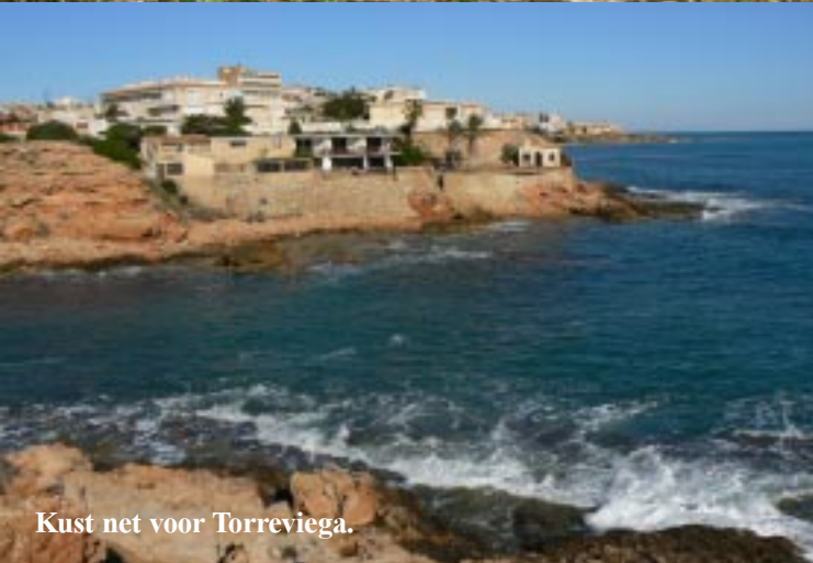
Kust net voor Torrevieja.