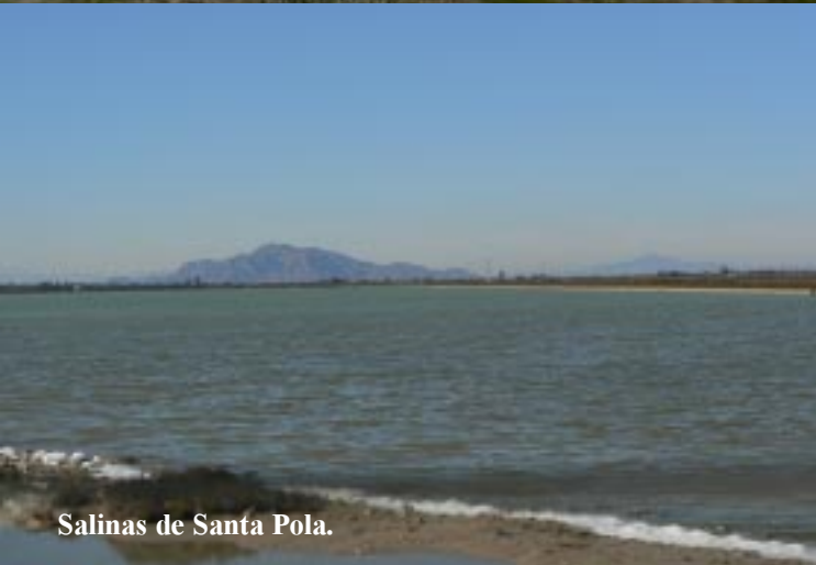
Salinas de Santa Pola.

Een 2e cache ligt een eindje terug bij een bunker aan het strand. Of eigenlijk zou moeten liggen, want we vinden hem evengoed niet (11.30).