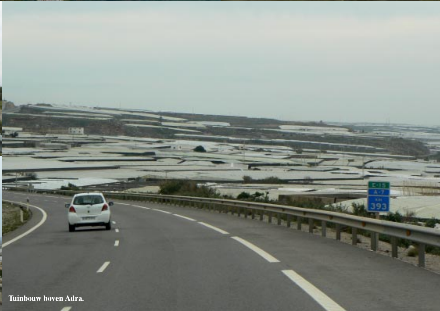
Tuinbouw boven Adra.