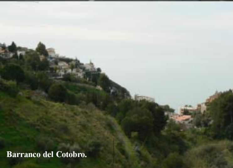
Barranco del Cotobro.