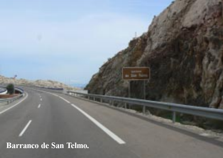
Barranco de San Telmo.