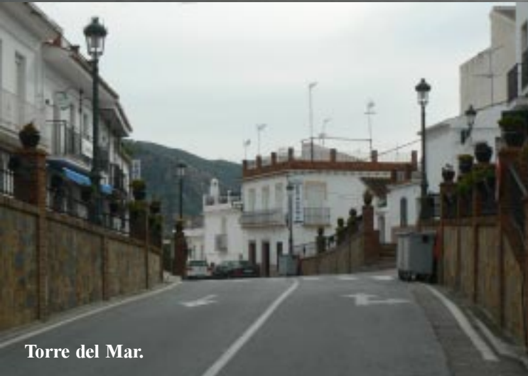
Torre del Mar.