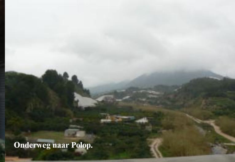
Onderweg naar Polop.

Na de lunch op het parkeerterrein van Guadaleste, dalen we in de motregen af in de richting van de kust. Zo passeren we het lelijke stadje Callosa d'en Sarría en (13.30) het heel goed uitzijende Polop. Vooral een hoge, bebouwde richel in het centrum maakt indruk.