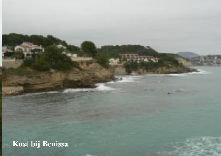
Kust bij Benissa.