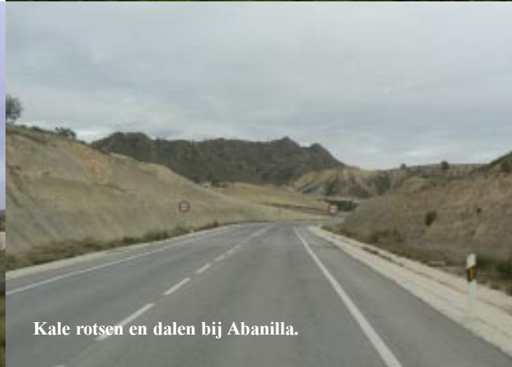
Kale rotsen en dalen bij Abanilla.