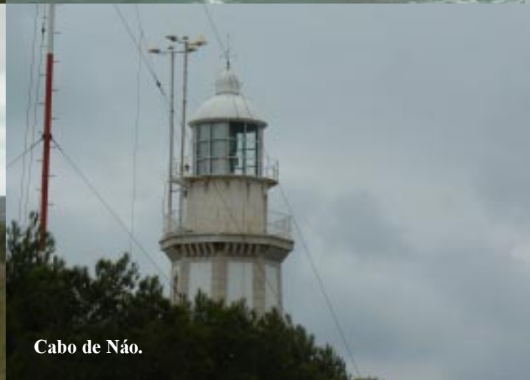
Cabo de Náo.