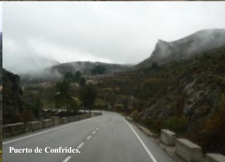
Puerto de Confrides.