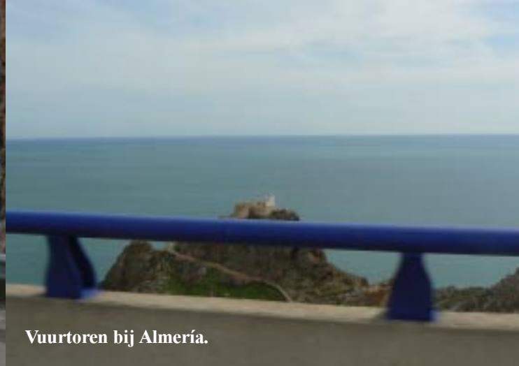
Vuurtoren bij Almería.