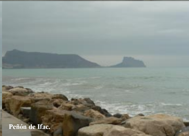
Peñón de Ifac.