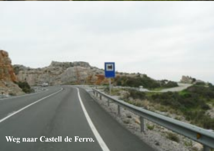
Weg naar Castell de Ferro.