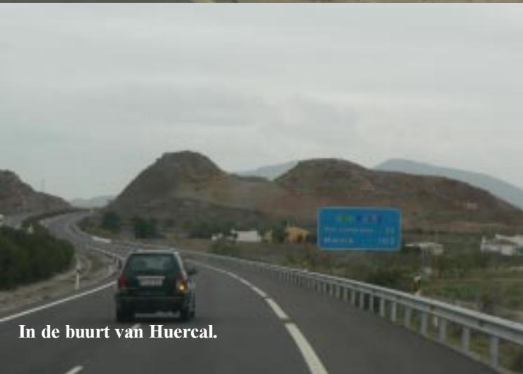
In de buurt van Huercal.