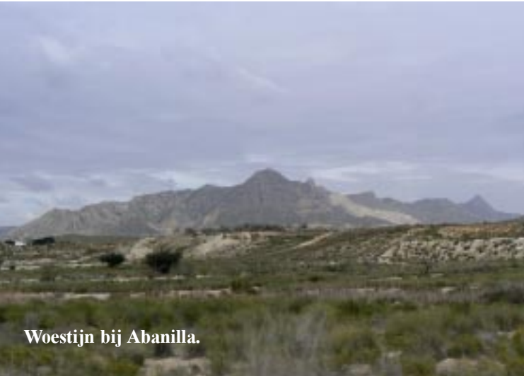
Woestijn bij Abanilla.