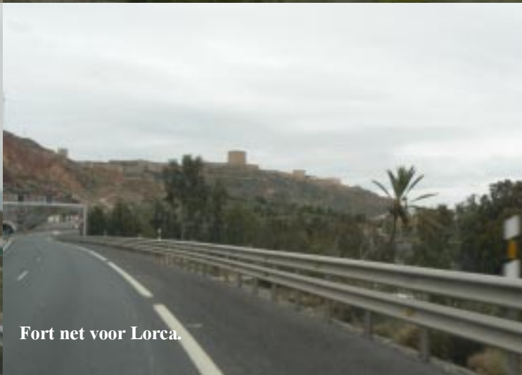
Fort net voor Lorca.