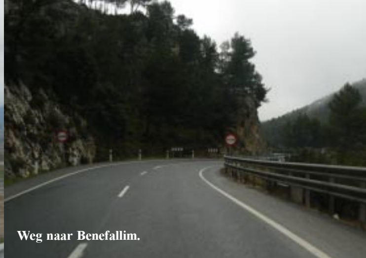
Weg naar Benefallim.