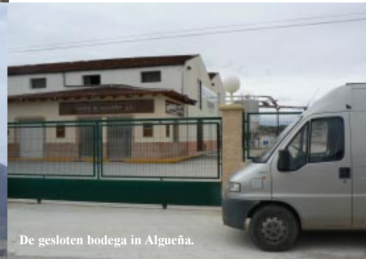
De gesloten bodega in Algueña.