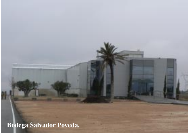
Bodega Salvador Poveda.