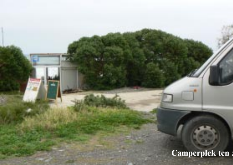
Camperplek ten zuiden van Mojacar.