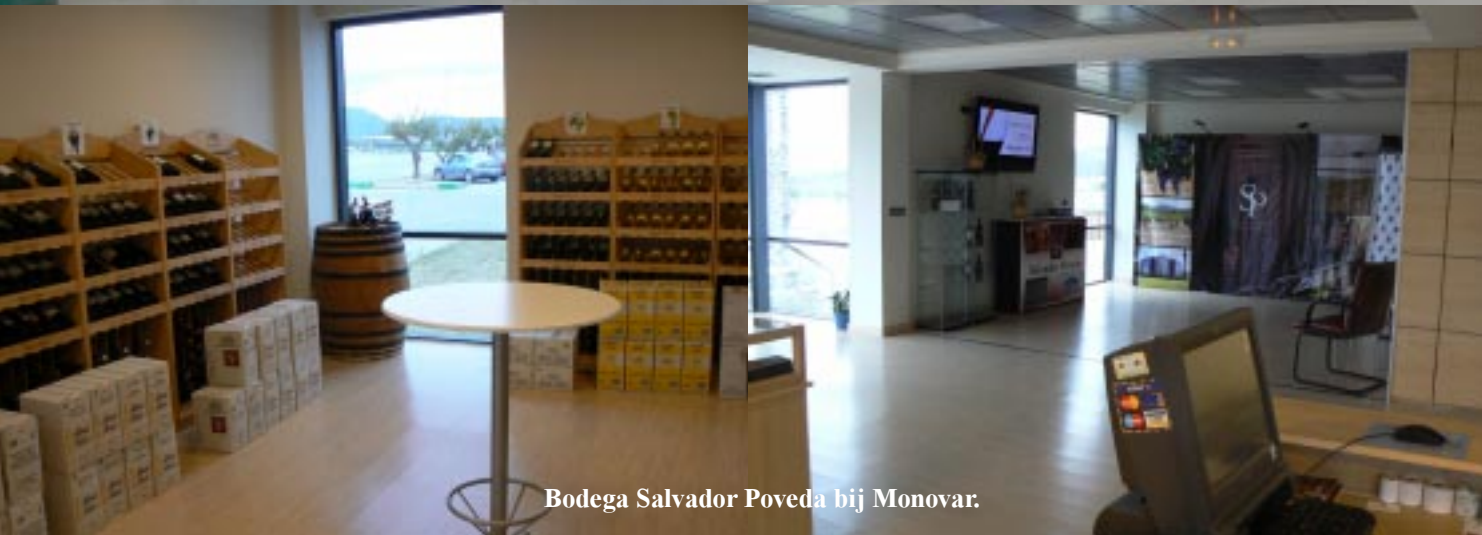
Bodega Salvador Poveda bij Monovar.

Gelukkig gaat ook hier menige zaak in drieën. Bij de Salinas in Monovar vinden we de Bodega Salvador Poveda. In het moderne kantoorgebouw zijn een tiental mannen aan het confereren en pimpelen uiteraard. Na zo'n 5 minuten komt iemand te voorschijn, van wie we hier mogen blijven vannacht. Uiteraard kunnen we ook wijn kopen. Dat worden 3 flessen, een droge en een halfdroge witte en een moscatel voor •7,--. Later op de avond wil ik een fles openen, maar moet uiteindelijk de fles door de gastgever laten openen! Zo vast zit die kurk.