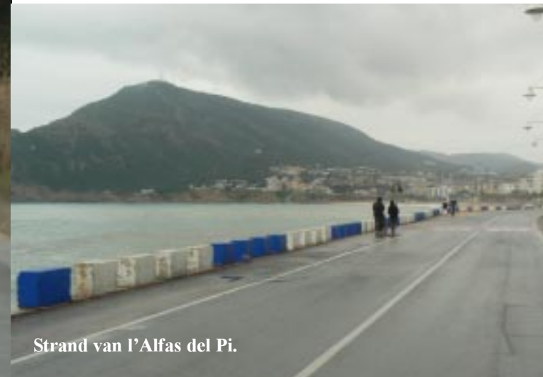
Strand van l'Alfas del Pi.

Via Altea met zijn grote koepelkerk, die van heel ver al te zien is, gaat het in 1e instantie de “verkeerde” kant langs de kust op, naar het strand van Alfàs del Pi. We vinden daar in geen van de beide plaatsen een camperplekje voor vannacht en rijden dus (de goede noordelijke kant op) naar Calp en de opmerkelijke Peñón de Ifac. De laatste lijkt een broertje van die rotspartij bij Anteguera: Peña de los Enamorados. We komen weer op bekend terrein, we waren hier al op de heenweg. Ik meen diverse gebouwen te herkennen, maar dat orthodox kerkje links had ik zeker gezien.