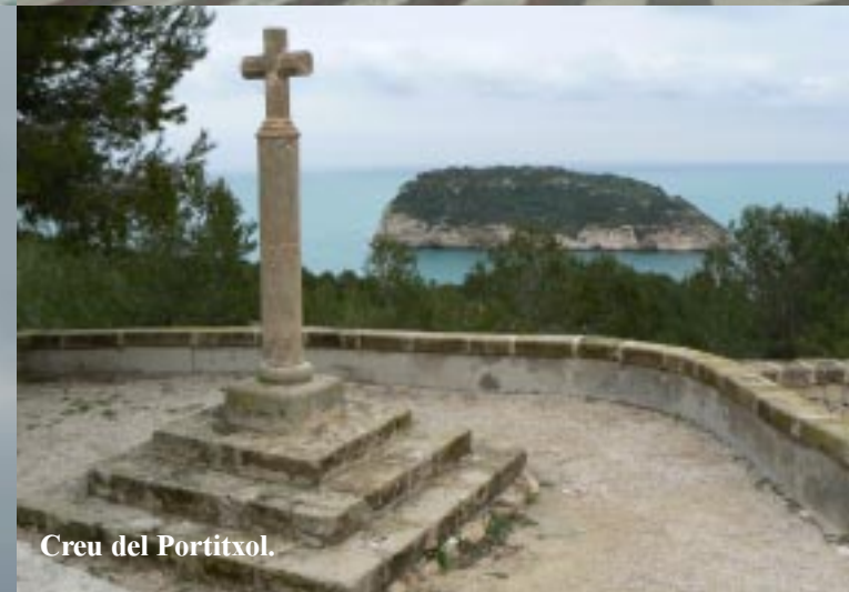
Creu del Portitxol.