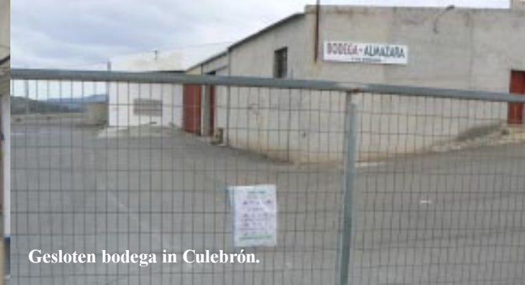
Gesloten bodega in Culebrón.

Gelukkig gaat ook hier menige zaak in drieën. Bij de Salinas in Monovar vinden we de Bodega Salvador Poveda. In het moderne kantoorgebouw zijn een tiental mannen aan het confereren en pimpelen uiteraard. Na zo'n 5 minuten komt iemand te voorschijn, van wie we hier mogen blijven vannacht. Uiteraard kunnen we ook wijn kopen. Dat worden 3 flessen, een droge en een halfdroge witte en een moscatel voor •7,--. Later op de avond wil ik een fles openen, maar moet uiteindelijk de fles door de gastgever laten openen! Zo vast zit die kurk.