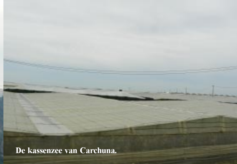
De kassenzee van Carchuna.