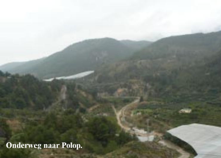
Onderweg naar Polop.