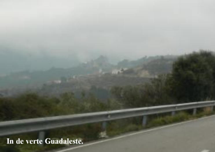
In de verte Guadaleste.