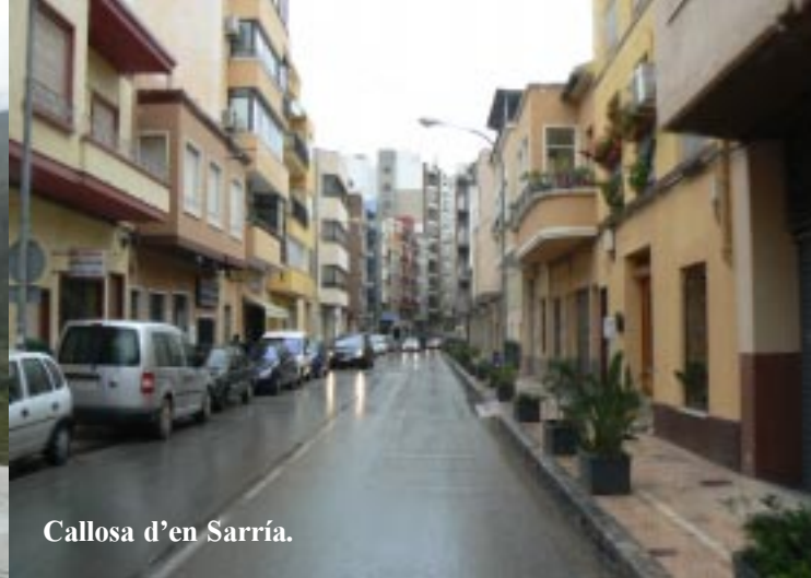
Callosa d'en Sarría.