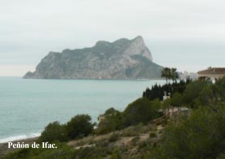
Peñón de Ifac.