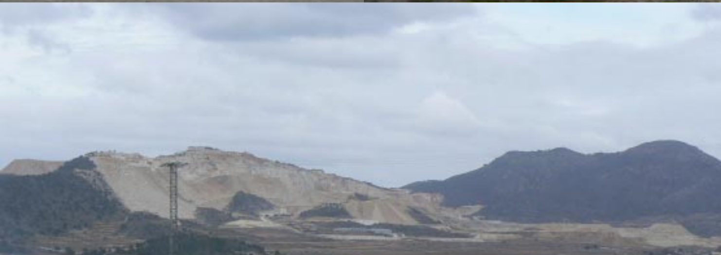
Woestijn bij Abanilla.

Via de afslag naar Abanilla gaat het een echte woestijn in. Een gebied met sterke erosie, alles is doorploegd door diepe geulen. Planten zijn schaars. Een weg in Abanilla is vanwege werkzaamheden afgesloten, zodat we via Fortuna om moeten rijden naar Pinoso en Algueña. Vanaf Rodriguillo zien we de verwachte wijngaarden. De druivenstokken zijn hier tot vrijwel op de grond weggesnoeid. Zo drastisch hebben wij dat nog nergens gezien. Het landschap ziet er nog steeds kurkdroog uit. In Algueña komen we bij de bodega van de plaatselijke cooperatie voor een gesloten hek te staan. Niemand in de verre verte te zien. Mooie camperplek is dat. Dus rijden we maar naar no2 in Culebron. Daar is het ook zo. Hier hebben ze de openingstijden op de poort gezet: Slechts enkele uren per dag.