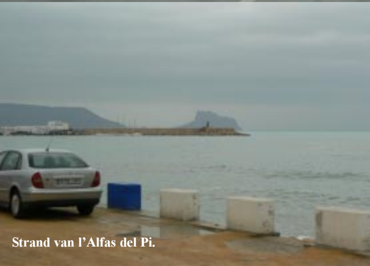
Strand van l'Alfas del Pi.