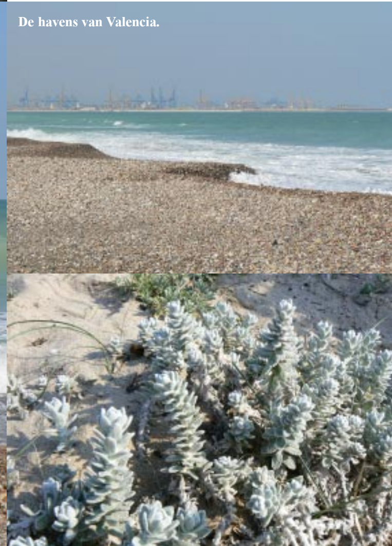
De havens van Valencia.