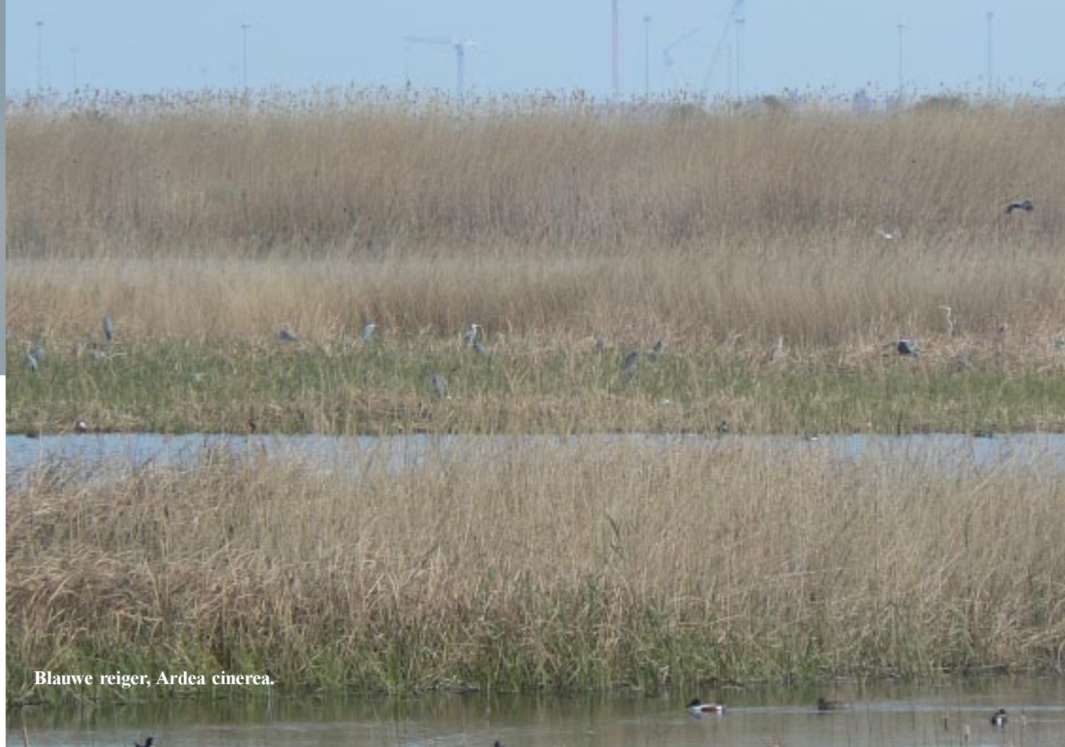
Blauwe reiger, Ardea cinerea .

Dan nog iets verder naar een volgend observatietorentje. Daar is weer zicht op enkele grotere plassen met onder andere zeer veel slobeenden en een onvoorstelbare hoeveelheid Blauwe reigers in het riet daarachter. Echt die staan daar hutje mutje op elkaar.