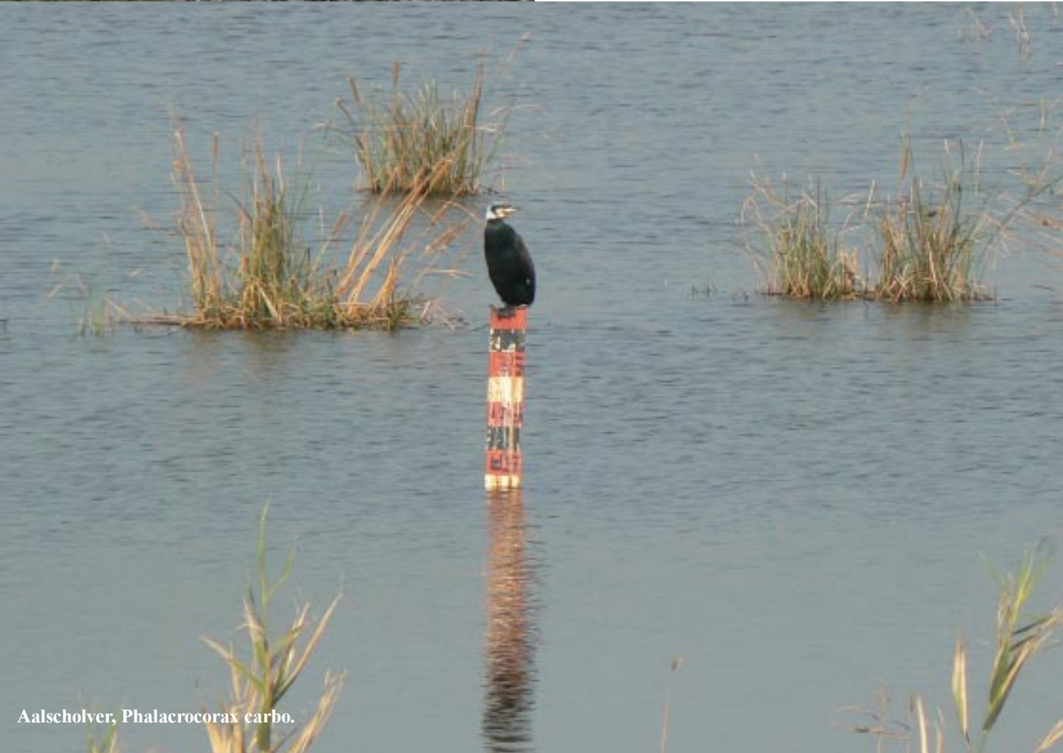
Aalscholver, Phalacrocorax carbo .

Opnieuw komen we door een cache op een onvermoed mooie plek terecht. We vinden er borden die een wandeling in en om dit moerasgebied beloven en beginnen dan ook aan de tippel. Eerst een eind langs het kiezelstrand af. Halverwege is er die cache en een observatietoren. Op de plas daar zien we slobbeenden, aalscholvers, dodaarsen, reigers en diverse kleine vogels (in het riet). De hele route is genummerd van 1 - 13. Bij 5 gaat het van de kust weg het moeras zelf in. Na een tweede observatiepost, waar minder te zien is, stuit de boardwalk op een stuk ondergelopen pad. Of eigenlijk lijkt het meer op een kanaal. Daar houdt het voor ons dus op.