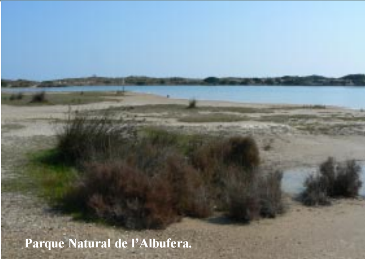
Parque Natural de l'Albufera.

De Garmin wijst ons uiteraard aan dat we moeten oversteken. Nu zetten we Zippy aan de weg bij enkele aanlegsteigers voor vissers- annex rondvaartroeboten. Een heel pittoresk plekje aan het grote meer van l'Albufera met visnetten aan palen in het water. We steken de weg over en volgen de blauwe wandelroute, die ruwweg het kanaal naar zee volgt.