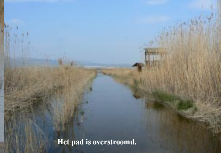
Het pad is overstroomd.