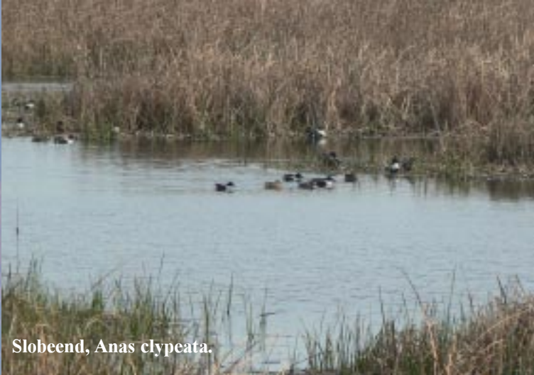
Slobeend, Anas clypeata .