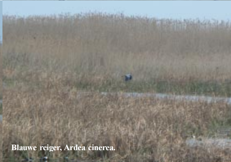
Blauwe reiger, Ardea cinerea .