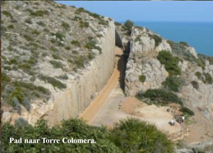
Pad naar Torre Colomera.