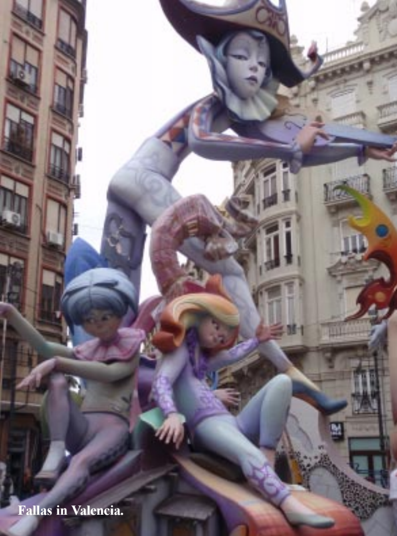
Fallas in Valencia.