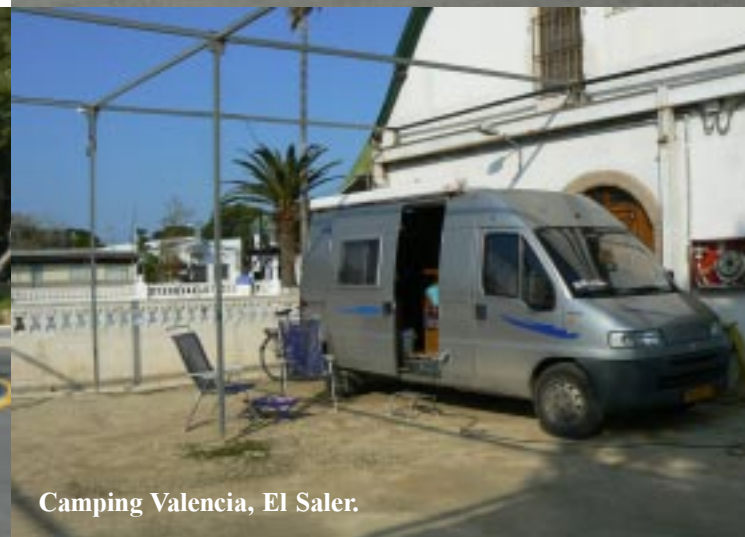
Camping Valencia, El Saler.

Op de camping (16.45) lezen we ons in voor het bezoek aan Valencia. Daar zijn de Fallas aan de gang, een grootschalig feest. We hoorden om twee uur ('s middags!) al het nodige vuurwerk, dat daar blijkbaar bij hoort. Hopelijk werkt het weer mee morgen.