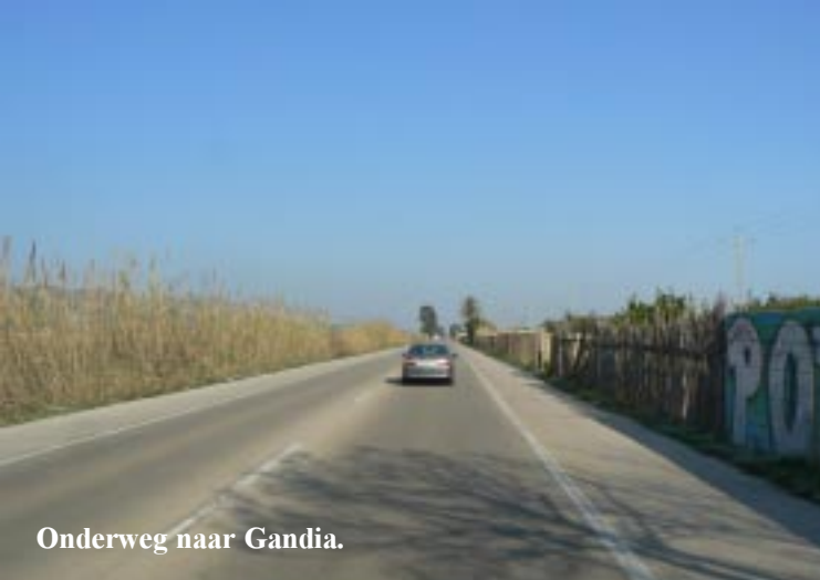
Onderweg naar Gandia.