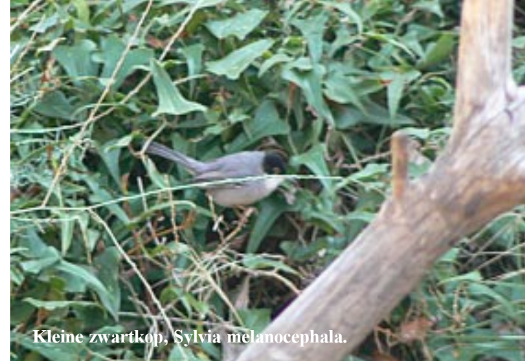
Kleine zwartkop, Sylvia melanocephala .

Via het voor ons niet interessante Benicàssim (de zee is afgeschermd door hotels en resorts) gaat het binnendoor naar de Playa de Oropesa. Hier wordt de kust weer hoog en wild. We vinden na enig zoeken naar de goede aanloop een cache bij de Torre Colomera. Vanaf de noordzijde is er een nieuw pad dwars door de rotsen heen getrokken. Diverse borden vertellen hun verhaal over de natuur hier.