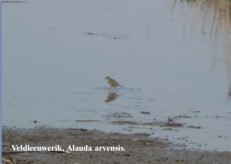
Veldleeuwerik, Alauda arvensis .