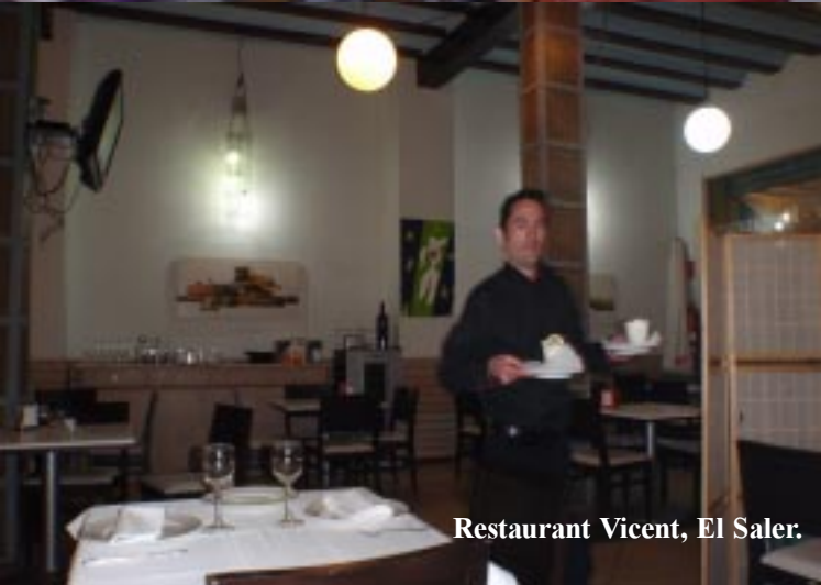
Restaurant Vicent, El Saler.

Om zes uur lopen we de 500 m naar het dorp. Onderweg jagen we een patrijs van de weg. Hij blijft aan de andere kant van de weg over het fietspad op en neer rennen. Durft blijkbaar niet het struikgewas in te duiken!