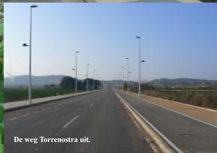
De weg Torrenostra uit.