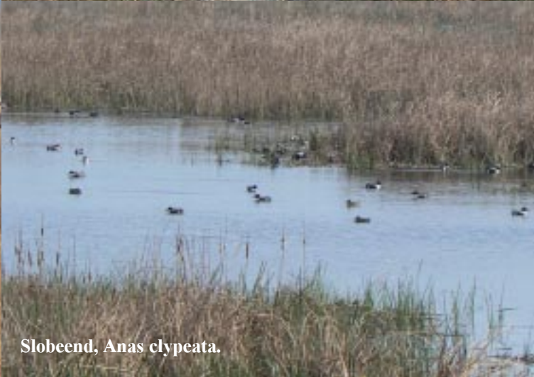
Slobeend, Anas clypeata .