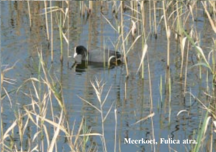
Meerkoet, Fulica atra .