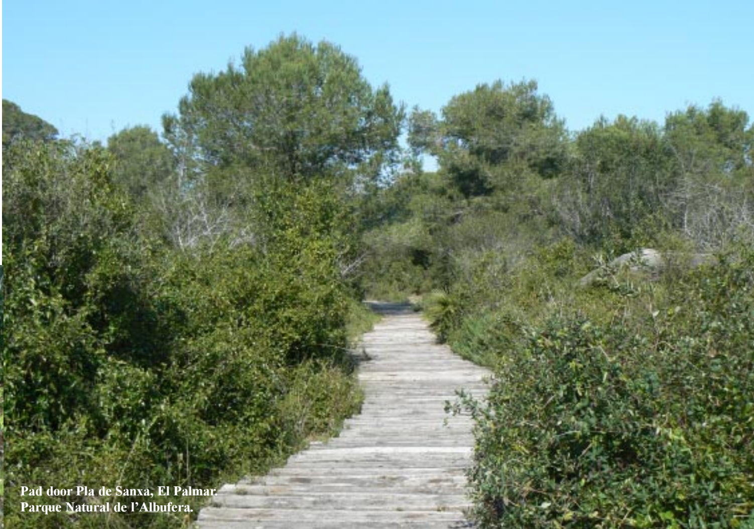
Pad door Pla de Sanxa, El Palmar. Parque Natural de l'Albufera.