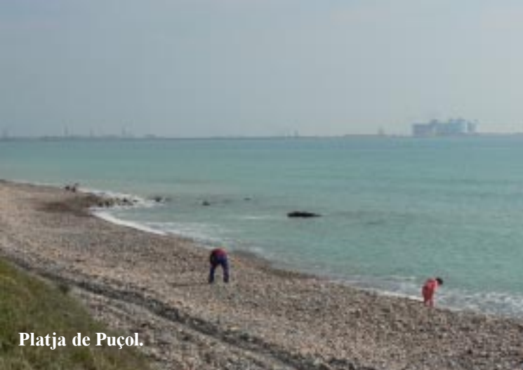
Platja de Puçol.

Opnieuw komen we door een cache op een onvermoed mooie plek terecht. We vinden er borden die een wandeling in en om dit moerasgebied beloven en beginnen dan ook aan de tippel. Eerst een eind langs het kiezelstrand af. Halverwege is er die cache en een observatietoren. Op de plas daar zien we slobbeenden, aalscholvers, dodaarsen, reigers en diverse kleine vogels (in het riet). De hele route is genummerd van 1 - 13. Bij 5 gaat het van de kust weg het moeras zelf in. Na een tweede observatiepost, waar minder te zien is, stuit de boardwalk op een stuk ondergelopen pad. Of eigenlijk lijkt het meer op een kanaal. Daar houdt het voor ons dus op.