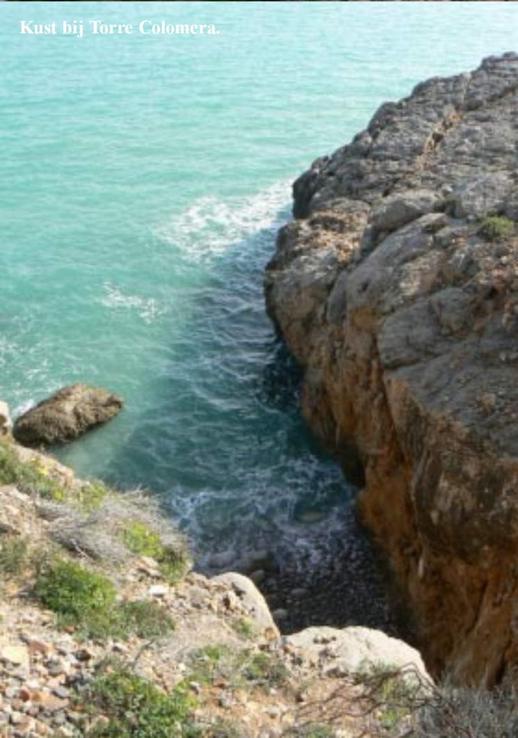
Kust bij Torre Colomera.