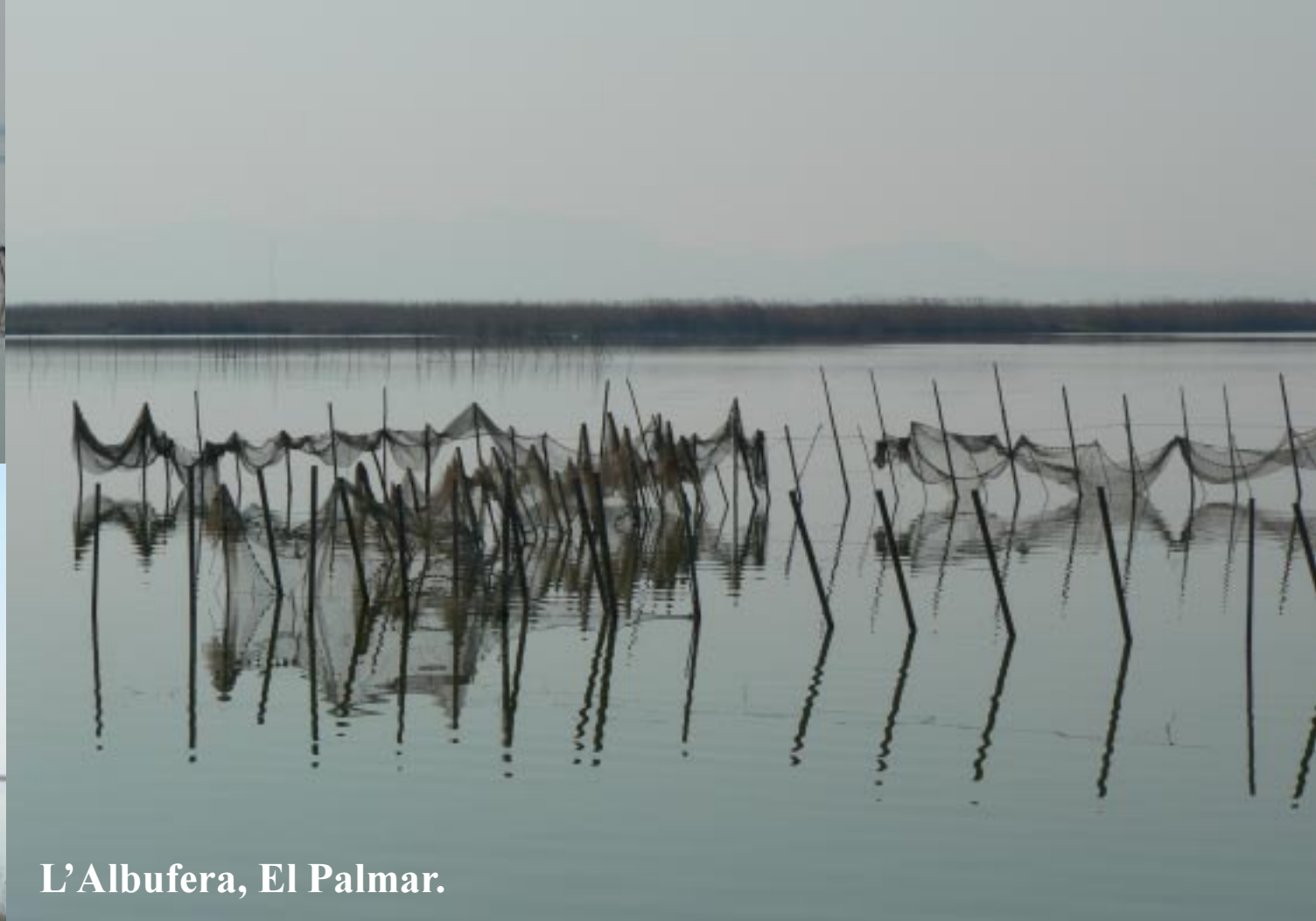
L'Albufera, El Palmar.

De Garmin wijst ons uiteraard aan dat we moeten oversteken. Nu zetten we Zippy aan de weg bij enkele aanlegsteigers voor vissers- annex rondvaartroeboten. Een heel pittoresk plekje aan het grote meer van l'Albufera met visnetten aan palen in het water. We steken de weg over en volgen de blauwe wandelroute, die ruwweg het kanaal naar zee volgt.