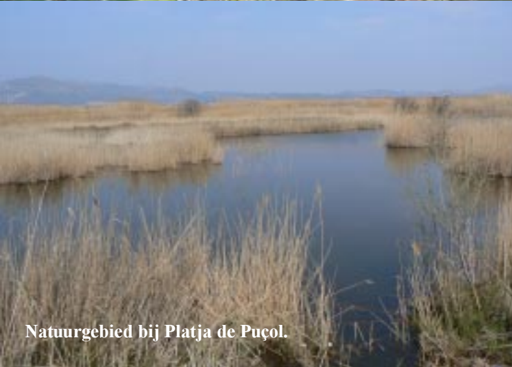
Natuurgebied bij Platja de Puçol.