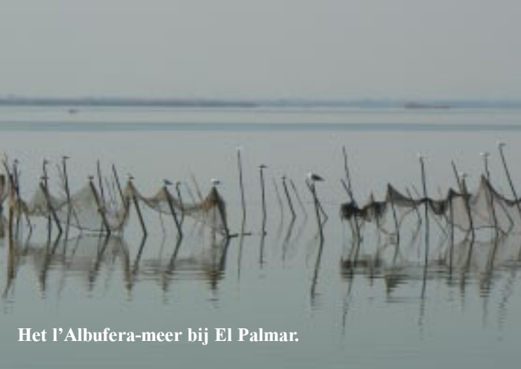
Het l'Albufera-meer bij El Palmar.