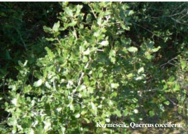
Kermeseik, Quercus coccifera .

Onder een brug in de boardwalk daar vinden we de cache. Dan lopen we die blauwe route af tot een groot strandmeer. Iets zuidelijker volgen we vervolgens de “botanische” groene route naar het uitgangspunt terug.