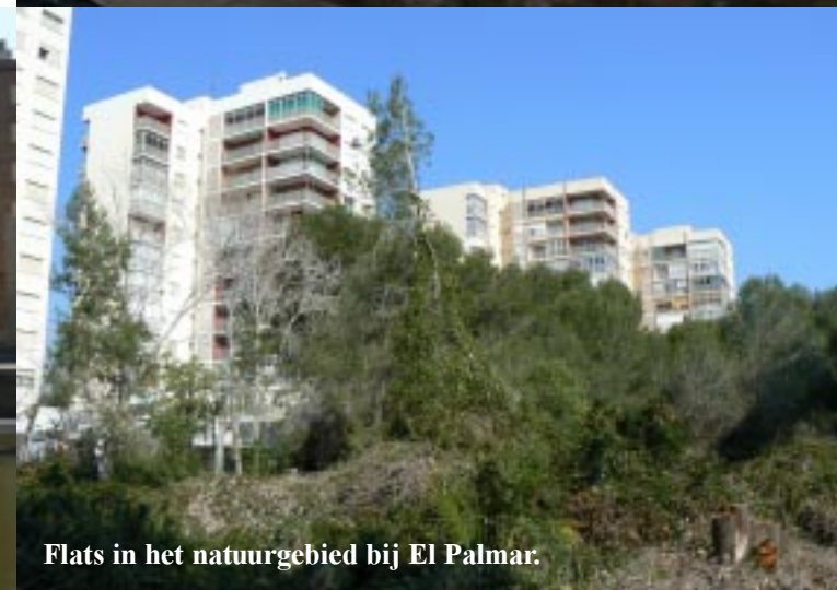
Flats in het natuurgebied bij El Palmar.