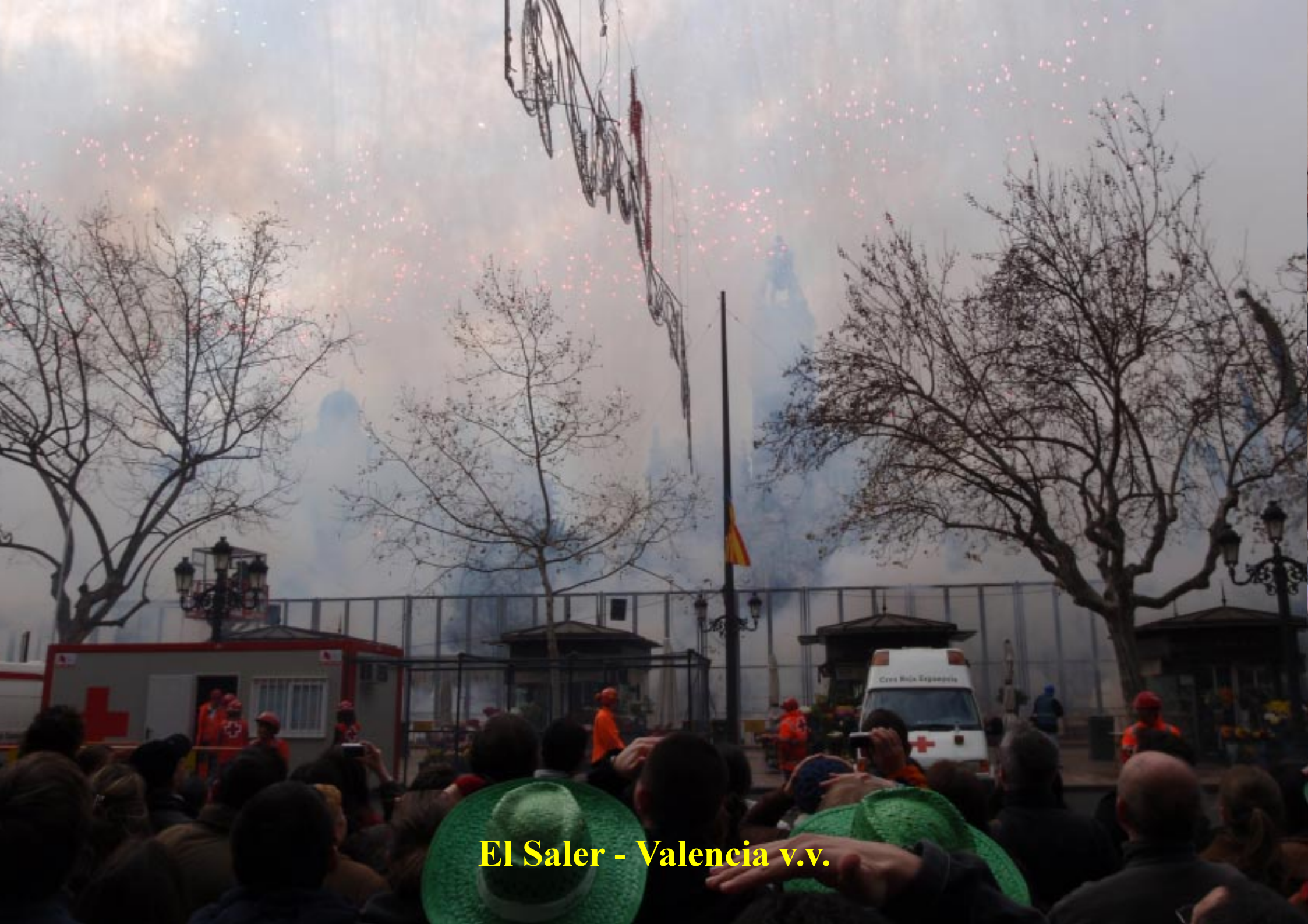
El Saler - Valencia v.v.