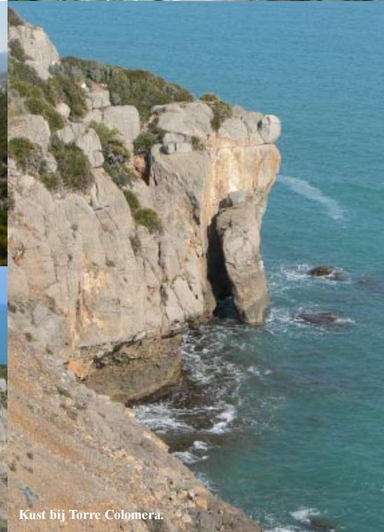
Kust bij Torre Colomera.