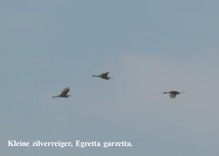
Kleine zilverreiger, Egretta garzetta .

Dan nog iets verder naar een volgend observatietorentje. Daar is weer zicht op enkele grotere plassen met onder andere zeer veel slobeenden en een onvoorstelbare hoeveelheid Blauwe reigers in het riet daarachter. Echt die staan daar hutje mutje op elkaar.