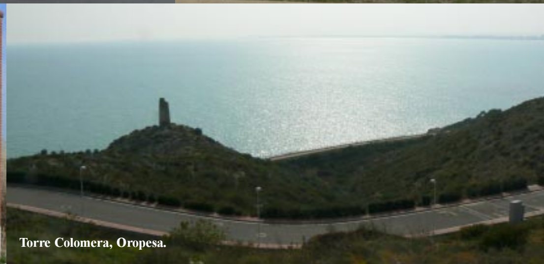
Torre Colomera, Oropesa.