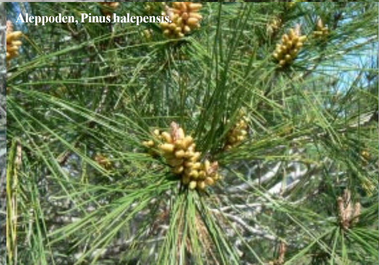
Aleppoeden, Pinus halepensis .