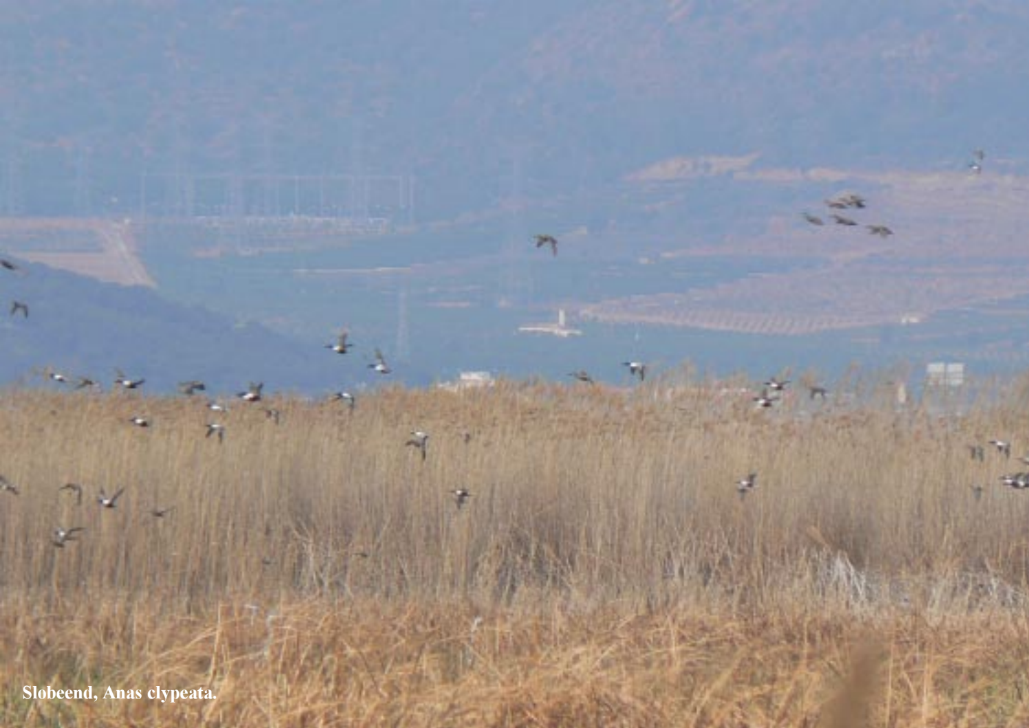
Slobeend, Anas clypeata .