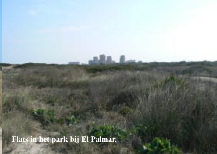
Flats in het park bij El Palmar.

Bij de flats daar draaien we weer om. We kijken op de terugweg even aan het strand bij een groot strandpaviljoen, dat goed bezet is. Links aan de kust zien we de havens van Valencia. Er liggen enkele grote schepen hier op de rede.