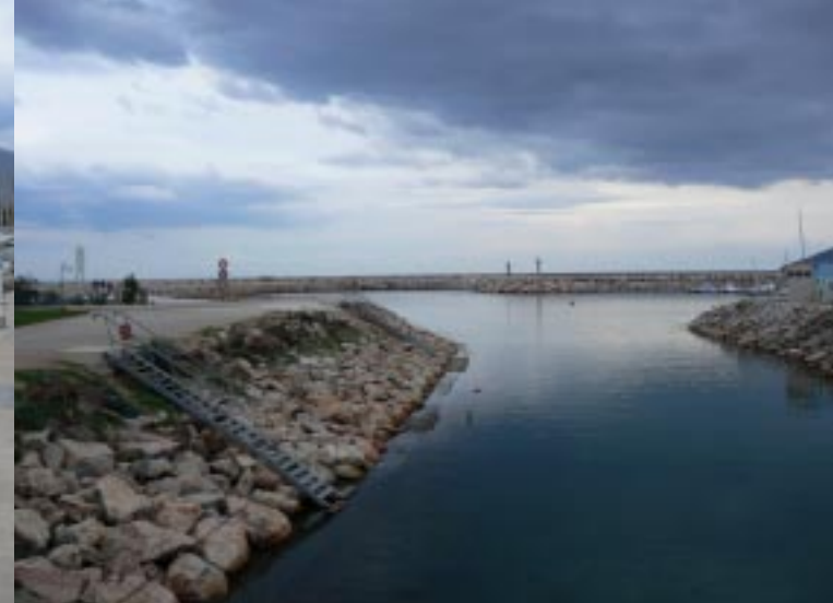
Haven van Argelès-Plage.

Tenslotte rijden we vandaag naar Argelès-Plage. Eerst kijken we in het noorden van Argelès op het strand. Weer geen schelpen. We staan even op een pleintje bij gesloten horecabedrijfjes. Op de parkeerplaats staan alleen maar twee sloopwagens. Daar hoef ik niet bij te staan. Maar later vinden we een schitterende plek voor de nacht aan de haven in het zuiden van de stad. Dat zoeken werd bemoeilijkt door opnieuw opgebroken straten. Onderhoud wordt hier uiteraard buiten het seizoen gedaan. Verder is vrijwel alles hermetisch tegen campers gebarricadeerd. Dikwijls zelfs met de gehate 2,2 m hoge balken.