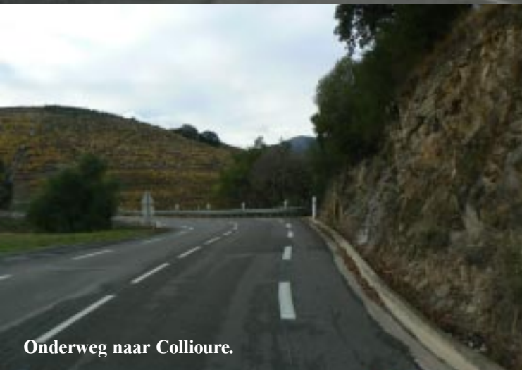
Onderweg naar Collioure.

30-11-2009. Argelès-Plage - Port-Vendres - Collioure. Voor we vertrekken kijken we nog even bij de visverkoop direct onder ons aan het water. De vissen zien er heerlijk uit, maar als je niet weet hoe die te fileren, dan heb je een probleem. Net na half tien rijden we weg van Argelès-plage. We rijden naar Collioure dat een kleine 10 km verder ligt. Voor dit dorp zien we fortificaties, die we even bekijken. We lopen omhoog naar Fort Carré. Rechts ligt Fort Miradou dat nog steeds in militaire handen is. Links een eindje terug Fort Rond. Fort Carré ziet er zeer degelijk uit, zeer compact.