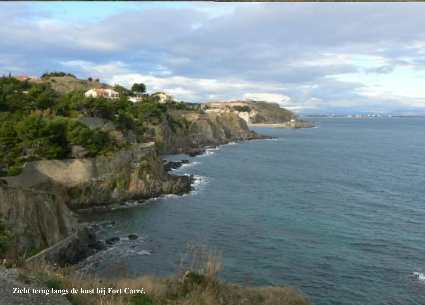
Zicht terug langs de kust bij Fort Carré.

We rijden door Collioure, dat een ronduit grandioos stadje blijkt te zijn, met vele vele prachtige en idyllische plekjes. Maar overal zien we borden dat campers niet mogen parkeren. Jammer maar niets aan te doen.