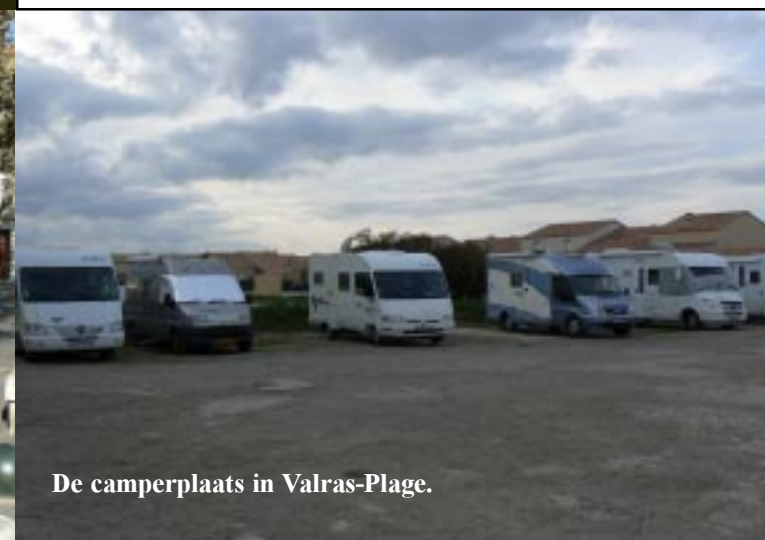
De camperplaats in Valras-Plage.