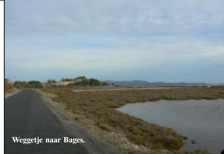
Weggetje naar Bages.

Om half drie zijn we een hooggelegen villawijk in Leucate ingereeden. Daar hebben we mooi zicht op de dijk naar Port-Barcarès. Op Leucate-Plage staan diverse campers vlak bij een woeste zee. Op het water zijn verschillende mensen met een surfplank en een peddel. Peddelsurfen? Daar hebben wij nog nooit van gehoord.