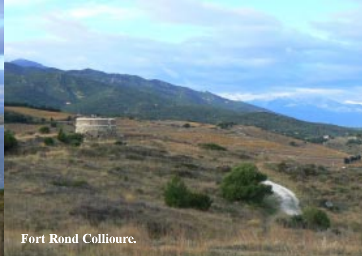
Fort Rond Collioure.