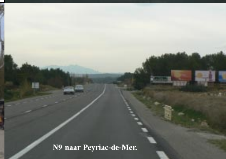
N9 naar Peyriac-de-Mer.