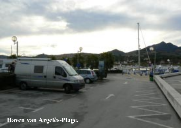
Haven van Argelès-Plage.