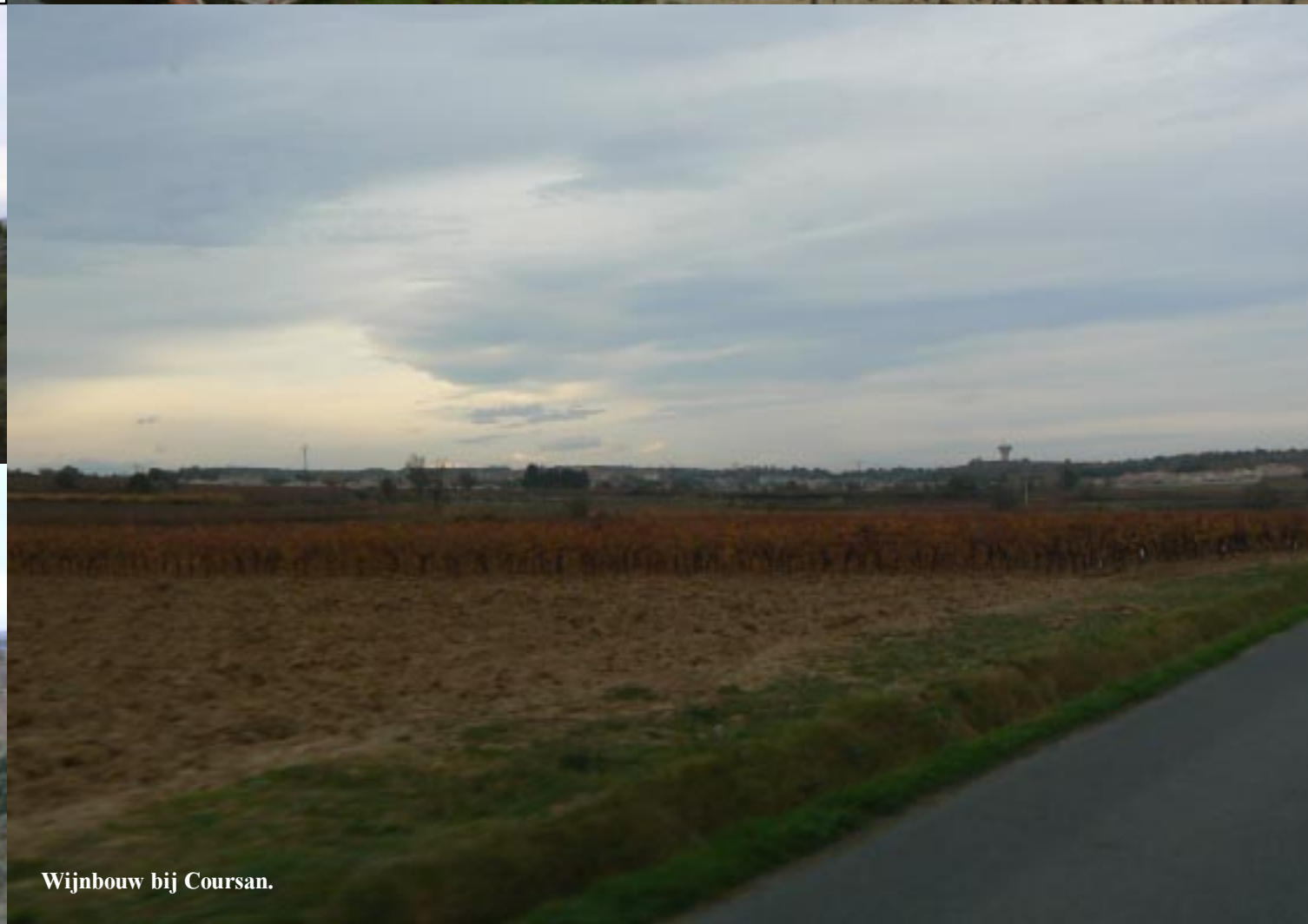
Wijnbouw bij Coursan.