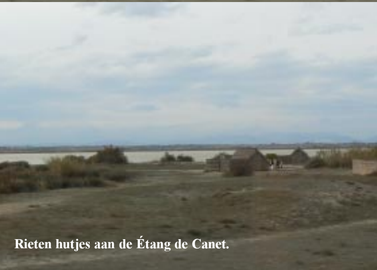
Rieten hutjes aan de Étang de Canet.