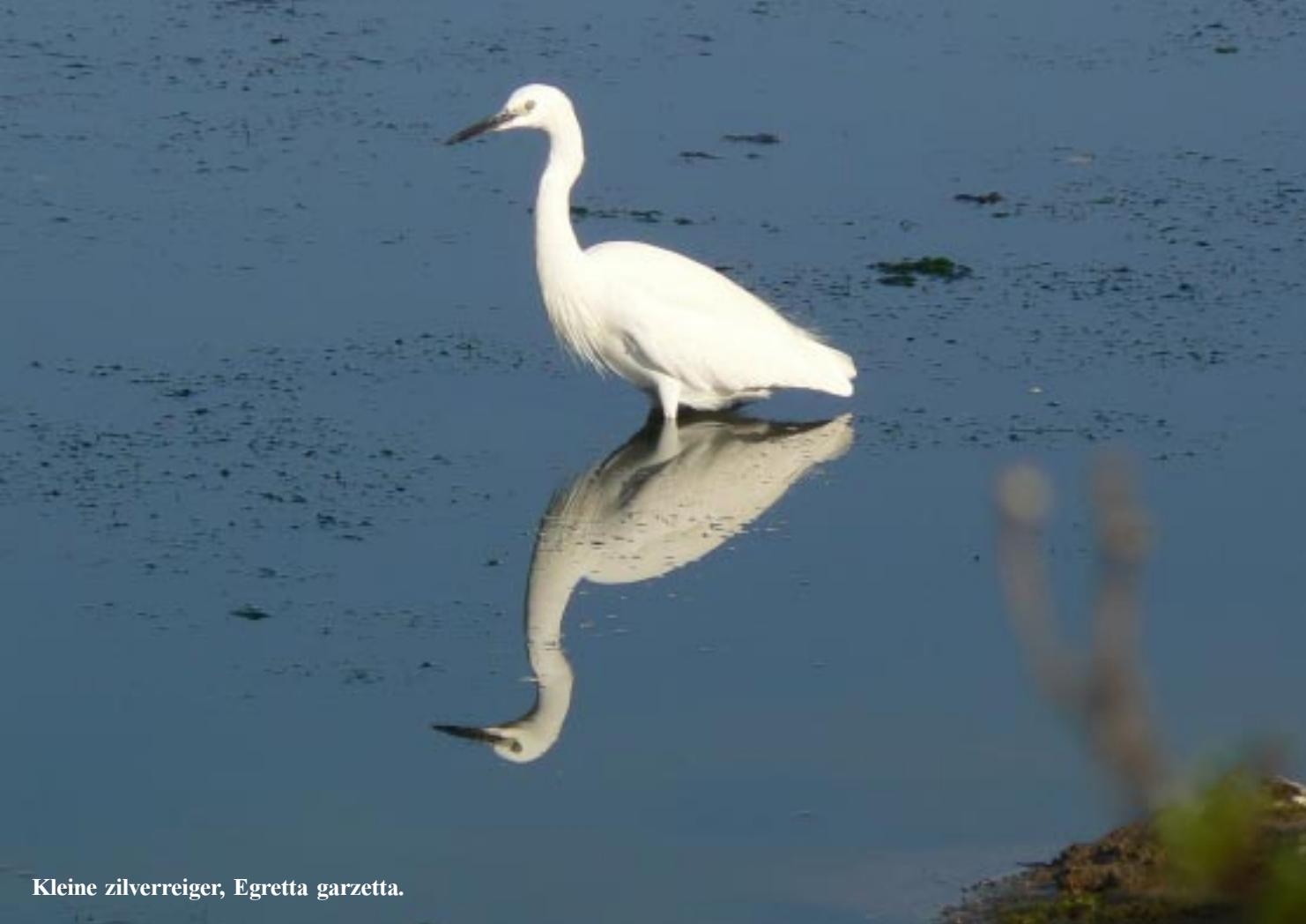
Kleine zilverreiger, Egretta garzetta .