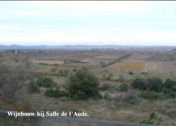
Wijnbouw bij Salle de l'Aude.