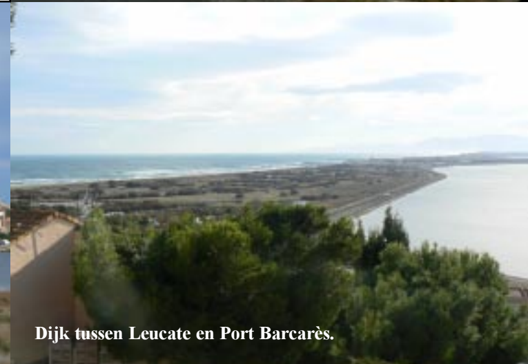
Dijk tussen Leucate en Port Barcarès.