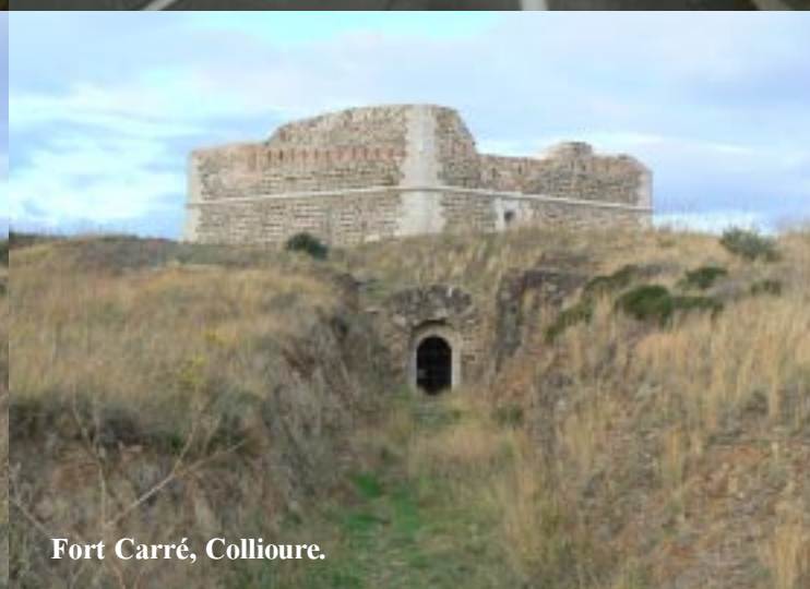
Fort Carré, Collioure.