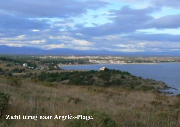
Zicht terug naar Argelès-Plage.