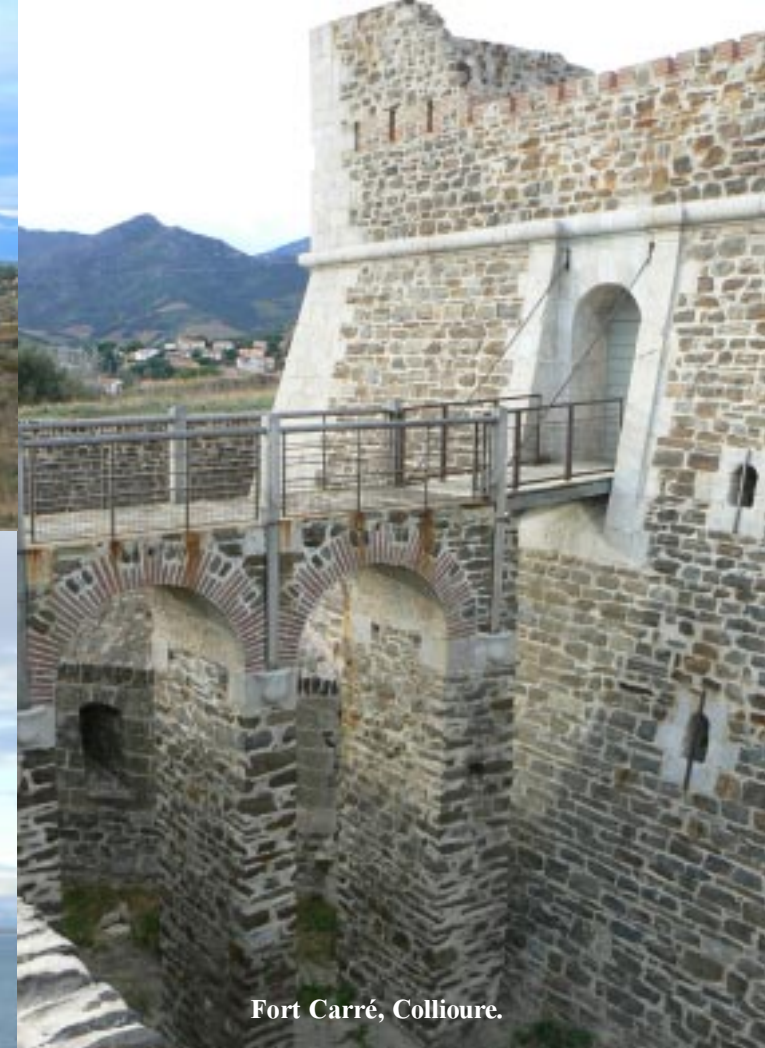
Fort Carré, Collioure.