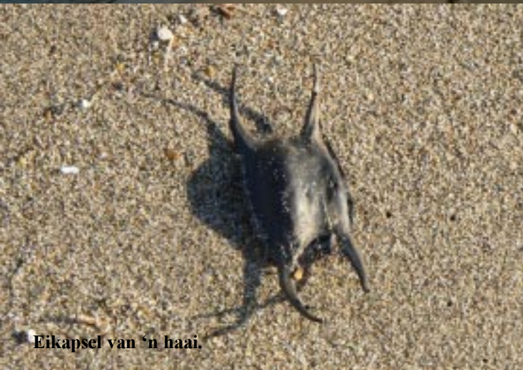
Eikapsel van 'n haai.