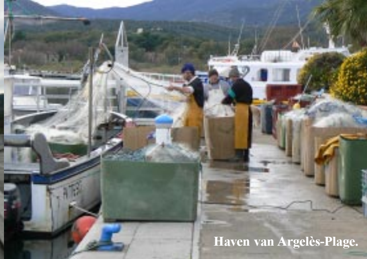
Haven van Argelès-Plage.

30-11-2009. Argelès-Plage - Port-Vendres - Collioure. Voor we vertrekken kijken we nog even bij de visverkoop direct onder ons aan het water. De vissen zien er heerlijk uit, maar als je niet weet hoe die te fileren, dan heb je een probleem. Net na half tien rijden we weg van Argelès-plage. We rijden naar Collioure dat een kleine 10 km verder ligt. Voor dit dorp zien we fortificaties, die we even bekijken. We lopen omhoog naar Fort Carré. Rechts ligt Fort Miradou dat nog steeds in militaire handen is. Links een eindje terug Fort Rond. Fort Carré ziet er zeer degelijk uit, zeer compact.