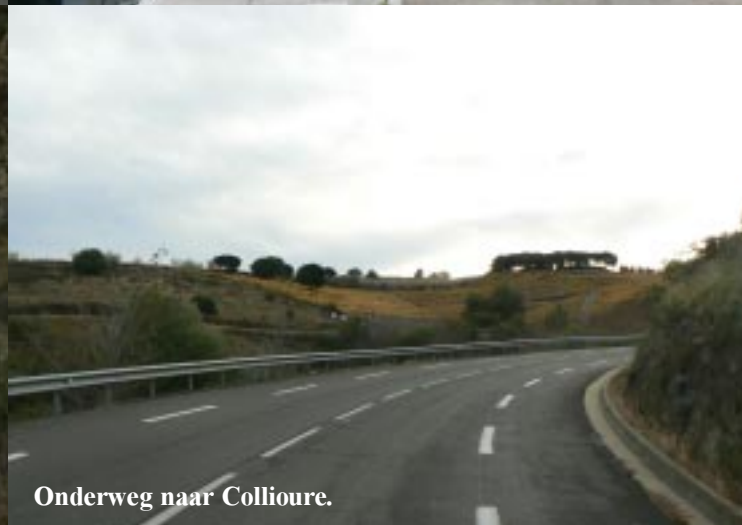
Onderweg naar Collioure.