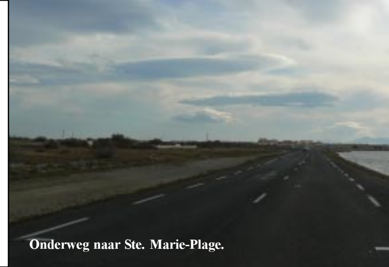
Onderweg naar Ste. Marie-Plage.

Ook in Ste. Marie-Plage komen we niet met de camper tot stand. We vinden verderop in het grotere Canet-Plage, wel een parkeerplekje. Zo kunnen we daar op ons gemak over de boulevard lopen. Er staan enkele kermisattracties en er loopt aardig wat volk rond. We kijken tevergeefs naar schelpen op dit strand. Alles is weggeveegd. Als we Canet weer uitrijden zien we aan de rechterkant enkele rieten hutjes staan.