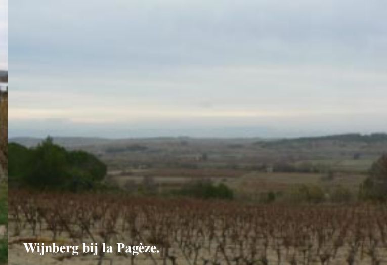
Wijnberg bij la Pagèze.