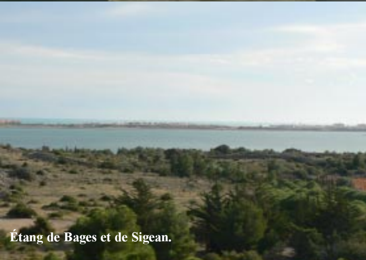
Étang de Bages et de Sigean.