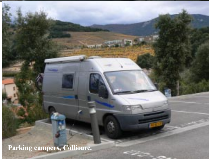
Parking campers, Collioure.