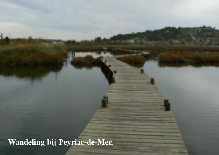
Wandeling bij Peyriac-de-Mer.

Opnieuw een heerlijke wandeling door een gevarieerd landschap. 10.35 - 12.45.