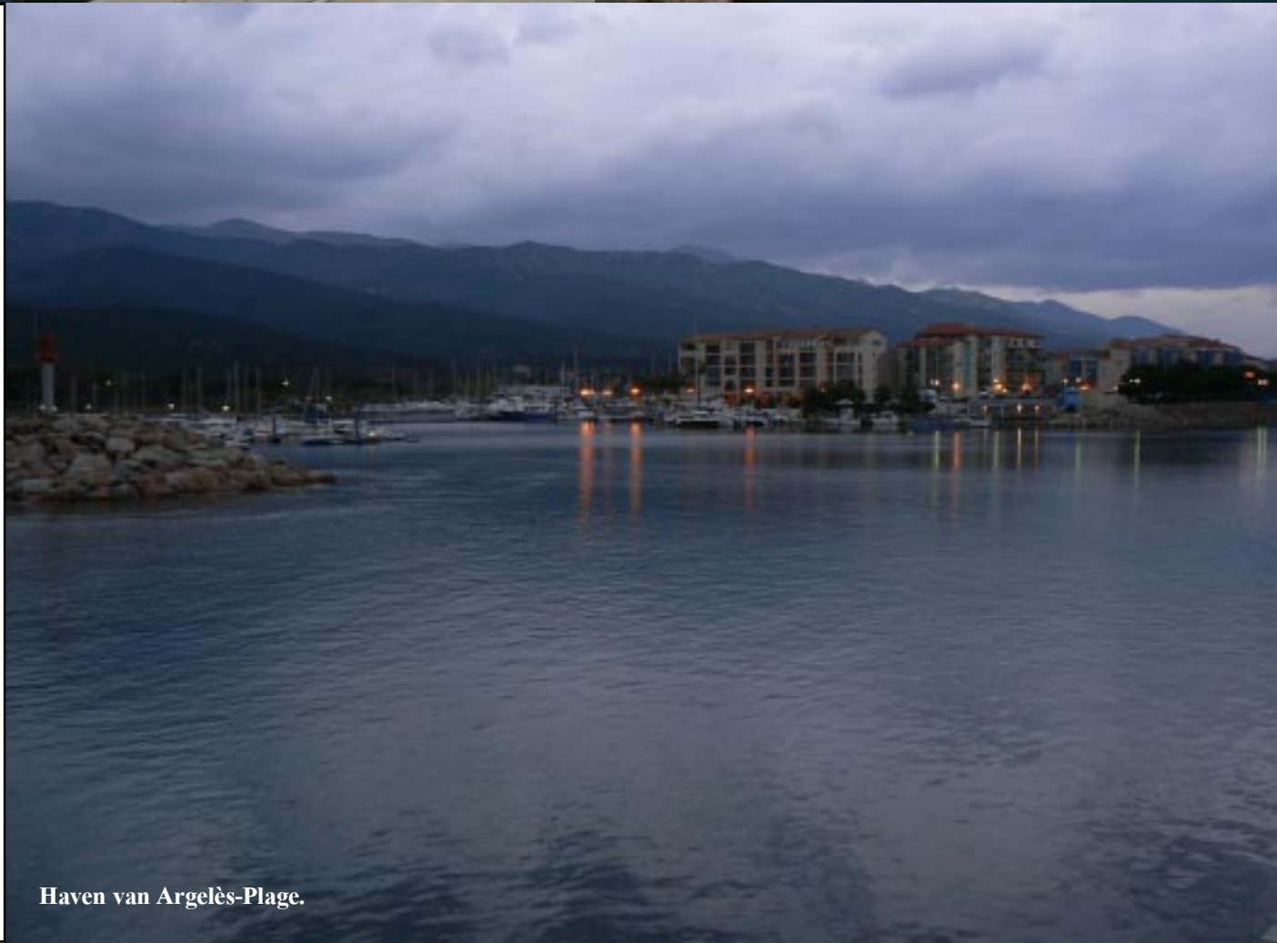
Haven van Argelès-Plage.

Maar goed nu hebben we een pracht plek. We verkennen de grote pier die de haven beschermd uiteraard. Steken daarvoor een brug over en lopen die pier op.