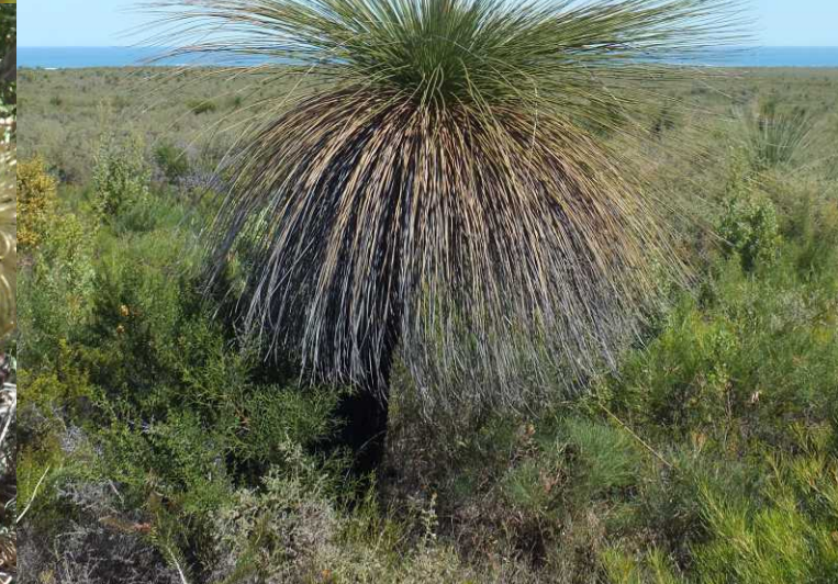
LB, MB: Willie wagtail, Rhipidura leucophrys leucophrys . RB: Nilgren NR. LM: Dwarf sheoak, Allocasuarina humilis . MM: Een soort pea flower, Faboideae . RO: Grasstree (Balga), Xanthorrhoea preissii . MO: Fox Banksia, Banksia sphaerocarpa .