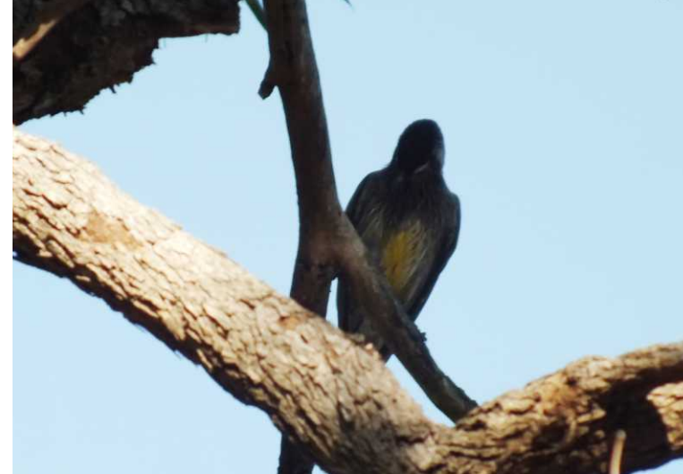
LB, RB: Red wattlebird, Anthochaera woodwardi. O: Tuarts Reserve, Cervantes.

Om 16:10 staan we daar op een heel mooi plekje. In de grote "Chewy"-boom daar (een eucalyptus met een grove bast) maakt een Red wattlebird junglegeluiden. Tot de schemering zitten we nog buiten. Een stel uit oost Australië komt even wat kleppen, ook zij zijn voor het eerst in West Australia. Met het laatste beetje sap in de laptop zet ik de foto's van deze dag over op de laptop en verkleind op de stick voor het Reismee-weblog.