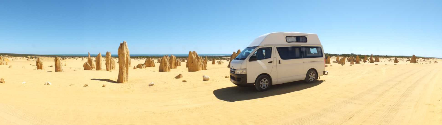
Deze pagina: Pinnacles.