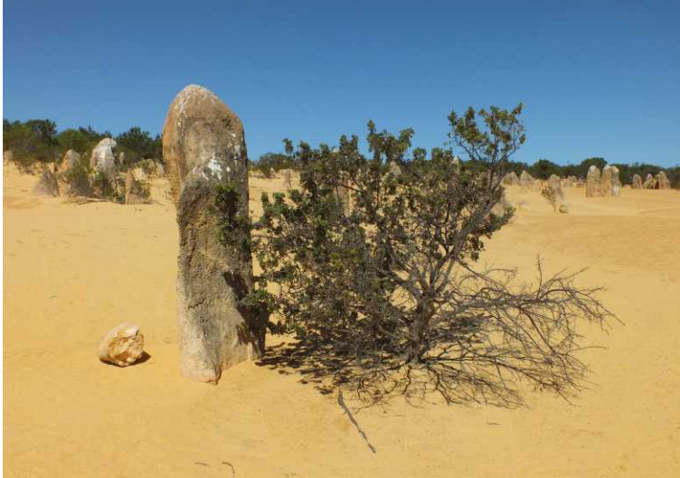
Deze pagina: Pinnacles, Nambung NP.