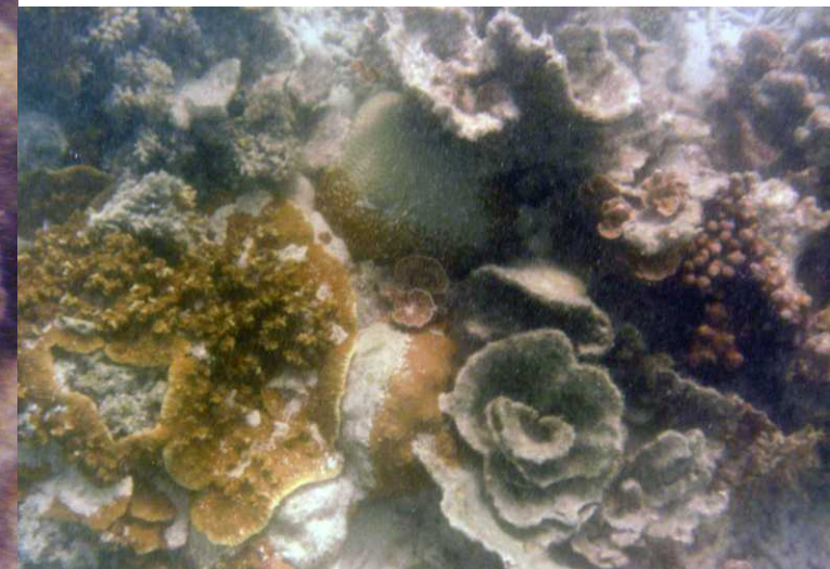
RO: Centraal: Fungia fungites.

In de snorkelstand (<8m diepte) wordt het roodverlies achteraf gezien overgecompenseerd. Dat wordt dus Photoshopen vanavond. Hoe dan ook we zien prachtige koralen in alleli vormen en soorten.