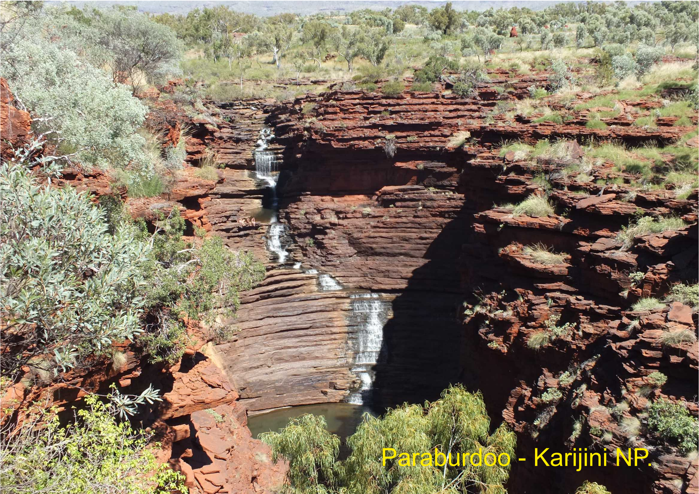
Paraburdoo - Karijini NP.