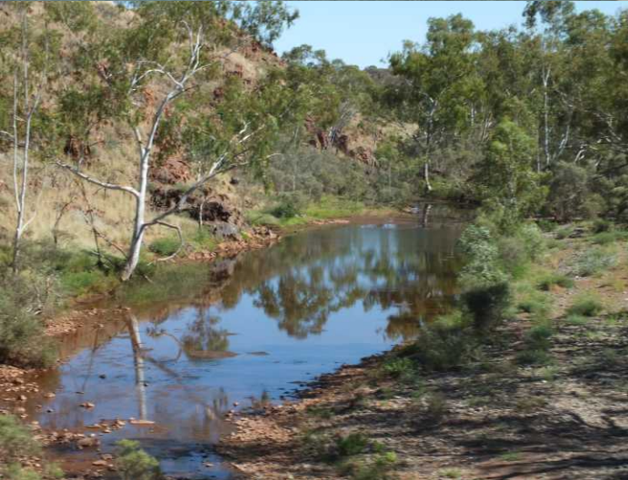
LO: Bellary Creek.

Na weer eens getankt te hebben vertrekken we om 9:53. Deze streek is duidelijk wat natter en dus zijn er hogere en meer bomen. We zien b.v. om 10:29 de Bellary Creek.