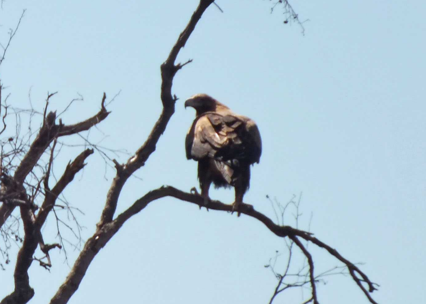
LB, RM: Wedgetailed eagle, Aquila audax audax.

In een boom niet ver van de weg zien we een grote roofvogel zitten. Het blijkt een Wedge-tailed eagle te zien. Mooi om zo'n beest van zo dicht bij te kunnen bekijken.