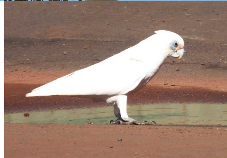
LB: Het park bij Rocklea Palms AC. RB, M, O: Little corella, Cacatua sanguinea westralensis .

14-04-2017. Paraburdoo – Karjini NP. Om 9 uur leveren we bij de receptie van het Rocklea Palms Accomodation Centre de sleutel van het sanitairgebouw in. Dan zetten we verhaal en foto's uit de 5e serie op Reismee. Om ons heen in het perken om de gebouwen van de gastverblijven wemelt het van de corella's.