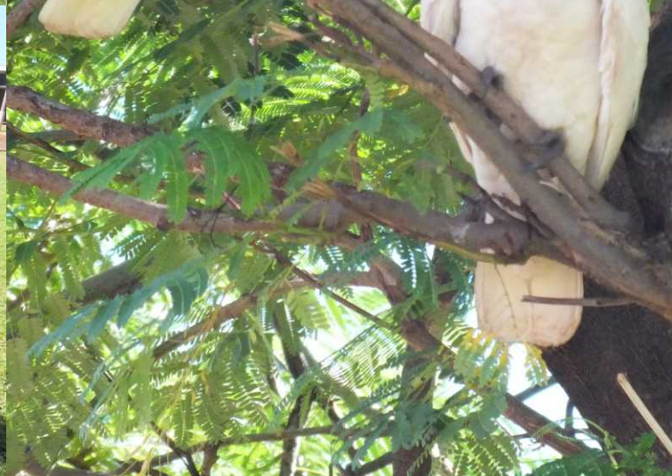
LB, RB: Yellow-throated miner, Manorina flavigula wayensis . MB: Whistling kite, Haliastur sphenurus . LM: Little crow, Corvus bennetti . MM: Magpie-lark, Grallina cyanoleuca . RO: Little corella, Cacatua sanguinea westralensis . MO: Contact met Reismee.