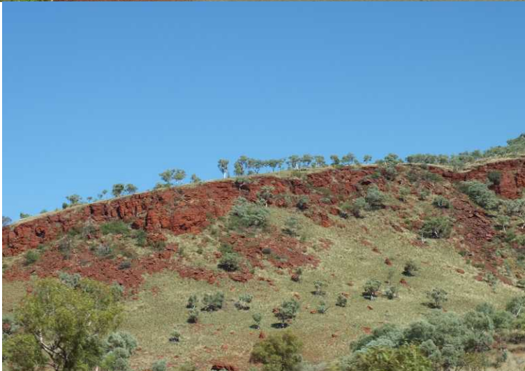
LB: Knox Gorge. RB: De centrale verharde weg door het Karijini NP.

Om 13:15 gaan we terug naar de camper en komen om 14:00 op de verharde weg terug.