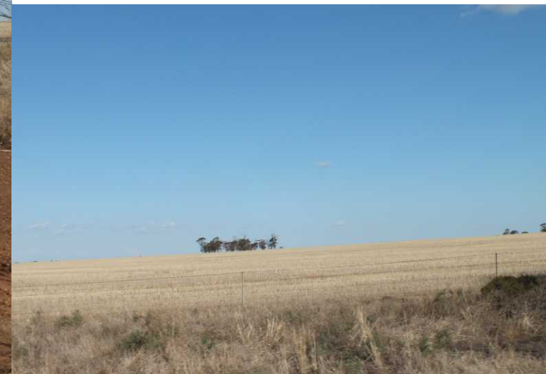
LB, RM: Uitgestrekte tarwevelden. O: Wubin.

Verderop kijken we over een enorm weidse vlakte uit (15:23). 5 km voor Wubin zijn we de outback uit. Hier liggen uitgetrekte graanvelden (16:00). In Wubin is het eerste tankstation öut of order". De BP is wel open, we tanken er 51 l benzine.