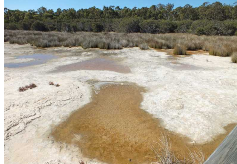
LO, RO: Thrombolites in Lake Clifton.

Bij Lake Clifton in het Yalgorup NP kijken we even naar de broertjes van de stromatolites van Hamelin Pool: Thrombolites. Deze thrombolites zijn qua opbouw anders en vormen een soort ronde keien.