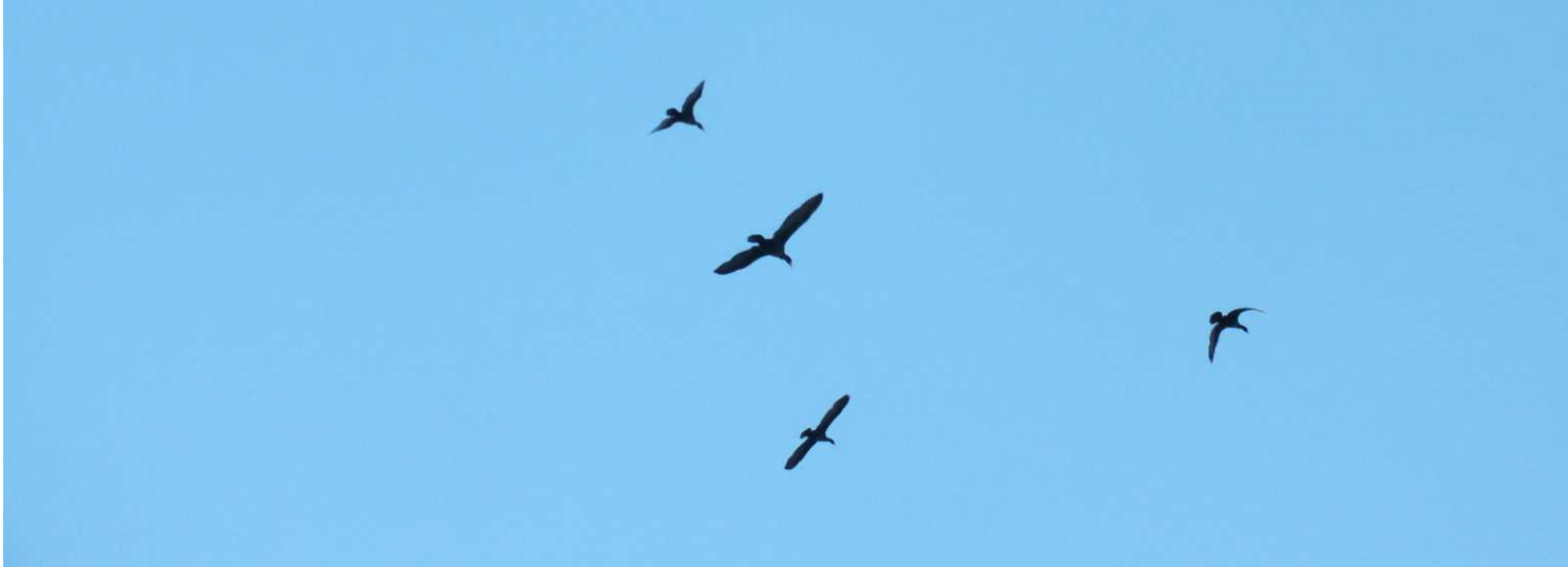
LO, RO: Little black cormorant, Phalacrocorax sulcirostris .