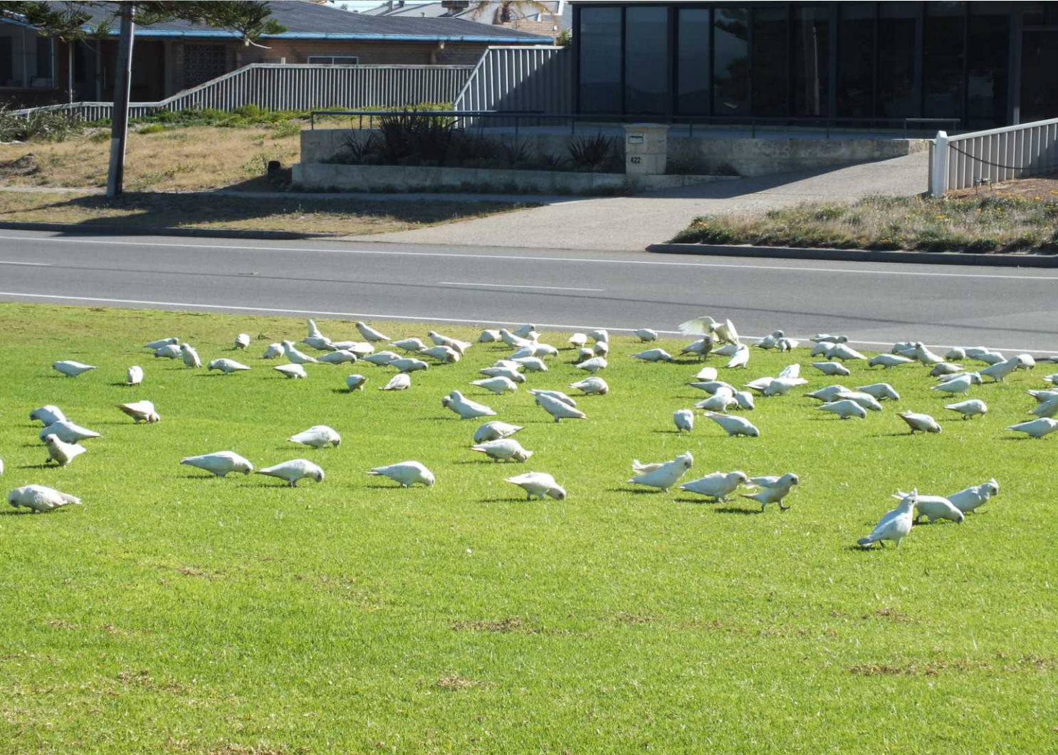
RB,LO: Little corella, Cacatua sanguinea sanguinea .

We rijden via de 22 naar de Safety Bay in Rockingham, 9:25. Daar maken we een korte wandeling langs het strand. We zien er massa's corella's op het gras.