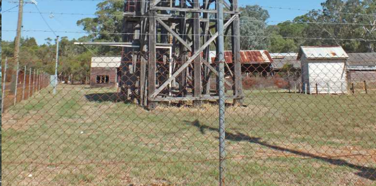
B: Bunbury. LM: Afslag naar Tuart Drive.